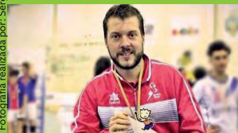
HISPANITAS PETRER RECIBE A SAN LORENZO CON URGENCIAS