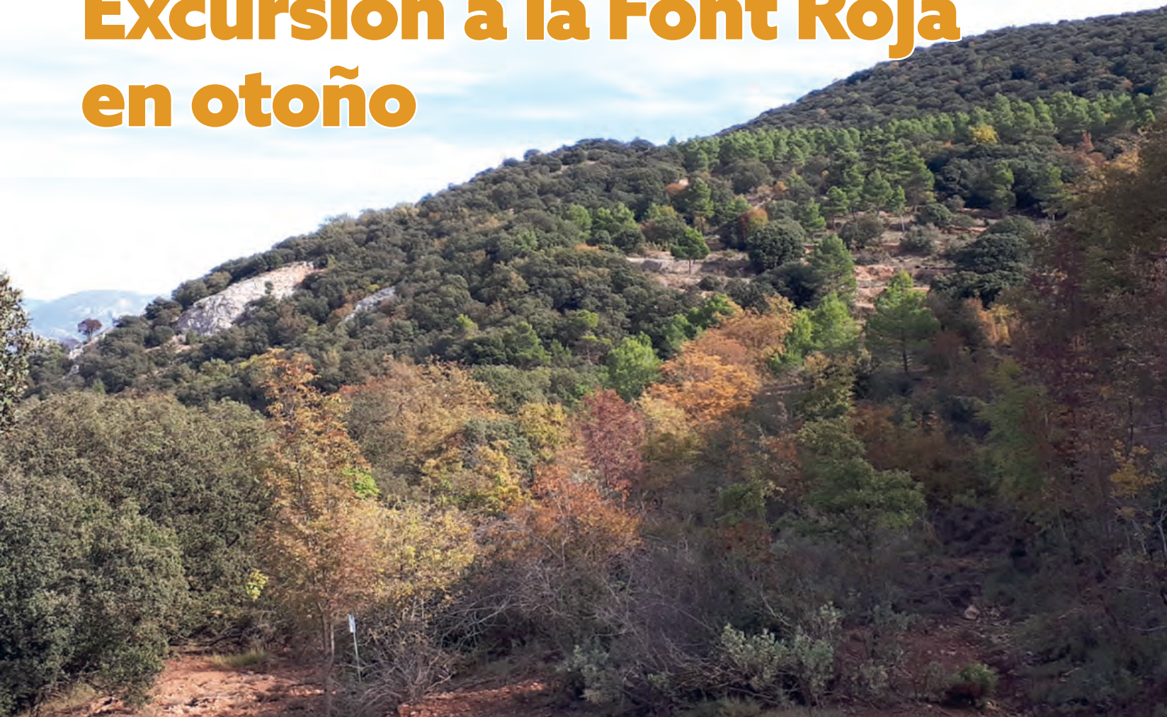
Fresnos de flor en la umbria de Tetuán

Distancia 15,2 Km. Desnivel positivo 940 mts Dificultad media