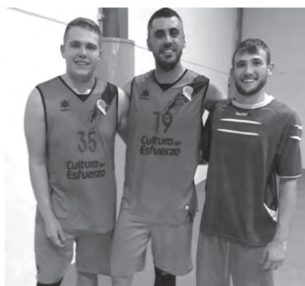
Jugadores del senior

El conjunto sénior venció 45-60 en Ibi. En el primer tiempo los locales llegaron a marcar una diferencia de 10 puntos que se quedó en 3 al finalizar el primer tiempo (29-26). En la segunda parte Petrer concedió sólo 16 puntos y terminaron ganando el choque. El sábado, a las 19h, recibe en San Jerónimo al Basket Agost. Victoria agrídulce del júnior contra Crevibasket por 60-57 ya que el partido estuvo marcado por una trifulca que se saldó con un total de 6 personas expulsadas, de entre ellos dos del CB Petrer. Al descanso Petrer ganaba de 11 tantos pero hubo reacción crevillentina en el segundo acto que les llevó a comandar el marcador. Sin embargo, un parcial de 6-0 para los locales les llevó a ganar el match. El sábado, a las 16:30h, juegan en Sax.