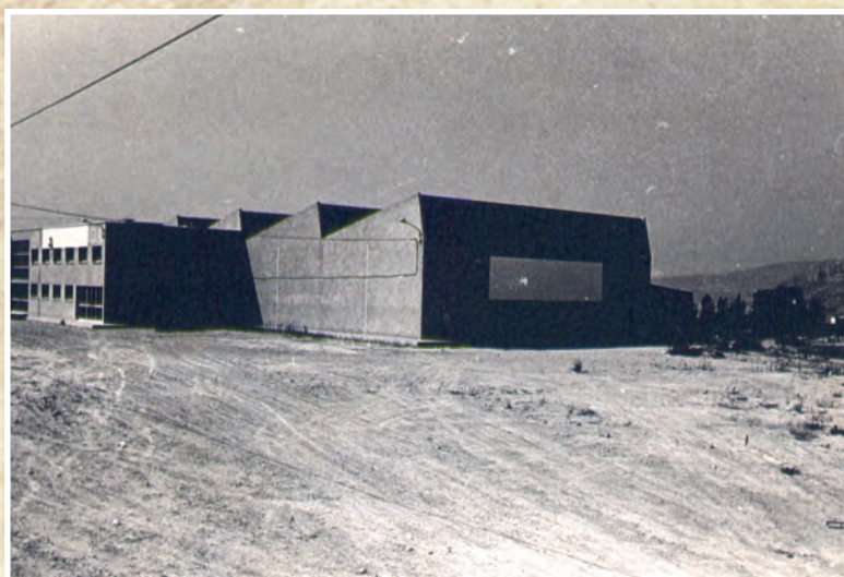
Any 1987 Calzados Saen va ser la primera nau que es va construir en el polígon Salinetas