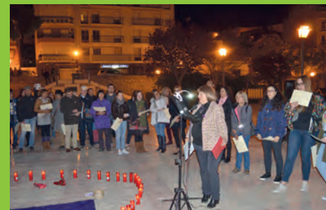
25N "CONTRA LA VIOLENCIA MACHISTA"