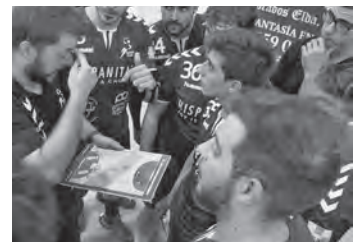
El técnico local aleccionando a sus pupilos

Una jornada más se repitió la historia. Hispanitas Petrer perdió su séptimo encuentro de la temporada, esta vez tocó en casa contra Levante Marni por 25-28. Tras unos primeros compases igualados, Petrer tomó la delantera 8-5 mediada la