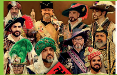
LA "FESTA DELS CAPITANS" Y "LA RENDICIÓ", A ESCENA