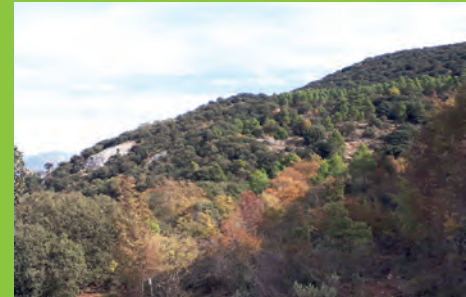
A UN PAS DE PETRER: FONT ROJA EN OTOÑO