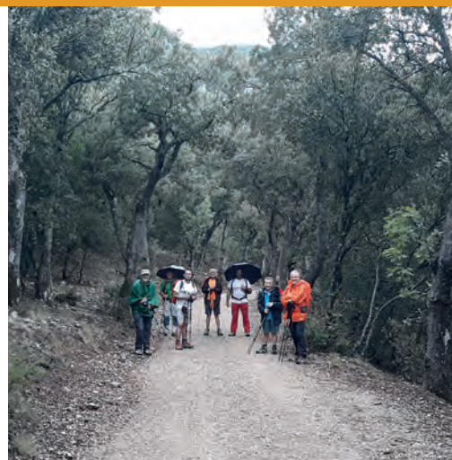
Camí del Pla dels Gal·les

dera. Esta es una bajada muy especial pues estamos en el mejor conservado y extenso "trozo" de lo que se conoce como bosque mediterráneo y que en nuestras sierras más cercanas ya es casi inexistente.