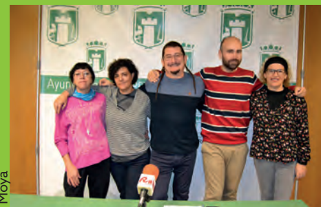
SERGI CREMADES NO SERÁ EL CANDIDATO DE PODEM PETRER