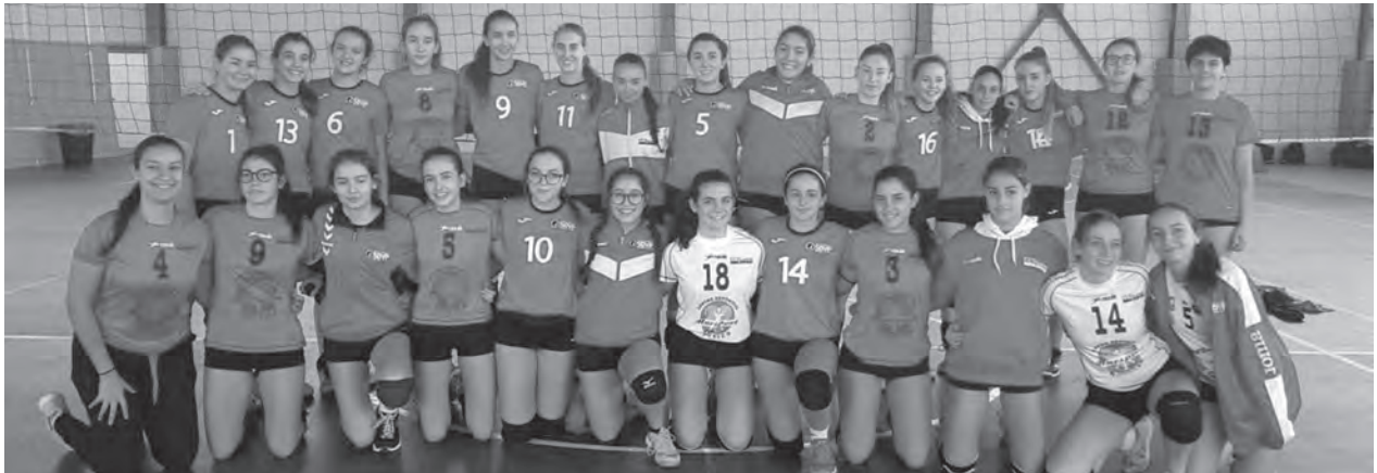
Féminas de SDVP

dió 3-1 (12-25/25-23/25-23/28-26) en Valencia un partido que comenzó muy bien ganando el primer set. Sin embargo, llegó la reacción local con tres parciales consecutivos con marcadores muy ajustados. Este domingo, a las 12h, recibe a Benidorm en el pabellón; El juvenil femenino ganó 0-3 (5-25/13-25/19-25) para seguir al frente de la tabla. El sábado, a las 17h, visitan al Almodar; El cadete masculino perdió 3-2 (17-25/21-25/25-