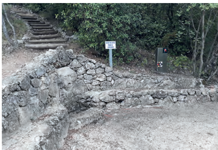
Font del Rossinyol

Desde el aparcamiento, bajamos por escalones y carretera hasta la Font del Rossinyol . De aquí parte un umbrío sendero dirección noreste que nos ira llevando de vuelta por un área de bosque mixto. A este tramo se le llama El Barranc del Infern . Después de un kilómetro encontramos, a la derecha,