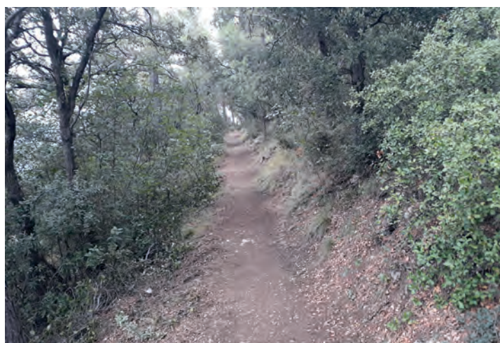
Senda del Barranc de l'Infern