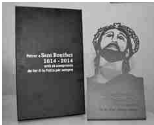
Rèplica en xicotet del monument de Sant Bonifaci Màrtir