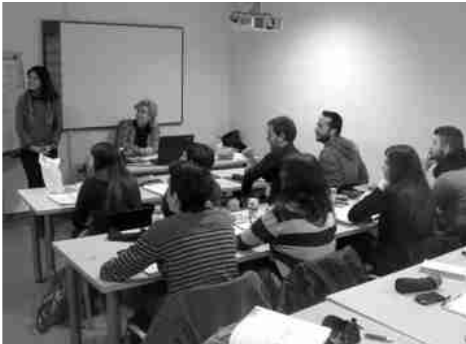
Imagen de archivo. Curso de Formación impartido en la ADESP

Asimismo, ha comentado que con esta iniciativa lo que se pretende es facilitar el acceso al mundo laboral a un grupo de vecinos de nuestra localidad con un taller teórico-práctico que, a la vez, redundará en beneficio del municipio puesto que está enfocado al mantenimiento urbano con trabajos de albañilería, pintura vial, señalización y limpieza.