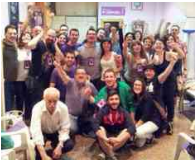
Miembros de Podem celebrando el resultado electoral el pasado domingo

poco variarán en exceso a los provisionales que aparecen en la página del Ministerio del Interior. Según esos mismos datos, de los 27.105 electores, acudieron a las urnas 13.047 personas, un 48,17% y por tanto, un 51,83% de abstención, un 5,30% de votos nulos y un 3,08% de votos en blanco. Respecto a la participación registrada a las ocho de la tarde, hora del cierre de mesas, fue muy similar a la que hubo en la convocatoria de 2009 en la que se registró un 48%. Todos los representantes políticos de nuestra población coincidían en que seguía siendo un porcentaje muy bajo y que era necesario hacer pedagogía de Europa dado que muchos de los asuntos legislativos y económicos que nos afectan dependen del Parlamento Europeo. De los siete colegios electorales habilitados en Petrer,