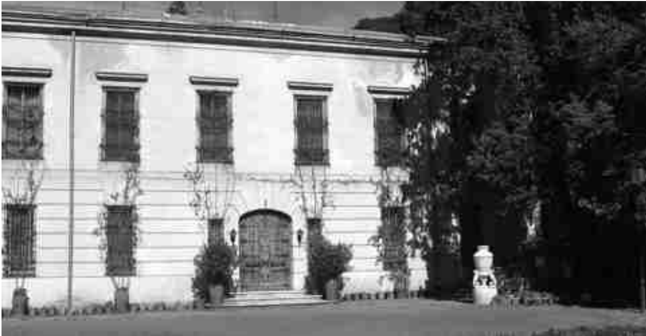
Finca del Poblet