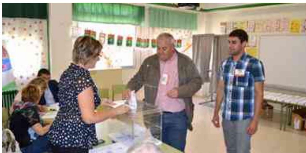
Votaciones en Petrer de los representantes políticos de los partidos mayoritarios

en tres bajó la participación respecto a las Europeas de 2009, concretamente en el Colegio "La Foia" donde se registró un -4,84%, en "Rambla dels Molins" con un -0,53% y "Virrey Poveda" con un -1,48%.