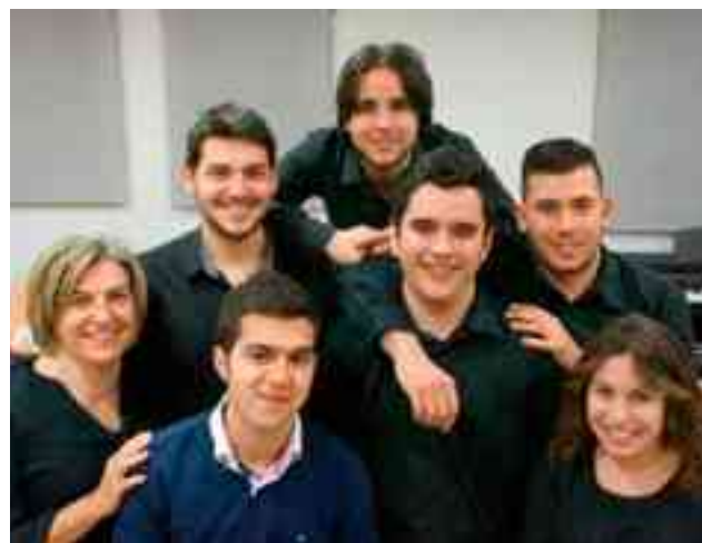
Alumnado seleccionado para la obtención de las seis becas

y Juanjo), tendrán la oportunidad de realizar durante el verano diversos cursos organizados por toda la geografía española. Estos alumnos, durante los meses de marzo y abril, tuvieron la oportunidad de presentarse en público en varios conciertos en los que mostraron una gran madurez interpretativa, beneficiándose de la experiencia formativa que ello supone de cara a su futuro profesional. Además de la oportunidad de tomar contacto con un escenario, estos alumnos, que cada año son seleccionados mediante audición pública en el Conservatorio, reciben el incentivo de una beca destinada a la realización de cursos de especialización musical. ● M.R.