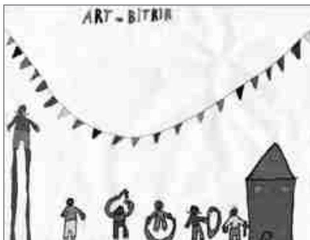
Dibuix de Raquel Juan