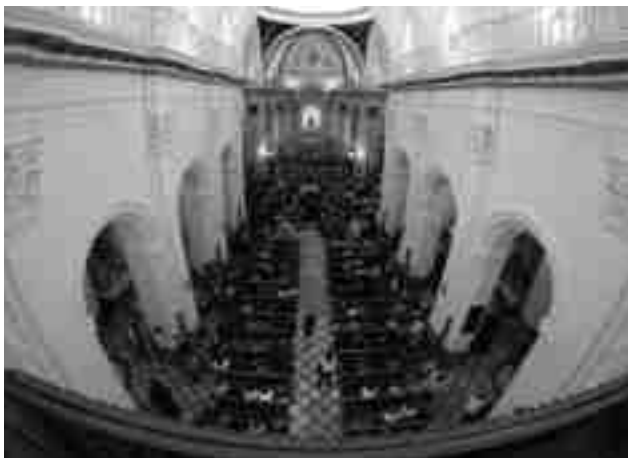
En la Misa Mayor se llevó a cabo la segunda colecta de la "Acción Social"

Petrer y la Fiesta han mostrado una vez más su lado más generoso y solidario