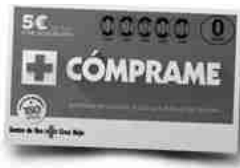
Este año el lema del cupón es "Cómprame"