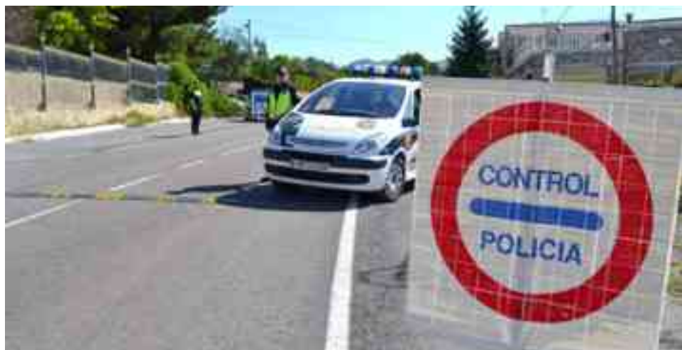
Imagen de archivo de la Policía Local

La propuesta contempla la posibilidad de solicitar la jubilación anticipada adaptándose así a las condiciones de otros cuerpos de seguridad