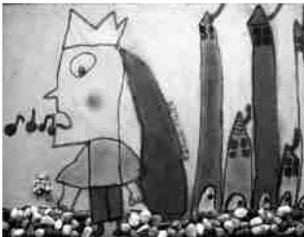
Dibuix de Valeria del Rey