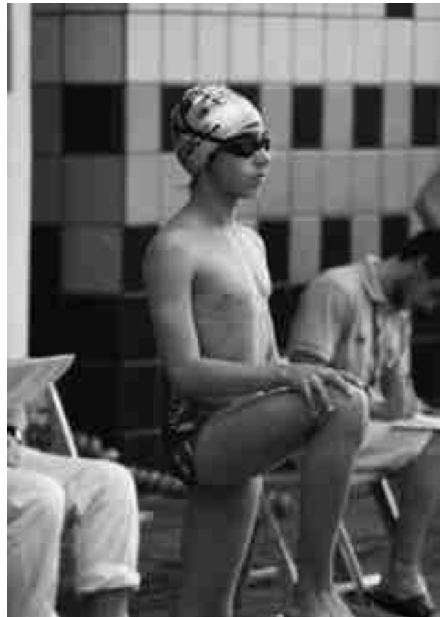
Nadador del CN Petrer-la Villa ●