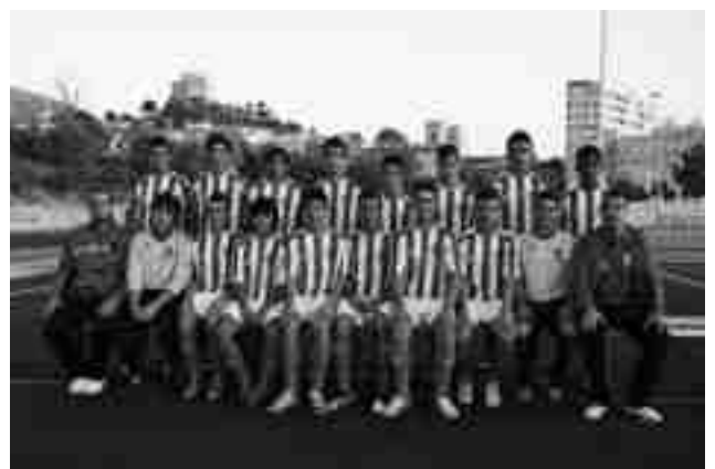
U.D. Petrelense cadete 1ª regional

El conjunto rojiblanco ha logrado la permanencia en 1ª regional al quedar en décima posición