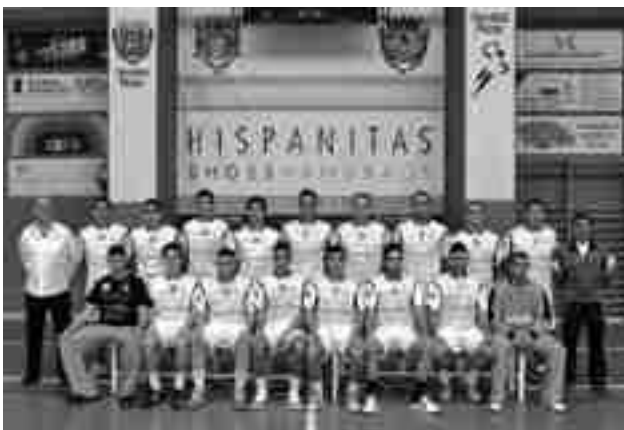
Hispanitas Petrer B

El resto de los equipos de la base del Hispanitas Petrer concluyeron su andadura en la Fase Ranking. El cadete masculino lo hizo per-