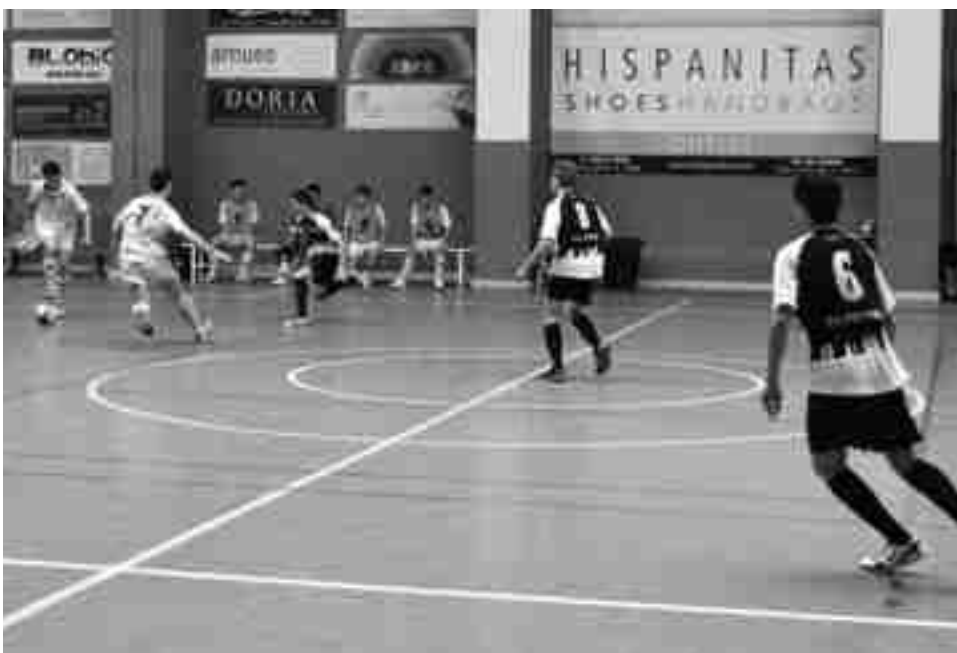
FS Petrer juvenil