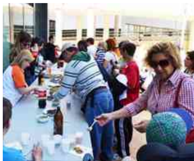
Durante el almuerzo comiendo gachamiga

lo que tiene para obtener recursos propios. Añade que en este primer año de funcionamiento se ha atendido a 11 personas externas en el Servicio de Fisioterapia y Rehabilitación