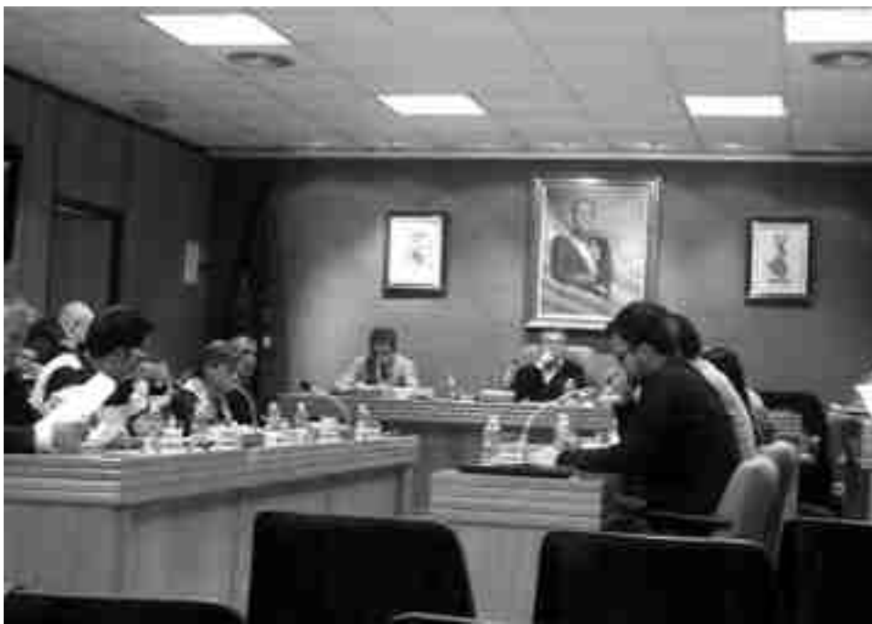
Imagen de archivo. Sesión plenaria en el Ayuntamiento de Petrer, hace unos meses

rra Unida, esta reforma del Código Penal es puramente ideológica e incluso con tintes xenófobos.