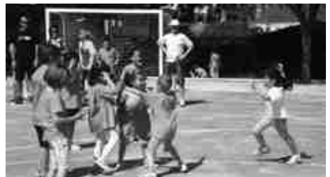
Alumnos de Rambla dels Molins en las XII horas

La participación en las diferentes modalidades deportivas es casi del cien por cien