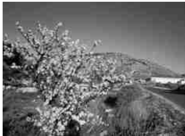
Los almendros estaban a en flor cuando bajaron las temperaturas

porte, por lo que se espera que en tres semanas pueda empezar a prestar servicio. Sobre la nueva ambulancia, ha explicado que es un poco más grande que el antiguo vehículo sanitario y, además, está dotada de desfibrilador y toma de constantes vitales. En definitiva, ha matizado es muy completa por lo que se prestará un servicio de calidad. En cuanto al coste, ha comentado que, finalmente, asciende a 62.000 euros puesto que se ha aprovechado mucho material de la antigua ambulancia ya que, en principio, era de unos 70.000 euros. ●