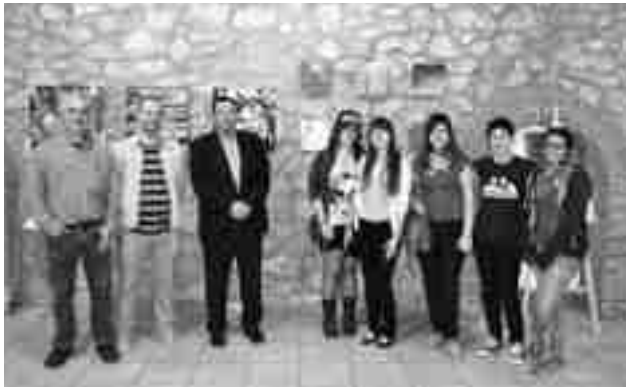
Exposición de alumnos del IES "Paco Mollá" en el "Forn Cultural"