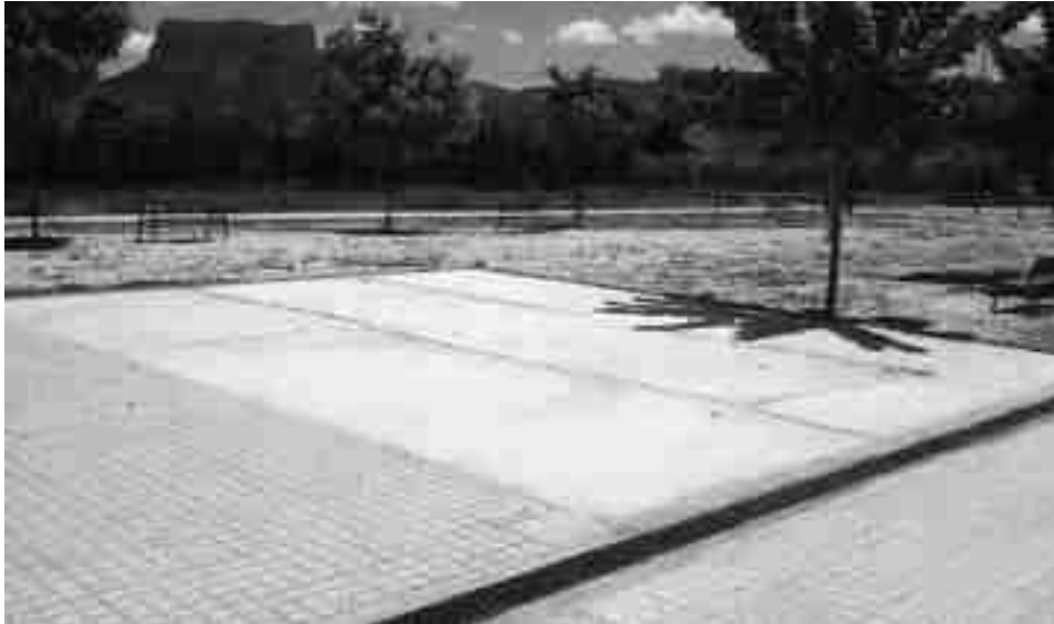
Plaza de la calle El Portal, ya se ha acondicionado el suelo de hormigón y en breve se instalarán los juegos

Por otra parte, la concejala de Servicios Generales tiene previsto renovar la iluminaria pública de la ave-