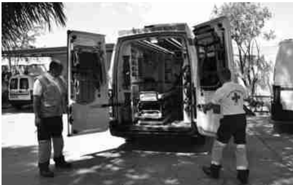
Técnicos de Cruz Roja Petrer junto a la nueva ambulancia

No prestará servicio hasta principios del mes de junio