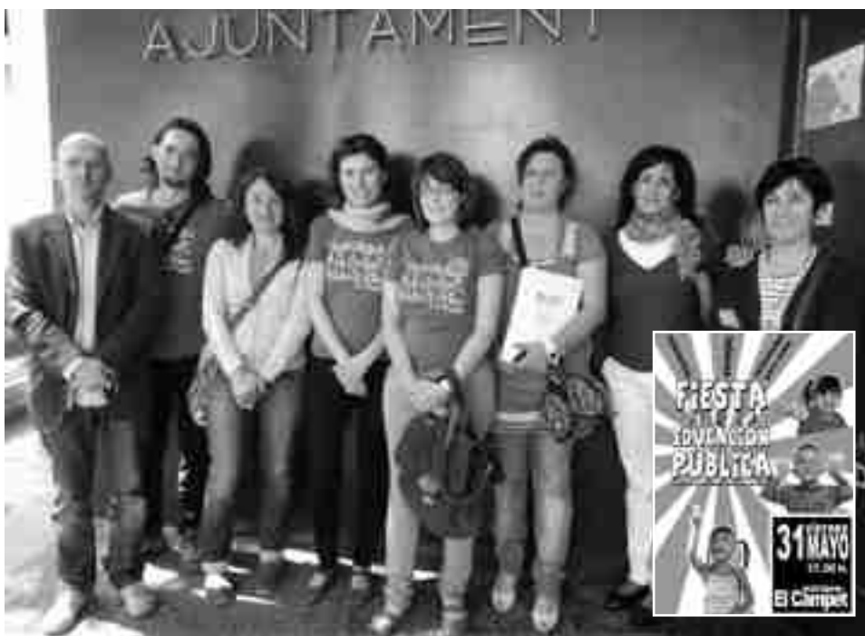
Profesores y padres de "Reina Sofía" y otros colegios a las puertas del Ayuntamiento tras la reunión