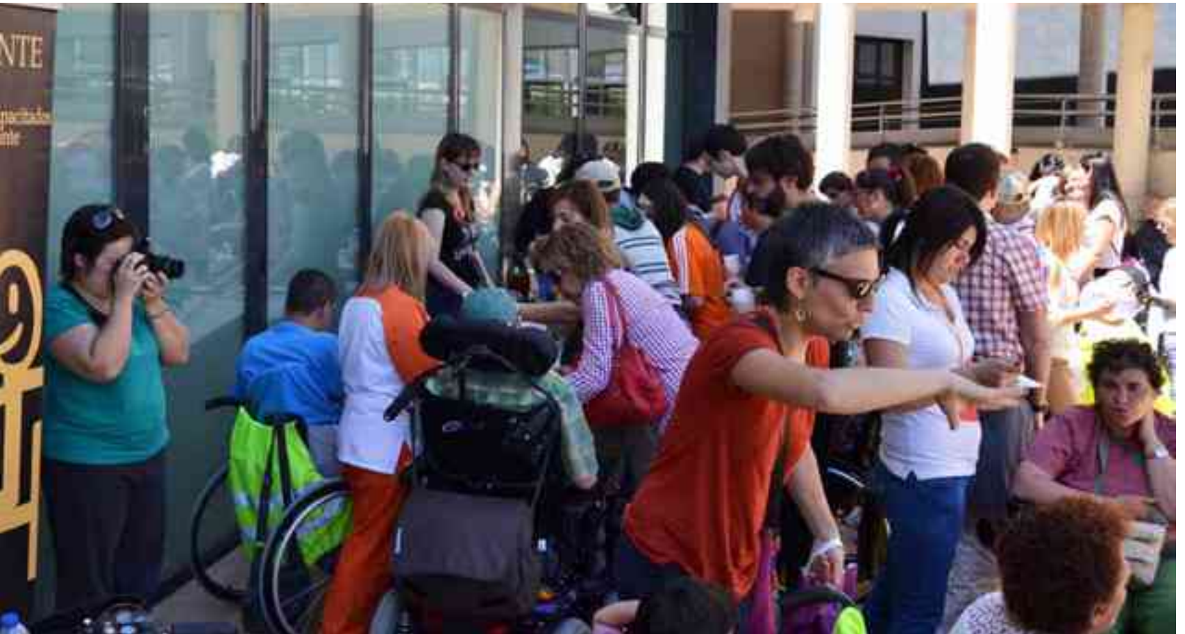
Imagen de la convivencia del sábado

y se ha prestado servicio a cinco centros escolares de la zona con su Cocina Central "SERAL-COCEMFE", realizando más de 320 comidas diarias, además de las de los residentes. Pero también, el CAI cuenta con un colectivo de 20 voluntarios a los que Mataix ha agradecido su labor desinteresada que semanalmente realizan tareas de acompañamiento, apoyo a los profesionales, etc. Su labor resulta fundamental en las salidas del centro, especialmente en el caso de personas que carecen de apoyo sociofamiliar y que por sus discapacidades tienen dificultad para transitar solos fuera del CAI.