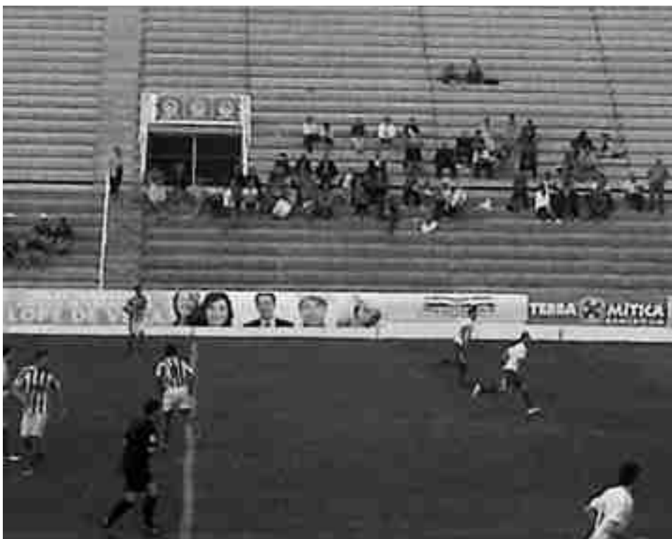
Al fondo, aficionados del Petrelense en Benidorm

El primer tiempo fue bastante malo, de tanteo. No