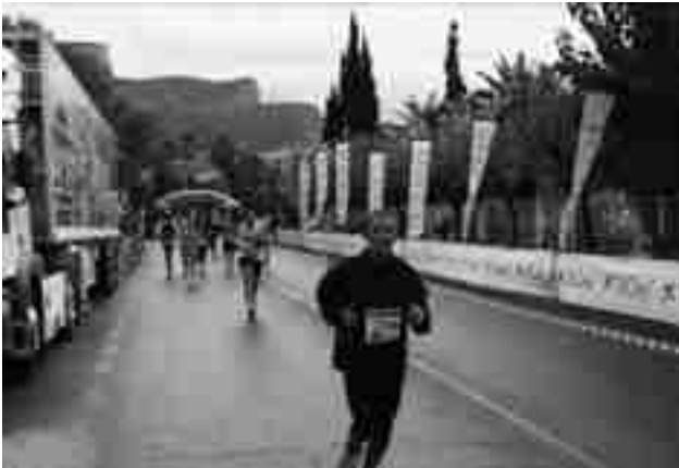
Corredores en la edición de 2012

La organización aprovechará que se dan tres vueltas a