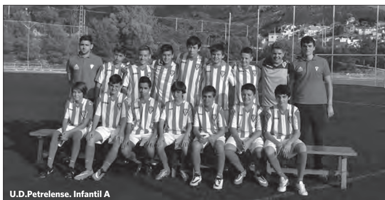
U.D.Petrelense. Infantil A