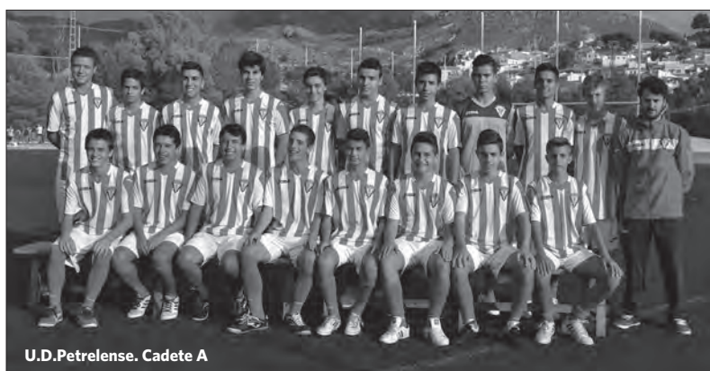
U.D.Petrelense. Cadete A