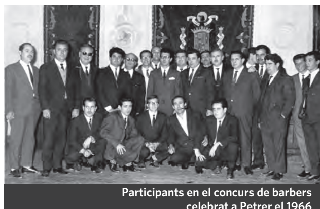
Participants en el concurs de barbers celebrat a Petrer el 1966