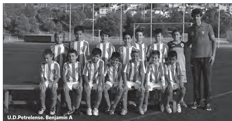
U.D.Petrelense. Benjamín A