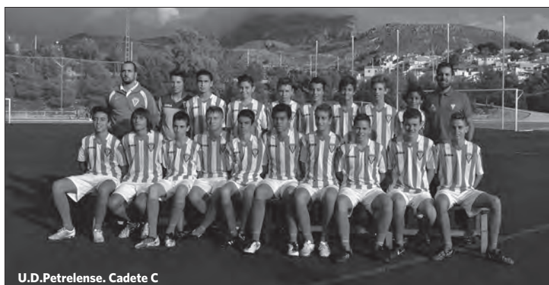
U.D.Petrelense. Cadete C