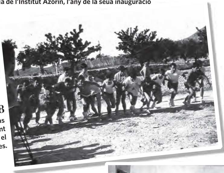
Any 1968 Competicions esportives enfront de la Bassa el Duro, en Salinetes.