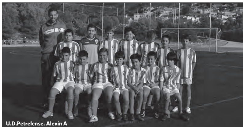
U.D.Petrelense. Alevín A