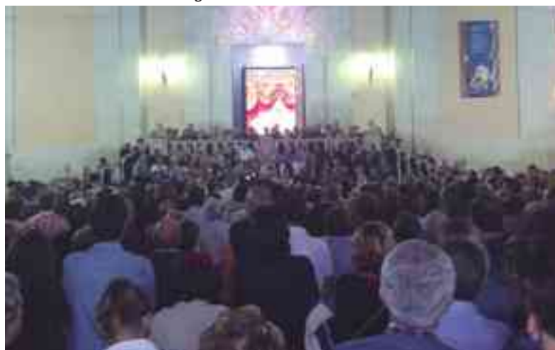
Canto de la Salve Marinera