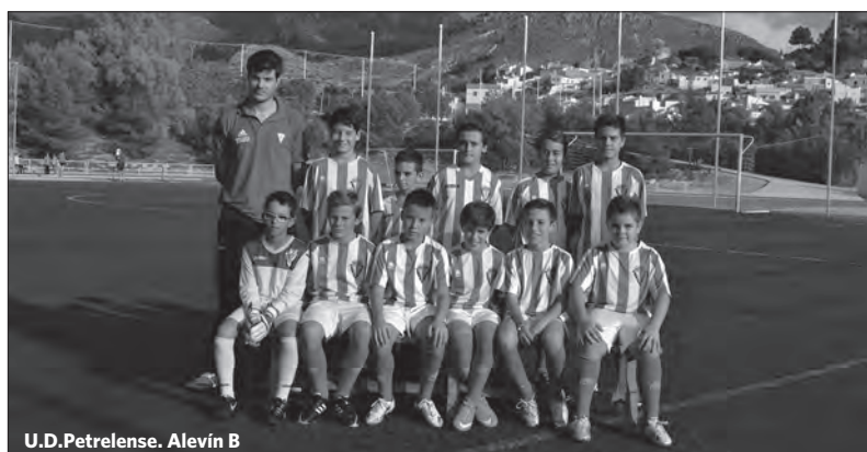
U.D.Petrelense. Alevín B