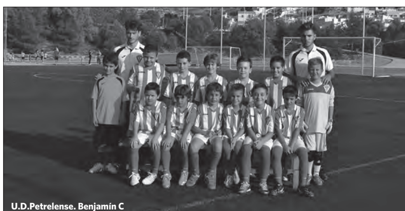
U.D.Petrelense. Benjamín C