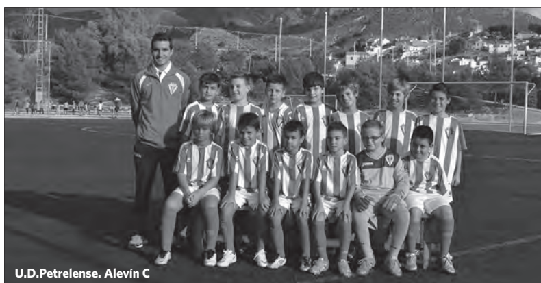
U.D.Petrelense. Alevín C