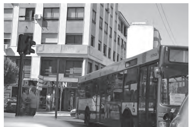
Autobús interurbano circulando en el barrio La Frontera

Por último, el concejal de Tráfico y Gobernación ha recordado que cuando SUBUS asumió la prestación de este servicio de autobuses interurbano modificó el itinerario de esa línea con el fin de ofrecer una presta-