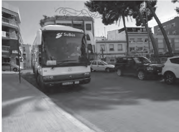
Autobús recogiendo a los estudiantes