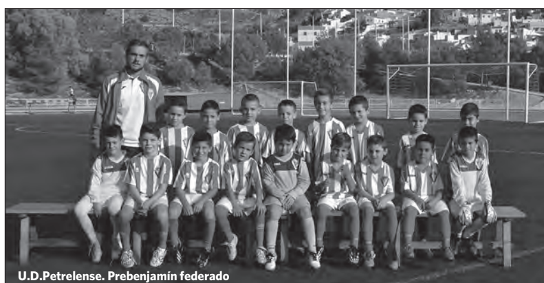
U.D.Petrelense. Prebenjamín federado