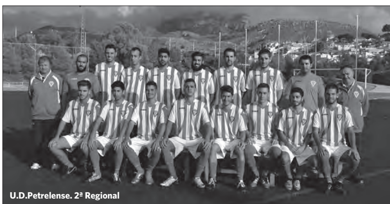
U.D.Petrelense. 2ª Regional