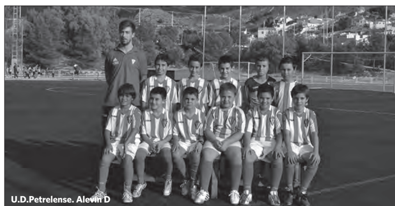
U.D.Petrelense. Alevín D