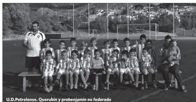
U.D.Petrelense. Querubín y prebenjamín no federado