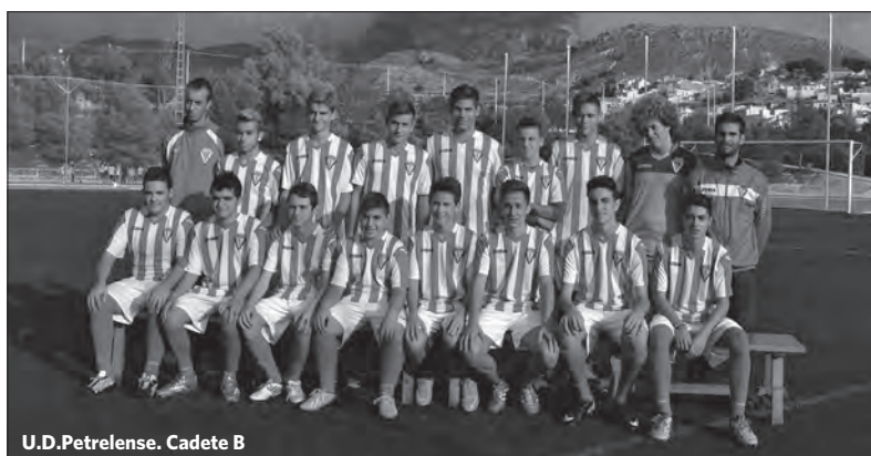
U.D.Petrelense. Cadete B