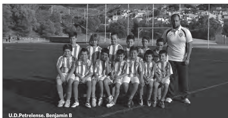
U.D.Petrelense. Benjamín B