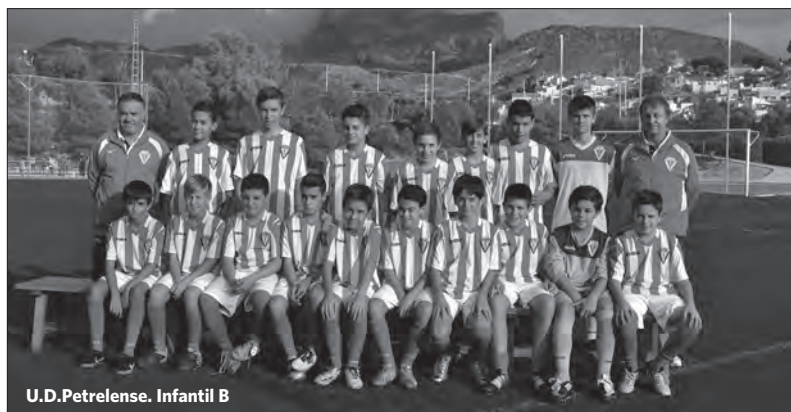
U.D.Petrelense. Infantil B