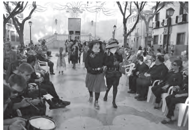
Imagen de archivo. "Carrases" en la Plaça de Baix

forma complementar un año repleto de momentos inolvidables. Agradecía el interés, colaboración y la brillante idea que tuvieron a la hora de solicitar a la Dirección de Correos el sello conmemorativo. Añadió que tanto la UF como la Mayordomía de San Bonifacio estaban muy orgullosos y contentas porque todas las iniciativas de colectivos y asociaciones se habían podido llevar a cabo gracias al buen hacer e implicación de todas ellas, incluida la Filatélica y Numismática. ● M.R.