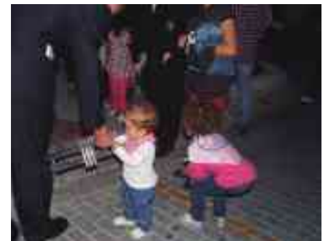
Ofrenda a la Virgen