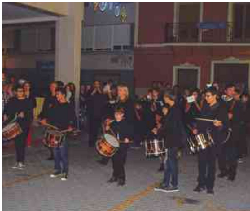
Pasacalles de "Nanos i Gegants" del pasado domingo

S i por algo se caracterizan las fiestas patronales en honor a la Virgen del Remedio es por la vida que cobran las calles. Se llenan de actividad, con pasacalles protagonizados sobre todo por los m1s peque1os acompa1ando a los "nanos i gegants" y las bandas de m1sica. Esto, unido a las actuaciones musicales, convivencias en los barrios y el fervor religioso hacia la Patrona, hacen que estas sean unas fiestas en las que casi todo transcurre en la calle, y m1s si el tiempo lo permite. ●