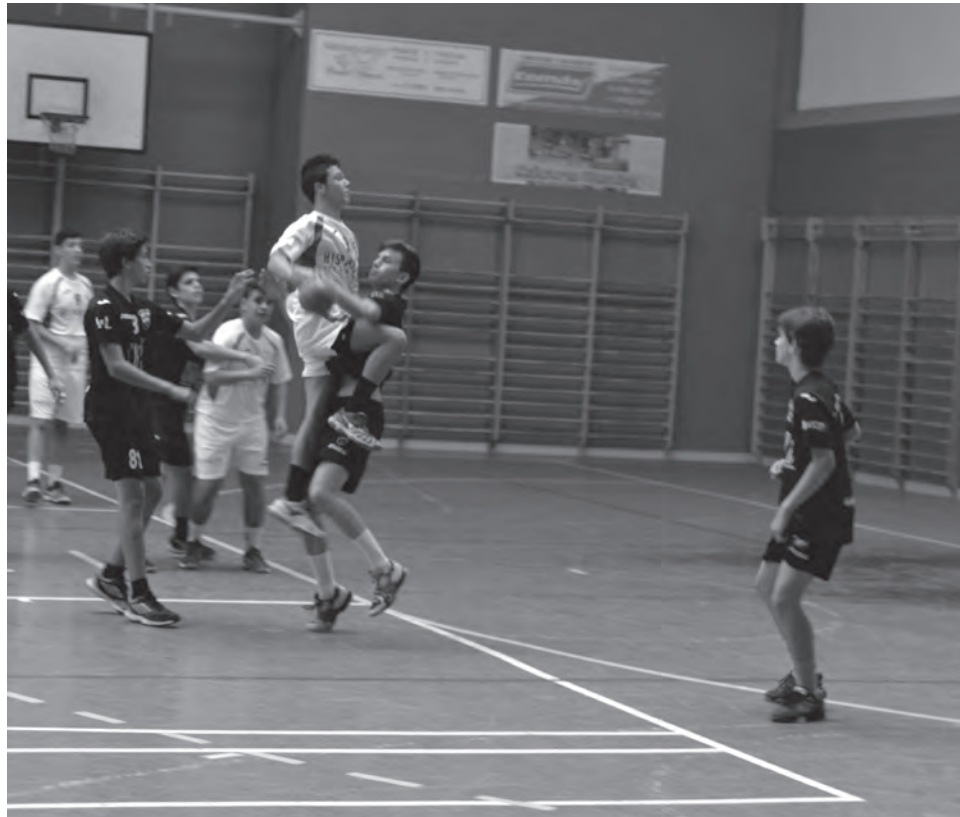
Partido Petrer-Elda en cadete masculino