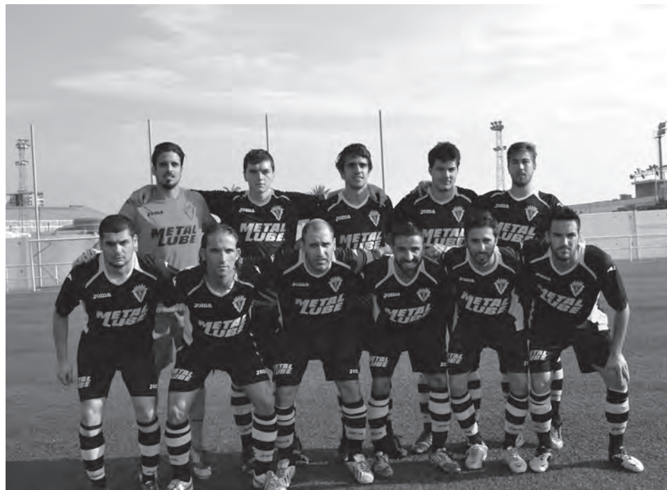
Formación de la U.D. Petrelense en Benidorm