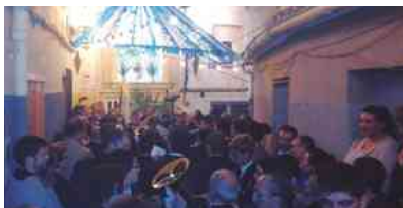
Pasodoble "Petrel" en calle La Virgen