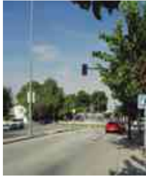
Imagen del semáforo