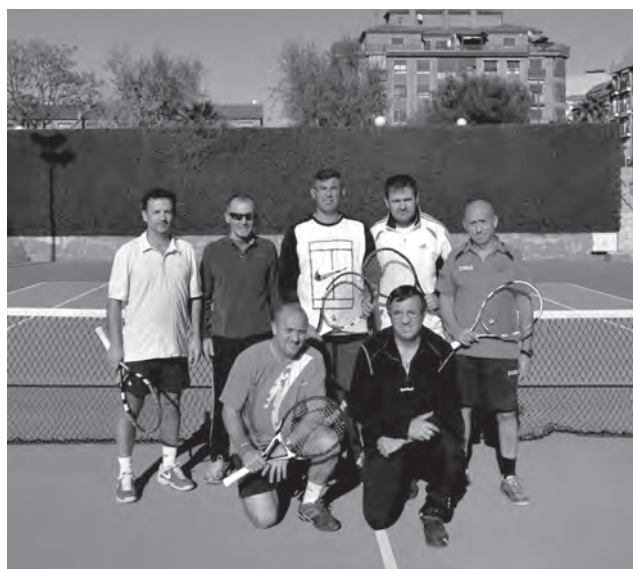
C.T. Petrer veteranos +45

Ahora, únicamente falta poner la guinda al pastel e