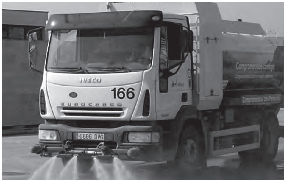
Los camiones de la empresa concesionaria baldearán diferentes zonas del casco urbano durante el desarrollo de este plan

Ha añadido que los trabajos se llevan a cabo por personal de la empresa responsable de limpieza viaria siguiendo un planning redactado al efecto, utilizando para el baldeo un camión cuba con mangueras de presión y un vehículo equipado para verter agua a una elevada presión.