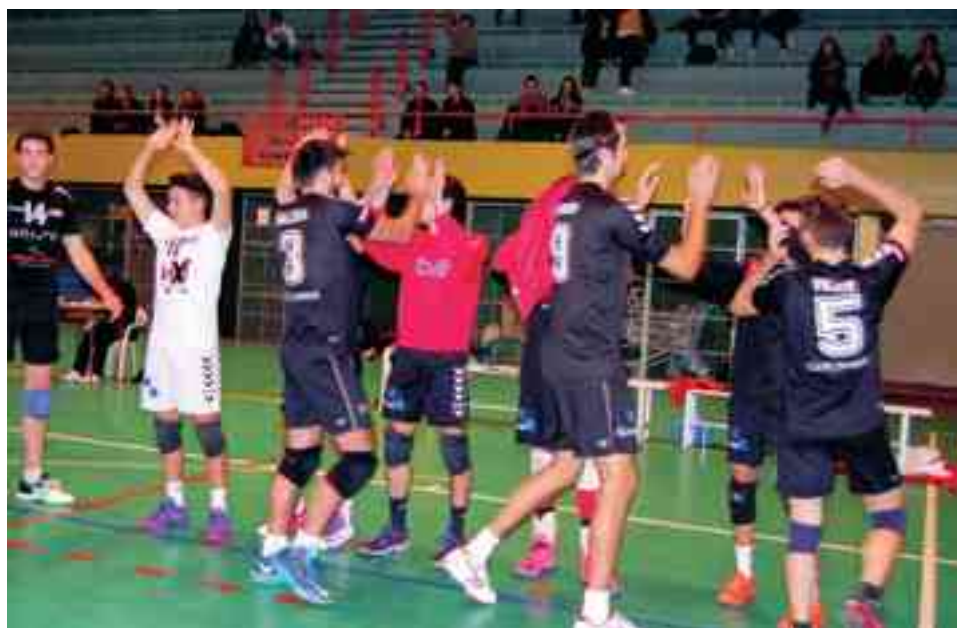
SDVP está imparable