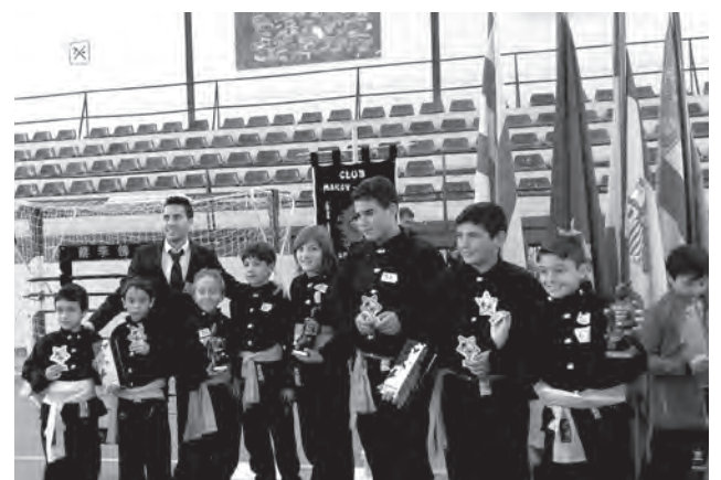
Participantes en el torneo

En el campeonato participaron competidores de toda la Comunidad Valenciana y además asistieron deportistas invitados de Albacete. En total, fueron unos 100 participantes de entre 4 y 14 años. ●