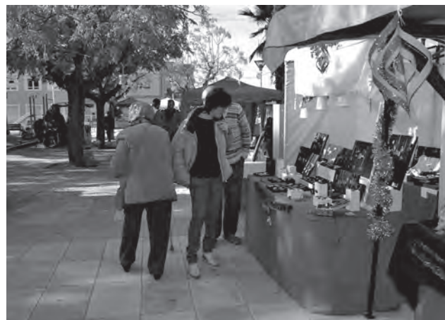
Muestra de Navidad de "MésqueArt" en la Plaça del Derrocat

La III Muestra de Navidad contó con una carpa central en la que los más pequeños pudieron participar en diferentes talleres y disfrutar de un espectáculo de magia a cargo del grupo Doctor Clown del Hospital Comarcal, mientras que los mayores recorrían los diferentes stands. Asimismo