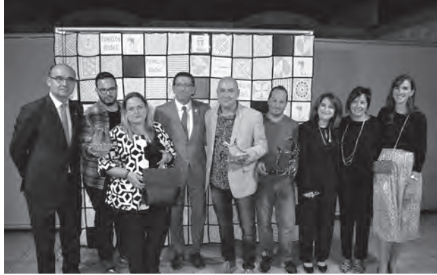
Imagen de los ganadores de los Model de este año junto a autoridades