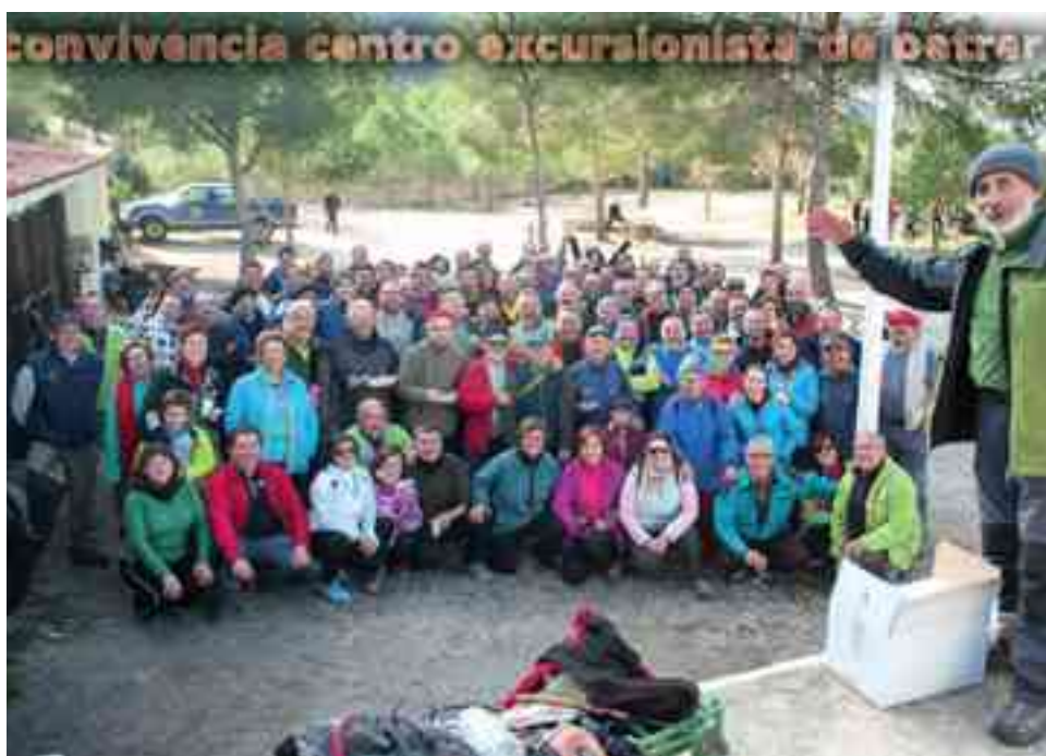
Integrantes del Centro Excursionista de Petrer

Un año más, como viene siendo habitual, el Centro Excursionista de Petrer celebró su día de convivencia en el campamento de Caprala donde dieron cuenta de un suculento almuerzo a base de gachamigas realizadas por sus socios.