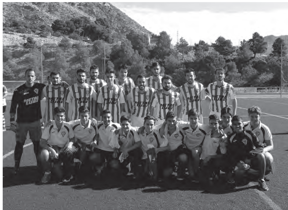
U.D. Petrelense en una imagen de archivo