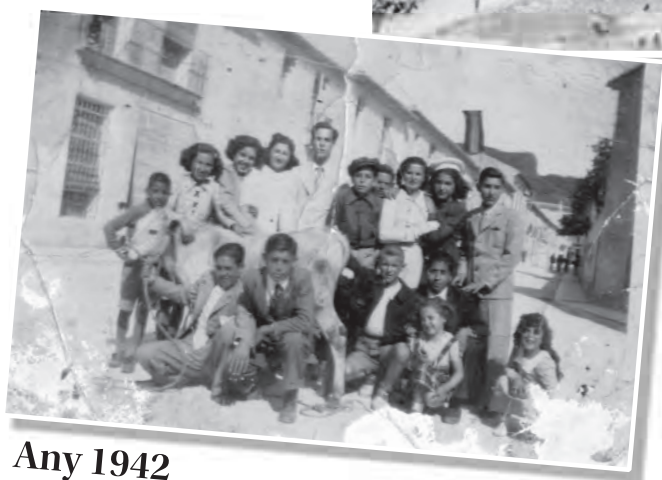
Any 1942 Grup d'amics de "la Patrulla" el dia de Sant Bonifaci