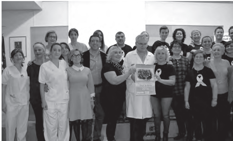
Durante la presentación