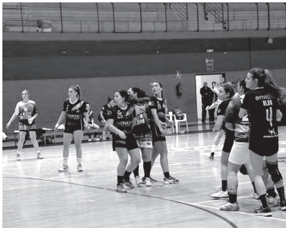
Hispanitas Petrer sénior femenino en Benidorm