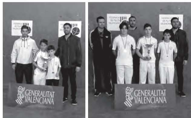
Equipos benjamín e infantil del Club Pilota Petrer

La fase final provincial de la modalidad de frontón se celebró en el polideportivo de Petrer