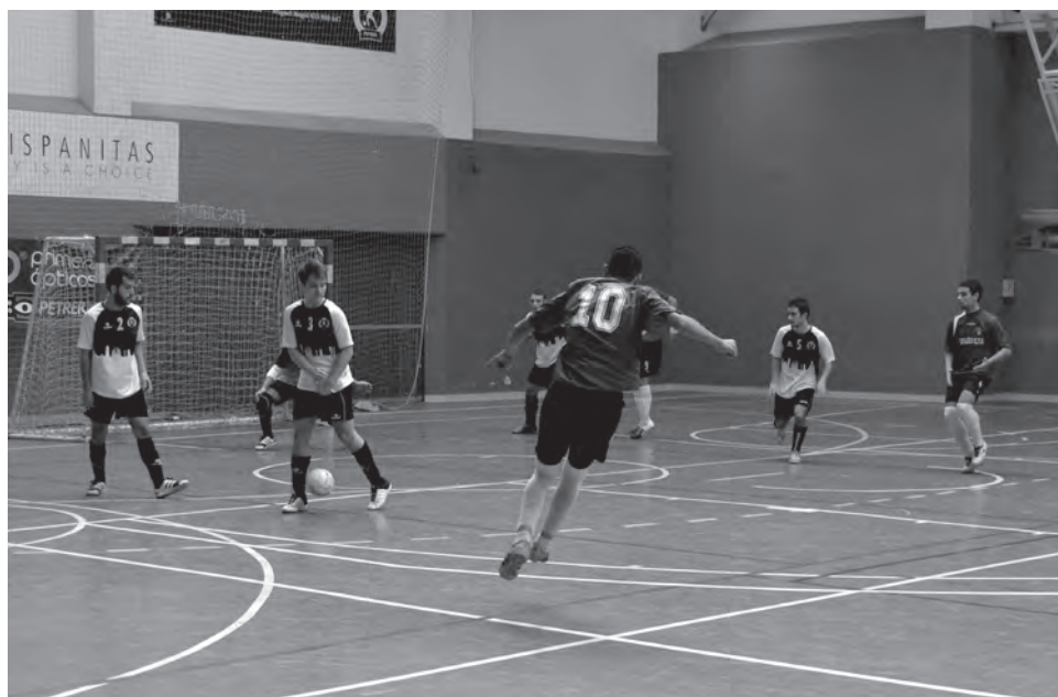
FS Petrer ganó in extremis al Xaloc

De infarto y prácticamente sobre la bocina se produjo la victoria el Fútbol Sala Petrer ante un gran equi-