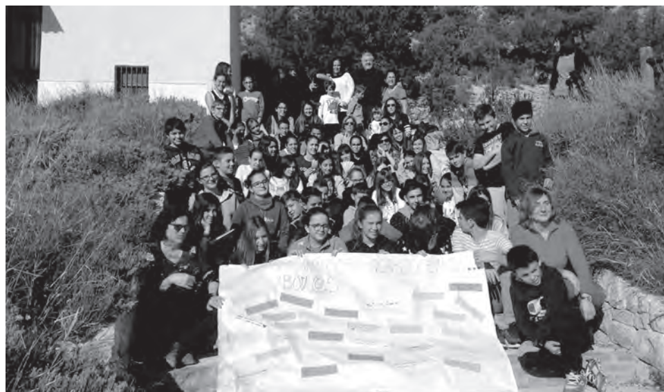
Imagen de participantes en las actividades organizadas

Es la tercera ocasión en la que los centros citados persisten en la importancia de crear una cultura de paz con el fin de que los centros educativos sean referentes en el ámbito del respeto y la convivencia. Si bien La Melva y el Azorín llevan más tiempo en la formación continua de su alumnado, en los dos últimos años la Torreta se ha unido a estos proyectos, que son dos: por un lado la formación de alumnos ayudantes, que tiene como objetivo la detección de situaciones y acoger, apoyar, facilitar y acompañar a otros alumnos que por diferentes circunstancias necesiten una atención en momentos determinados. Todo ello desde la presencia de valores esenciales como el respeto, la confidencialidad, com-