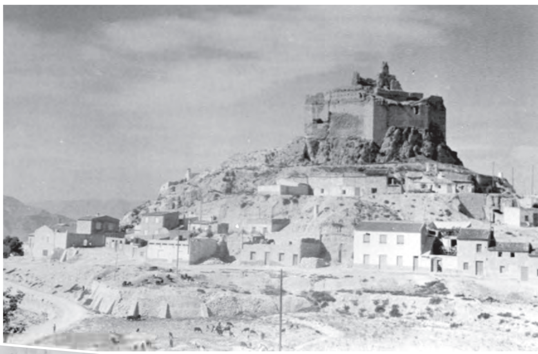
Any 1960 Vista posterior del Castell de Petrer, foto presa des del camí de Ferrussa.

I ENERO I FEBRERO I MARZO I ABRIL I MAYO I I JUNIO I JULIO I AGOSTO I SEPTIEMBRE I I OCTUBRE I NOVIEMBRE I DICIEMBRE I