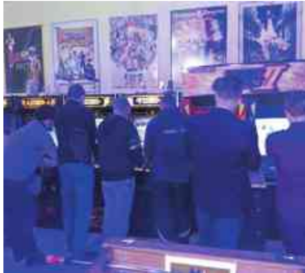
Imagen de la Jornada

Fueron más de 400 euros los recogidos en una jornada en la que además del pago simbólico de una entrada al recinto por valor de 15 euros y de ofrecer información detallada de la labor que la Fundación "Honrar la Vida" viene