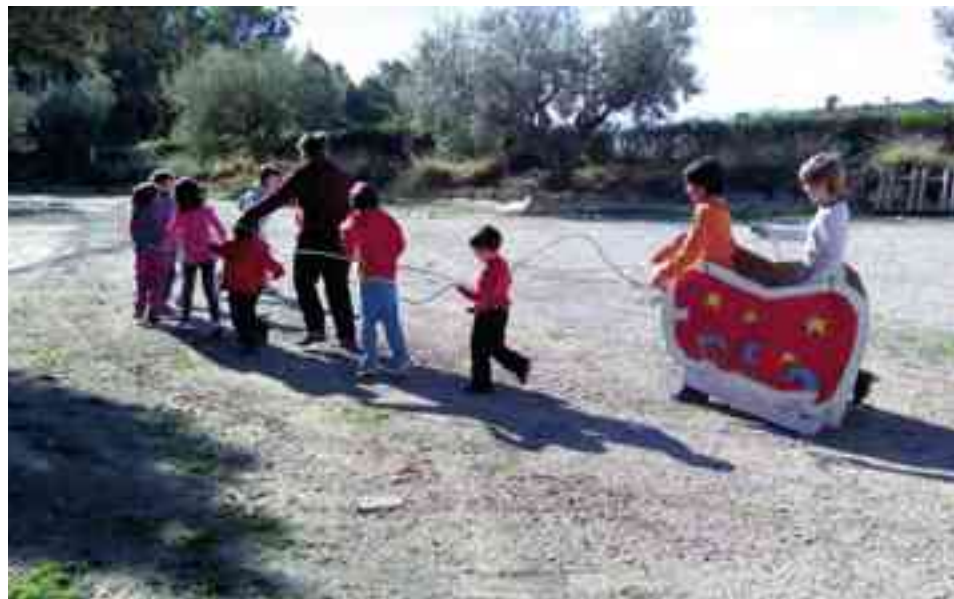
Imagen de una de las actividades desarrolladas en la Escuela de Navidad del año pasado

Se trata de una alternativa de ocio para los niños y una manera de que los padres puedan conciliar mejor la vida laboral y familiar en estas fechas de asueto