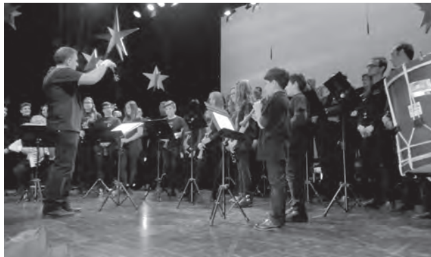
Momento del Concierto de Navidad de la EMTD, en el Teatro Cervantes