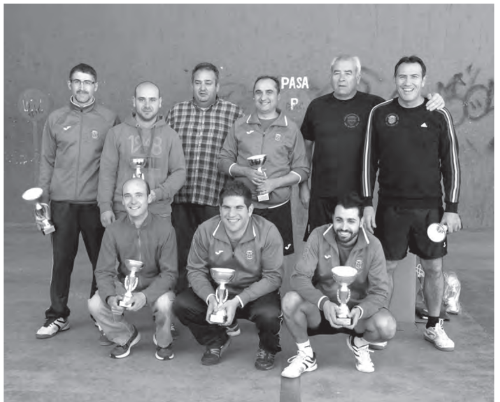
Finalistas del trofeo de otoño

Durante la disputa de las finales, la directiva ofreció a todos los presentes un buen surtido de típicos polvorones y bebida espirituosa que hizo entrar en calor a más de uno en esta época navideña. ●