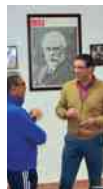
Detalles de la jornada electoral vivida por los diferentes partidos en sus respectivas sedes