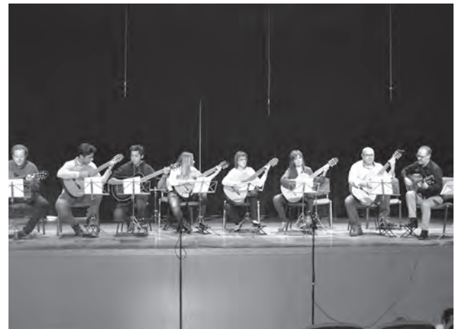
Audiencia Navideña de ECOMUT, en el Centre Cultural

do que la concepción que había manejado a la hora de escribirla era el de usar el contexto histórico en la ficción pero, aclarando, que la base de la historia era totalmente real aunque instrumentalizada. ●