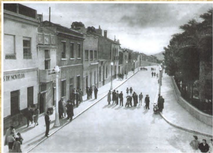
Any 1955. Perspectiva del passeig de l'Esplanada