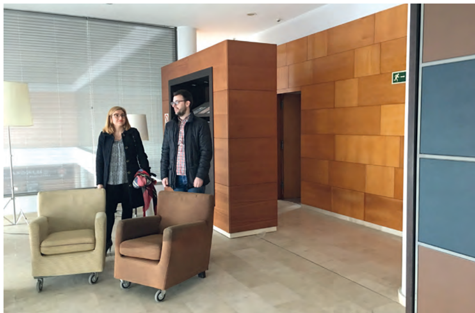
Imagen del interior

adjudicataria que contará con un plazo de ejecución de 6 meses. Además, la empresa adjudicataria dispondrá de 3 meses para iniciar esas obras desde el momento de la adjudicación.