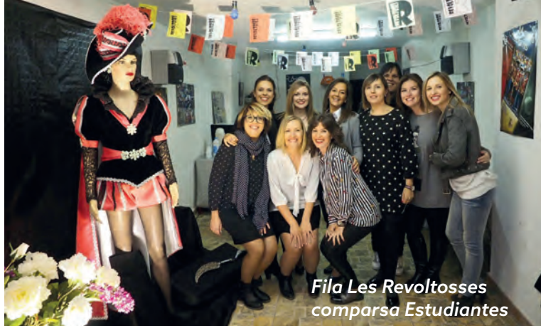
Fila Les Revoltoses comparsa Estudiantes