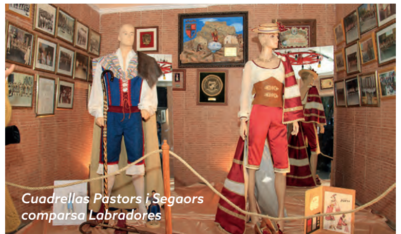
Cuadrellas Pastors i Segadors comparsa Labradores