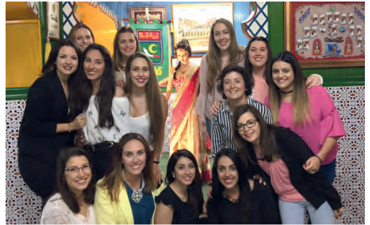
Fila Sadies comparsa Moros Viejos