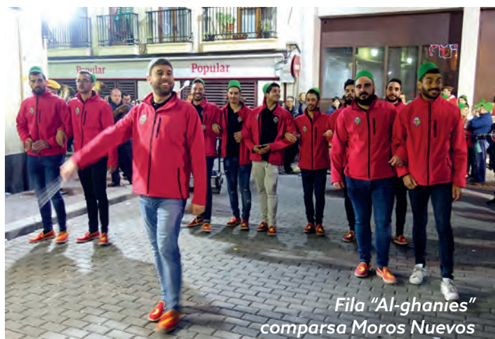
Fila "Al-ghanies" comparsa Moros Nuevos