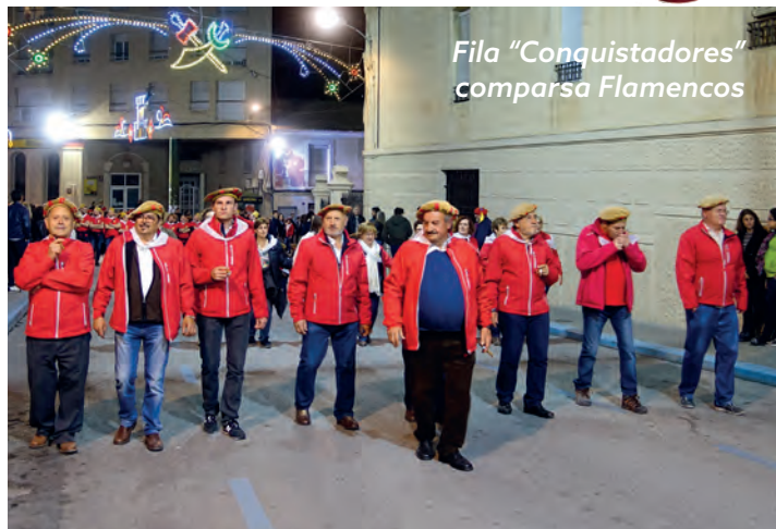
Fila "Conquistadores" comparsa Flamencos