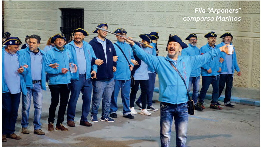
Fila “Arponers” comparsa Marinos

La Unión de Festejos ha programado para este viernes, 5 de mayo, la “Entraeta Extraordinaria” en la que desfilarán las filas y Cargos Festeros que en las Fiestas de Moros y Cristianos de 2017 conmemoran su 50 y 25 Aniversario. Mientras que el sábado, 6 de mayo, tendrá lugar la segunda jornada de las Entraetas de Comparsas con la participación de los Estudiantes y Labradores,