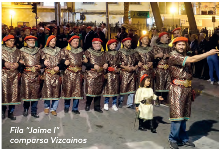
Fila "Jaime I" comparsa Vizcaínos