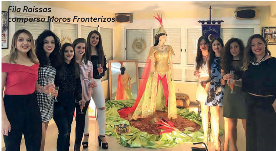
Fila Raissas comparsa Moros Fronterizos