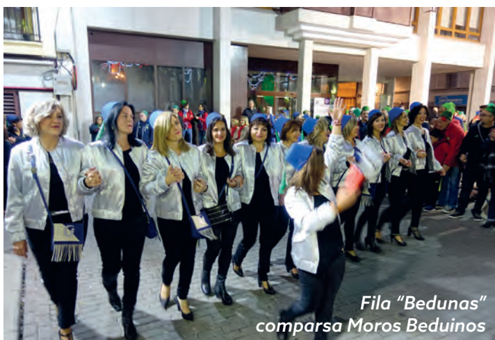
Fila "Bedunas" comparsa Moros Beduinos