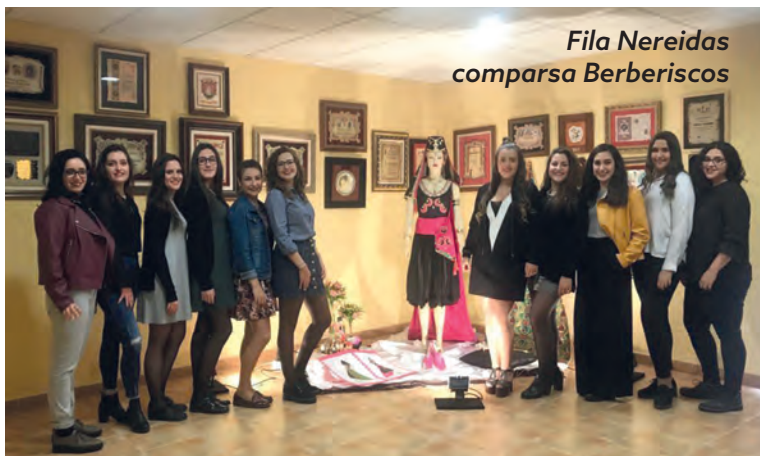
Fila Nereidas comparsa Berberiscos