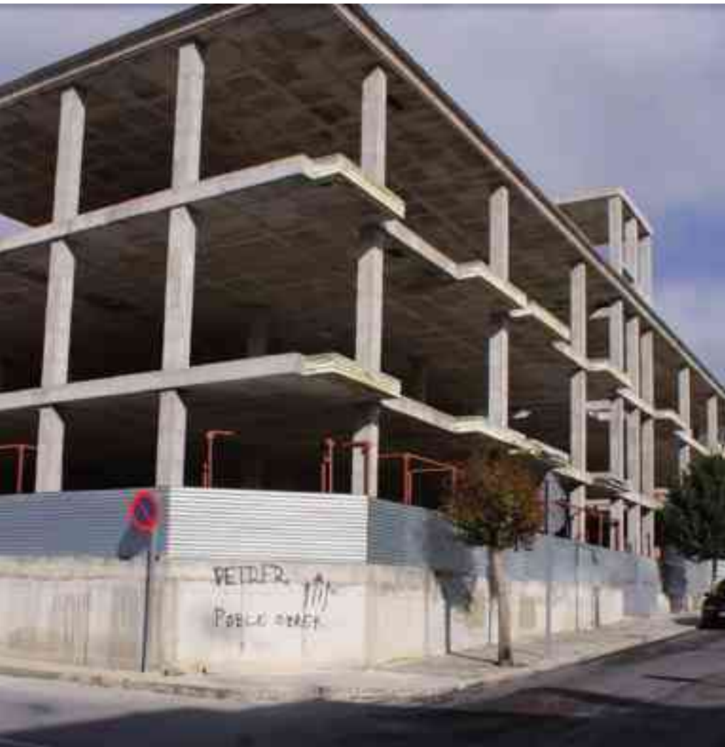
Avenida de Hispanoamérica