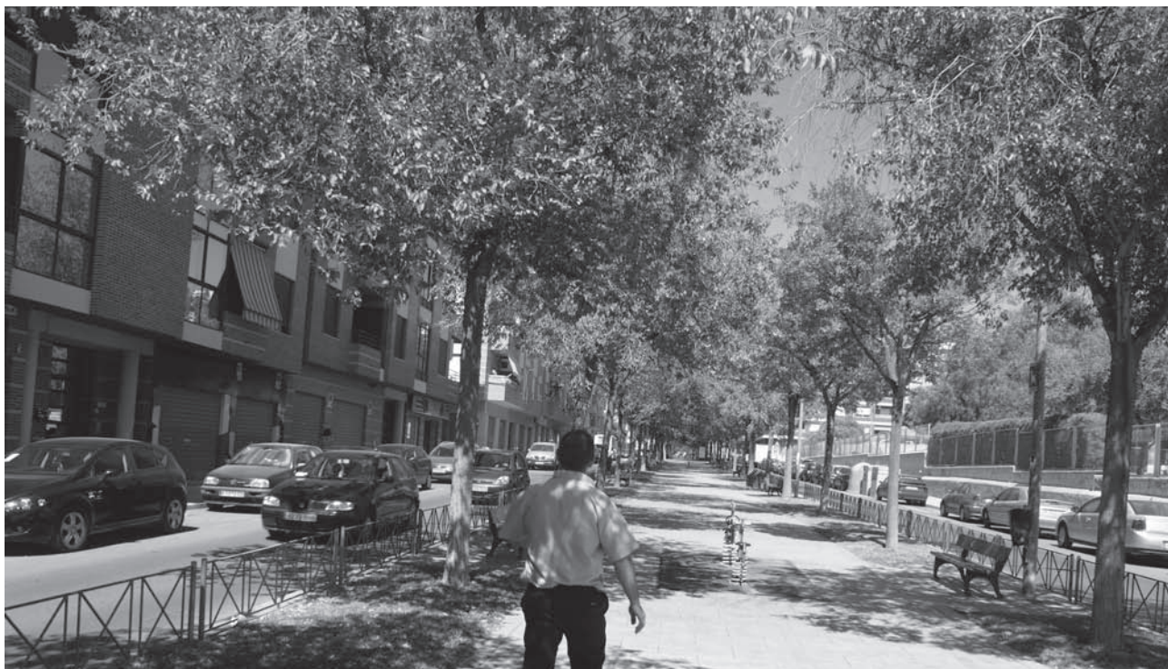
Imagen de la Avda. Felipe V, lugar donde se ha programado la Feria de Navidad