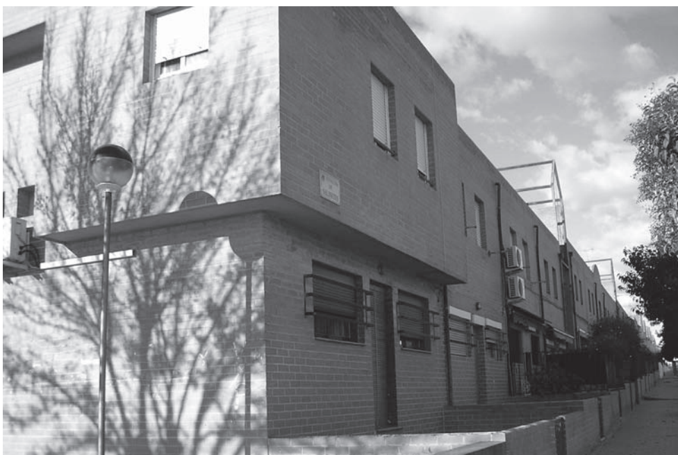
Una de las mociones pide la rehabilitación de las viviendas sociales vacías

Se centran en vivienda social, inversión autonómica para Petrer y violencia de género