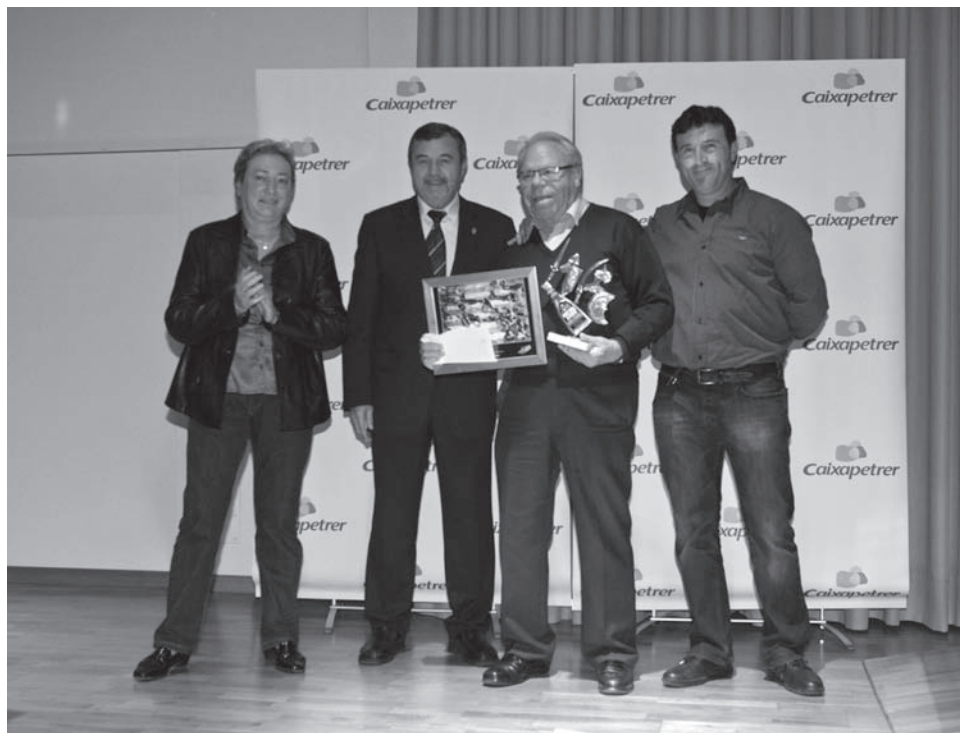
Imagen de la entrega de los premios del concurso de fotografía que tuvo lugar durante la velada

la gran novedad de este año es que una vez se ha visionado la película, que cuenta con una duración de 70 minutos, cabe la posibilidad de acceder a través