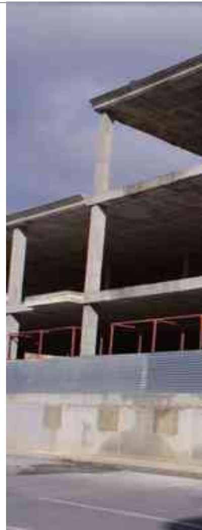
Edificio a medio construir y paralizado en la Avenida