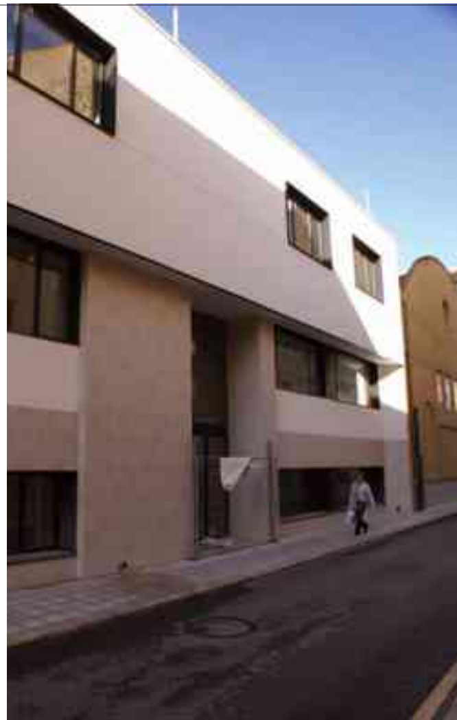
Parte de la Manzana Cultural sigue cerrada y sin uso

nes culturales y a otros usos relacionados con la cultura. La falta de créditos de los bancos ha dado al traste con un gran proyecto para regenerar una zona deprimida: el PRI de la calle Andalucía y zona adyacente. El Ayuntamiento facilitó a la empresa pública Pro Aguas dependiente de la Diputación Provincial dos solares en las calles La Mancha y Comparsa de Marinos en los que se construyeron un total de cuarenta y una viviendas de diversas dimensiones. Con los beneficios de la venta de los inmuebles la empresa acometería la construcción de nuevas casas y un gran espacio de zona verde