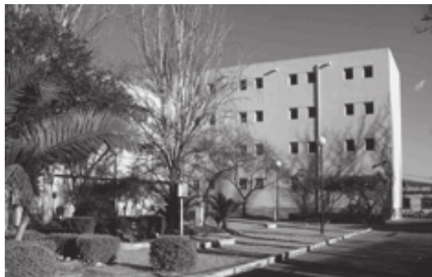
El IES "Azorín" está pendiente de una remodelación integral

No obstante, ha matizado que el hecho de que el grupo municipal del PP de Petrer apoye esta propuesta no