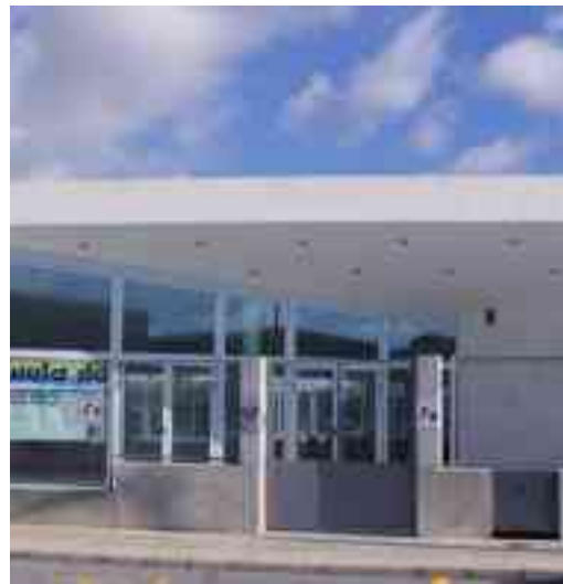
Fachada del nuevo edificio de "Sense Barreres"