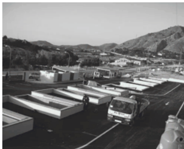
Eco Parque de "Cuatrovientos"

La idea, ha matizado, es que se tenga que pagar a partir de una determinada cantidad de kilos vertidos con el fin de que tampoco suponga un gasto excesivo para los usuarios del servicio. ●