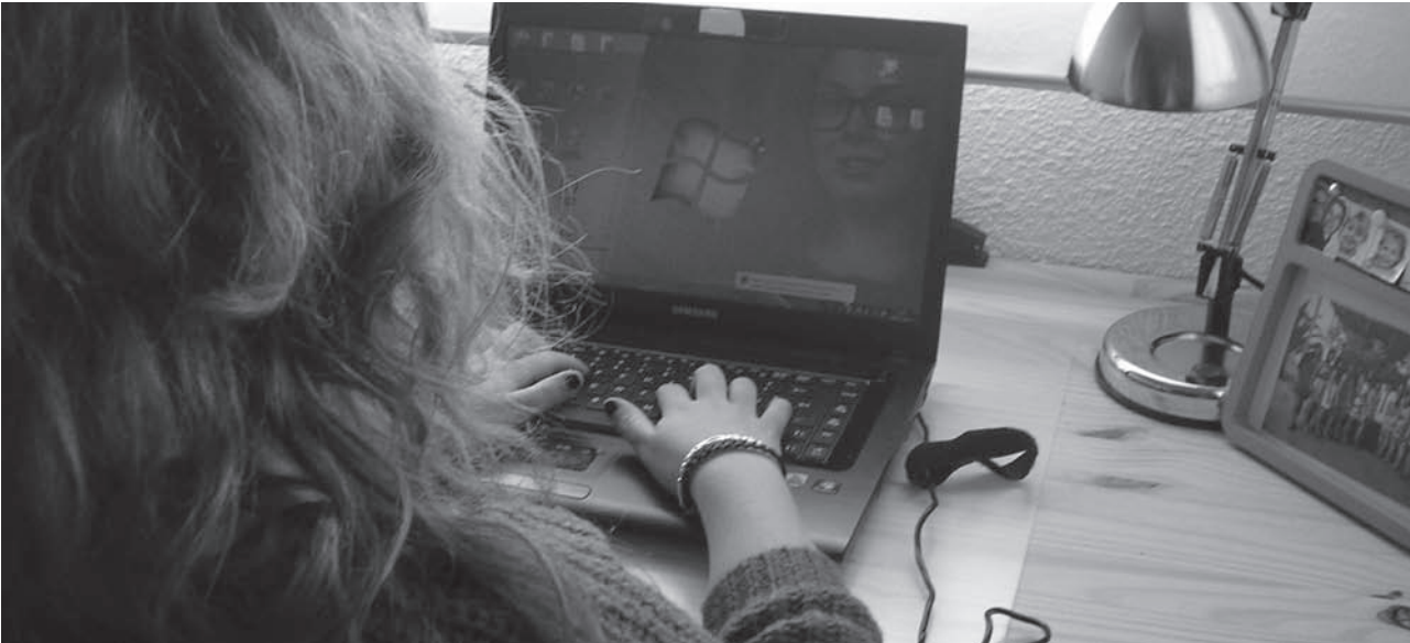
El uso de las redes sociales están a la orden del día entre los adolescentes y jóvenes

La próxima semana habrá acceso a la información a través de facebook, twitter y tuenti