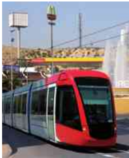
Imagen virtual del bus guiado

Los tiempos han cambiado y el panorama es ahora totalmente distinto. La crisis está tambaleando la vida económica y deja un reguero de grandes secuelas y servicios que, después de importantes inversiones, están dejando infraestructuras y edificios recién construidos "aparcados" y cerrados a la espera de mejores tiempos. En Pe-