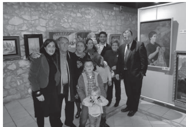
Exposición de Gabriel Poveda en el Forn Cultural

Con esta exposición lo que se pretende, puntualizó el concejal de Cultura, es re-