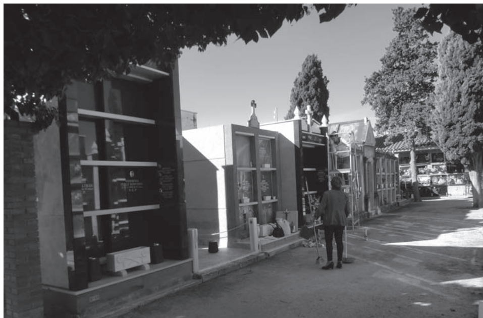
Cementerio Municipal de Petrer

De esta forma, ha explicado el portavoz adjunto del Partido Popular, Óscar Payá, se da cumplimiento a la normativa autonómica sobre Policía Sanitaria Mortuoria que establece la obligatoriedad de que los cementerios municipales dispongan de un reglamento interno de funcionamiento y utilización mientras que la aprobación de la ordenanza es para adecuarse a esa misma normativa puesto que hasta el momento el Ayuntamiento de Petrer solo ha contado con una ordenanza de carácter fiscal. Otro motivo que ha determinado que el equipo de gobierno haya decidido crear tanto el reglamento como la ordenanza ha sido, según Óscar Payá, "la externalización del servicio del Cementerio Municipal ya que, aunque es un funcionario quien está al frente