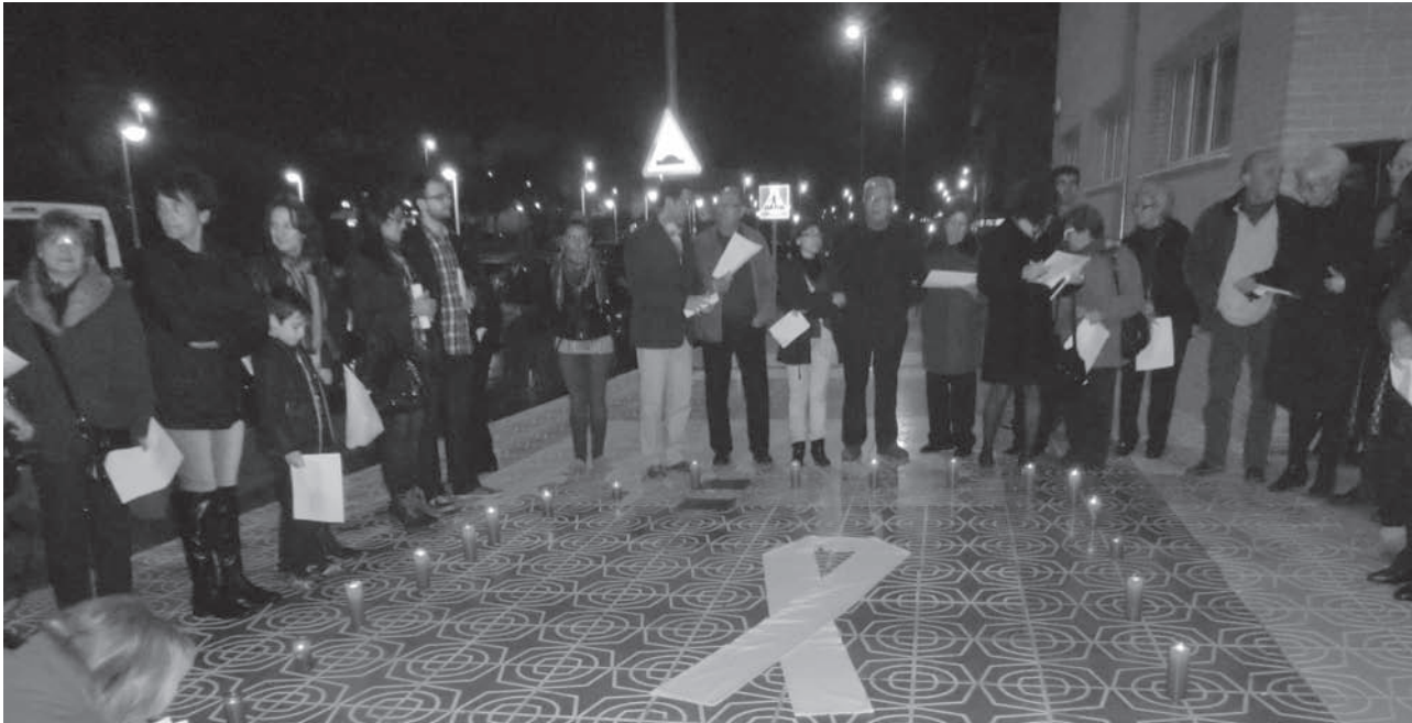
Concentración contra la violencia de género en las puertas del Centro "Las Cerámicas"