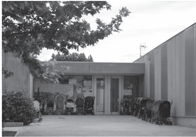
Imagen de archivo. Escuela Infantil Virgen del Remedio

perder ninguna oportunidad para seguir reclamando y exigiendo, con todas las armas y herramientas que democráticamente disponen, tanto en el Ayuntamiento de nuestra localidad como en las Cortes Valencianas, que esa