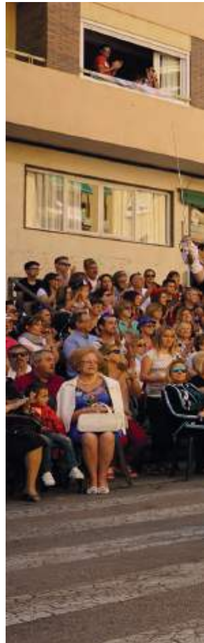
Imagen de archivo. Capitanía de la comparsa Est...

Por su parte el Diputado de Promoción Turística subrayaba que una primera prueba de ese compromiso que había adquirido durante la reunión con la Unión de Festejos era que se va a intentar incluir la promoción de la Entrada Cristiana, a