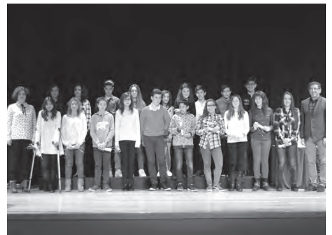
Imagen de los galardonados junto a autoridades locales