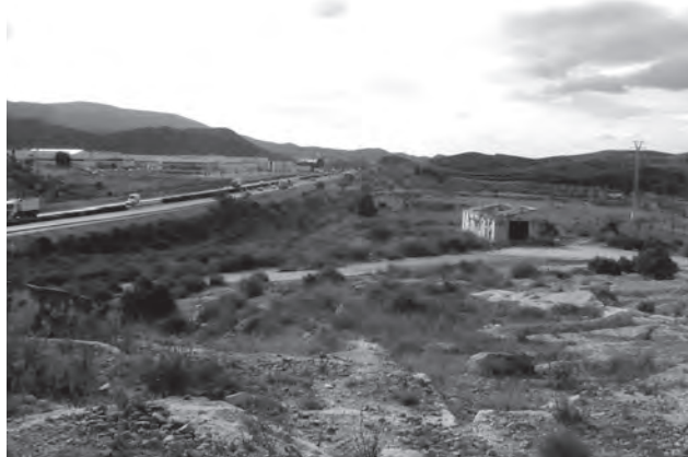
Imagen de archivo de la zona donde estaba previsto el polígono "La Cantera"

El concejal de Hacienda ha continuado calificando como especialistas en demorar y ocultar deuda a los populares y en ineficaces a la hora de promover y desarrollar proyectos, se-