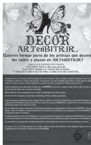
Cartel promocional de esta actividad

Cabe recordar que cualquier persona o colectivo puede colaborar en la decoración con un dibujo, pancarta, escultura, poesía, fotografía, guirnalda, un mural o cualquier otro elemento que se pueda