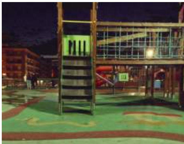
Juegos infantiles en el parque de Las Chimeneas

El portavoz y representante de Ciudadanos añade que en la moción se pide que el equipo de gobierno tenga en cuenta una partida para este menester en los presupuestos municipales de 2017, pero además, y una vez hecha la liquidación del presupuesto de 2015, y en la dotación que se destine a los proyectos financieramente sostenibles, destinar una parte a la sustitución de juegos infantiles en una o más