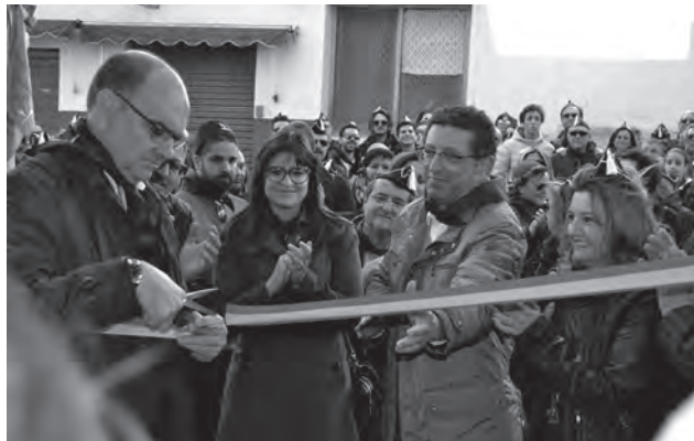
Momento del corte de cinta de la sede de los Estudiantes "El Campus"