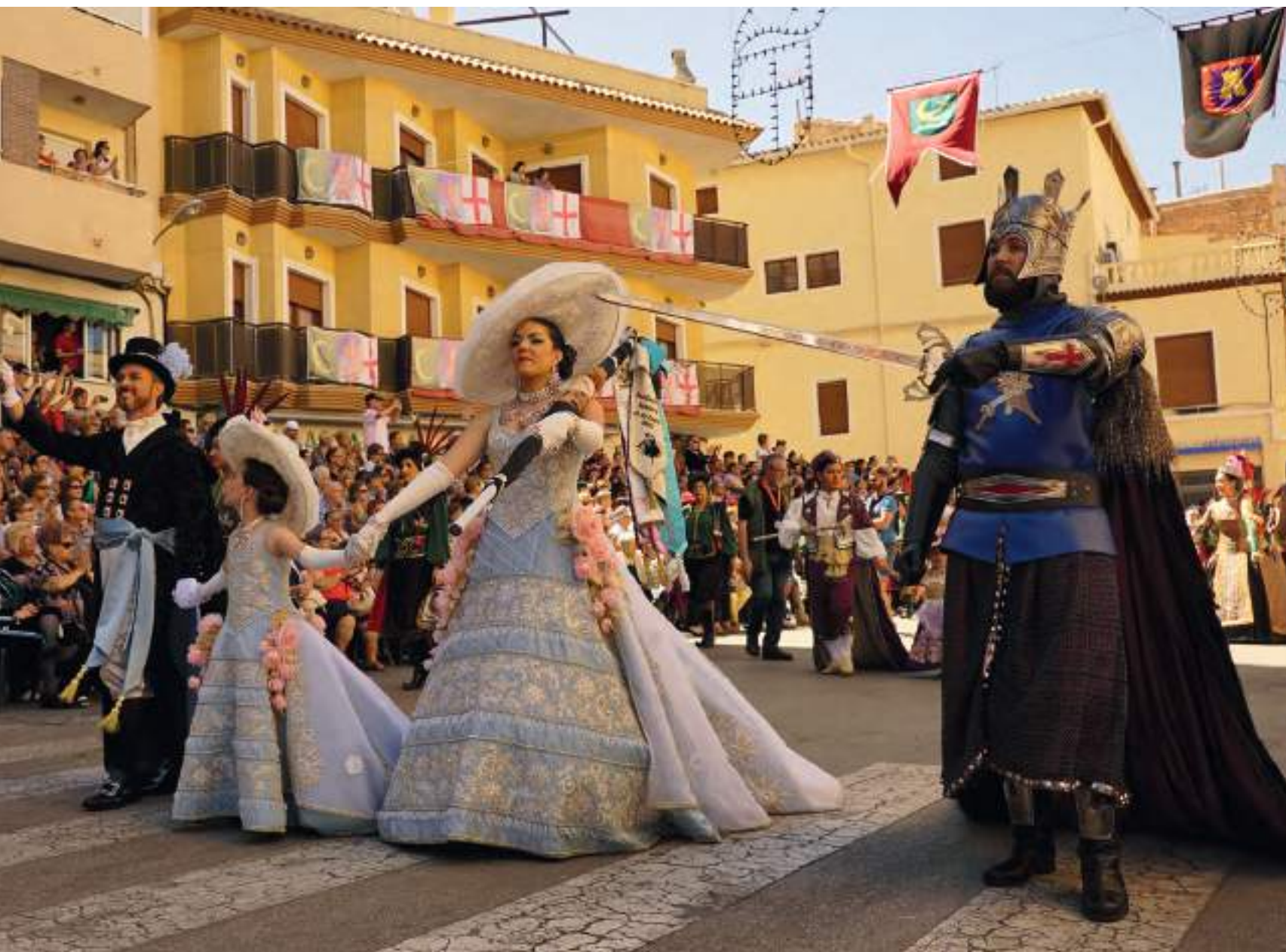
Estudiantes durante el desfile de honor, el domingo 17 de mayo de 2015

“Tourist Info”, en particular, y las Fiestas de Moros y Cristianos de Petrer, en general, en las líneas de promoción del segundo trimestre del año del “Patronato de Turismo”, que incluye el mes de mayo y de esta forma intentar atraer más turismo. Pero, además, explicó que no se va a tratar de una acción aislada para este año 2016 sino que la intención es complementarla con otras iniciativas de cara al futuro.