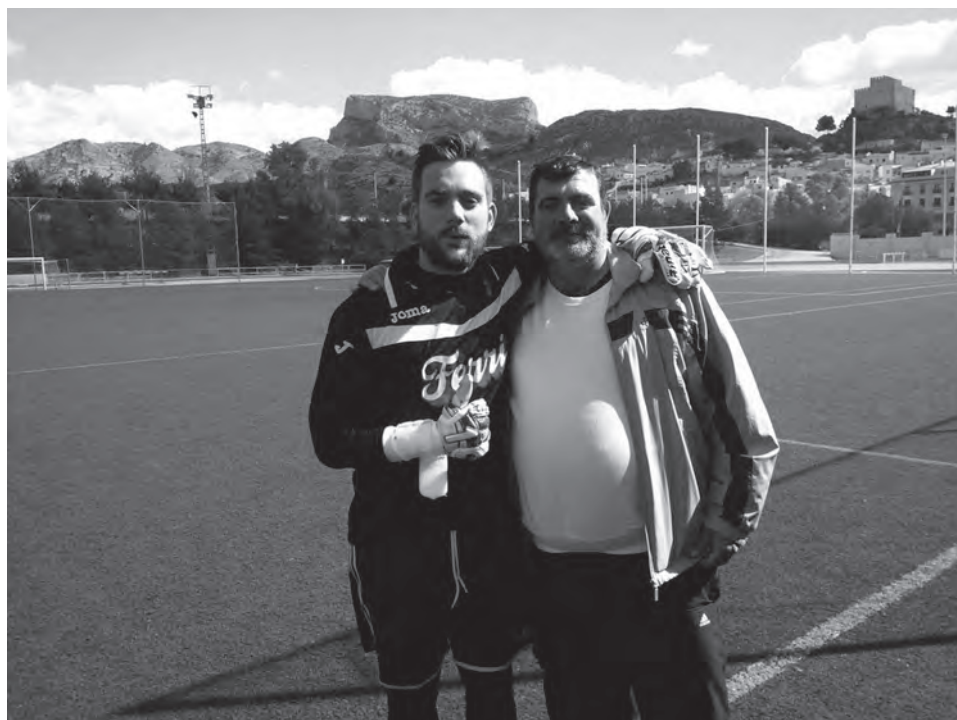
El petrerense "Mendi" defendió la portería del Villena

N. Benidorm-U.D. Petrelenso Domingo, 12 marzo, 11:45h Campo (Guillermo Amor)