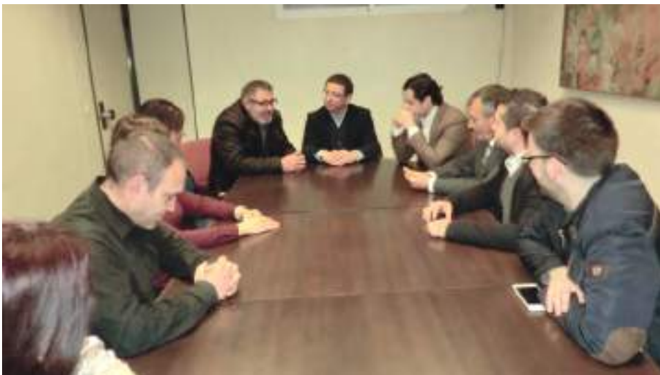
Reunión de autoridades festeras y municipales con el Diputado Provincial de Promoción Turística

través del "Pack Festero" que desde hace unos años se lanza como herramienta de promoción de la jornada festera del sábado desde la