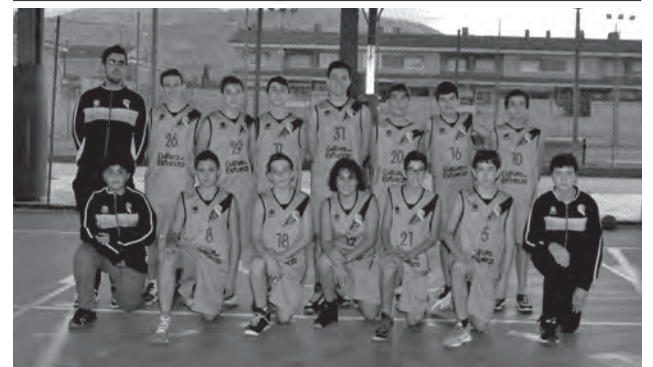
C.B. Petrer cadete B

El cadete A logró su primera victoria en la liga Preferente contra Jorge Juan A