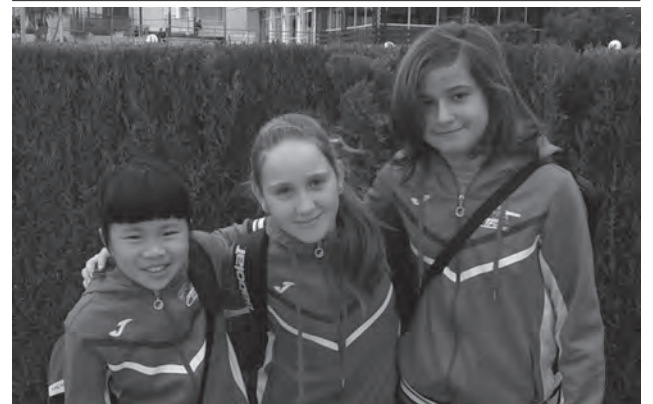
Equipo alevín femenino

Las chicas cayeron en Villena 2-0 y los chicos fueron derrotados en casa 1-5 por el C.T. Oliva