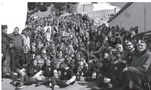
Foto de familia de los "Estudiantes" en las escaleras de la ermita del Cristo

finales del Campeonato de Mesa, un sorteo de regalos y