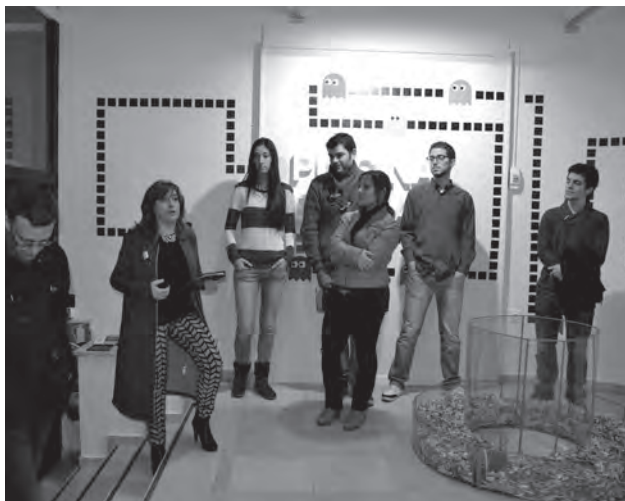
Momento del acto de inauguración de la exposición "Game Over"

Precisamente, en el apartado lúdico, de los dos de que se compone la exposición, hay que mencionar los juegos instalados y que interactuarán con los visitantes, y que son los de Sudoku Transparente, Sopa de Letras, Las 7 Diferencias, Mario Bros, Dominó, Solitario de Cartas, Solitario de Bolas, Tetris y la Piscina de Olas. ● S.A.R.