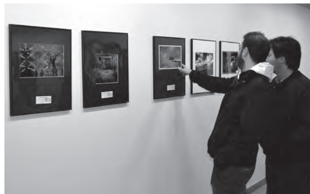
Imagen de archivo. Exposición retrospectiva de "FotoPetrer"

Respecto a la participación, ha apuntado que en esta nueva edición se han presentado un total de 61 plicas de diferentes autores y un total de 393 fotografías. En concreto, 168 al apartado Mejor Colección, 173 a "Mejor Fotografía" y 52