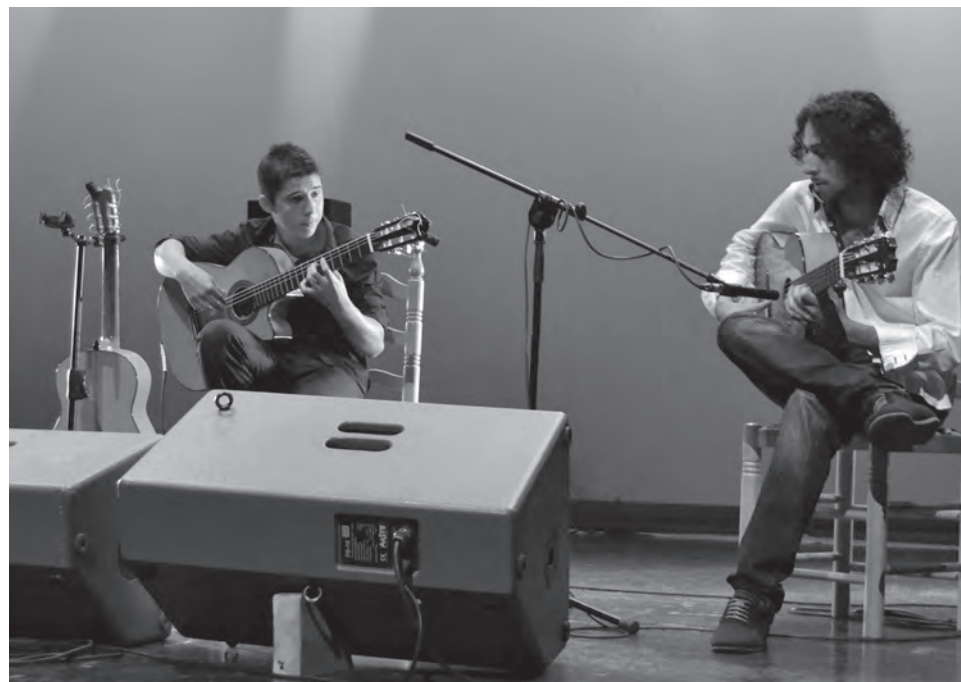
Imagen del concierto inaugural en la edición de 2014

El 5 de junio, ha añadido, se hará una presentación a nivel nacional a través de Radio Clásica para ya, por último, en fechas aún por determinar, tener lugar en Petrer la presentación oficial donde ya se darán a conocer con más detalle toda la agenda de actividades y conciertos que conformarán esta edición del Festival Internacional de la Guitarra.