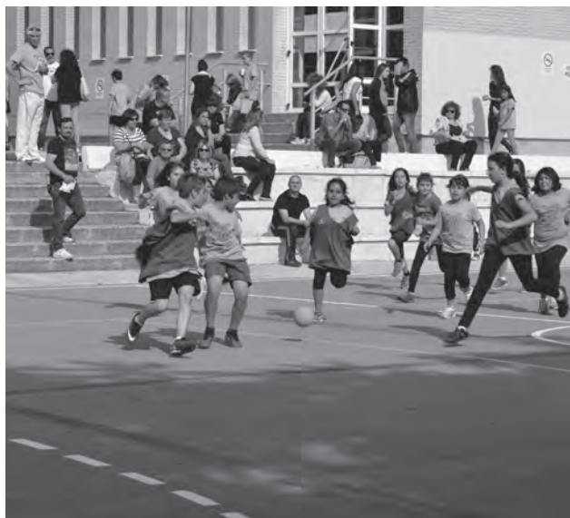
Rambla dels Molins

Hay que dar la enhorabuena a todos por el magnífico ambiente deportivo vivido y también agradecer la colaboración e impli-