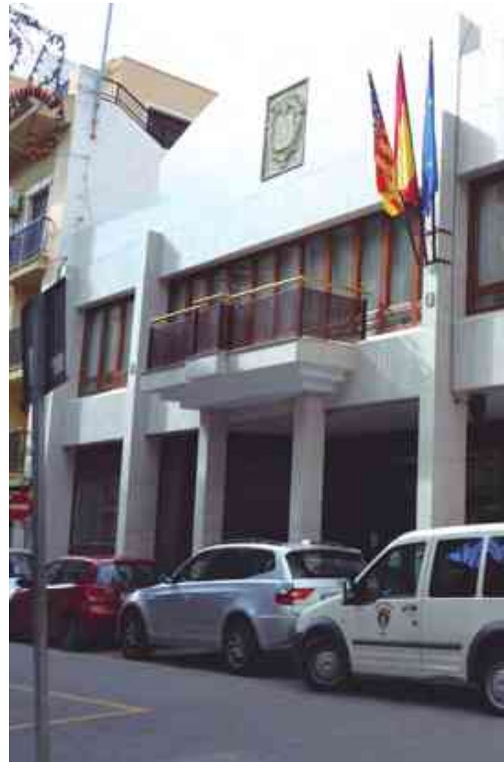
Fachada exterior del consistorio municipal

Al cierre de este semanario, Esquerra Unida y "Sí se puede Petrer" ya le habían comunicado al PP que no le iban a apoyar ni para formar gobierno ni en la investidura para que Pas-