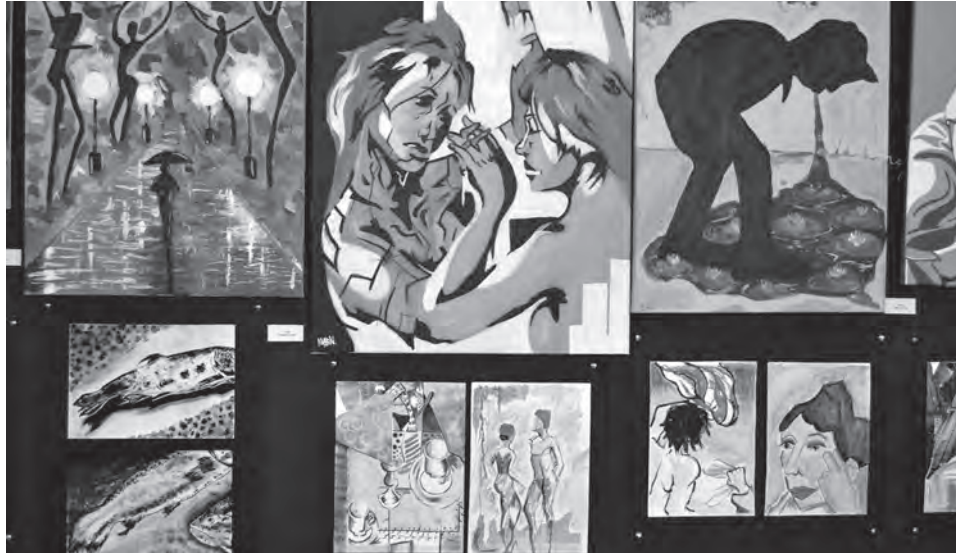
Imagen de alguno de los trabajos expuestos

La exposición incluye, entre otras, pinturas, bodegones y trabajos de volumen de barro