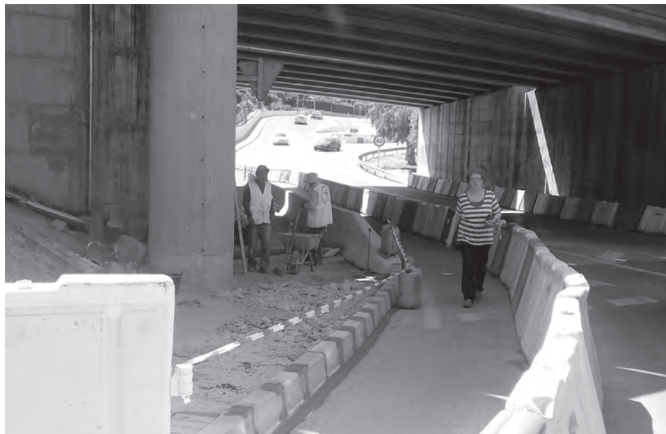
Trabajadores construyendo la barrera para garantizar la seguridad de los peatones bajo el puente de Salinetas