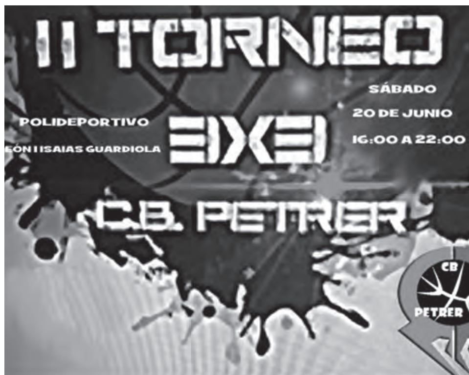
Cartel del II torneo 3x3

El Club Baloncesto Petrer trabaja para poder inscribir siete equipos en competición federada la próxima temporada