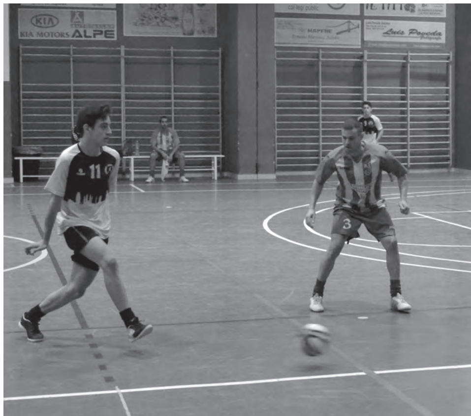
Fútbol Sala Petrer