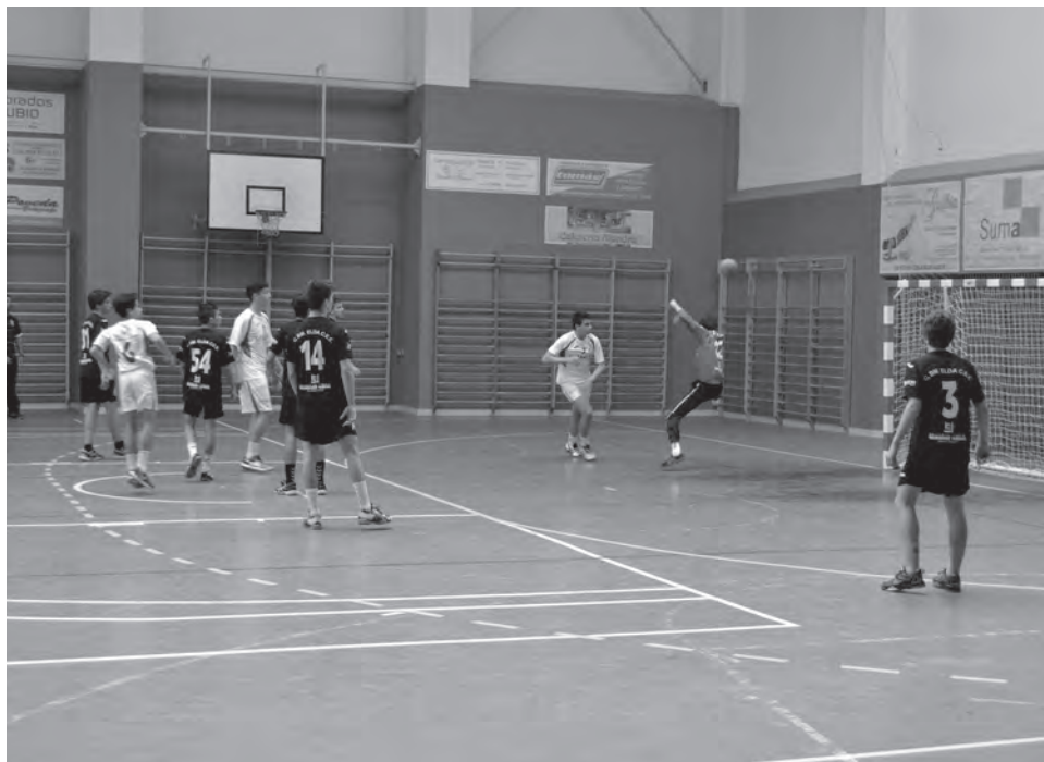
Hispanitas Petrer Infantil B

Por último, Hispanitas Petrer B terminó su andadura en la Copa ranking con una derrota casera frente a Villa Blanca de Altea por 9-16. En la clasificación han sido segundas con 16 puntos. ●