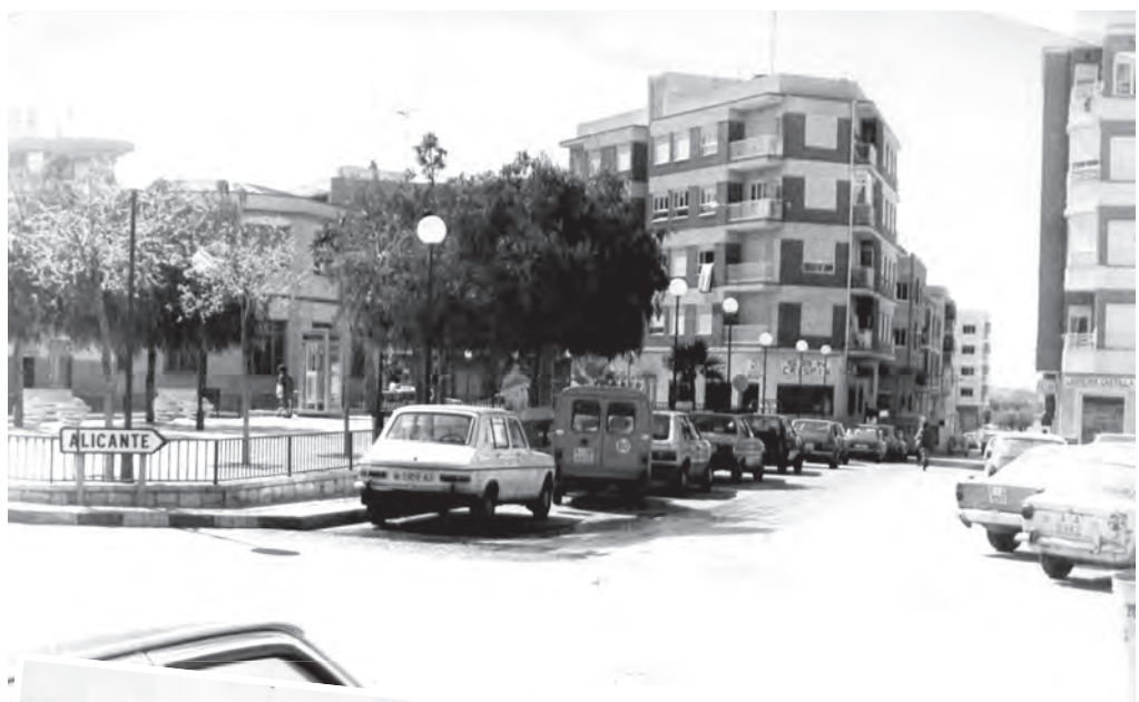
Any 1985 Vista de la Plaça San Crispín amb el seu disseny original.

I ENERO I FEBRERO I MARZO I ABRIL I MAYO I I JUNIO I JULIO I AGOSTO I SEPTIEMBRE I I OCTUBRE I NOVIEMBRE I DICIEMBRE I