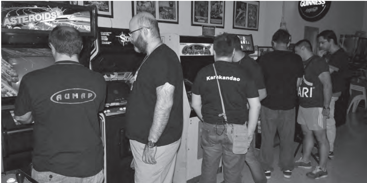
Imagen del interior de la sede donde se llevó a cabo el torneo con varios participantes en plena acción