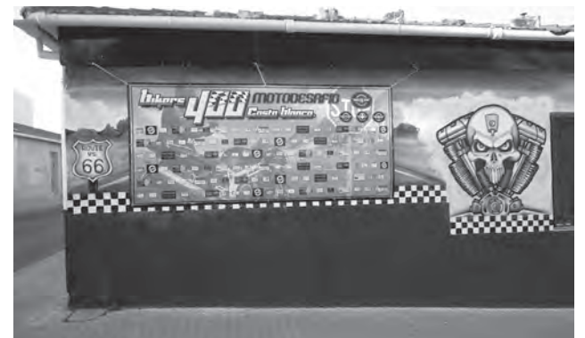
Fachada de la sede de la Agrupación con el cartel de la actividad

Respecto a la inscripción, los interesados en participar deberán realizarla