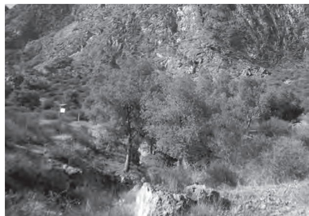
Imagen de un pino afectado por el "Tomicus"

que a pesar de que no se ha recibido ninguna denuncia al respecto, se viene haciendo un seguimiento de esta plaga ya que surge en épocas de sequía y pese a que cuando ataca a los pinos la única solución existente es proceder a la tala de los ejemplares afectados, por suerte, en la actualidad, son sólo casos aislados los que por el