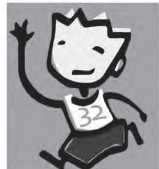
Logo de presentación de la actividad

El acto comenzará a las 17:30h en el pabellón municipal y se prolongará por el espacio de una hora y media