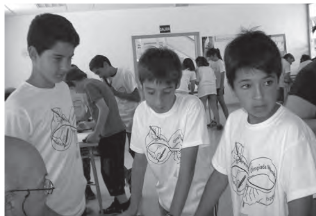
Algunos de los participantes durante una de las pruebas celebradas en Castellón

Respecto a las pruebas realizadas hay que indicar que consistieron en una prueba individual, en la cual hubo que resolver seis cuestiones matemá-