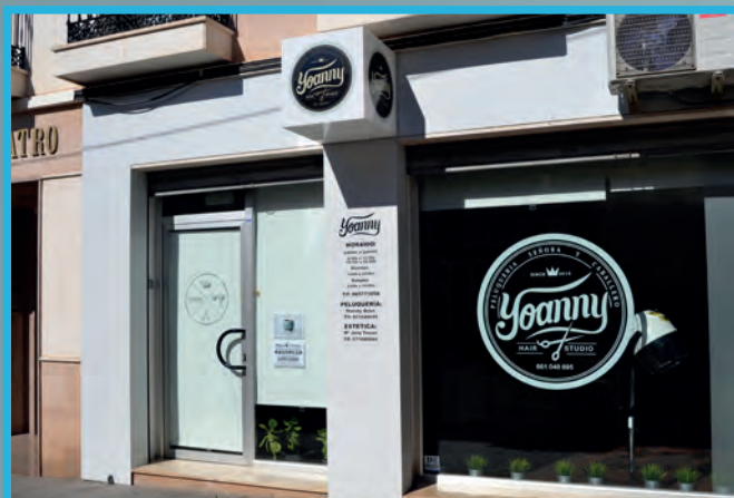
YOANNI PELUQUERÍAS Jardines N° 19 Tratamiento y peinado para el cabello