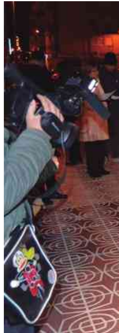
Imagen de archivo. Concentración contra la violencia

Mientras que a las doce del mediodía, en la Plaça de Baix, si la climatología lo permite y si no en el Salón de Plenos del Ayuntamiento de Petrer, se celebrará un acto abierto a toda la ciudadanía, asociaciones, colectivos y entidades de nuestra localidad en el que intervendrán representan-