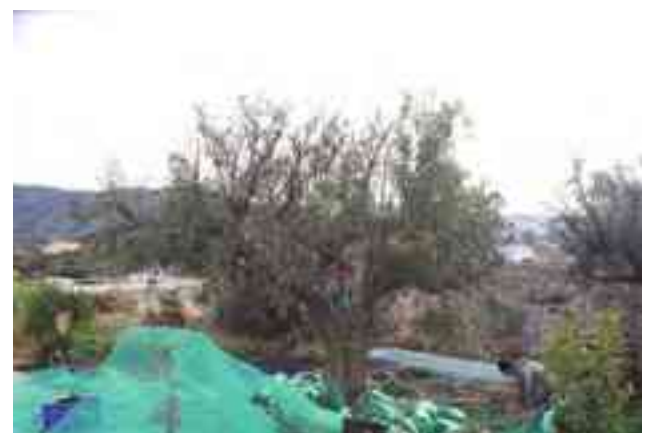
Imagen de recogida de la aceituna

Por último, el director gerente de esta entidad agraria ha recordado que el horario de la Almazara