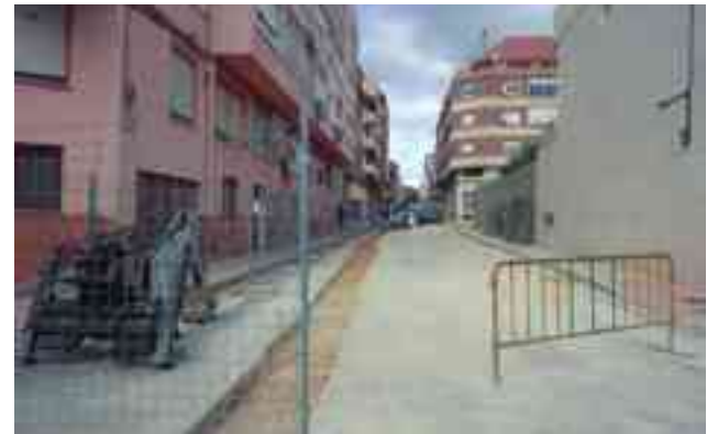
Obras de renovación de parte de la red de saneamiento, en la calle Azorín