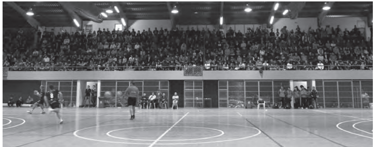
La grada, abarrotada en el último derbi

Agustinos-Hispanitas Petrer Sábado, 22 noviembre, 18h Pabellón (col. San Agustín)