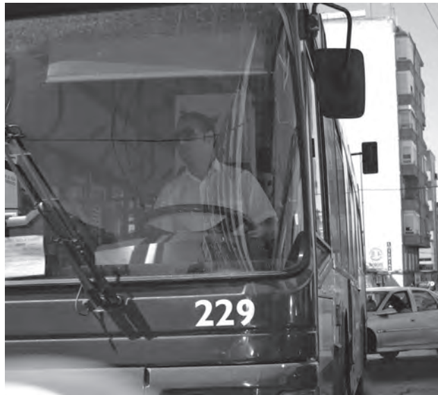
Imagen de un autobús circulando por las calles de Petrer

El segundo tema de carácter local sobre el que se ha referido David Navarro, manifestando su malestar y sorpresa, ha sido el tratamiento que el equipo de gobierno ha dado al asunto del juicio al policía local acusado de malversación de caudales públicos y fal-