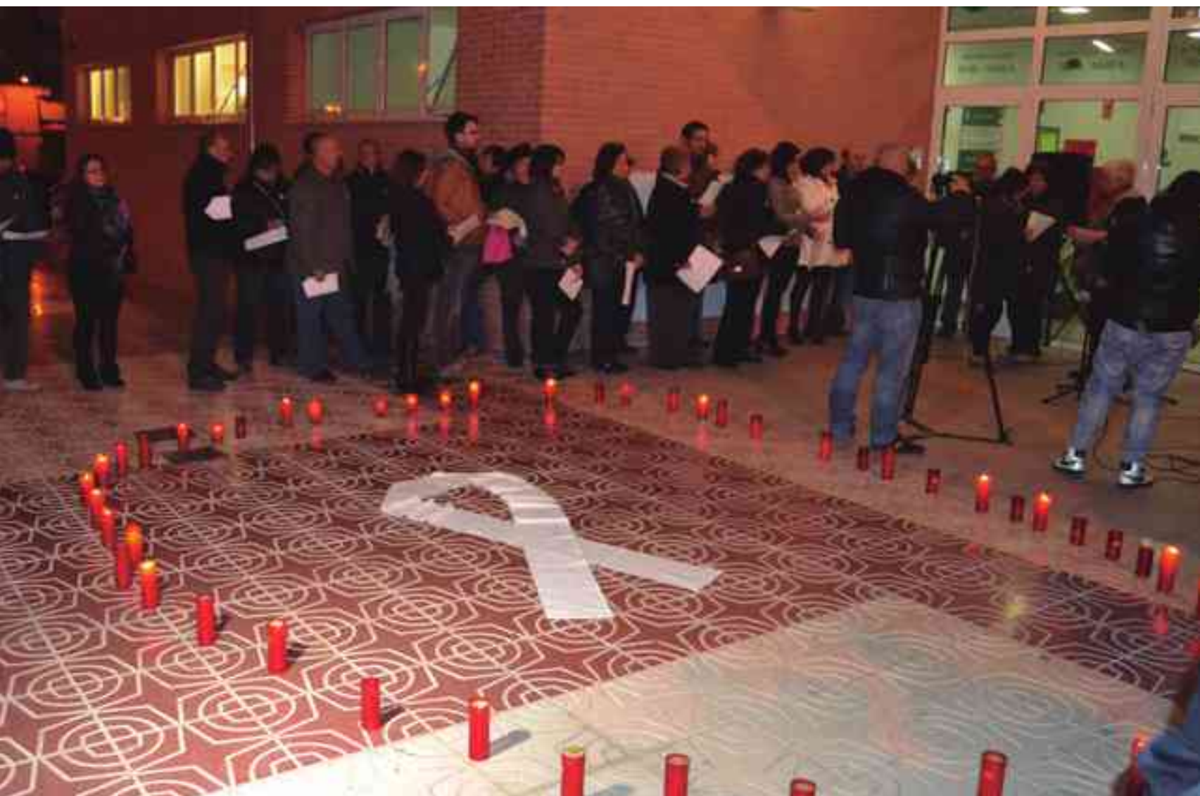
Violencia machista a las puertas del Centro Municipal Las Cerámicas