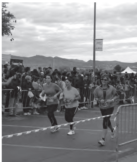
Más féminas que nunca