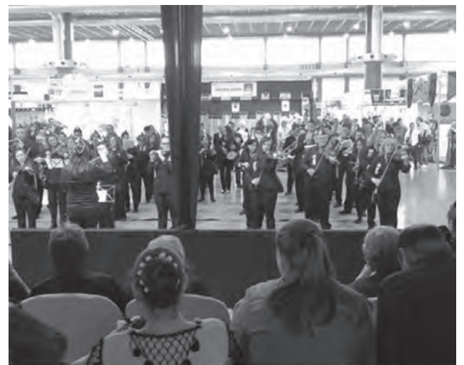
"La Jarana" actuando en ExpoFiesta, este pasado domingo

Finalmente, el concejal de Cultura ha añadido que "este libro que resalta la importancia de este tratado firmado en 1244 por el rey Jaime I con los castellanos, guarda muchas similitudes al texto de 'La Rendició' que en Petrer representamos". ● A.B.