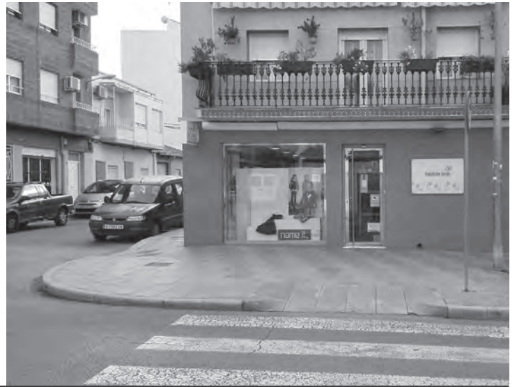
Estela, mare i filla, a l'interior de la carnisseria. Façana actual del lloc on es trobava la carnisseria