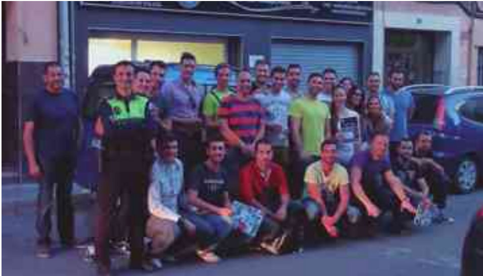
Foto de familia de los agentes de la Policía Local de Petrer y otras poblaciones tras finalizar el curso

Petrer va a contar con una unidad específica contra los graffitis