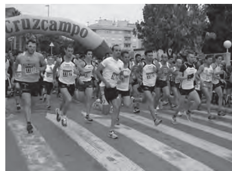
Salida Media Maratón