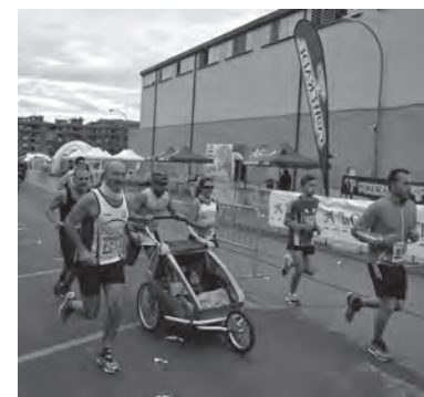
Familias enteras corriendo