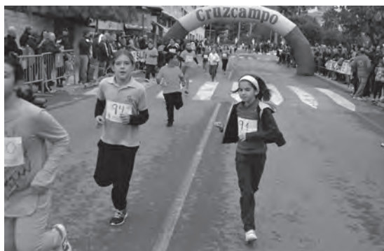
Niños entrando a meta