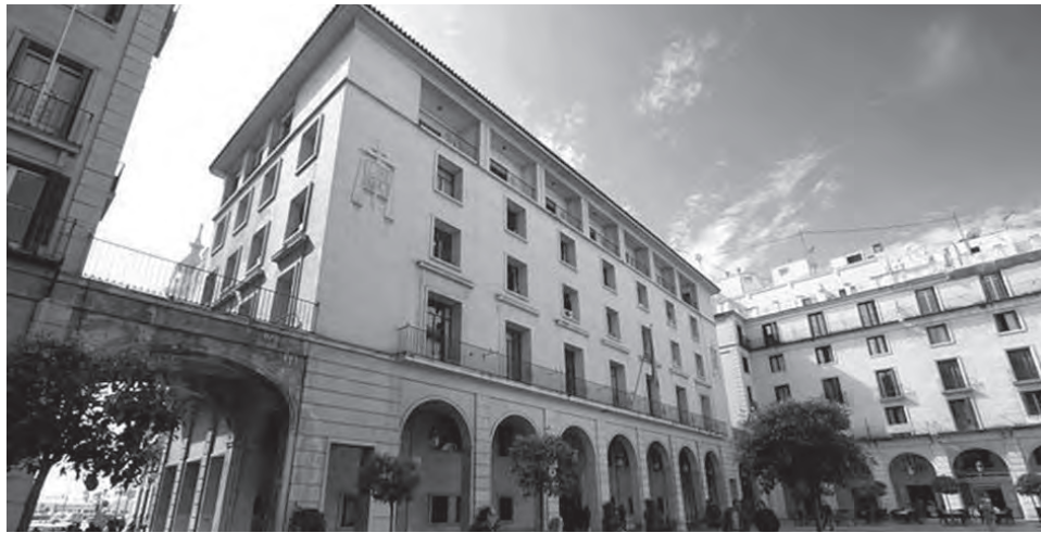
Imagen de la sede de la Audiencia Provincial de Alicante donde se celebró el juicio

Cabe recordar que tras una investigación interna del Ayuntamiento de Petrer se