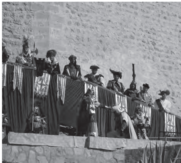
Imagen de archivo de "La Rendició" en el castillo