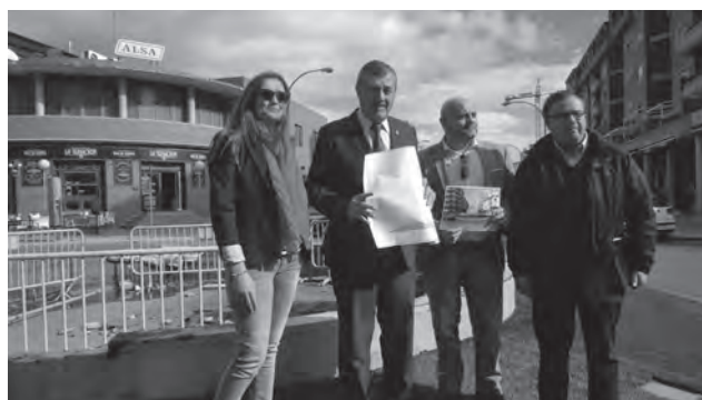
Diversas autoridades y técnicos locales visitando la fuente

La primera autoridad municipal señalaba que, en un