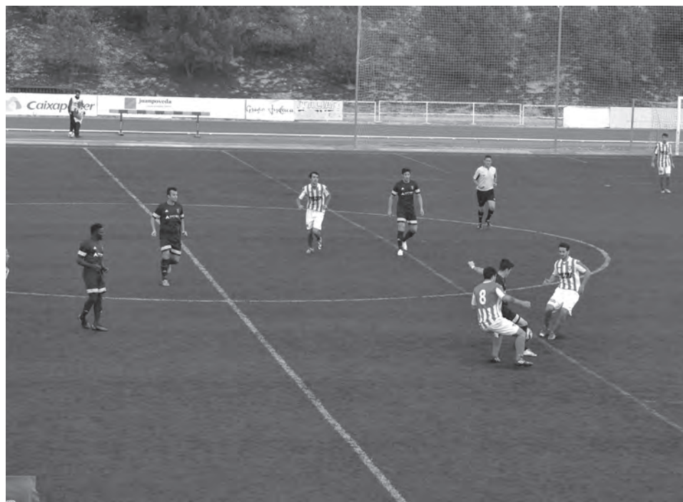
U.D. Petrelense-Horadada U.D.

Almoradí-U.D. Petrelense Domingo, 16 nov, 11:30h Campo (Nuevo Sadrián)