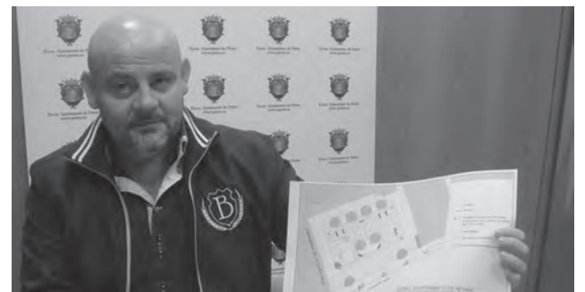
El concejal de Urbanismo mostrando el plano de las obras a realizar