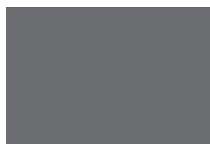
GRUPO PROVIDA DE PETRER ALICANTE

Se cumplen ahora cinco años de la marcha que un grupo aproximado de cien petrerenses emprendimos a Madrid un 17 de Octubre de 2009 para participar en la manifestación en defensa de la vida convocada por la Asociación Provida y el Foro de la Familia contra la regulación legal del aborto del PSOE que convertía el aborto en un derecho y facultaba a las niñas de dieciséis años a abortar sin necesidad del consentimiento de sus padres. Íbamos cargados de ilusión a unirnos a otro millón y medio de personas de toda España con el único objetivo de mostrarle al gobierno de aquel momento que la vida es lo más importante que tenemos y que hay que defenderla desde su inicio, en el mismo seno de la madre. Volvimos muy contentos porque nos sentíamos arropados por un Partido Popular, entonces en