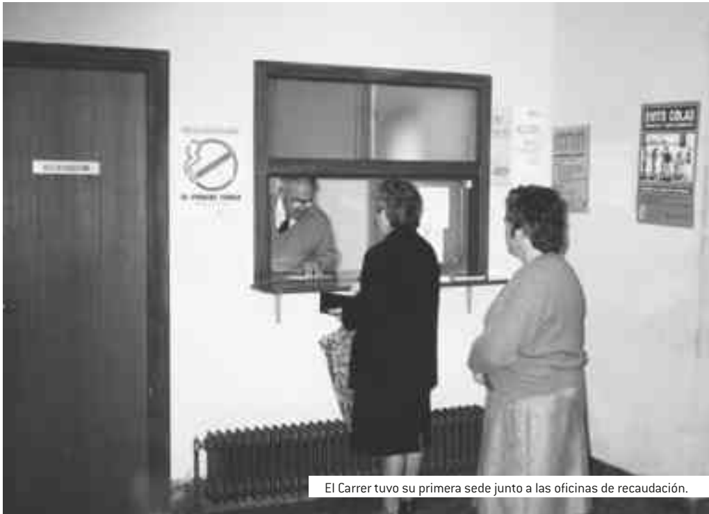
El Carrer tuvo su primera sede junto a las oficinas de recaudación.