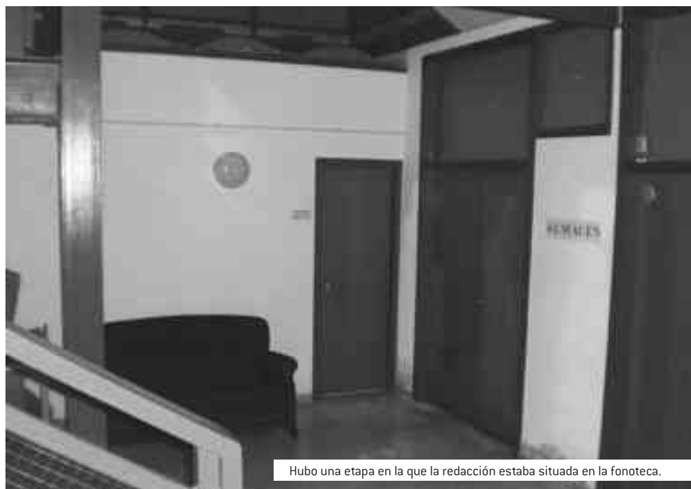
Hubo una etapa en la que la redacción estaba situada en la fonoteca.

Desde hace 20 años la redacción de “El Carrer” se encuentra en la avenida del Guirney ocupando una de las alas superiores -y parte de la inferior- del antiguo Cuartel de la Guardia Civil, junto a la Cruz Roja local. En el año 1994 era lo que se deseaba pero transcurrido el tiempo se demanda un lugar mucho más operativo y que ofrezca otra imagen más acorde con nuestros tiempos. Aseguran que todo llegará pero estos tiempos difíciles están dificultando un nuevo traslado.