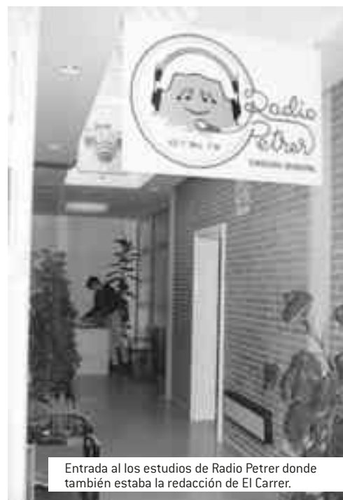
Entrada al los estudios de Radio Petrer donde también estaba la redacción de El Carrer.