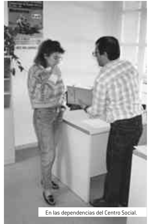
En las dependencias del Centro Social.