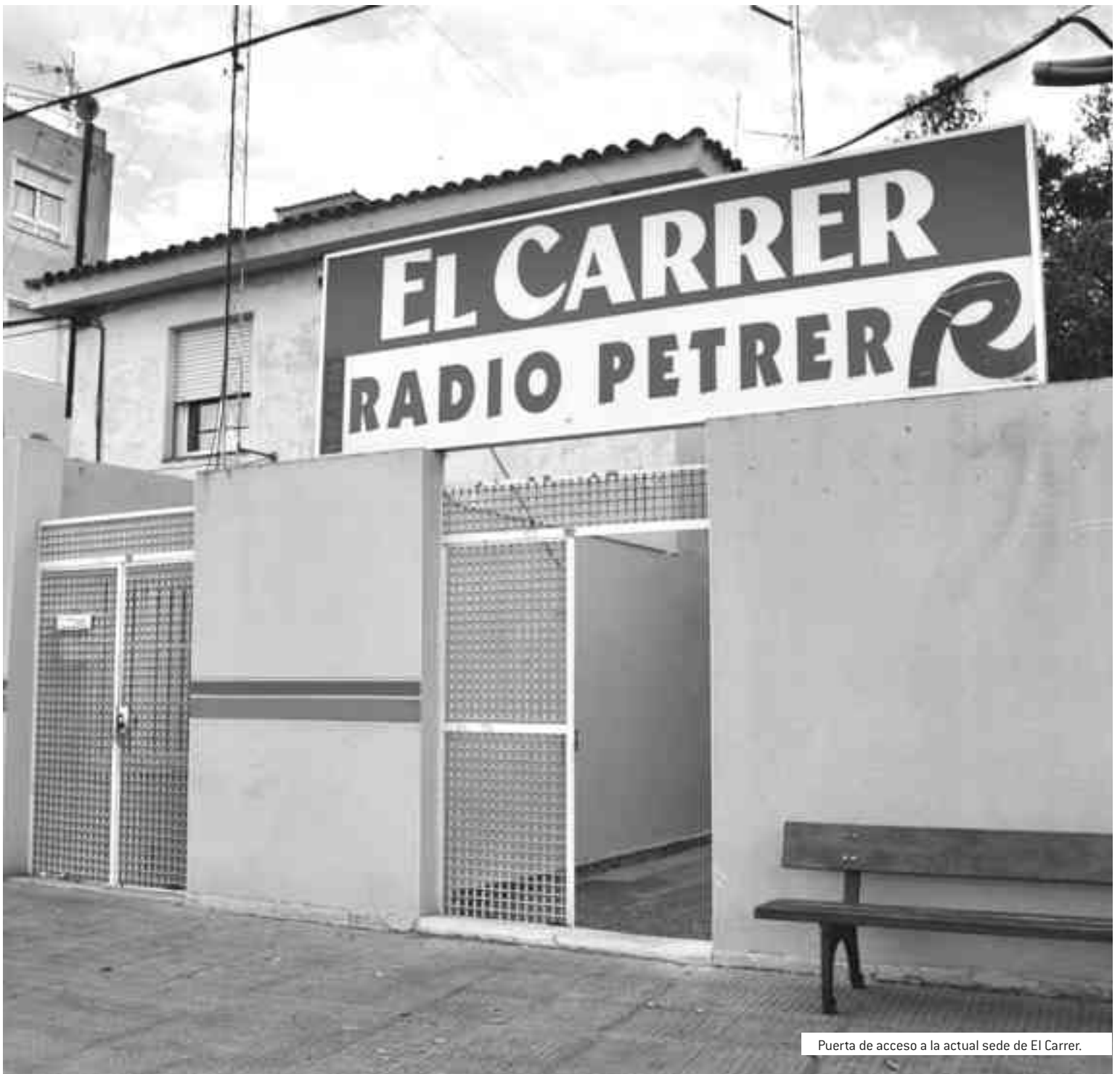
Puerta de acceso a la actual sede de El Carrer.