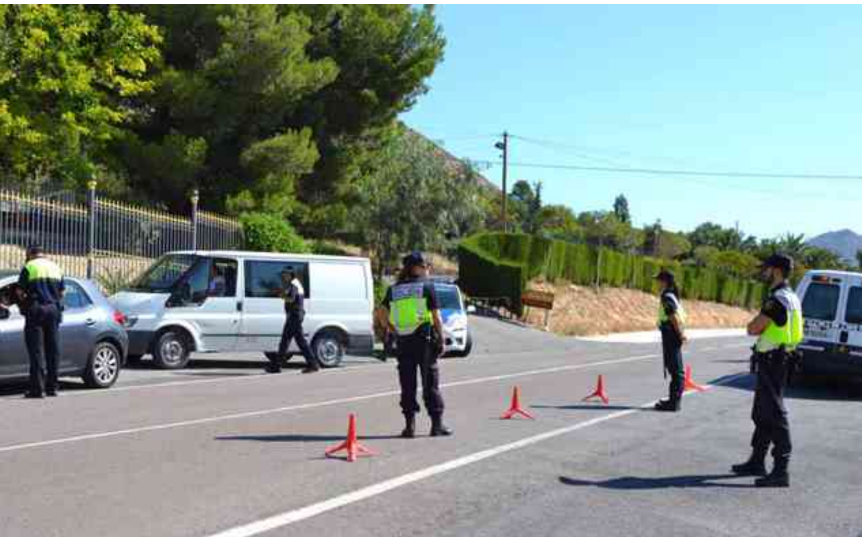
Control policial en Buenos Aires este miércoles