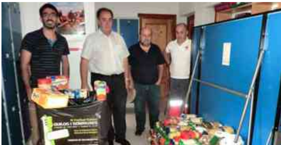
Alimentos recogidos en el Festival Solidario y entregados a Cruz Roja

Se recogieron 1.000 kilos de alimentos y 3.600 euros en metálico