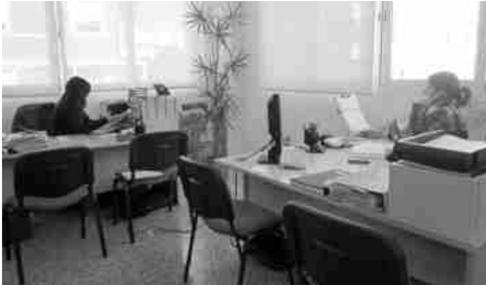
Imagen de archivo del servicio psicológico