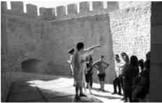
Unos vecinos de Petrer en el interior del Castillo