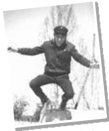
"Chaki" en la "Bassa Perico". Año 1968