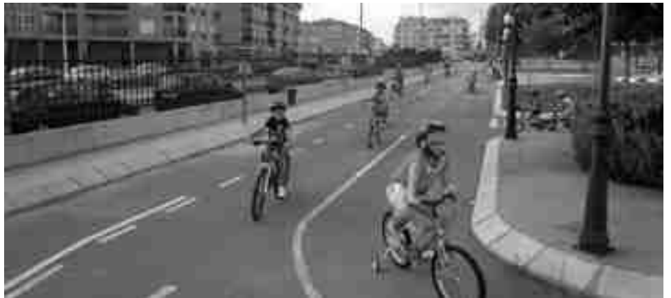
Actividad en el Parque Infantil de Tráfico relacionada con la Semana de la Movilidad organizada por Medio Ambiente

nizadas de forma conjunta por el BLOC y Los Verdes. La primera de ellas tuvo lugar el día 17, en la plaza del Ayuntamiento de Elda, donde se anunció las dos entidades premiadas en la primera convocatoria de los "premios 30km/h" que se concedían a la entidad más sostenible, en este caso a Renfe y Adif. El jueves 19 tuvo lugar en el Centro Municipal "Las Cerámicas" la proyección de dos documentales titulados "Lorca Biciudad en Amsterdam" y "Plan Integral de Movilidad Sostenible" y, finalmente, la instalación de una mesa informativa el pasado sábado día 21 en la avenida de Madrid en la que repartieron folletos explicando