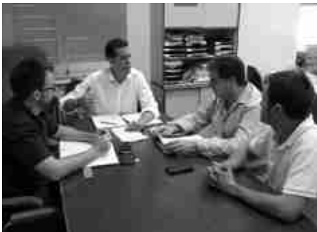
Reunión de concejales del PSOE de Petrer, Elda y Villena

Para el PSOE, ha matizado que, “sin lugar a dudas la eliminación de la lanzadera, se debe al excesivo tiempo que