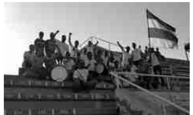
Imagen de la grada de El Barxell durante el último partido

El patrocinio de los partidos incluye una oferta especial para todas aquellas empresas que quieran participar. Consiste en la emisión de las cuñas publicitarias durante la retransmisión del partido a un coste de 60€ o bien cuatro cuñas diarias, de lunes a viernes, y durante los partidos por 120€. ●