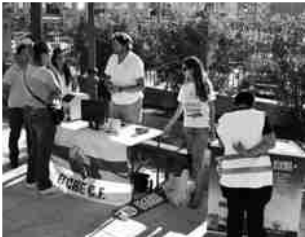
Tour de la Ilusión

Posteriormente, se realizó el concurso "Estrella por un Día" en el que los ganadores obtuvieron como premios la posibilidad de disfrutar de un día de convivencia junto a los jugadores y equipo técnico de la