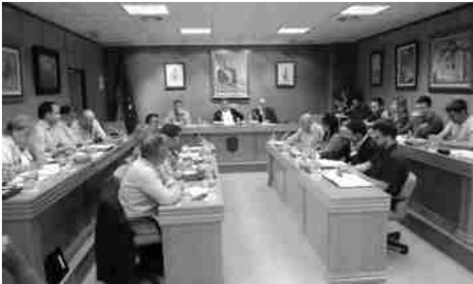
Imagen de archivo. Gobierno y oposición durante una sesión plenaria en el Ayuntamiento de Petrer