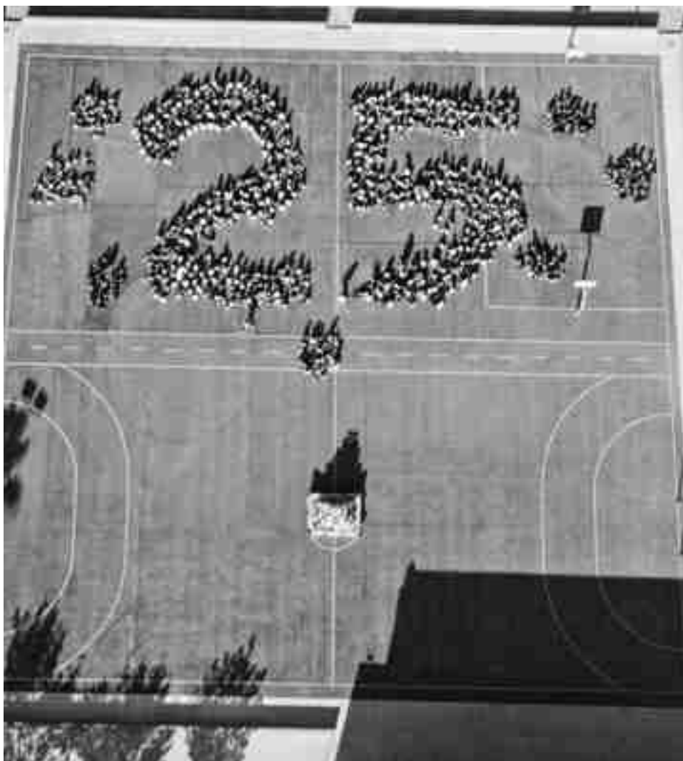
El alumnado y profesorado del centro formaron el número 25 en la pista deportiva para la fotografía aérea

También se espera con gran expectación la cena de antiguos alumnos del 8 de noviembre. En definitiva, unos meses de intensa y nostálgica celebración. ●