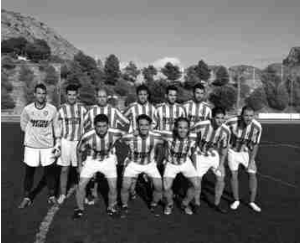
Formación de la U.D. Petrelense el pasado sábado

En la primera mitad hubo poco fútbol y contadas ocasiones. El filial herculano tiene un equipo joven que deja jugar y eso favorece a un conjunto como el rojiblanco que no sabe