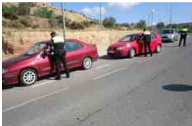
Dispositivo de control del uso del cinturón en la zona de "El Guirney"