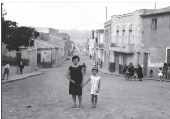
AÑO 1962 Imagen de la calle Leopoldo Pardines sin tráfico ni vehículos estacionados.