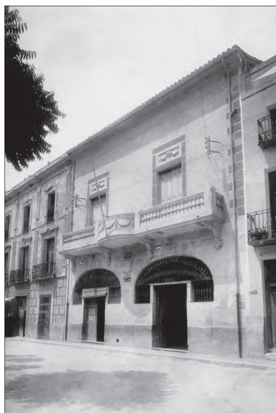
AÑO 1935 Fachada del antiguo Ayuntamiento justo antes de estallar la Guerra Civil.