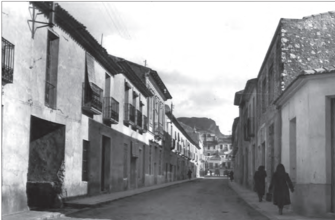
AÑO 1964 Calle Gabriel Payá. A mano izquierda, el pasaje de Amelia y a la derecha el garaje de "La Noveldense"