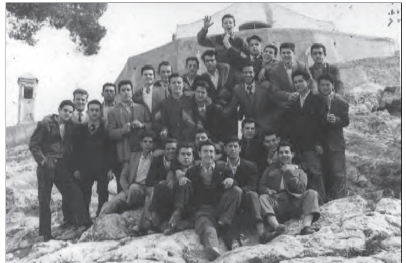
AÑO 1958 7. Los quintos, entre la ermita de San Bonifacio y la del Cristo, después de presentarse en el cuartel de la Guardia Civil