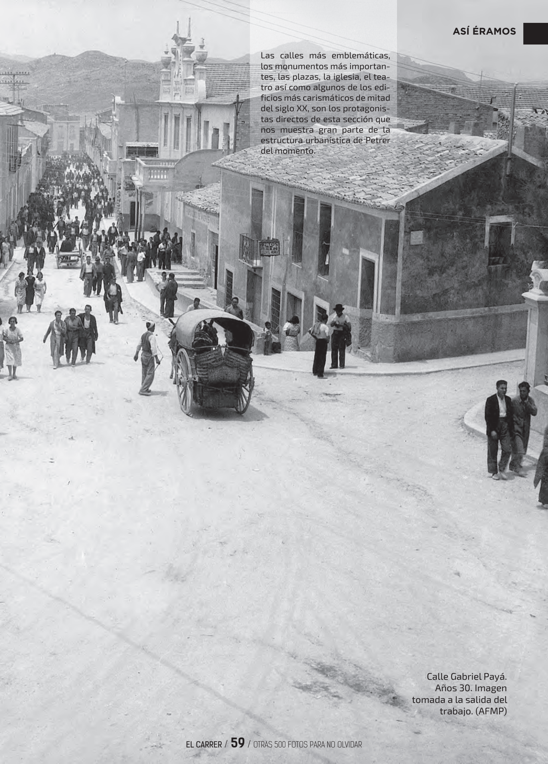
Calle Gabriel Payá. Años 30. Imagen tomada a la salida del trabajo.

Las calles más emblemáticas, los monumentos más importantes, las plazas, la iglesia, el teatro así como algunos de los edificios más carismáticos de mitad del siglo XX, son los protagonistas directos de esta sección que nos muestra gran parte de la estructura urbanística de Petrer del momento.