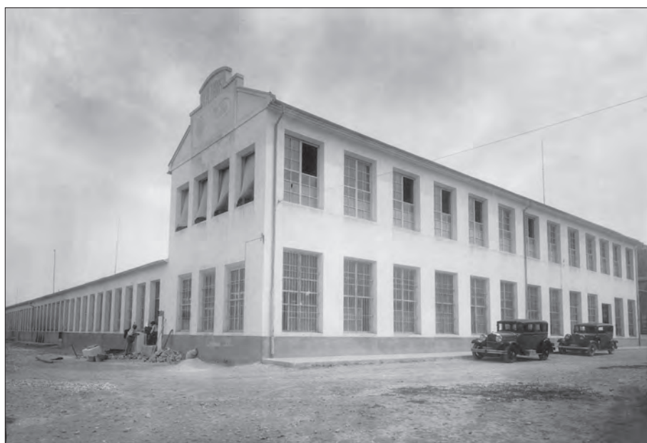
AÑO 1935 Fábrica de Calzados Luvi. Se aprecia a unos albañiles realizando obras.