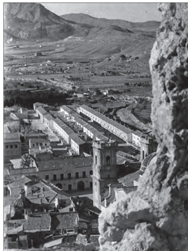
AÑOS 60 Vista de las viviendas sociales desde la ladera de el castillo.