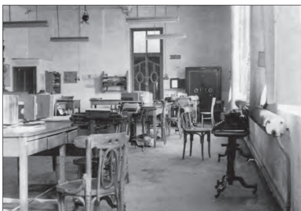
AÑO 1965 Interior de la oficina del Calzados Luvi.