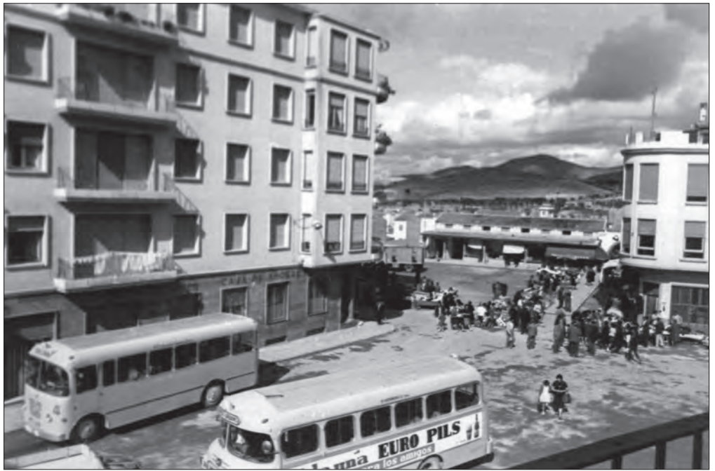
AÑO 1964 El Derrocat, donde se observan los autobuses de línea "El Amarillo" y "El Azul".