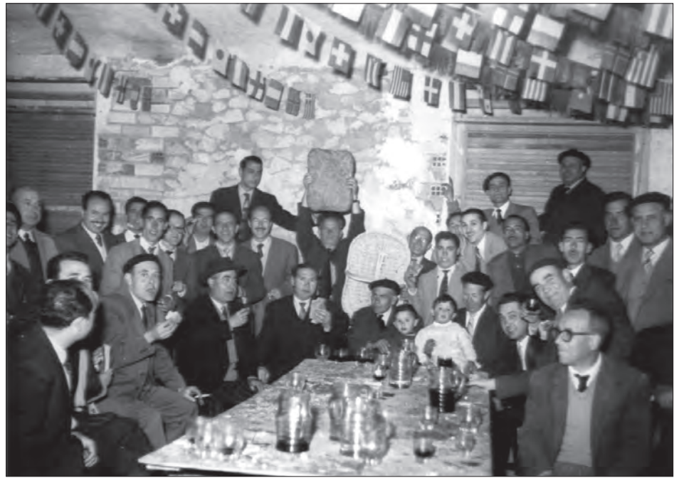
29 DE MARZO DE 1956 La Coca de los Moros Viejos