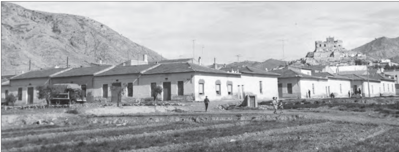
AÑOS 60 Calle Pintor Vicente Poveda y los bancales donde se iniciaba la senda que conducía al instituto Azorín, actualmente la calle Virrey Poveda.