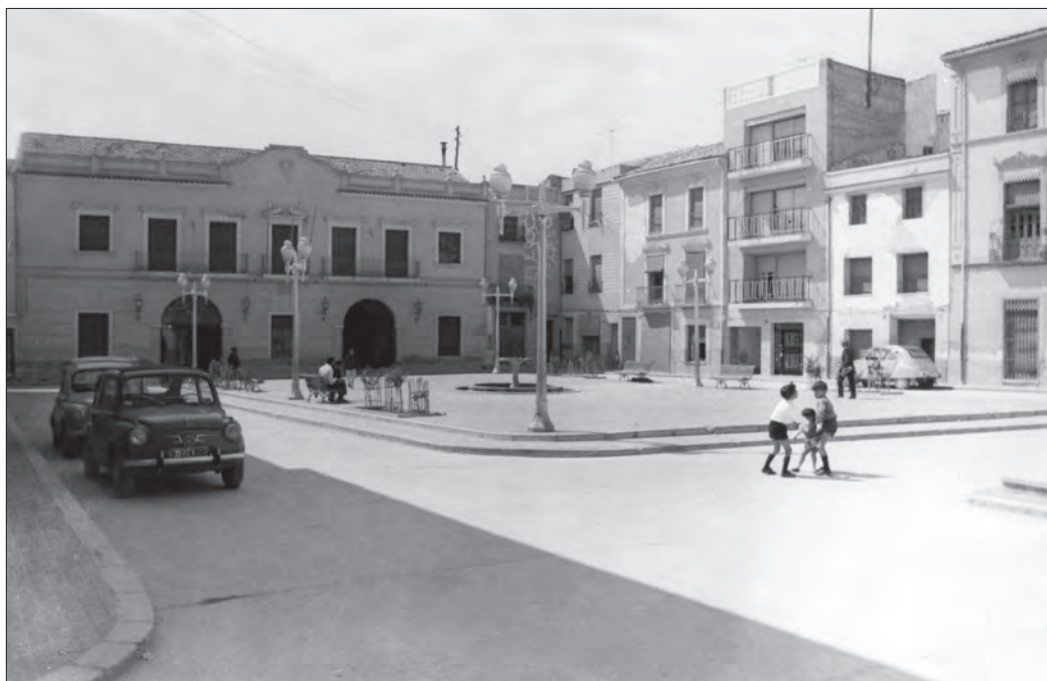
AÑOS 60 La plaça de Baix. Al fondo, el ayuntamiento.