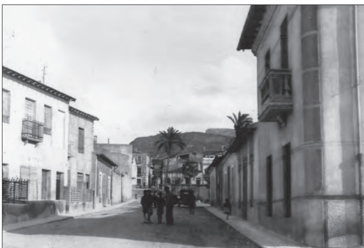
AÑO 1964 Calle Leopoldo Pardines. Foto tomada desde el chalet de "los Chicos"