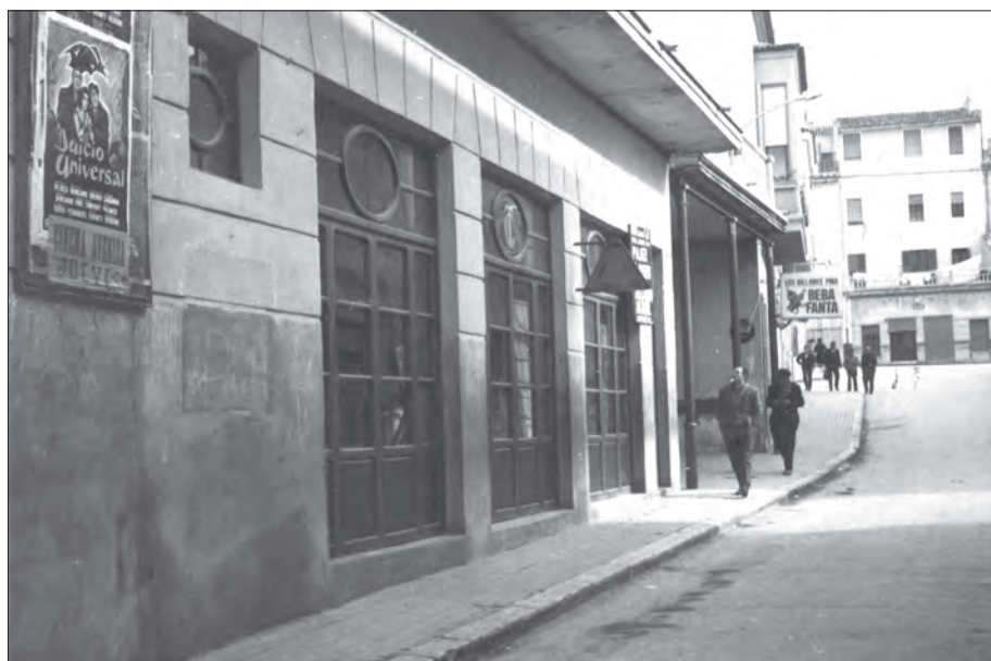
AÑO 1965 Calle Gabriel Payá, a la izquierda la fachada del Teatro Cervantes.