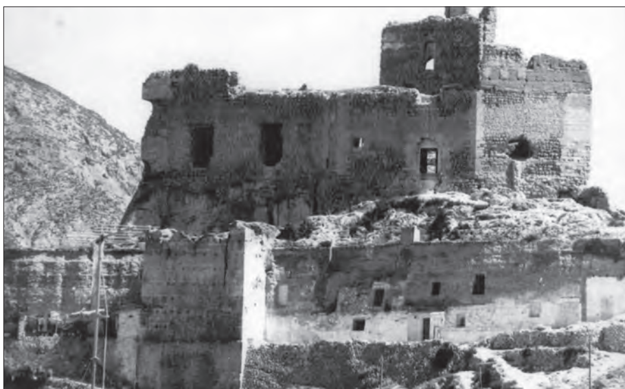
AÑO 1971 Primeros planos del Castillo