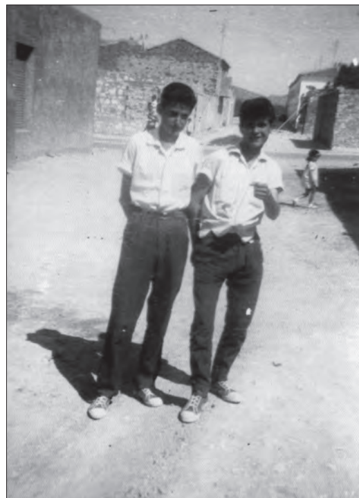
AÑO 1960 En la calle Monóvar. Avenida de Elda Joaquín y Liberto