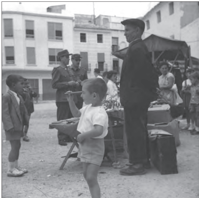
AÑO 1964 Puestos ambulantes en el Derrocat. Se instalaban los días próximos a las fiestas Patronales.