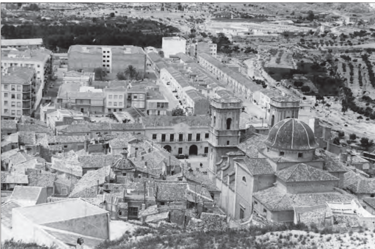
AÑOS 60 Vista desde el castillo de la Plaça de Baix y calles adyacentes. Fotografía: José Esteve

Tramo de la antigua carretera a su paso por la Noguera con el caserío de Santa Bárbara al fondo. Fotografía: José Esteve