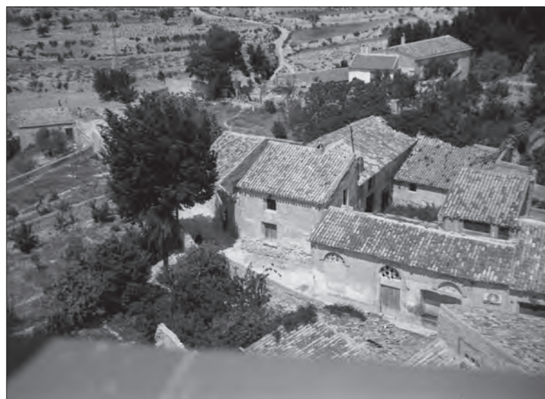
AÑO 1966 Vista cenital tomada desde la torre de la Iglesia de San Bartolomé de la Calle La Fuente.