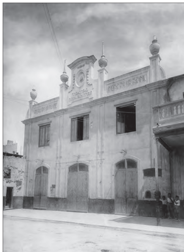
AÑO 1935 Fachada del Teatro Cervantes. A la derecha, junto a las taquillas, dos niños de la época esperando.