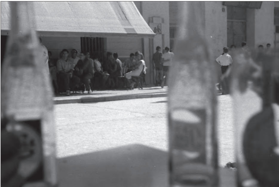
AÑO 1966 Terraza del bar "Chico la Blusa" en el paseo de la Explanada, un domingo de aperitivos.