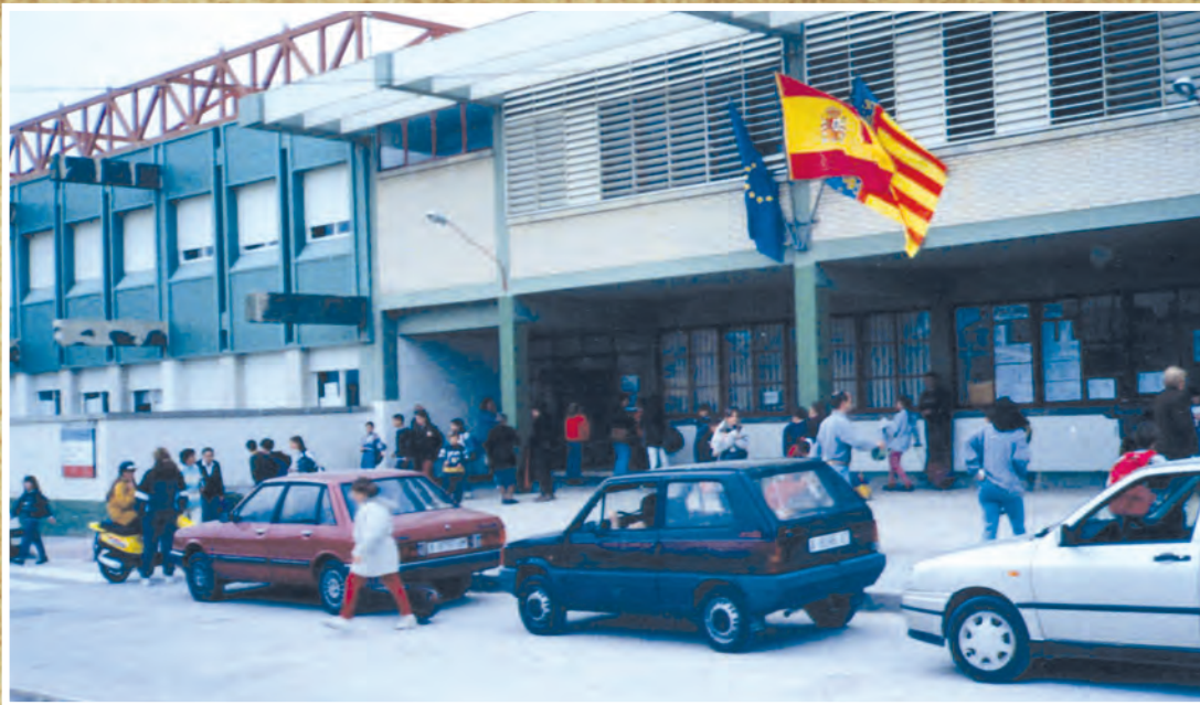
Any 2001. Entrada d'alumnes al col·legi Reis Catòlics el primer dia del curs.