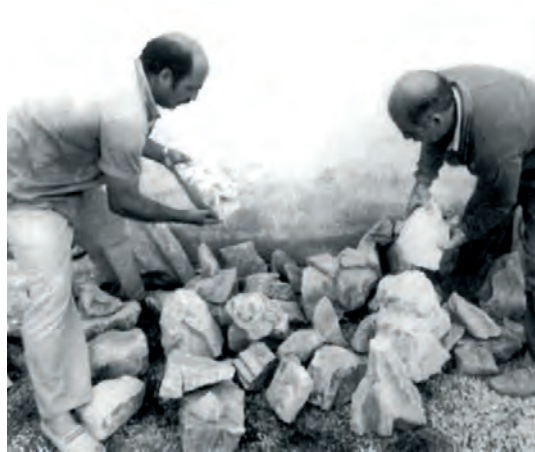
Restos de las esculturas de los santos identificadas a mediados de los años ochenta