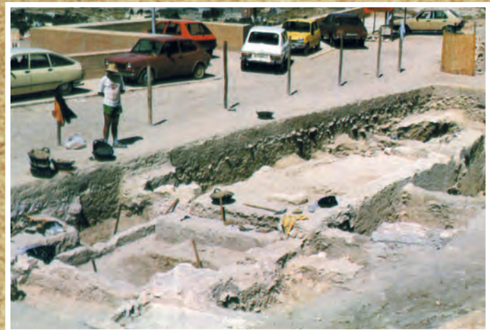
Any 1988. Excavacions arqueològiques en l'Esplanada del Castell