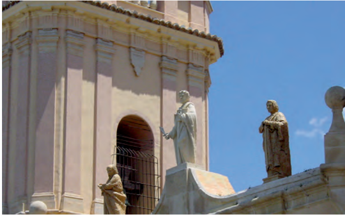
Detalle de las esculturas de los santos San Pedro, San Bartolomé y San Pablo