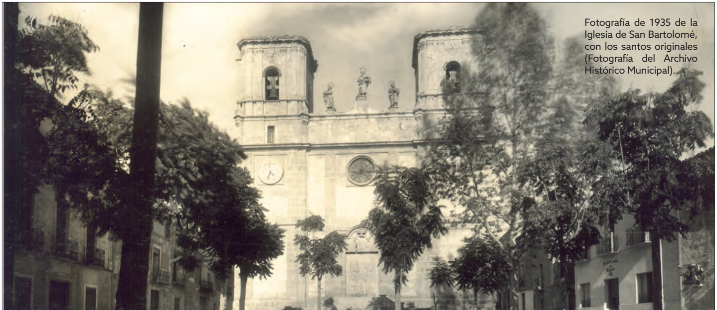
Fotografía de 1935 de la Iglesia de San Bartolomé, con los santos originales.

E sta semana, coincidiendo con la celebración de San Pedro y San Pablo, el Museo propone situarnos en la plaza de Baix, frente a la fachada principal de la iglesia parroquial. Allí levantaremos la cabeza hacia la parte superior de la misma para ver las estatuas de estos santos flanqueando a San Bartolomé, apóstol al que está dedicado el templo.