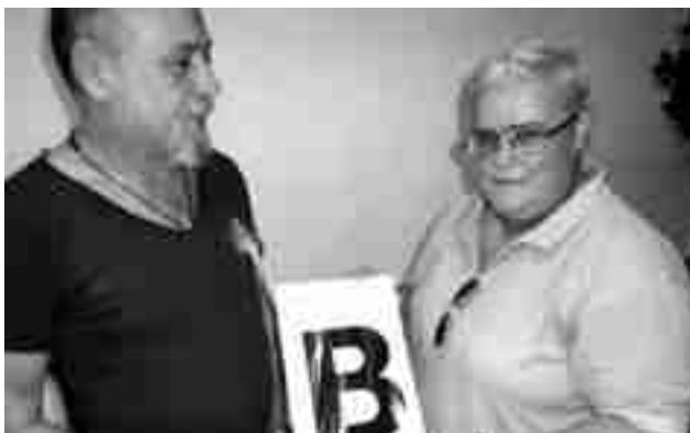
Placas que deberán de colocarse en las fachadas de los cuartelillos