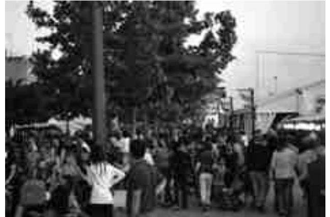
Feria de Turismo de Interior de Villena

con la Policía Nacional, entre ellas Cruz Roja de Petrer. La primera autoridad municipal aprovechó el Día de los Ángeles Custodios para agradecer "la grandísima labor que realizan los Cuerpos y Fuerzas de Seguridad por todos los ciudadanos. Velan por nosotros y nuestras familias arriesgando sus propias vidas. Gracias a ellos nos sentimos más seguros y tranquilos, por lo que en nombre de todo el pueblo de Petrer y también el de Elda, gracias por vuestra enorme labor". ●