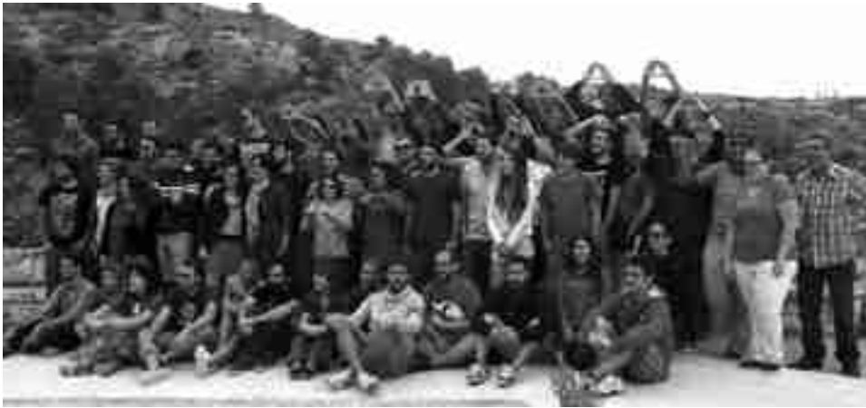
Foto de familia de los jóvenes que asistieron a la Escuela de Formación, en la Finca Ferrusa