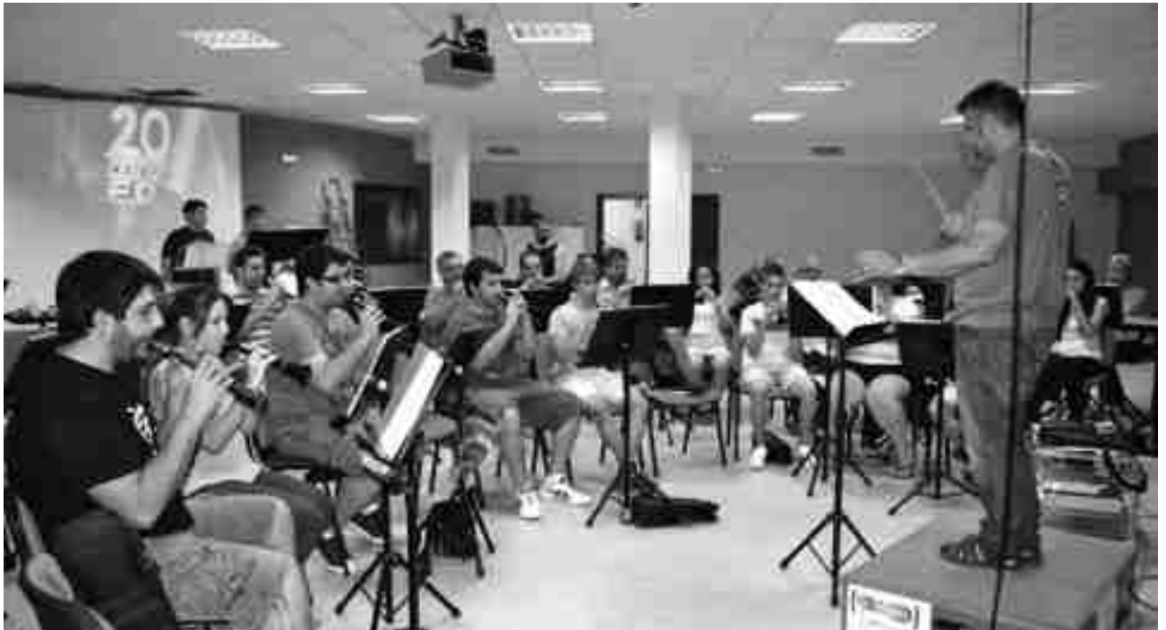
Sala de Ensayo de la "Escola de Música Tradicional i Dansa"