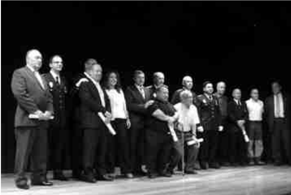
Acto de entrega de condecoraciones al Mérito Policial y reconocimientos a colectivos que colaboran con la Policía Nacional