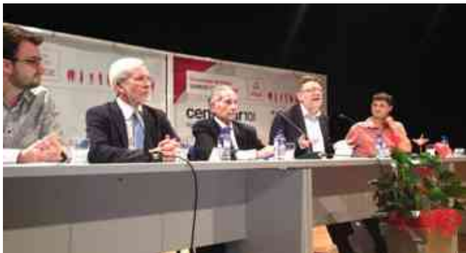
El ex alcalde y los invitados al homenaje durante durante la celebración del acto