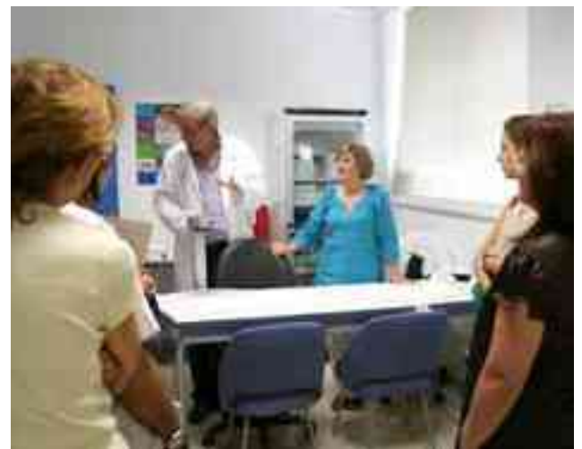
Curso de Patología Alérgica impartido en el Hospital General Universitario

Horario de atención: De lunes a jueves de 11:00 a 14:30 horas. A partir del 1 de octubre: de 11:00 a 14:30 y de 17:00 a 20:00 horas.