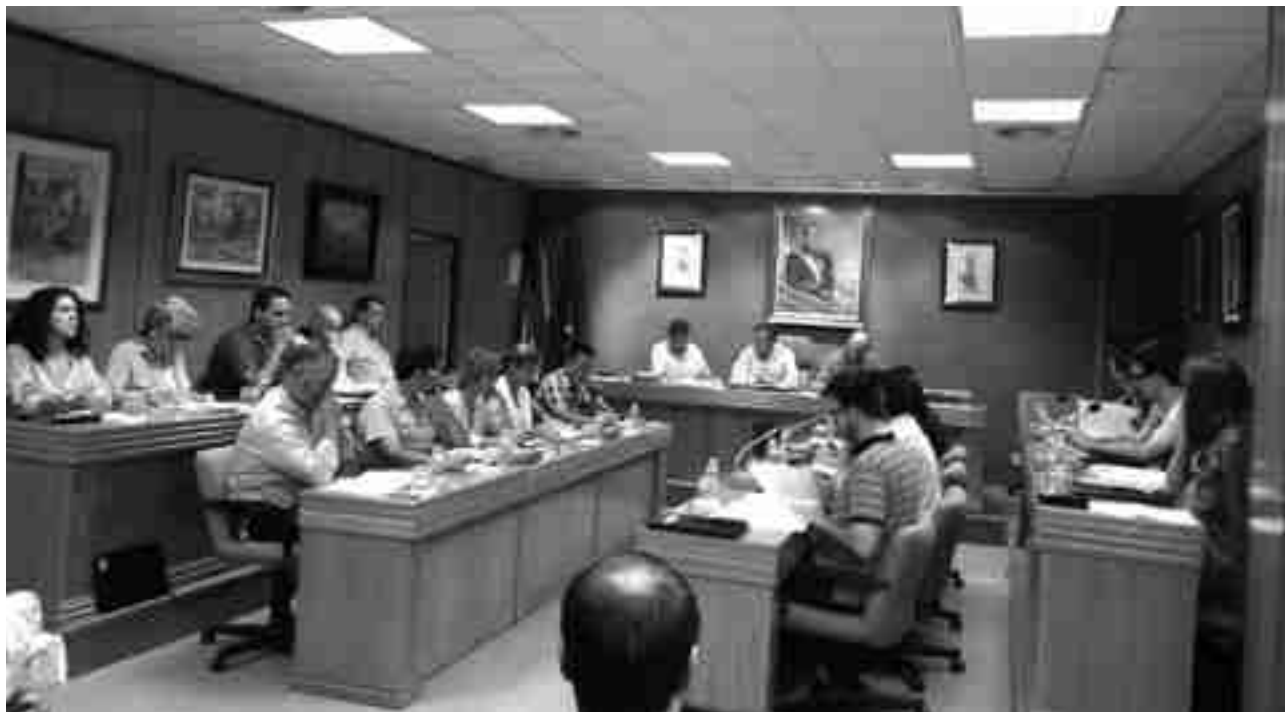
Imagen tomada durante la sesión plenaria del pasado jueves