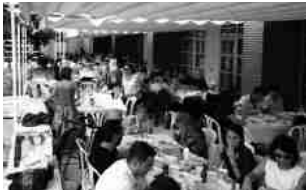
Jornada de Convivencia con motivo del X Aniversario de "La Molineta"

Está previsto para el 26 de octubre la celebración una Eucaristía en recuerdo de