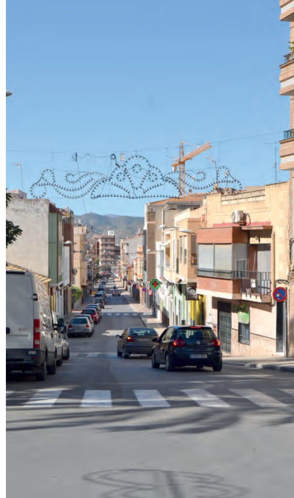
calle Leopoldo Pardines