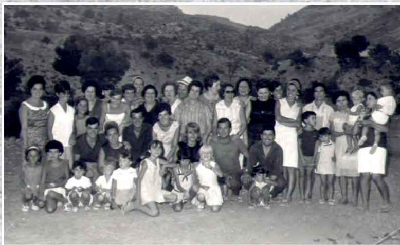
Any 1967 Veïns de la partida de Caprala