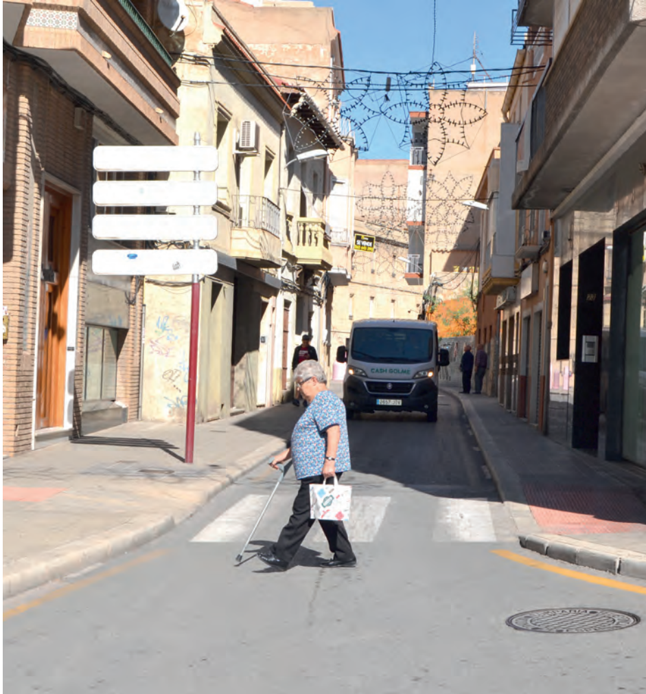
calle José Perseguer