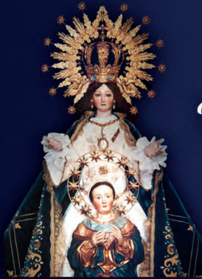
Virgen de la Esperanza