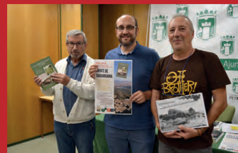
FALLECIDOS EN LA GUERRA CIVIL, HOMENAJEADOS EN GUADARRAMA