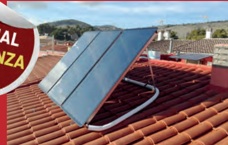
LAS PLACAS SOLARES BONIFICARÁN EL IBI HASTA UN 30%