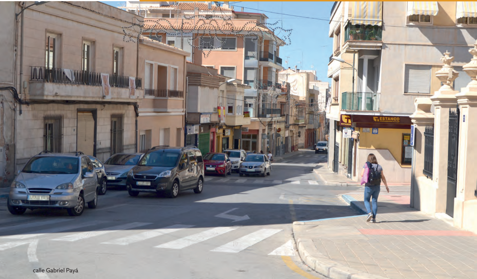
calle Gabriel Payá