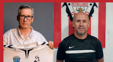
H. PETRER Y UD. PETRELENSE, SE QUEDAN SIN ENTRENADOR