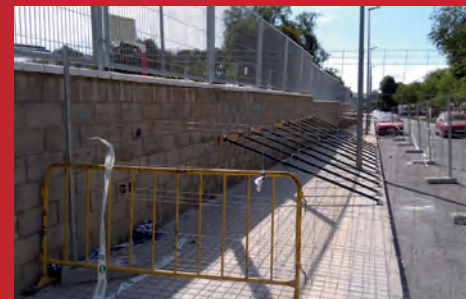
C'S PIDE EL ARREGLO DEL MURO DEL COLEGIO VIRREY POVEDA