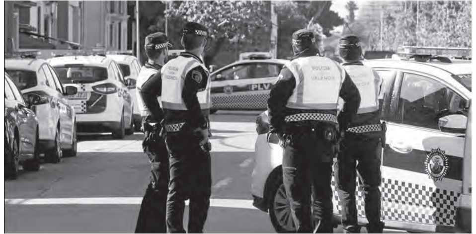
Imagen de algunos miembros de la Policía Local de Valencia

Los Cuerpos de Policía local de todo el Estado español no han podido escapar a este extendido proceso y, de este modo, han encontrado una vía en él para lograr mantener, en ocasiones a marchas forzadas, sus efectivos por encima de la línea de flotación, en detrimento, las más de las veces, de la calidad del servicio público a prestar, pues no conviene olvidar que el interino suele estar mínimamente formado y ni tan siquiera ha pasado por la academia de policía y, en consecuencia, se duda de su cualificación y competencia para la prestación de determinados servicios y actuaciones, sobre todo aquellas que comportan un claro ejercicio de autoridad (uso de armas, detenciones, sanciones, vb.) o que puedan afectar al ejercicio de derechos básicos de la persona.