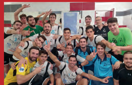
HISPANITAS PETRER RECIBE A ELDA EN UN DERBY CALIENTE