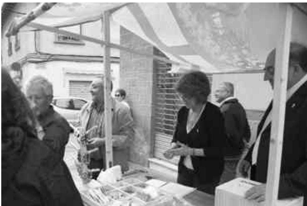
Como cada domingo del Desfile Infantil el Carrito de la Mayordomía de San Bonifacio saldrá a la calle

Desde la Mayordomía de San Bonifacio se recuerda que todo lo que se recauda con la venta de estos artículos se destina al mantenimiento y conservación de la imagen del Santo Patrón y de su ermita. ●