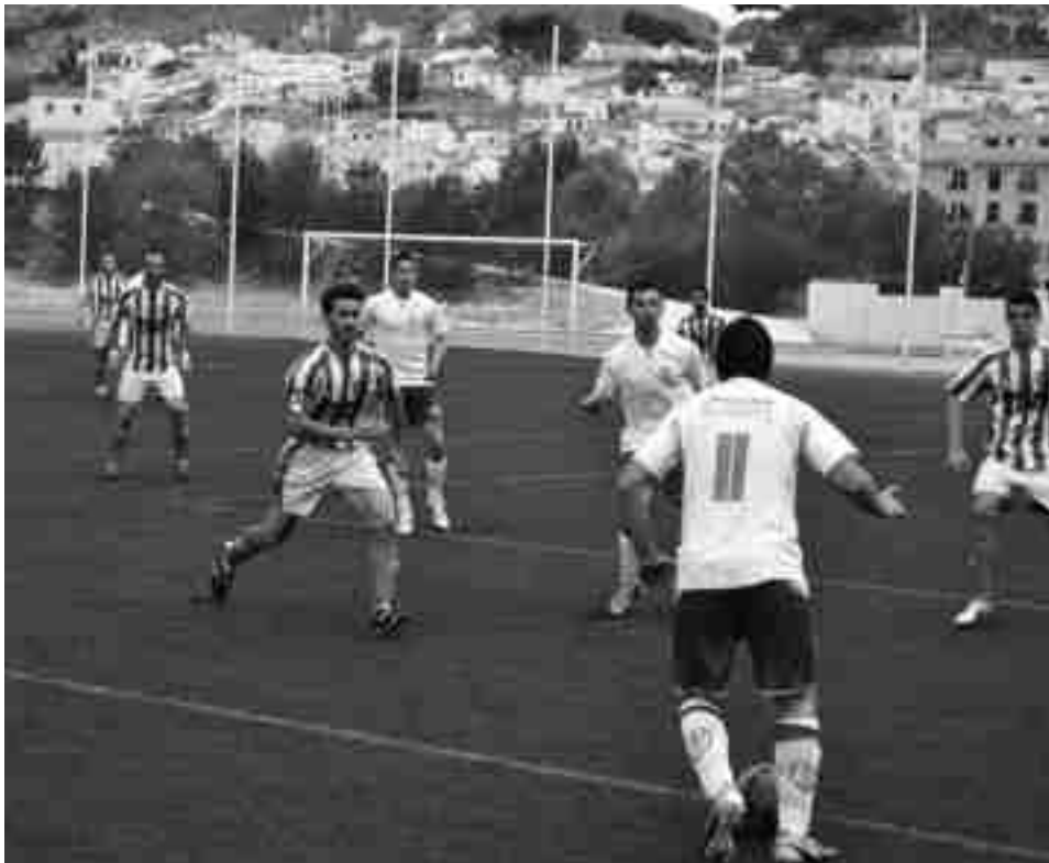
El Petrelense atraviesa un buen momento