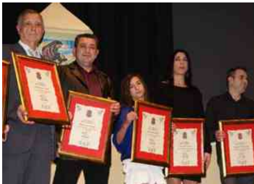
Cargos festeros de años atrás de la comparsa Moros Beduinos durante el homenaje del cincuentenario