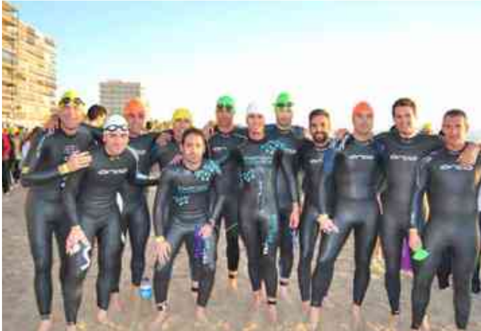
Triatletas del CN Petrer-la Villa

El día fue excelente para la práctica de este deporte, con sol y sin demasiado viento para el segmento de la bicicleta. A primera hora se dio la salida a la categoría élite y, a partir de ahí, de cinco en cinco minutos, el resto de las diferentes categorías. Todos los triatletas de Petrer pudieron termi-