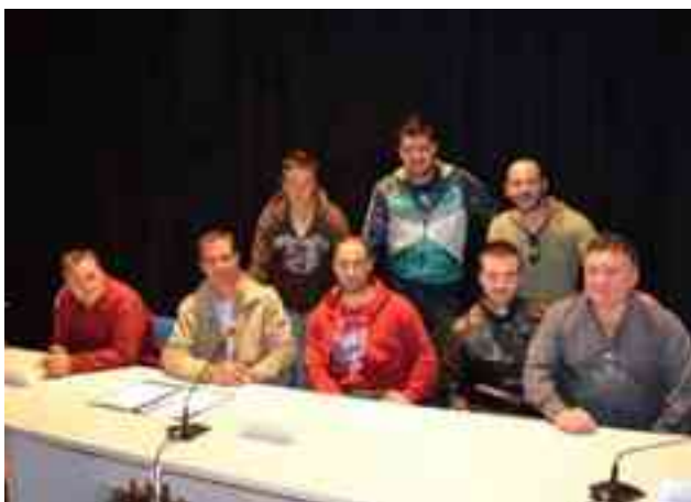
Junta Directiva del Club Fútbol Base Petrer junto a los técnicos

Nosotros hemos coincidido con la U.D. Petrelense en la nomenclatura. En lo deportivo nosotros llevábamos unas edades y ellos, a partir de infantiles, recogían a los niños, nosotros fútbol 8 y ellos fútbol 11. Hemos funcionado con todas las directivas sin ningún problema porque nos hemos beneficiado ambas partes. Ahora, la directiva actual quiere coger la escuela y no nos parece bien que por tener el mismo nombre sea de ellos. Somos un club paralelo y hemos venido trabajando así durante veinte años. No queremos separar-