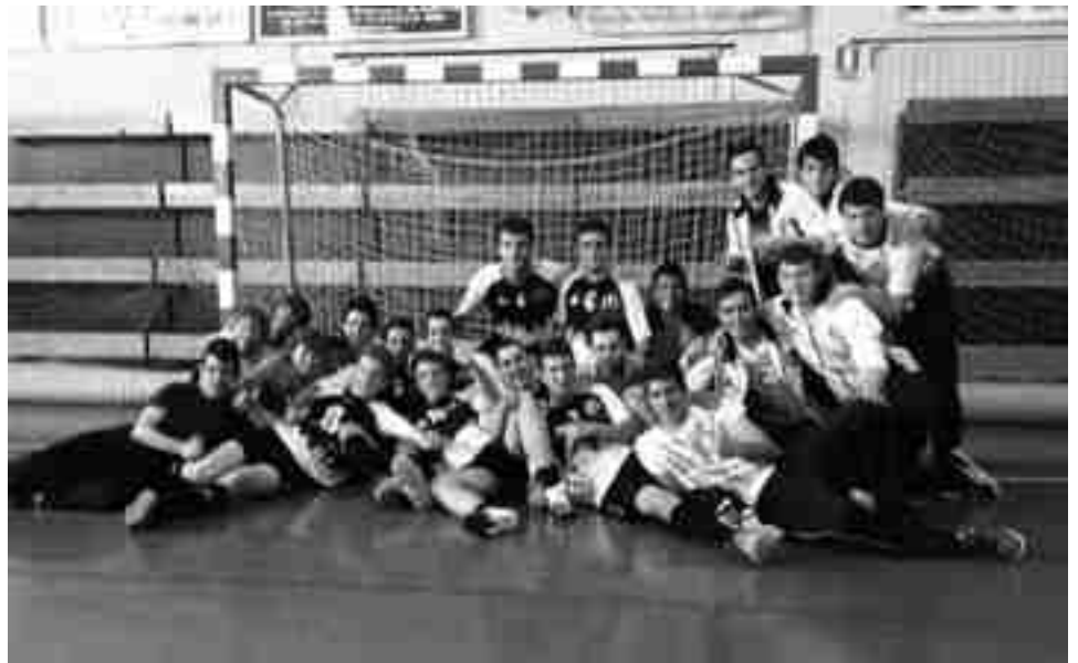
FS Petrer juvenil tras clasificarse para la final