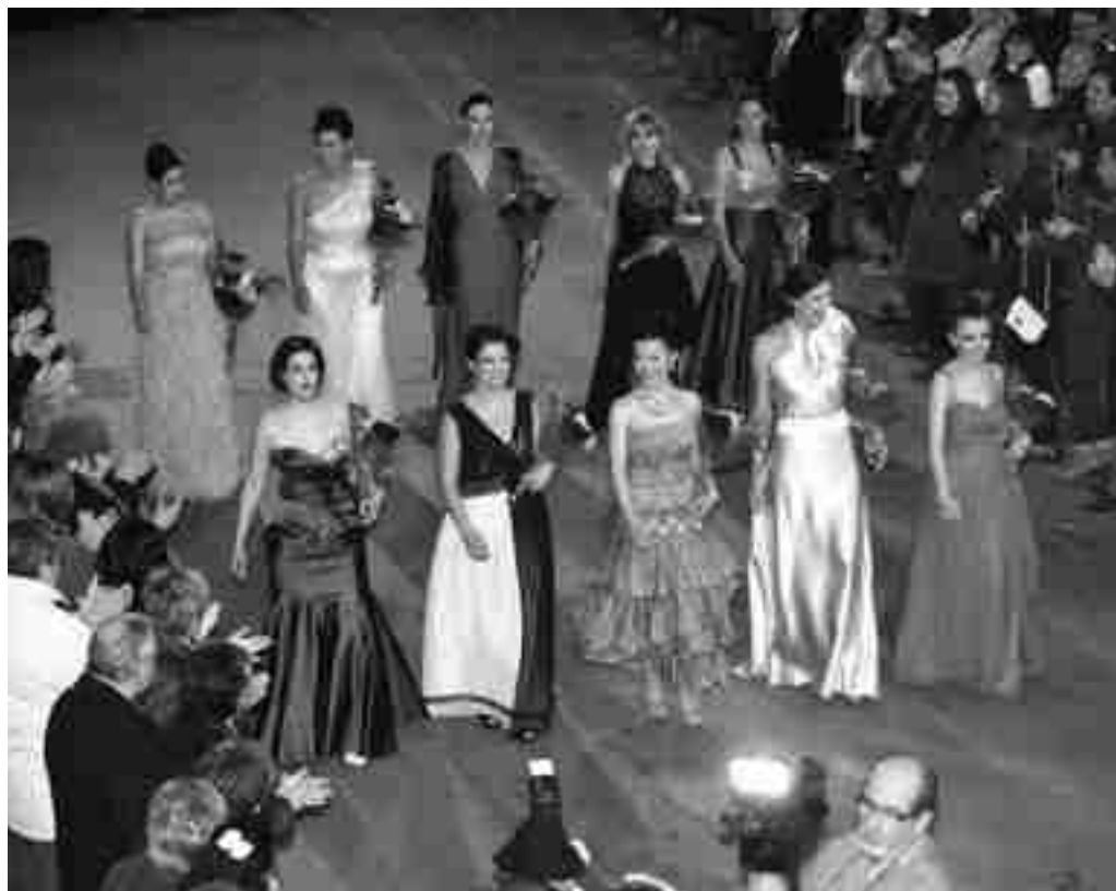
Las abanderadas de las fiestas de Moros y Cristianos de 2013 llegando al Teatro Cervantes