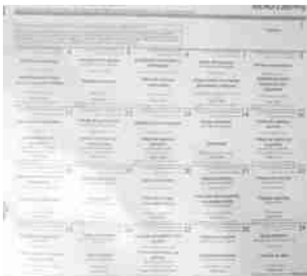
Menú escolar del mes de noviembre que IRCO está ofreciendo en "Reina Sofía"

que hablan del preocupante crecimiento de la desnutrición infantil debido a la situación difícil y complicada de las familias, de momento, no es extrapolable a Petrer aunque sí hay casos puntuales, de menores con familias problemáticas que