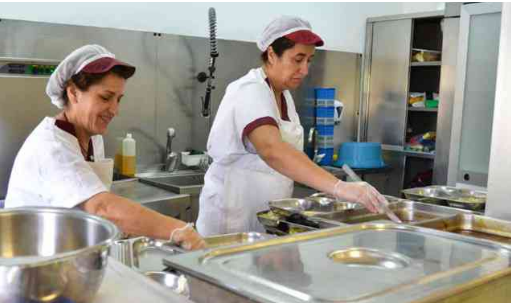
El comedor del Colegio "Reina Sofía" es el que más usuarios tiene en estos momentos

La convocatoria de becas de comedor escolar estuvo salpicada de dudas cuando se inició el nuevo curso, no obstante, la convocatoria llegó y la demanda ha crecido en la mayoría de colegios. A día de hoy, y según los datos facilitados por los propios centros, los comedores escolares atendidos por las empresas IRCO y ANDOVER, S.L., sirven comidas a un total de 1.294 menores frente a los 1.165 del curso pasado. En el Colegio "Reyes Católicos" hay 277 frente a los 240 de 2012, en "9 d'Octubre" hay actualmente 240 mientras que el curso pasado la cifra fue sensiblemente inferior, alrededor de 235. En el Colegio "La Foia" están haciendo uso del comedor