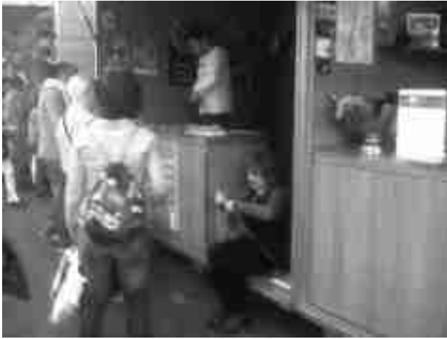
Imagen de la caseta en la Fira de Tots Sants de Cocentaina