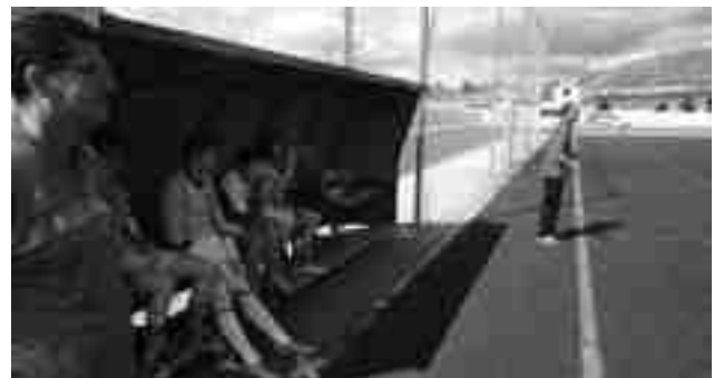
Banquillo del juvenil