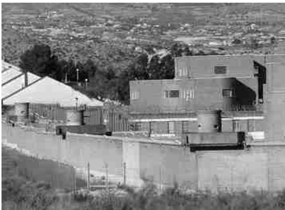
Prisión de Fontcalent en Alicante donde ha ingresado el presunto autor de las ocho agresiones

La Policía Nacional ha detenido a un individuo de 26 años, vecino de Elda, como presunto autor de al menos ocho agresiones sexuales perpetradas todas ellas en nuestra localidad entre los meses de octubre de 2012 y septiembre de 2013. Las víctimas eran todas mujeres jóvenes de entre 17 y 21 años a las que, aprovechando la noche, el autor seguía hasta que entraban en sus respectivos portales y una vez allí, las