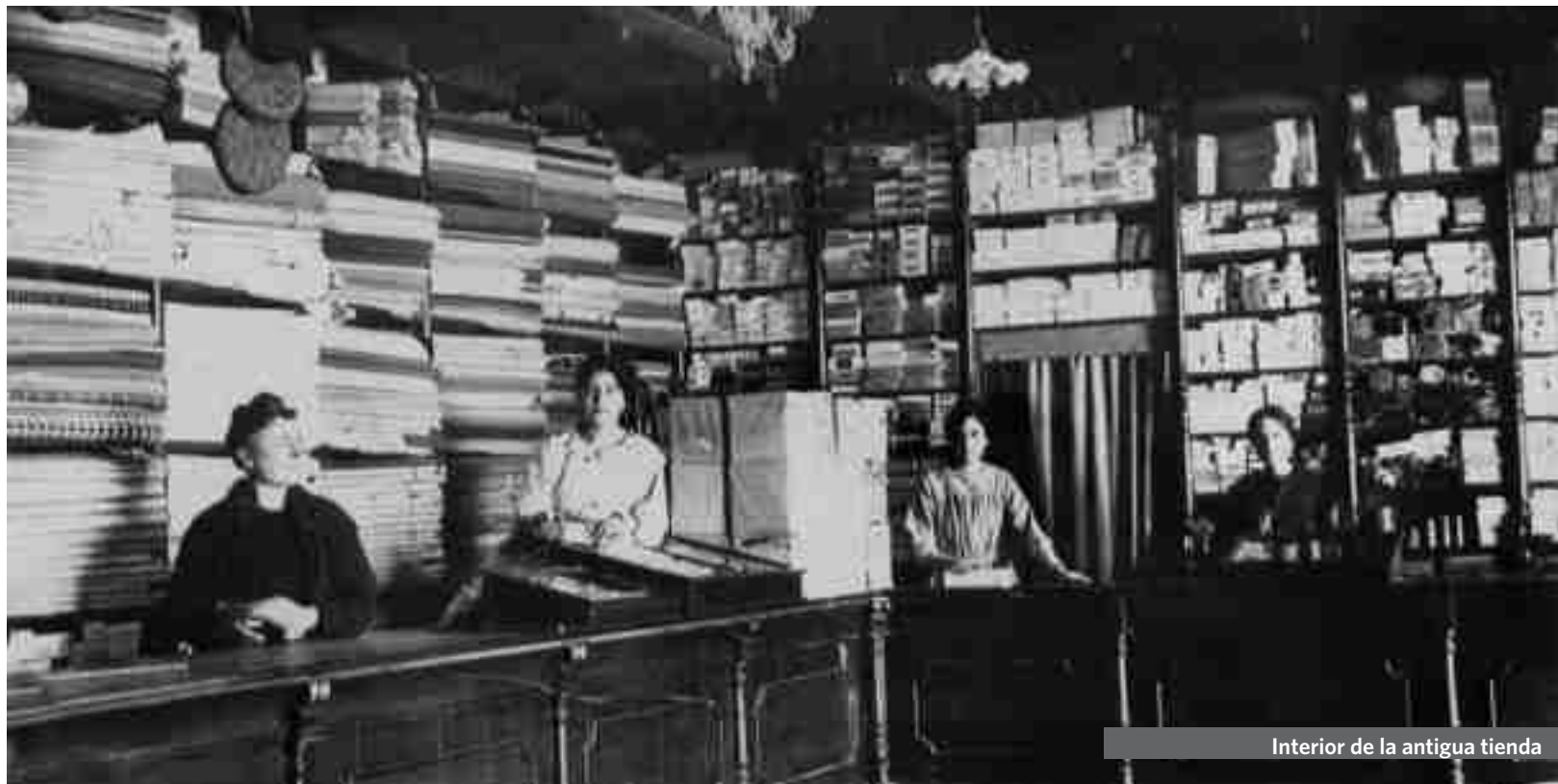
Interior de la antigua tienda

José Carretero Peña publicidad@radiopetrer.es