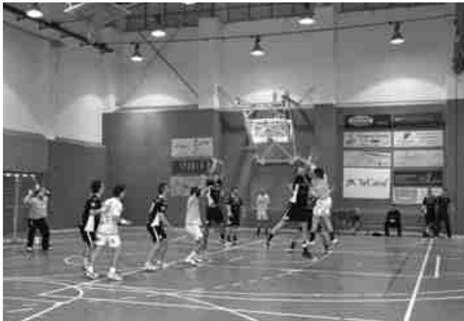
Hispanitas Petrer defiende un ataque de Sant Joan

La segunda derrota casera del Hispanitas Petrer duele más que la primera. En aquella ocasión era contra el líder invicto y en esta se perdió ante un rival directo en la lucha por la permanencia. Al UCAM Sant Joan se le había ganado en los dos compromisos de pretem-