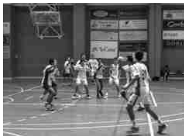
Hispanitas Petrer infantil A masculino

Este sábado se disputa el derbi local interno entre el cadete A y el cadete B masculino