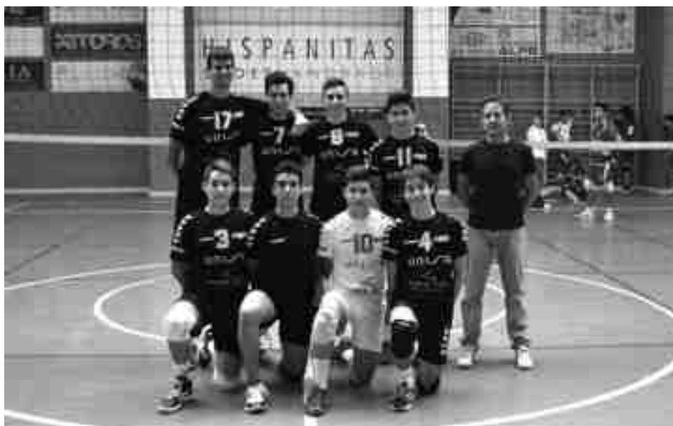
SDVP juvenil masculino

El equipo senior de SDVP continúa sin conocer la victoria en este arranque liguero de 1ª Nacional. El pasado fin de semana disputó dos partidos y en ambos acabó cediendo de manera muy clara. En el primer envite, disputado en la pista del CV Cieza, se perdió por 3-1 (22-25; 25-21; 25-18; 25-17) y eso que se comenzó jugando bien y ganando el primer set. Después desapareció de la pista y cedió los siguientes sin tener opción de victoria. En el segundo partido adelantado de la cuarta jornada y disputado en Petrer contra el CV Tarragona