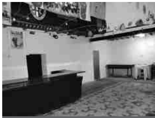
Estado actual del interior del establecimiento