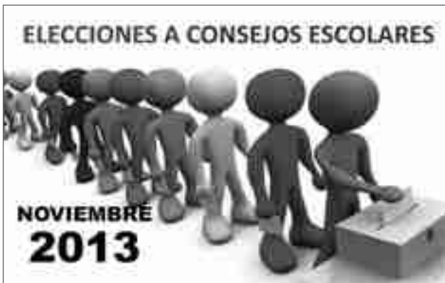
Imagen de archivo. Elecciones al Consejo Escolar, en un centro público

Ha recordado que este órgano de funcionamiento está formado por profesores, alumnos, padres y personal administrativo del centro por lo que están convocados todos ellos a ejercer su derecho al voto. Asimismo, ha matizado que tanto el padre como la madre de los escolares tienen derecho a votar. Además, ha explicado