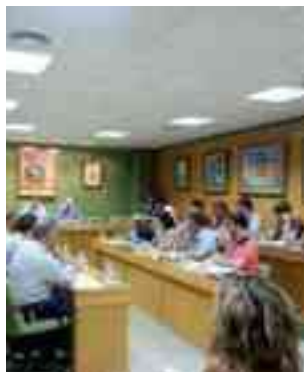
Imagen de archivo. Sesión plenaria en el Ayuntamiento de Petrer

Se aprueba una modificación para amortizar deuda