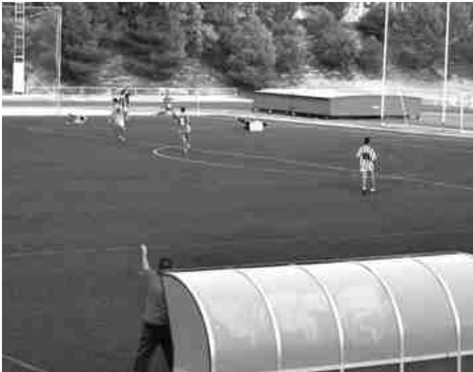
Campello dando instrucciones

Alicante-U.D. Petrelense domingo, 10 nov, 16:30h Campo (Villafranqueza)