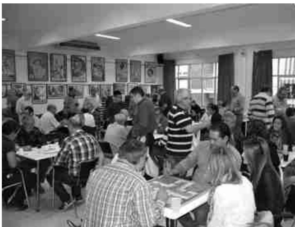
Campeonato de Juegos de Mesa organizado por la Unión de Festejos coincidiendo con el "Mig Any Fester"

Una muestra que se inaugura este viernes, 8 de noviembre, a las siete de la tarde en el Museo de la Fiesta, ubicado en la Plazoleta Ramón y Cajal a espaldas de la Iglesia de San Bartolomé, y