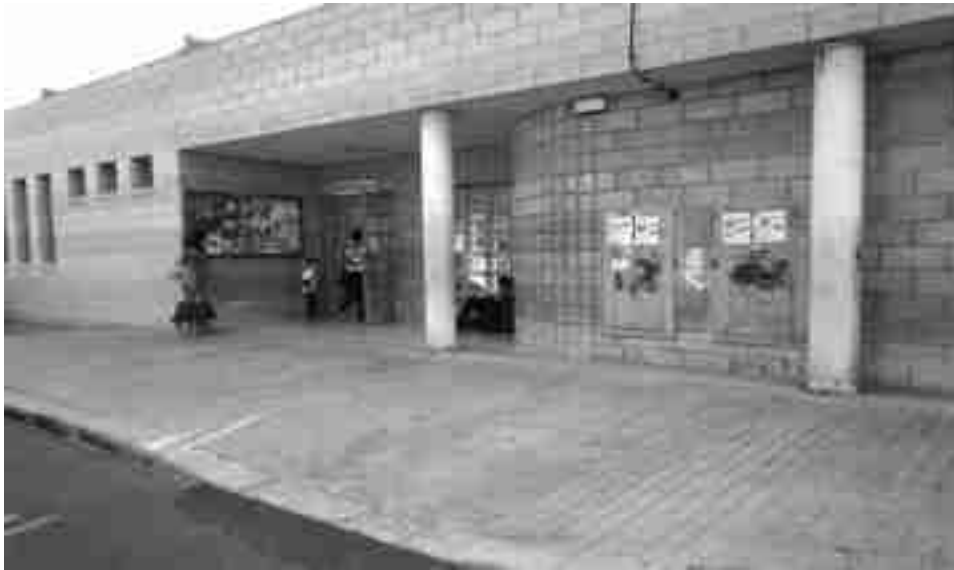
A partir de enero, las tasas por el uso de instalaciones deportivas no se pagarán en efectivo