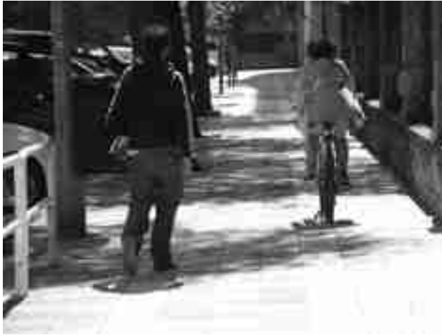
Acera compartida por un peatón y una ciclista

A través de unos trípticos se recuerdan algunos consejos tanto al peatón como a los ciclistas y conductores. Para los peatones consejos para cuando transiten por aceras, caminos o carreteras, cuando crucen la calzada o cuando vayan con niños. Para los ciclistas para que circulen con seguridad, cuando vayan por zonas peatonales o por la calzada.