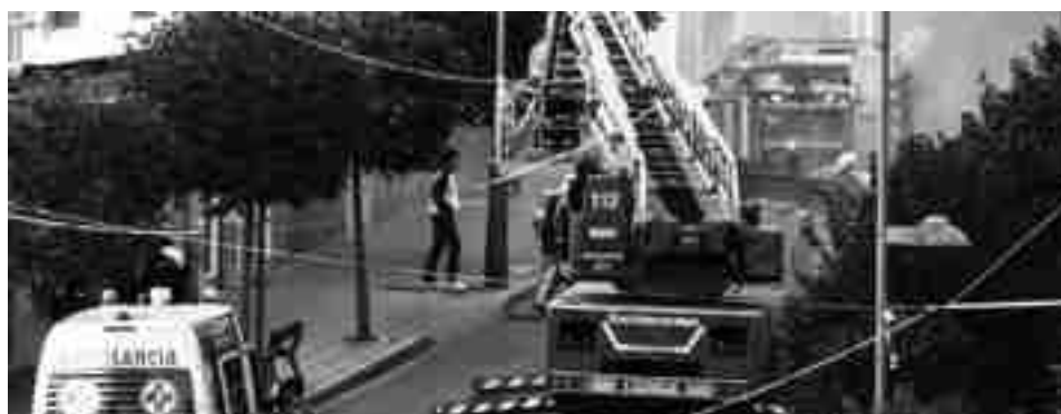
Fachada del restaurante siniestrado

el incendio. Precisamente por la inhalación de humo, una trabajadora del establecimiento tuvo que ser atendida y trasladada al Hospital por los servicios sanitarios de urgencia y, además, las dieciséis familias del edificio, y como medida de precaución, fueron desalojadas. ●