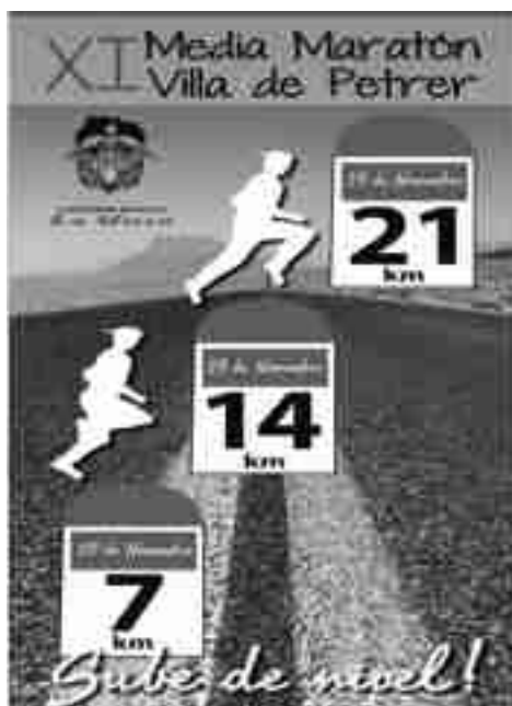
Cartel de la prueba

Este domingo, a partir de las 10 de la mañana, tiene lugar la XI Media Maratón Villa de Petrer organizada por el Centro Natación Petrer-carpintería metálica la Villa. Para la edición de este año y buscando un mayor número de corredores inscritos, el club ha incluido tres opciones, una primera de 7km dirigida a atletas que se están iniciando en el running y que darán una vuelta al circuito, una segunda alternativa de 14km con dos vueltas al itinerario con el objetivo de subir el nivel y una tercera opción que son los tradicionales