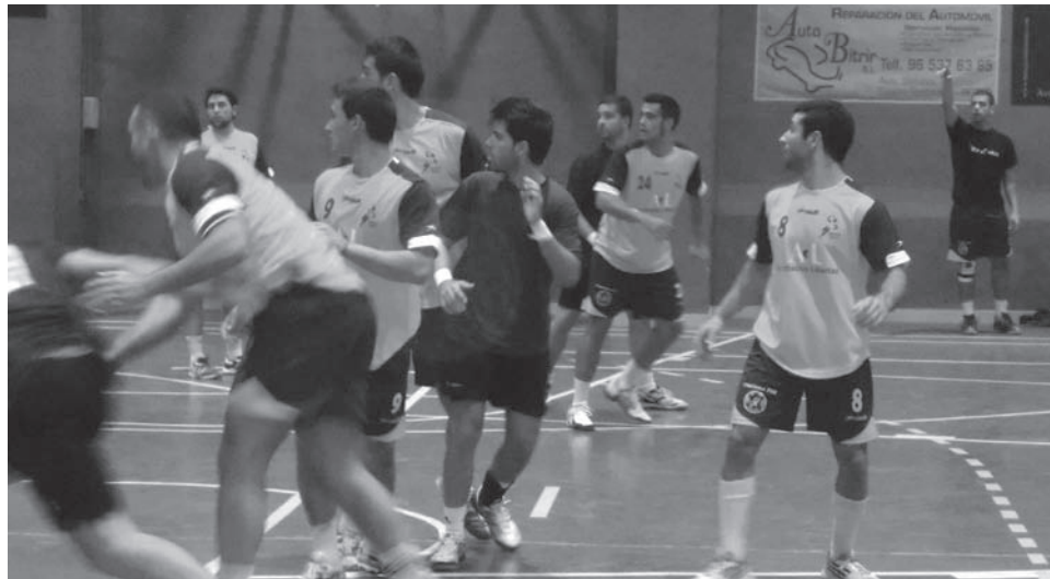
Hispanitas Bm. Petrer

Mislata-Hispanitas Petrer Sábado, 27 octubre, 18:30h Pabellón (La Canaleta)