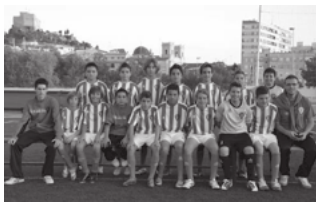
Unión Deportiva Petrelense C

En infantiles, el Petrelense A ganó 5-1 al Banyeres. Este sábado, a las 09:15h, visitan a la P.M. de Ibi. El Petrelense B perdió en Elche ante el Intangco C por 5-1. Este sábado, a las 10:15h, reciben al Forqué. El Petrelense C, pese a la lluvia, sigue enamorando con su juego de ataque. Venció 4-0 al Playa Sant Joan. Este sábado, a las 18:00h, juegan en el campo del Akrasala. ●