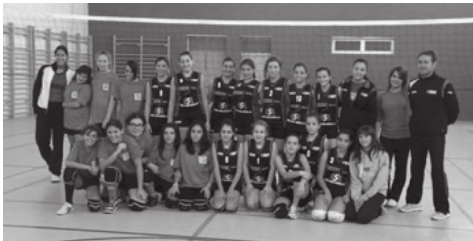
SDVP infantil femenino posa con sus rivales del IES La Nia

Los juveniles juegan dos encuentros, el viernes, a las 20h, en Elx y el domingo, a las 12h, en Petrer ante el Sant Joan