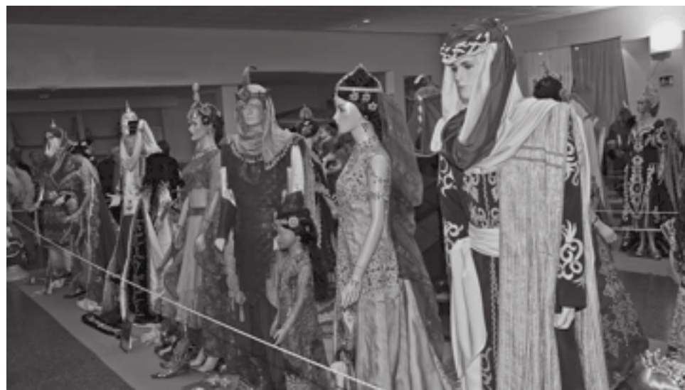
Exposición "Beduinos en el recuerdo" que se puede visitar en el "Campus"