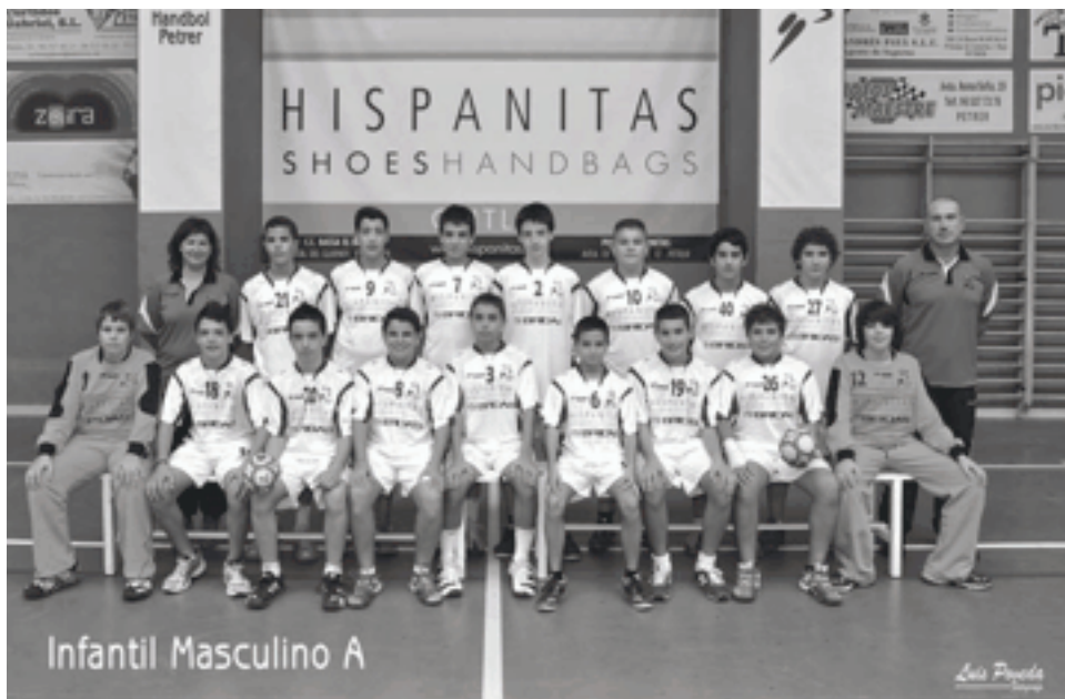
Hispanitas Bm. Petrer infantil masculino A

El masculino B debutó con un empate a 33 goles con el