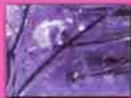
Foto de cuero cabelludo con problemas capilares

En nuestros centros de Petrer y Elda realizamos pruebas de salud de tu cabello