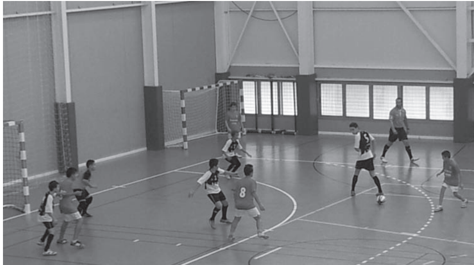
FS Petrer infantil en Pilar de la Horadada