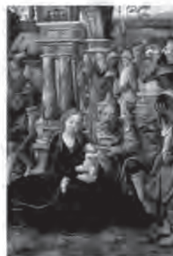
«NAVIDAD» Adoración de los Reyes Magos. Tabla realizada por Pieter Coecke van Aelst. Siglo XVI. Museo Nacional del Prado, Madrid.