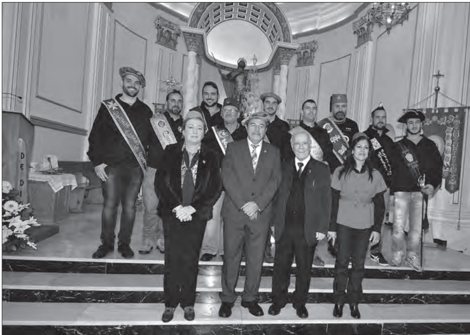
Capitanes 2014 con autoridades locales y festeras