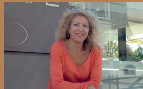
LA ZARZUELA REGRESA AL TEATRO CERVANTES