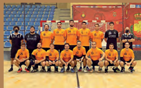
DOBLE TEST PARA HISPANITAS PETRER ANTES DE LA LIGA