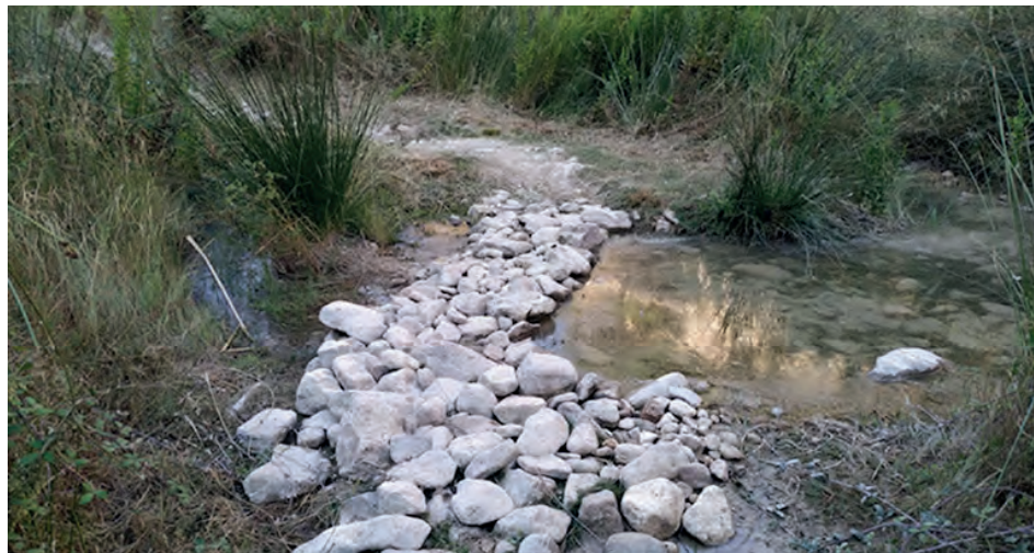
Imagen de una de las actuaciones llevadas a cabo

En el caso de la Rambla de Puça, la Brigada del Paisaje Protegido ha llevado a cabo una actuación que se ha centrado