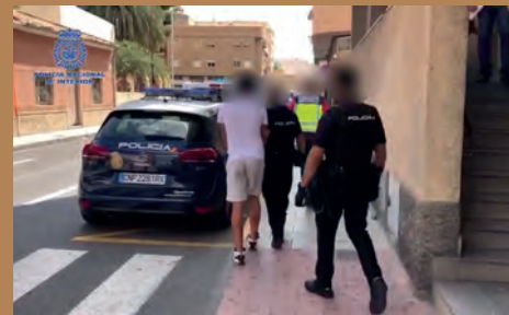
DETENIDO UN JOVEN POR ASALTAR Y AGREDIR A UNA MUJER