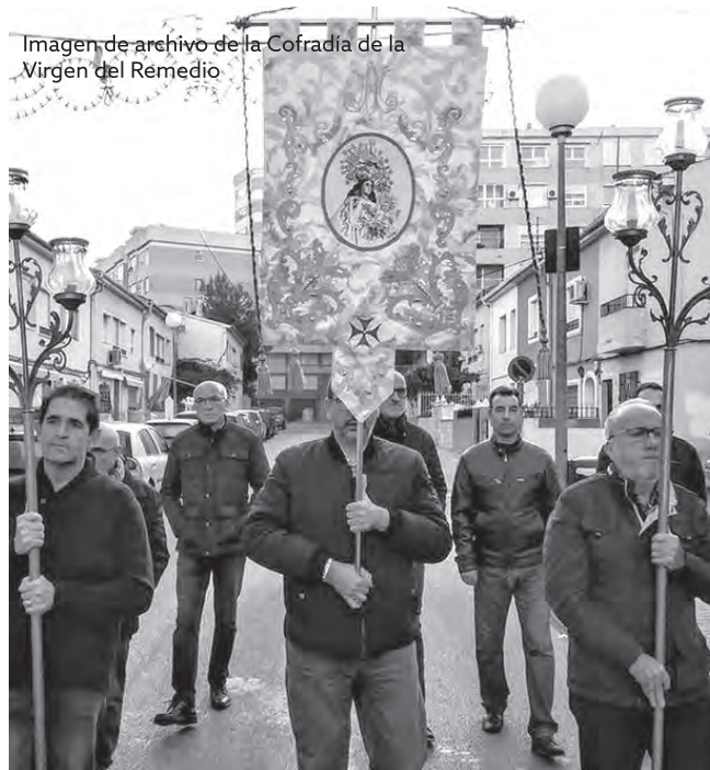
Imagen de archivo de la Cofradía de la Virgen del Remedio

Otros actos sí que se van a celebrar pero adaptándolos para cumplir con la normas sanitarias de prevención y protección frente a la pandemia del coronavirus. Uno de ellos es el Rosario de la Aurora que, como desde antaño, se rezará to-