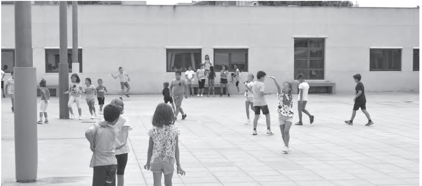
Colegio 9 d'Octubre. Imagen de archivo

Tras confirmarse tres positivos de COVID-19 en alumnos de tres centros, dos colegios y un instituto, la primera autoridad municipal ha lanzado un mensaje de tranquilidad a la comunidad educativa