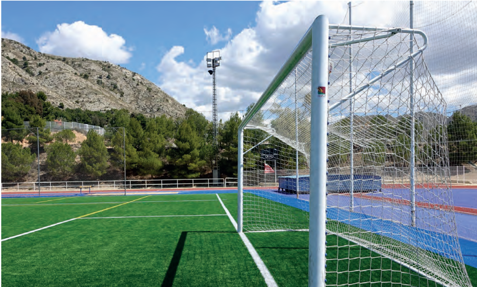
Estadio Municipal El Barxell

Este año las Inversiones Financieramente Sostenibles cuentan con un presupuesto de cerca de un millón de euros que van a permitir realizar pequeñas actuaciones de no más de 40.000 euros e impulsar el sector local de la construcción