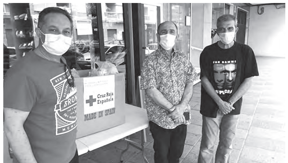
Miembros de la Asociación en uno de los puntos de recogida.

Para la tercera salida, prevista para el viernes 25 de septiembre, de 17 a