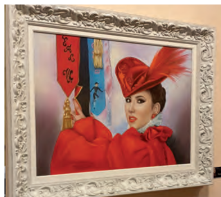
Imagen de uno de los cuadros expuestos

La mayoría de ellos son retratos, primeros planos de abanderadas, capitanes, rodela y festeros de Petrer pero también esta exposición cuenta con