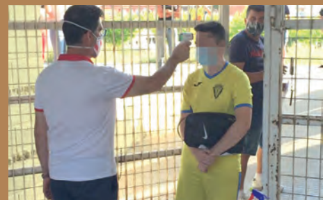
EL PETRELENSE JUV. SUSPENDE LOS ENTRENOS POR UN POSITIVO