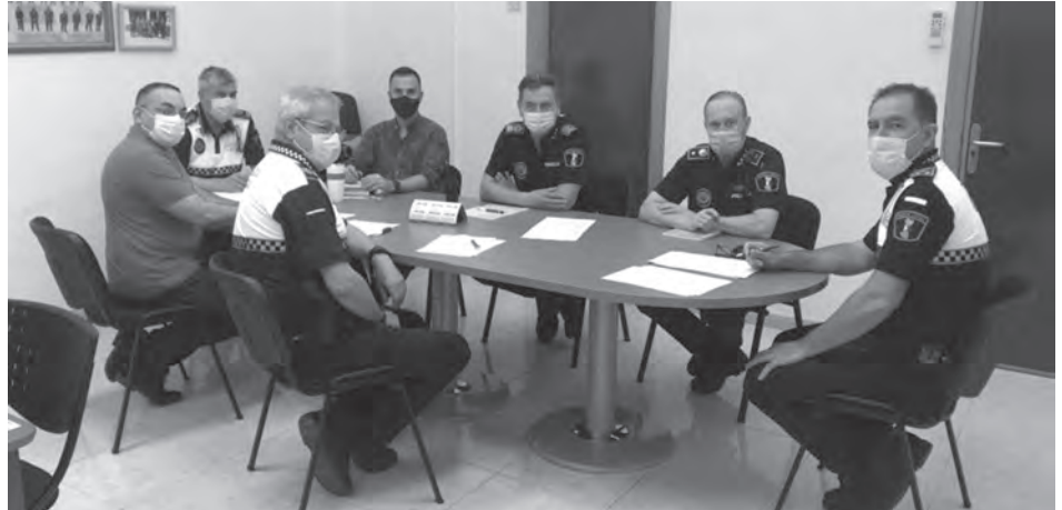
Integrantes de la comisión