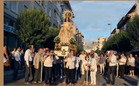
SOM DE PETRER: LA VIRGEN PASEA POR LAS CALLES DE PETRER