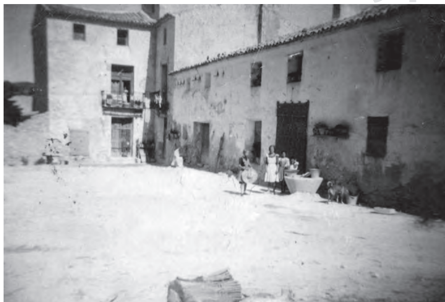
Finca de L'Administració de Catí