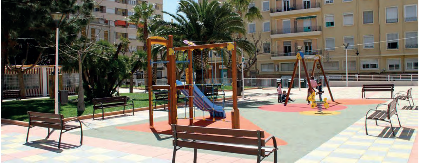
Imagen superior: Plaça del Derrocat. Imagen inferior: Escuela Infantil "Els Peixos"