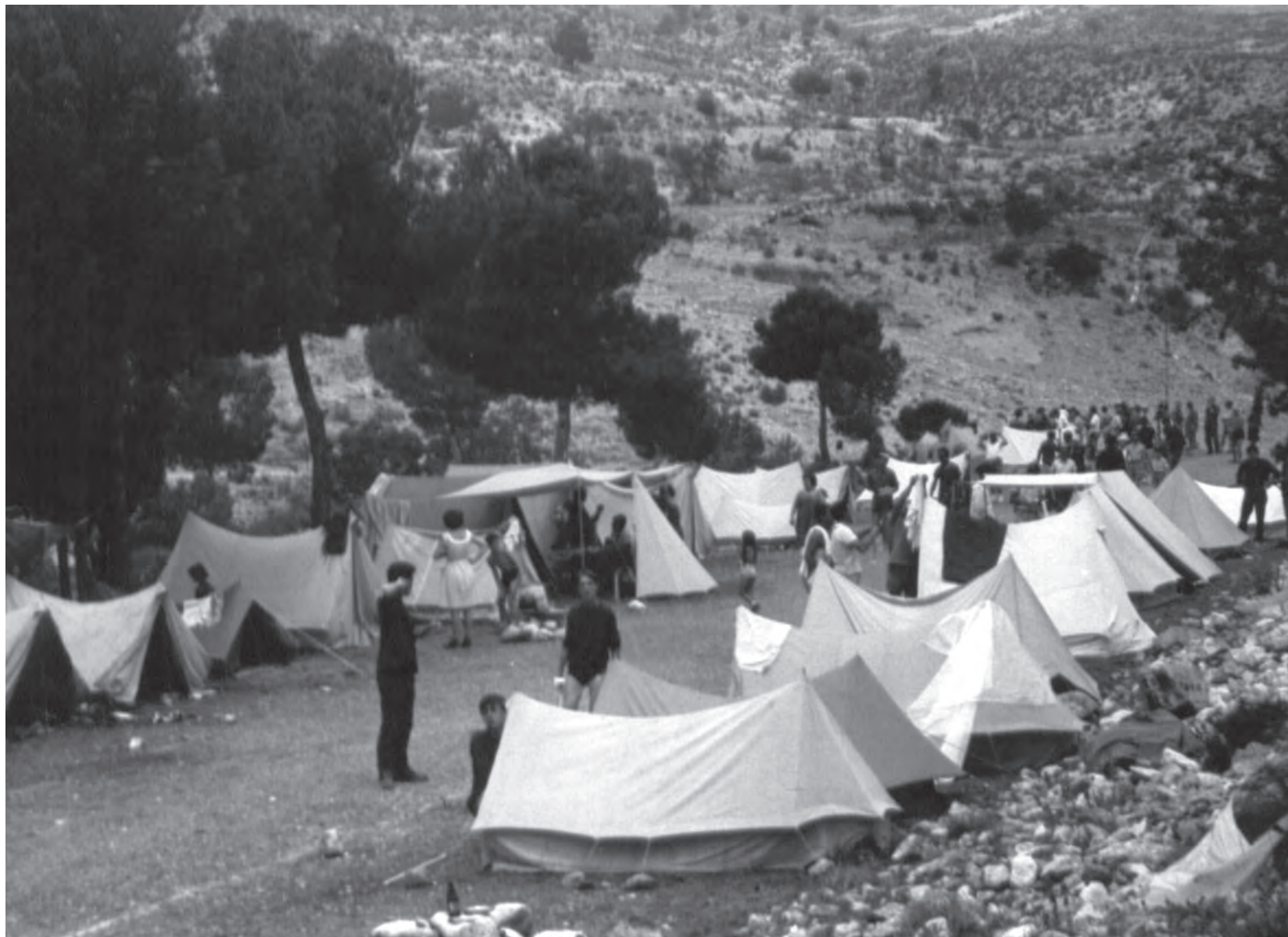
Campamento de Caprala organizado por el Centro Excursionista de Petrer