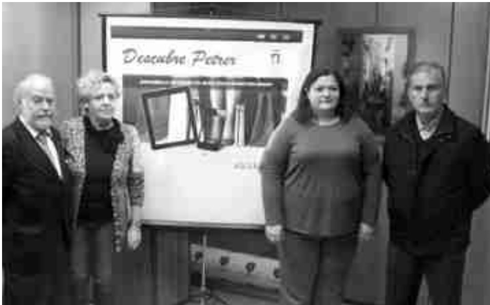
La concejala de Desarrollo Económico y el de Comercio con los responsables de la Asociación de Comercio Electrónico

El nuevo portal va a disponer de una oferta muy interesante para comercios y usuarios