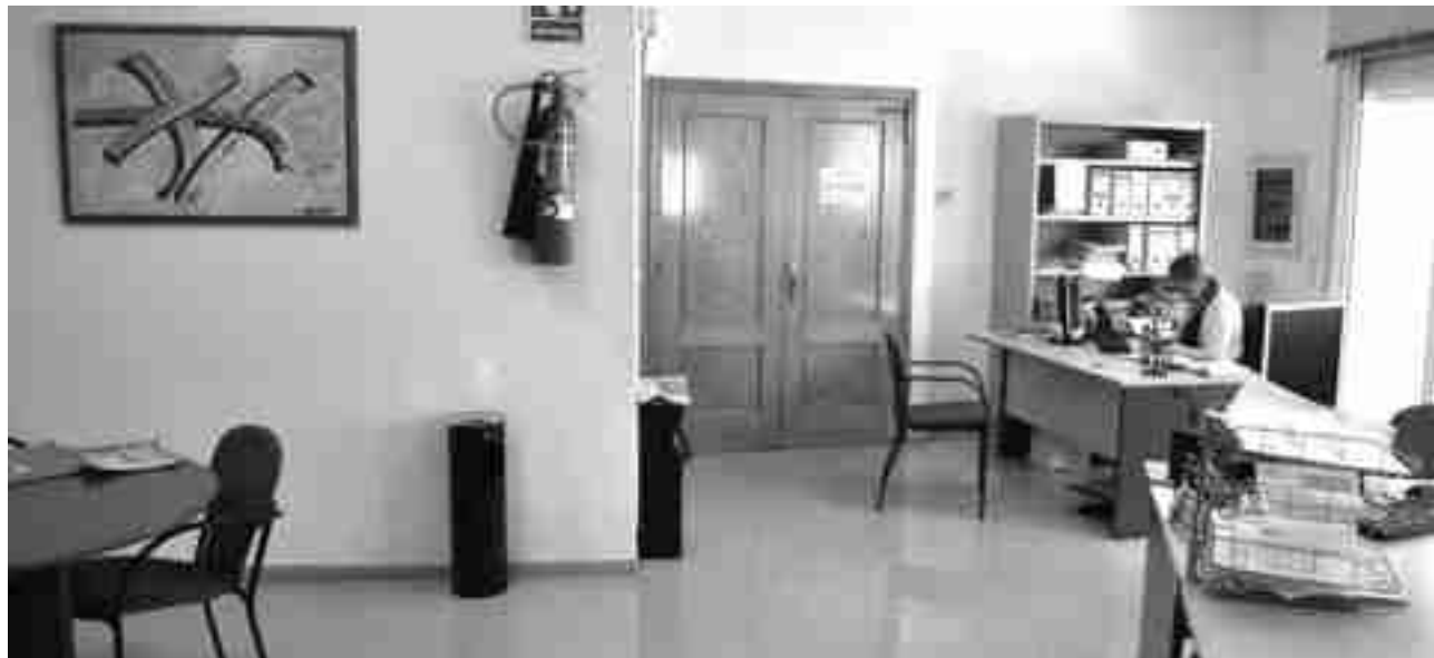
Imagen del Juzgado de Paz de Petrer