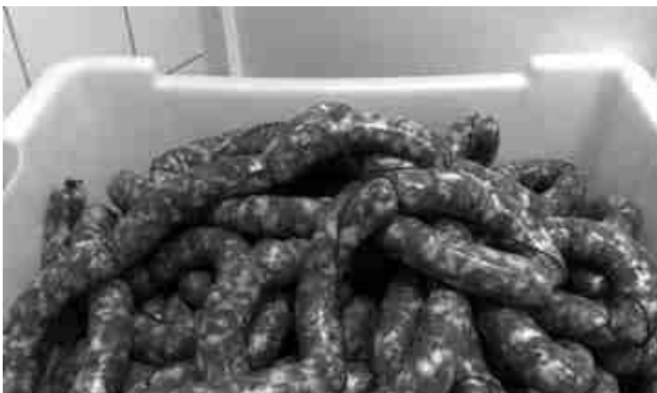
Llonganissa típica de la Carnisseria Laliga