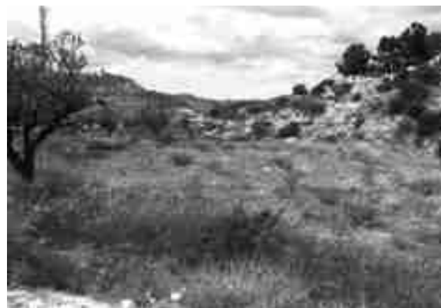
Bancales abandonados, en el término municipal de Petrer

También, ha matizado que para acceder a este "Banco de Tierras" la moción propone la creación de una bolsa regulada por unos requisitos mínimos de sostenibilidad que deberán ser elaborados por una comisión compuesta por el Consejo Municipal de Medio Ambiente, el Consejo Local