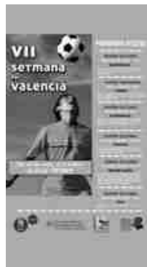
Cartell promocional de la "VII Setmana pel valencià"