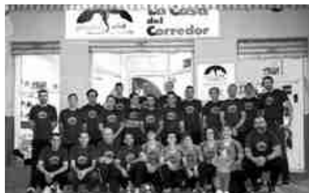
Club Atletismo Petrer-Running Cid