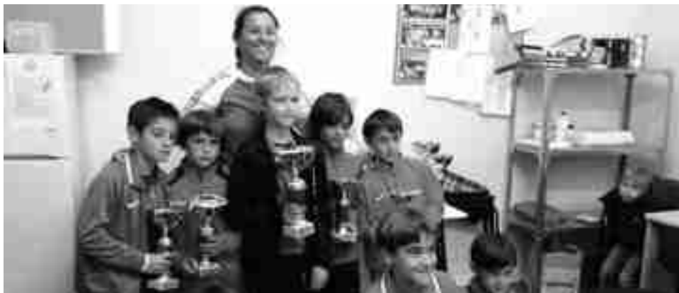
Jugadores del Club Tenis Petrer