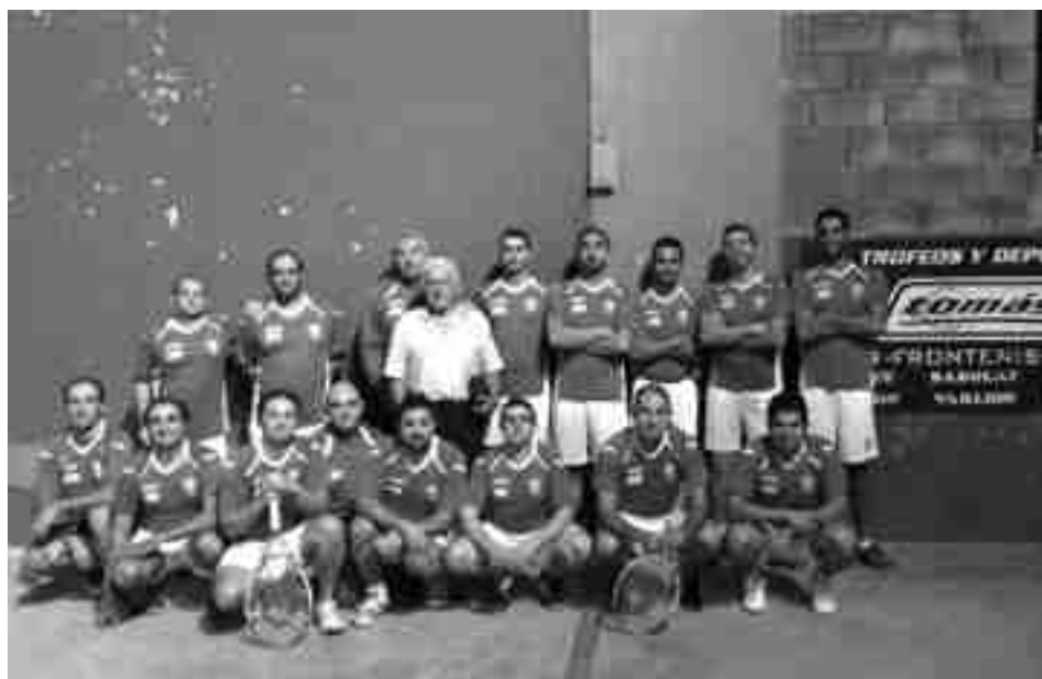
Club Frontenis Petrer-Deportes Tomás