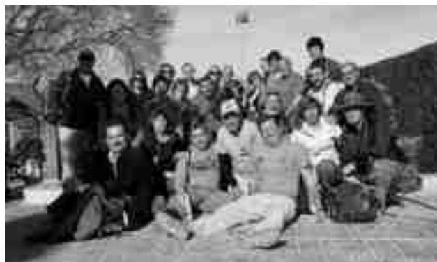
Marcha de los Gazpachos 2013

Se llevará a cabo el domingo 6 de abril y las inscripciones se pueden realizar martes/jueves