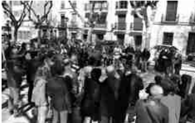
Ruta Poètica, "Petrer i els seus poetes", en la Plaça de Baix