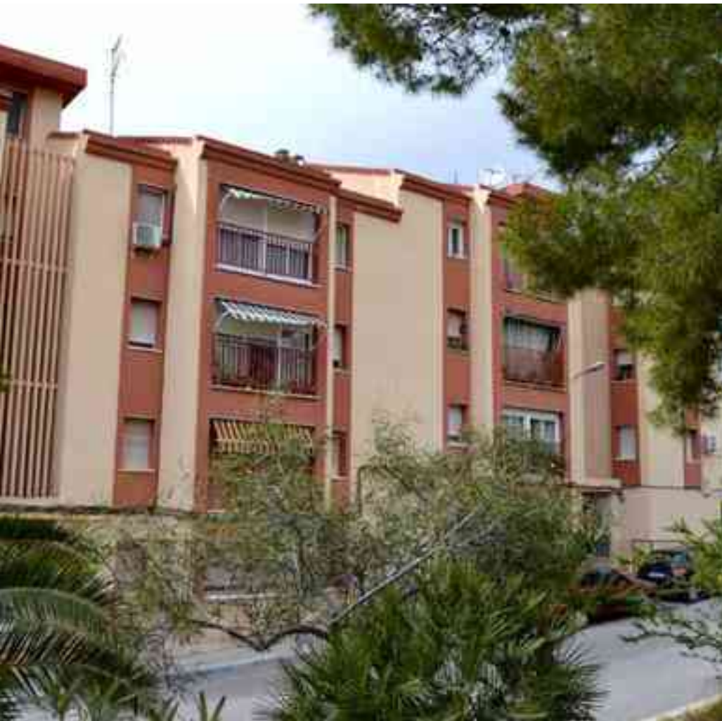
Tres de las viviendas sociales a rehabilitar están en la c/ Amazonas en el bloque de las "75 Viviendas"