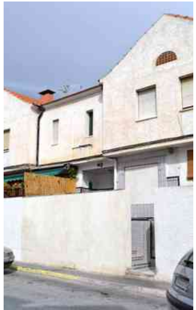
Otra de las viviendas sociales que se va a arreglar ubicada en la c/ Quevedo