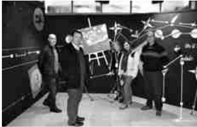
Imagen de la exposición durante la apertura