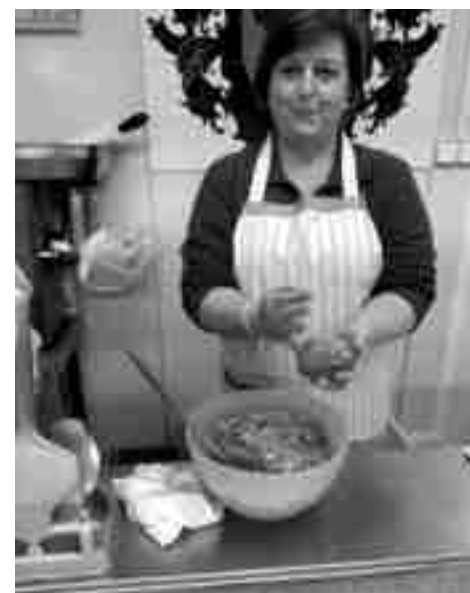
Salu fent fassesures