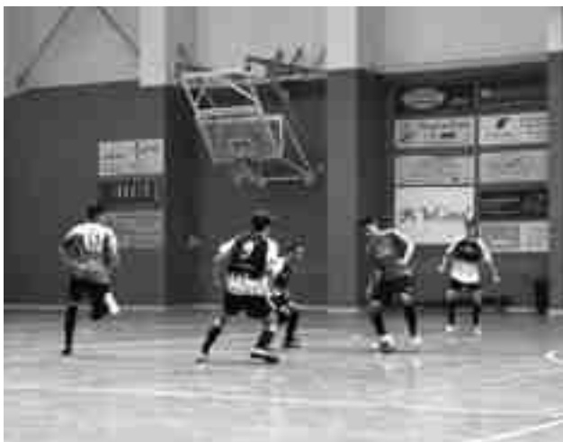
FS Petrer juvenil

El equipo infantil también solventó positivamente su compromiso frente al To-