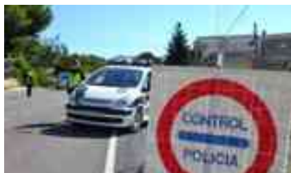
Imagen de archivo de un control policial

Pero a pesar de esos buenos resultados sobre el uso correcto del cinturón de seguridad, el concejal de Tráfico y Gobernación ha reconocido que los agentes sí que han impuesto varias san-