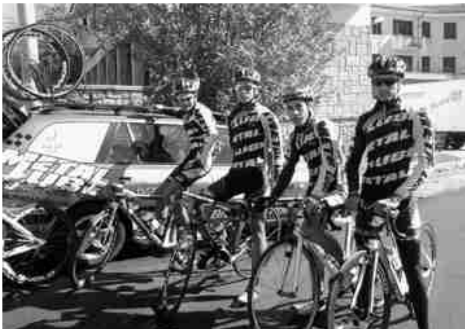
Componentes del Metal Lube Bicycle