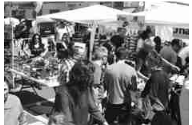
Imagen de archivo. Feria Outlet de Comercio 2013