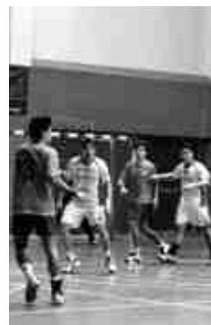
Hispanitas Petrer juvenil

El cadete femenino juega este sábado, a las 10h, en