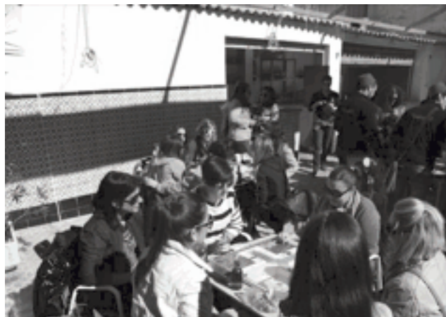
Día de Convivencia de los Moros Viejos en su sede de País Valenciano

La jornada comenzó a las ocho de la mañana con el Concurso de Gachamigas que ganó la elaborada por