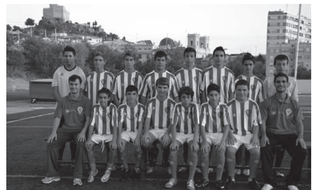
Unión Deportiva Petrelense cadete B

El infantil C venció 0-4 en Akrasala. Este domingo, a las 10:00h, reciben al Promesas de Elche B. ●