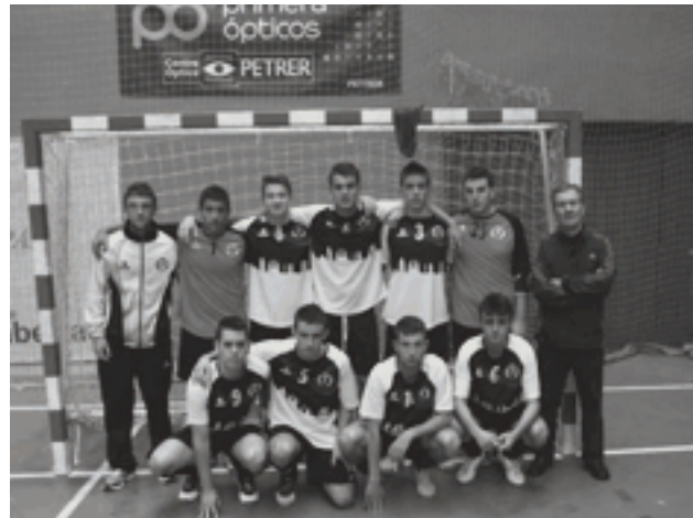
FS Petrer juvenil 2012/13

Este fin de semana se vivirán los derbis contra Nueva Elda en las categorías infantil y cadete