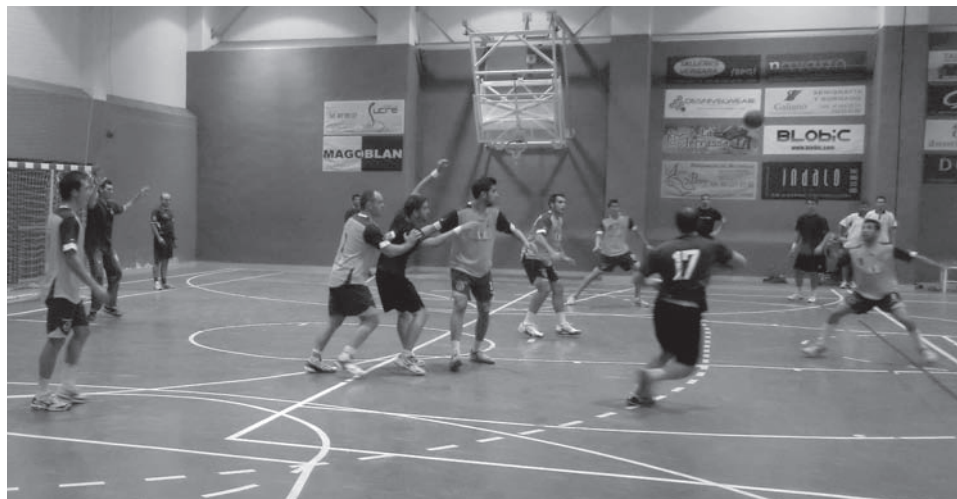
Hispanitas Bm. Petrer

Hispanitas Petrer-Altea Sábado, 3 noviembre, 18:30h (Pabellón Municipal Petrer)