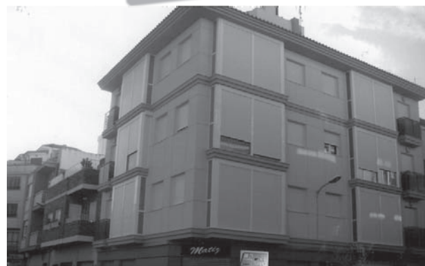
"Edificio Racó", en la calle Menéndez Pelayo 29, de Petrer