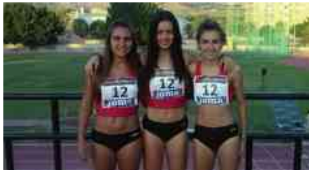
Tres de las atletas participantes en la Milla de Elche