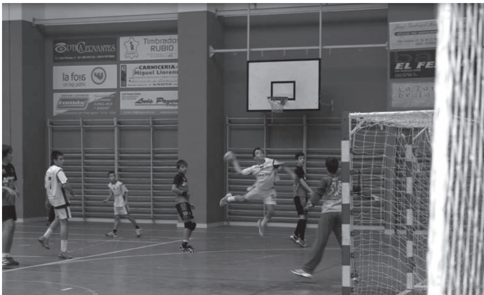
Acción del partido del infantil masculino A

Sólo el equipo infantil masculino B fue capaz de ganar su partido en la pista del Torrellano Elche por 22-30