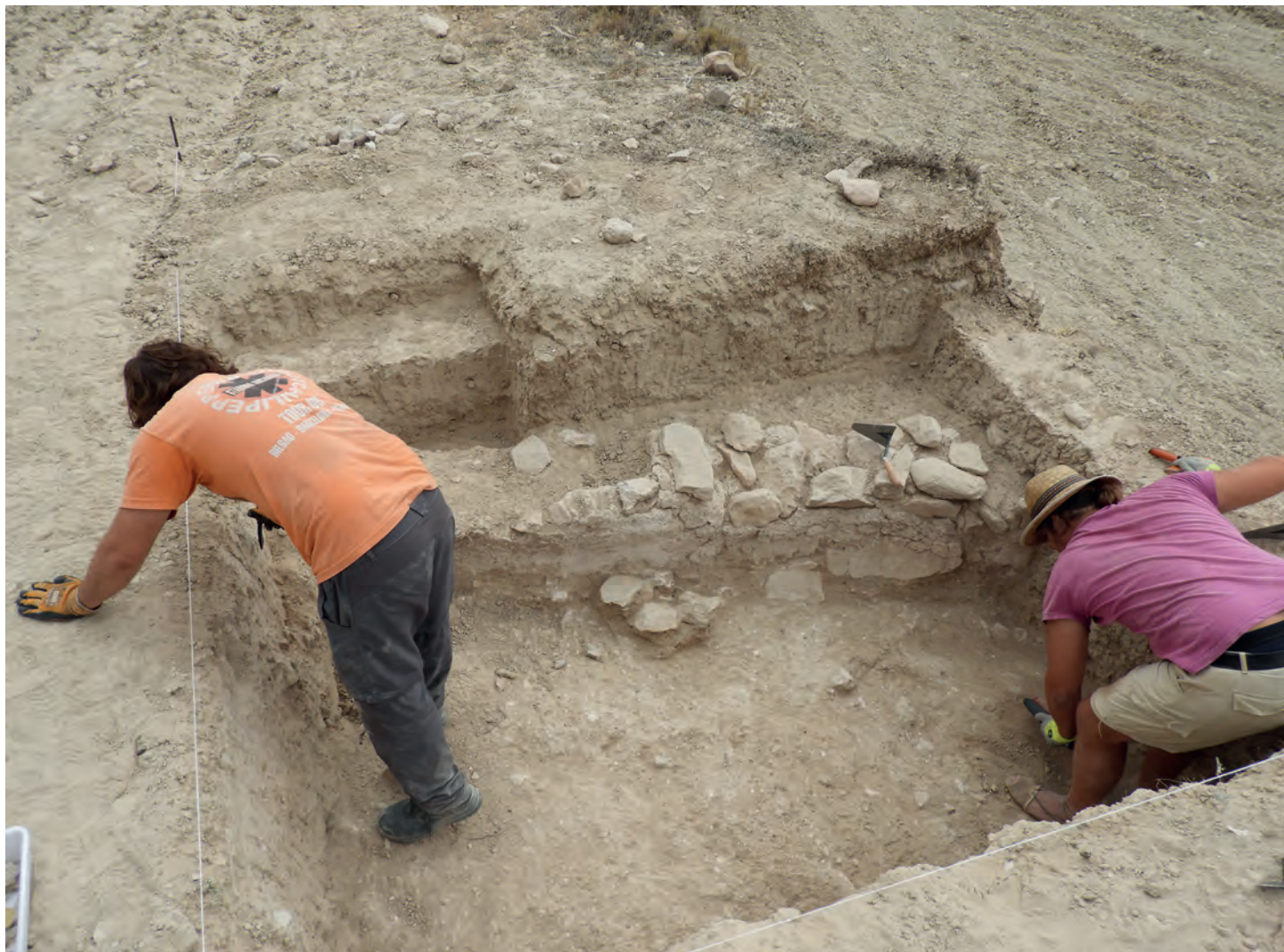
Excavación del Muro. Sondeo 2

Los primeros sondeos arqueológicos del Plan General de Investigación del Proyecto Territorio Bitrir realizados, tras un primera fase de prospección, han presentado hallazgos muy interesantes que evidencian restos de la Alquería Andalusí de Puça