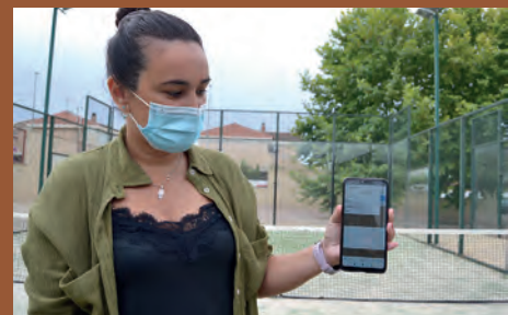
DEPORTES CREA UNA APP PARA RESERVAR LAS INSTALACIONES