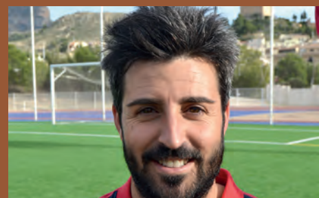
LA U.D. PETRELENSE RINDE HOMENAJE A SU CAPITÁN "COTI"