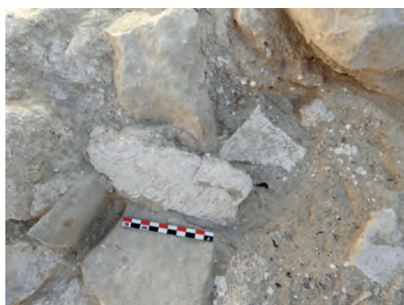
Enlucidos con círculos concéntricos. Sondeo 1

Localizar en el espacio la ubicación física de las viviendas que componían la Alquería Andalusí en la partida de Puça, datar cronológicamente su perduración en el tiempo y comprender mejor la relación de la población en el entorno inmediato de esa zona rural así como establecer su relación con los yacimientos más cercanos e importantes como son los de "Els Castellarets" y "Bitrir" son los objetivos que se marcó la concejalía de Patrimonio Histórico cuando decidió poner en mar-