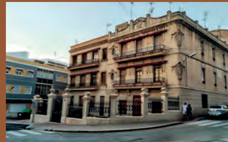
SOM DE PETRER: LA CASA DE LOS VILLAPLANA