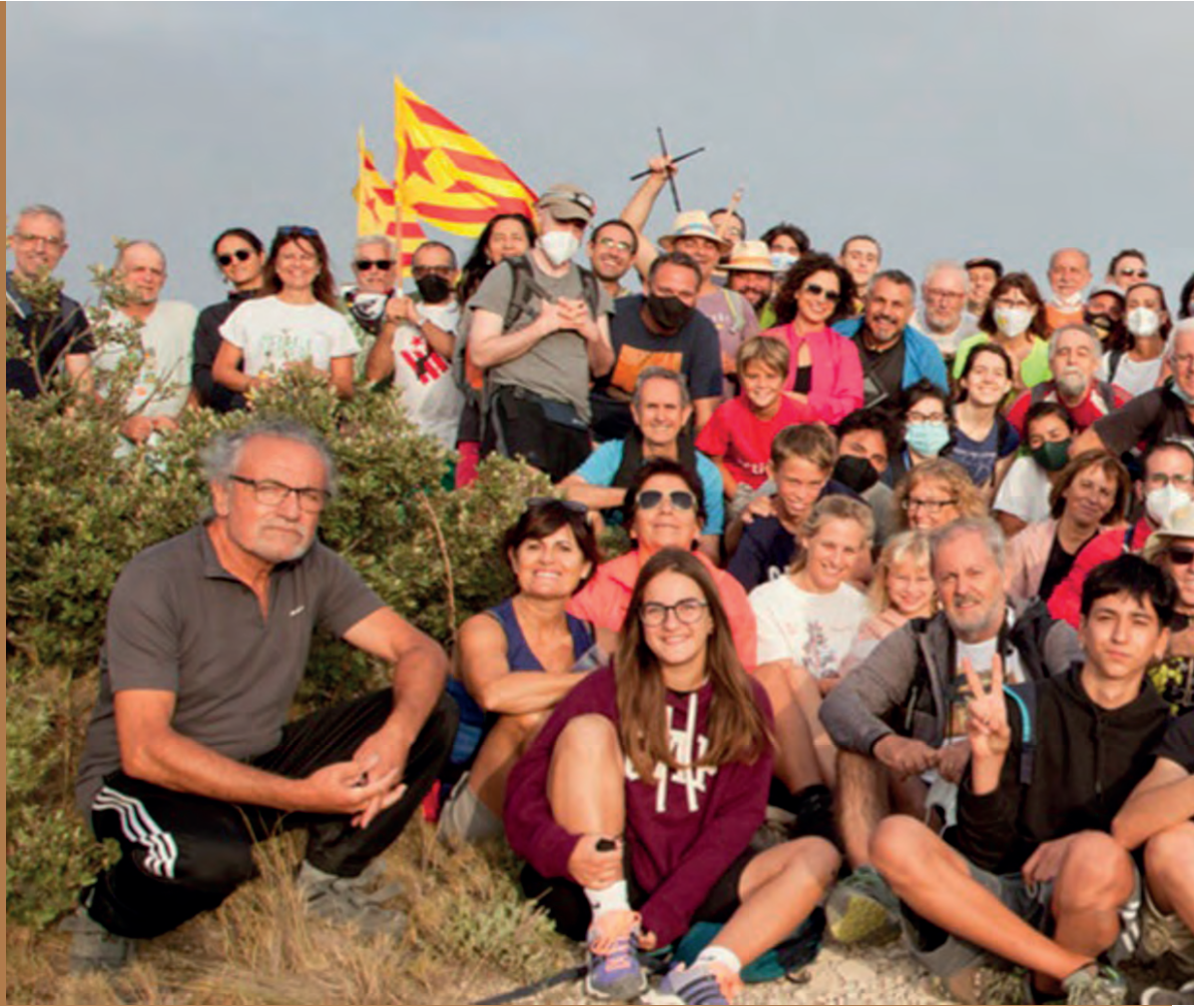
Foto de grup de l'XI ALBA DE VALOR. Més de 80 persones de l'entorn comarcal es trobaren a l'alt de Guisop per veure eixir el sol pel Puigcampana i llegir textos literaris per celebrar el 110é. aniversari de l'escriptor Enric Valor i Vives (Castalla, 22 d'agost de 1911 - València, 13 de gener de 2000), l'autor de la rondalla "El jugador de Petrer".