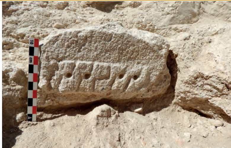
Moldura decorada. Sonda 1

Además, se decidió realizar otro sondeo para determinar si un muro que se intuía en el perfil del bancale seguía prolongándose en el terreno pero se comprobó que no y que, seguramente, se trate de un amontonamiento de piedras y restos depositados cuando, en su día, se llevaron cabo las labores de abancalamiento. En cuanto al material arqueológico hallado, predominan los fragmentos cerámicos de los siglos XII y XIII, con restos de una vajilla andalusí, entre ellos, una jarrita con decoración esgrafiada, frag-