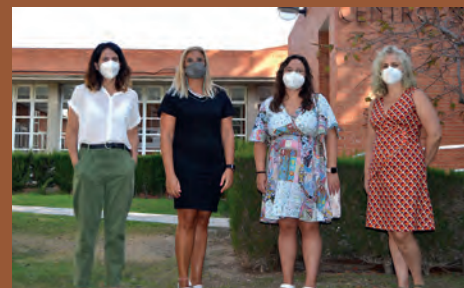
PETRER LLEGA A LA LISTA DE ESPERA CERO EN DEPENDENCIA