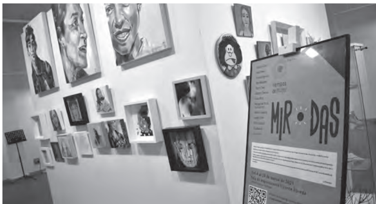
Imagen de la exposición Ad Miradas

La Asociación Tiempos de Mujer arranca el nuevo curso con varias actividades que se celebran este fin de semana y el inicio de los talleres. La presidenta hace un llamamiento a la participación