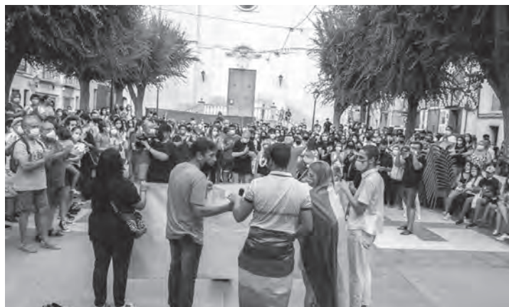
Concentración de la Asociación Iris