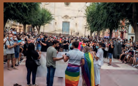
CONCENTRACIÓN MULTITUDINARIA CONTRA LA HOMOFOBIA