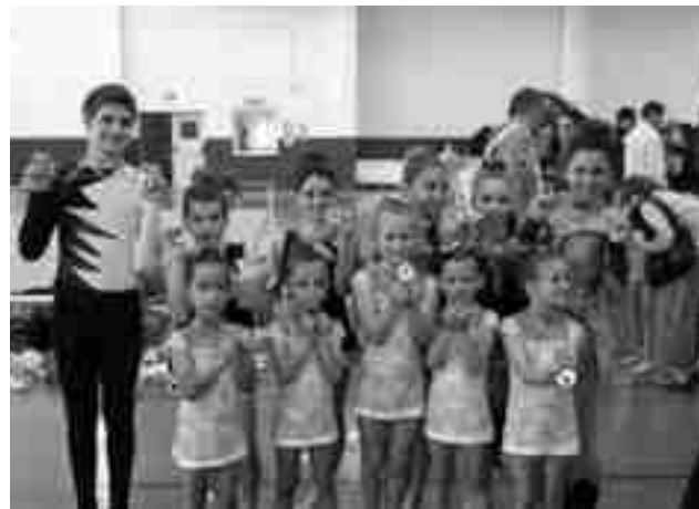
Todos los medallistas en Callosa d'Ensarrià

Todos los participantes del Club Gimnasia Rítmica Petrer subieron al podio