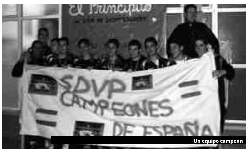
Un equipo campeón