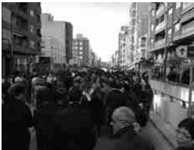
Imagen de archivo de la manifestación contra la LOMCE en febrero de 2013

Del mismo modo, cada una de las diferentes asociaciones que componen la Federación tienen la