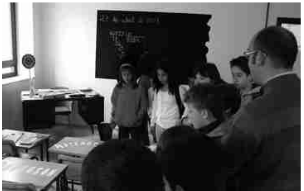
Grupo de escolares visitando la exposición

Por último, cabe recordar que este próximo fin de semana, sábado y domingo, va a permanecer abierta al público, de doce a dos y de seis a siete de la tarde. ●