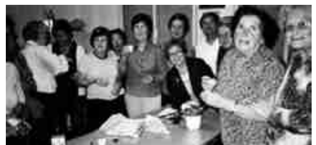
Convivencia HOAC y Comunidades Cristianas

Los grupos están inmersos en una comunidad parroquial, con quien comparte la celebración y la acción. Anualmente se llevan a cabo un par de asambleas diocesanas en la que se ponen en común los problemas e inquietudes del mundo obrero. Allí, se marcan las directrices del trabajo que deben desempeñar para buscar soluciones a los problemas que marcan la actualidad, tales como el paro y la pobreza. El órgano supremo de decisión de la HOAC es la Asamblea General de Militantes (se convoca cada seis años) y en ella todos sus componentes participan directamente. Cada uno tiene un voto. ●