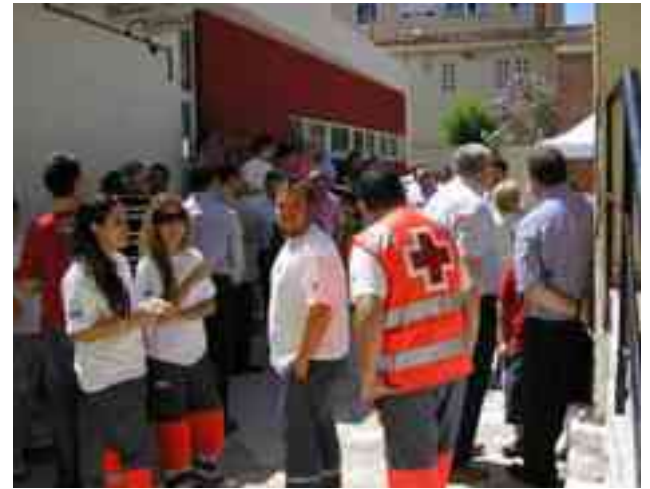
Imagen de archivo. Día de la Banderita

degustar un plato de arroz ya que se ha previsto cocinar una paella gigante que se complementará con un aperitivo y refrescos. Mientras que a las tres se llevará a cabo la puesta en común de los grupos de trabajo. El Encuentro Diocesano concluirá a las cuatro de la tarde con la celebración de la Eucaristía que presidirá el Obispo, Jesús Murgui. ●