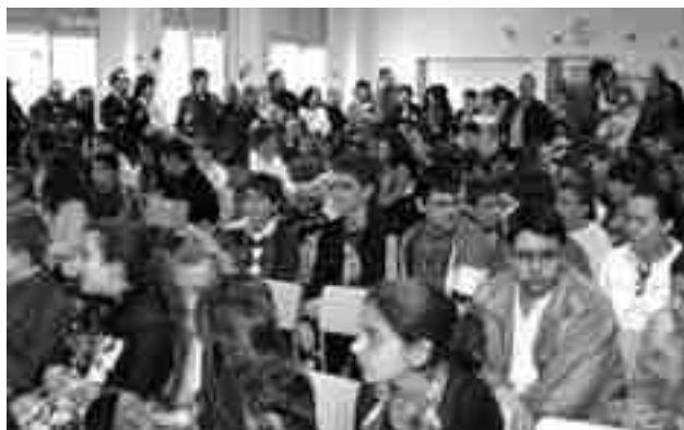
Salón de actos repleto de gente antes de dar comienzo la prueba

Los jóvenes tuvieron hora y media para resolver las cinco pruebas de que consta la Olimpiada. Para terminar el mismo colegio "Reina Sofía" les ofreció un aperiti-