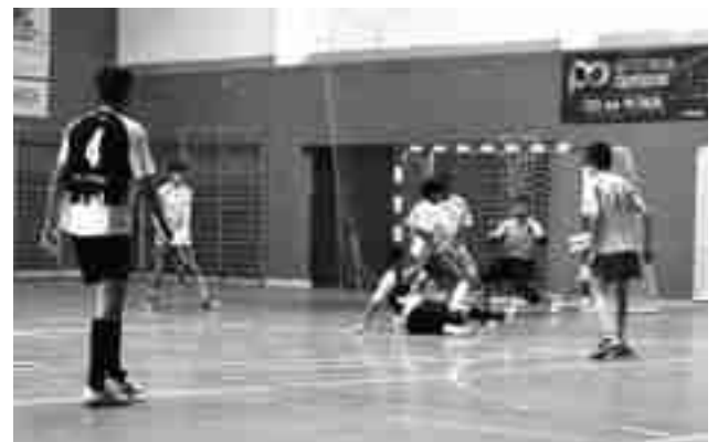
FS Petrer juvenil

El único equipo que jugó partido de Copa fue el infantil que perdió en Novelda ante el Racing por 3-1. Este domingo, a las 10 h, juegan la vuelta en Petrer. El cadete recibe al S. Desamparados este domingo, a las 12:30 h. El alevín cierra la 1ª fase en casa este domingo, a las 11:15 h contra Xaloc. ●