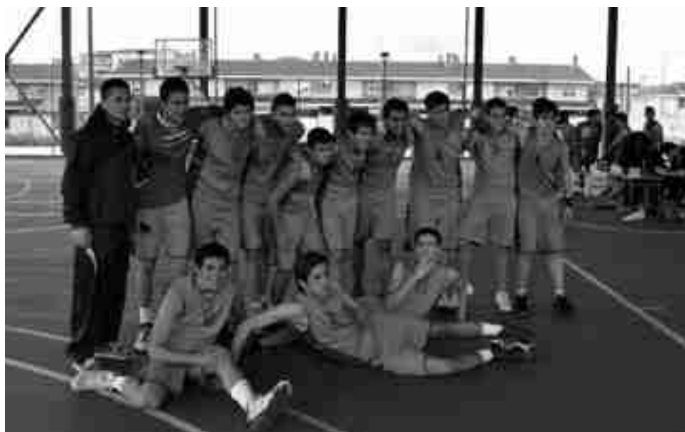
Club Baloncesto Petrer Cadete, segundo clasificado

La temporada en la liga federada de baloncesto ha finalizado para los cuatro equipos del C.B. Petrer. El Bassoil Estaciones de Servicio ha cerrado su participación con una victoria a domicilio por 40-50 en Villena ante el V74, quedando finalmente en octava posición en la tabla. Por su parte, el conjunto cadete se impuso por 62-47 al CB Biar en San Jerónimo, victoria que le ha permitido acabar en segunda posición en su grupo, sólo superado por un intratable V74 Villena Deportes Stadium.