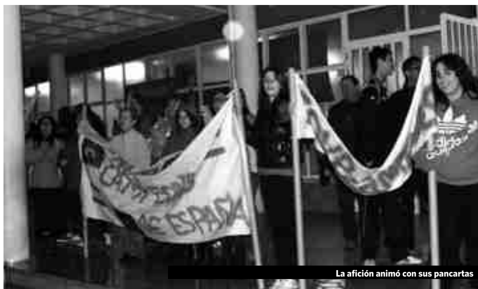
La afición animó con sus pancartas