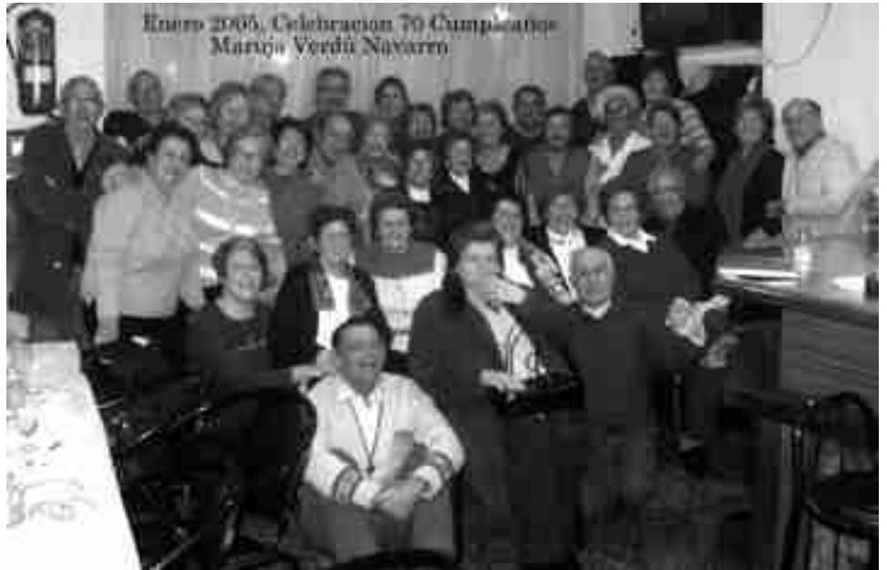
Integrantes de la HOAC Petrer con sus familiares en 2005

años, se desarrolló a mayor escala en el comedor comunitario que se instaló en un inmueble adquirido por trabajadores que formaban parte de la HOAC y Comunidades Cristianas de base a través de sus diferentes aportaciones económicas. Los primeros años de actividad fueron los de mayor expansión. El colectivo local llegó a superar la veintena de militantes, lo que tenía mucho mérito porque se vivían todavía tiempos de represión política-social en los últimos años de la dictadura.