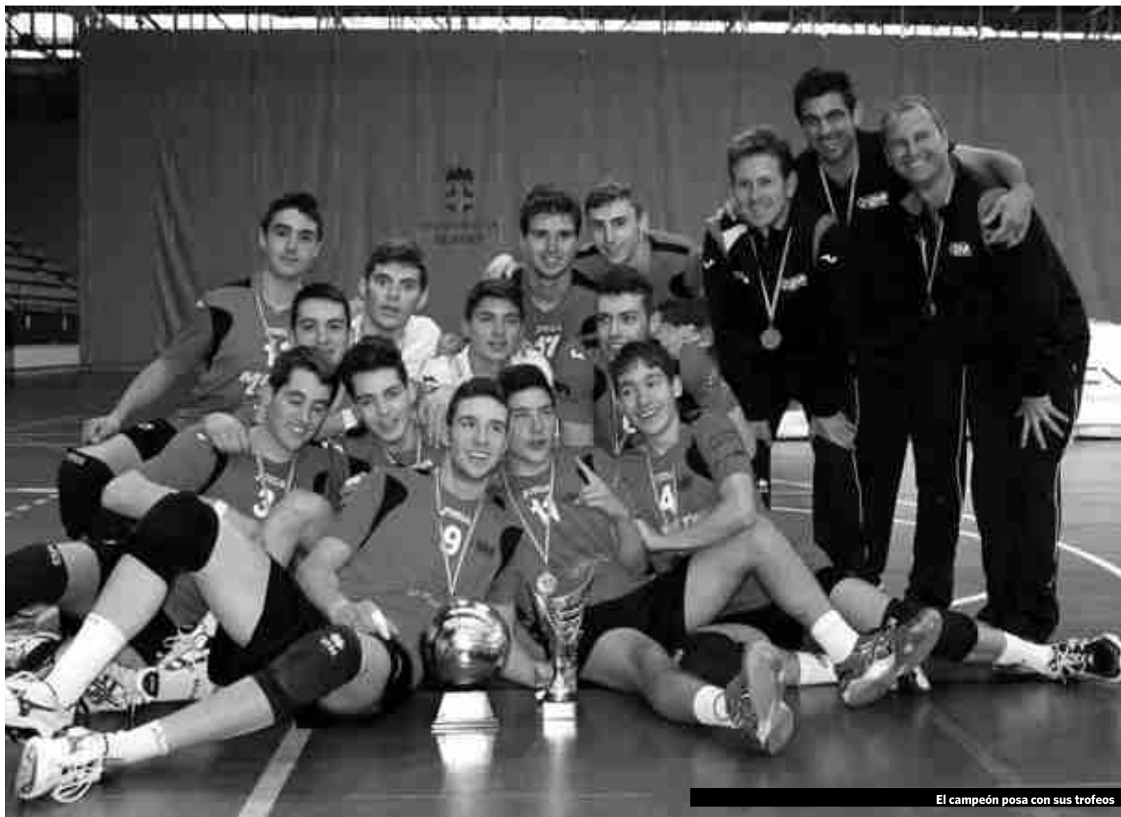
El campeón posa con sus trofeos