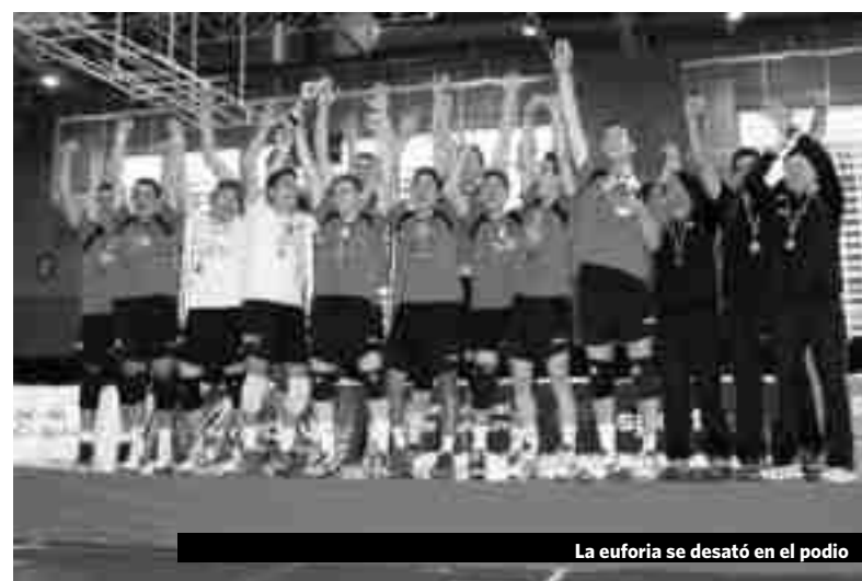
La euforia se desató en el podio