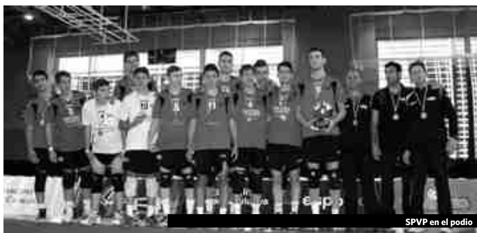
SPVP en el podio