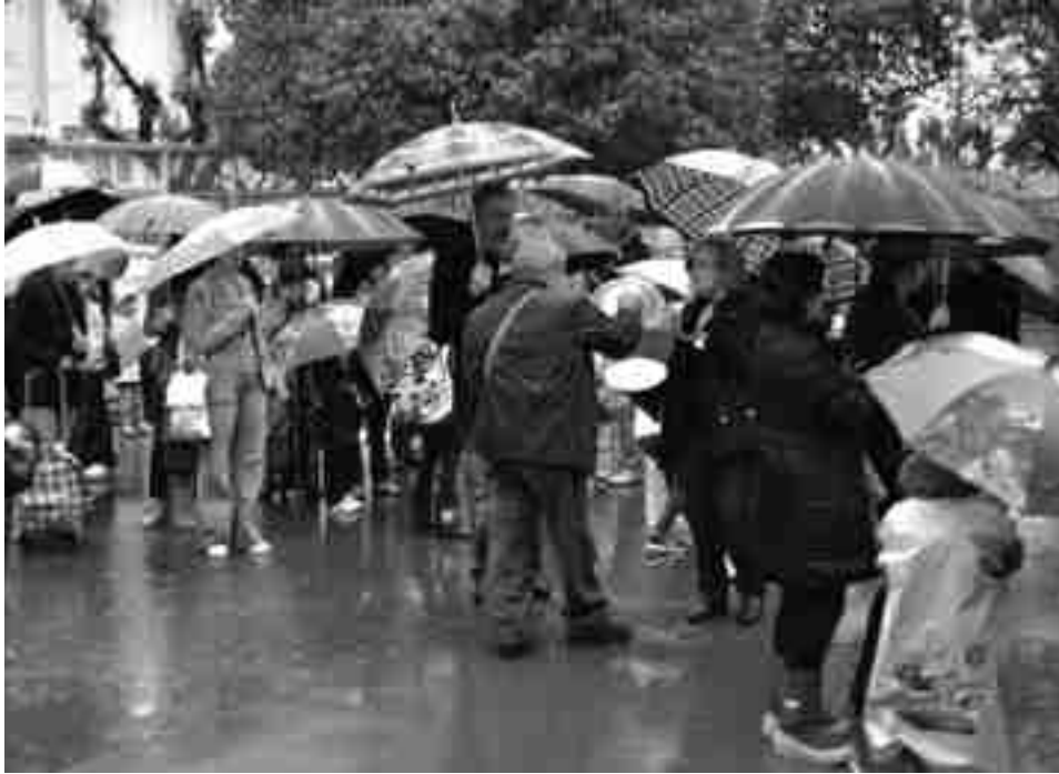
Imagen que corresponde a las personas que participaron en la "cacerolada"