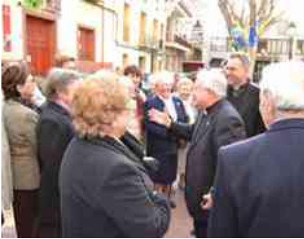
El Obispo de Orihuela-Alicante asistirá a esta jornada pastoral