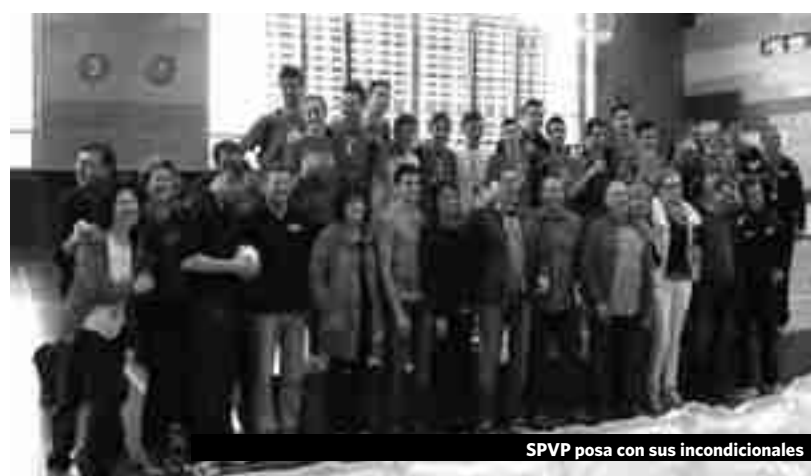
SPVP posa con sus incondicionales