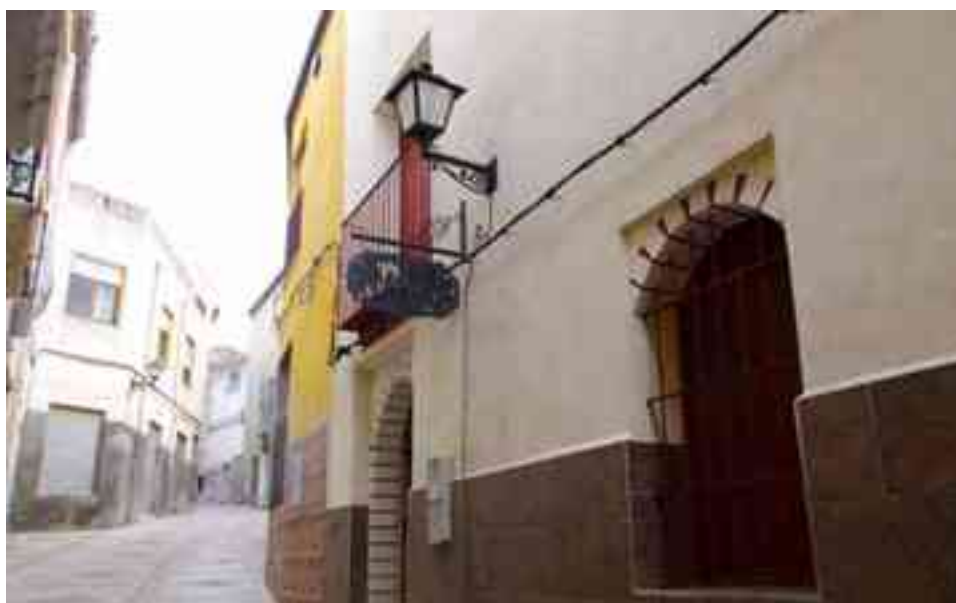
Cuartelillo de la calle San Rafael

En nuestra localidad, todos los cuartelillos deberán estar inscritos en la categoría B ya que se trata de sedes en las que, además, de realizar una función adminis-