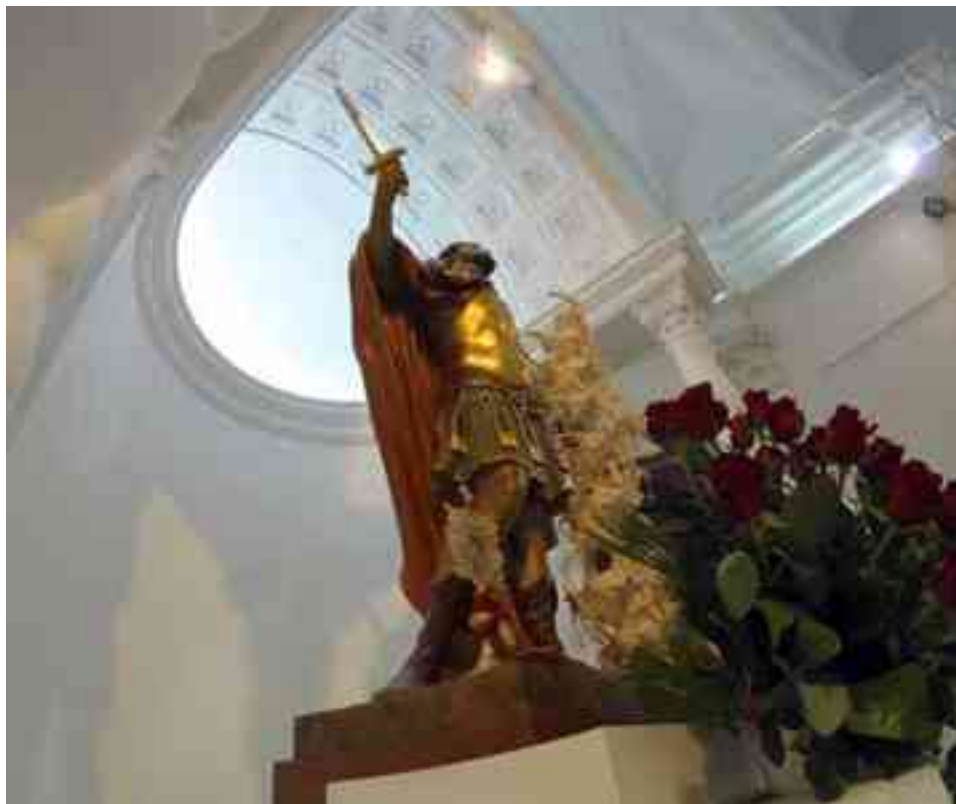
Imagen de San Bonifacio Mártir en el altar de su ermita

Además, según ha explicado el propio Rafael Antolín, se ha incluido un poema de