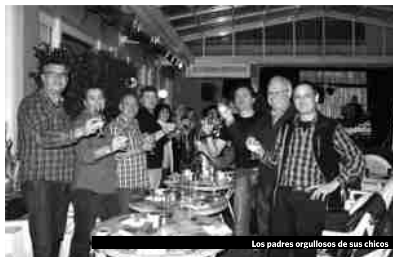
Los padres orgullosos de sus chicos