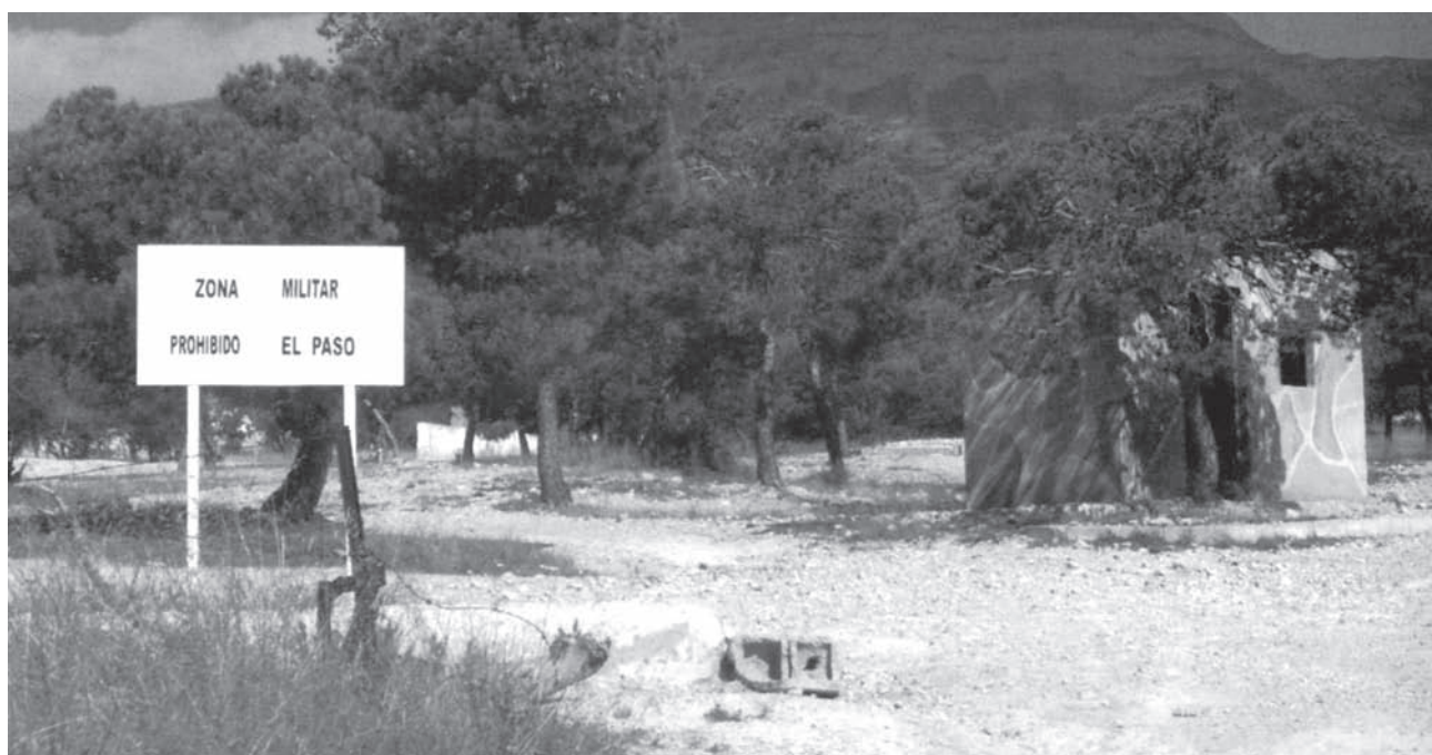
Campo de tiro que comparten los términos municipales de Petrer y Agost

Si se camina entre la Silla de El Cid y la Serra de Xaparrals no es nada extraño escuchar –en tiempos de paz– el insistente ruido de ametralladoras, disparos aislados e, incluso, el estallido de algún obús. Si el excursionista es algo curioso y se asoma hasta los límites de esta última sierra y mira hacia abajo verá humaredas esporádicas en el falso llano que se extiende junto a Les Mames del Sit, conocido popularmente como el Clot del Llop. Si la excursión la realiza por la ruta verde que, partiendo de la estación de Agost, atraviesa el término municipal de Petrer por el Palomaret y llega hasta territorios de Tibi, tampoco será raro encontrar vehículos militares con su característico color “camuflaje” o a jóvenes militares haciendo rapel en el Pont del Vidre, lugar habitual – por su verticalidad – para realizar estas prácticas. La razón de ello es que el Ministerio de Defensa es propietario de 445.000 metros cuadrados de terrenos en el término municipal de Petrer. A ellos hay que añadir los que pertenecen al territorio de la vecina población de Agost, bastante más extenso. Entre ambos conforman el campo de tiro del Ejército. A estos casi medio millón de metros cuadrados hay que añadir su zona de influencia que es muy extensa. El Ministerio de Defensa “controla” dos kilómetros lineales contados a partir del perímetro externo del campo de tiro que en lo referente a Petrer suponen más de veinte millones de