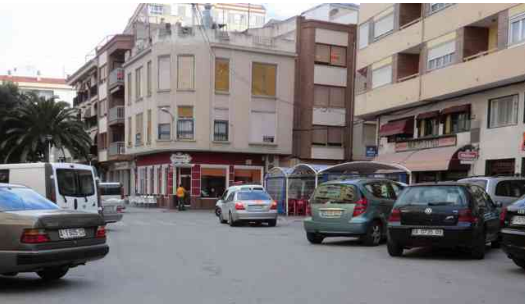
La zona del Derrocat, siempre está colapsada de vehículos