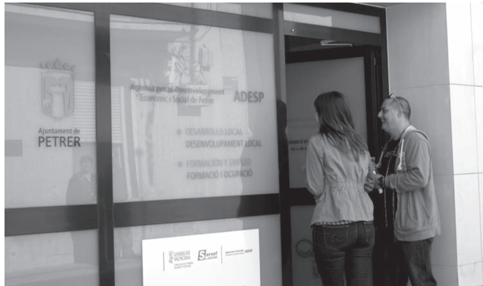
Dependencias de la Agencia de Desarrollo Económico y Social de Petrer, en la calle Luis Chorro