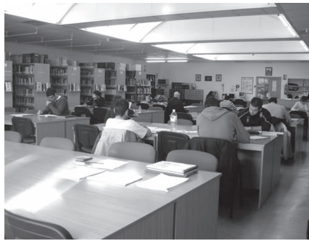
La biblioteca es uno de los lugares más frecuentados por los opositores

También piden que se restablezcan los temarios para oposiciones a profesor de Secundaria