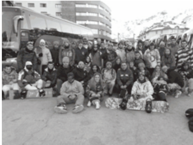
El grupo de jóvenes a su llegada a Sierra Nevada