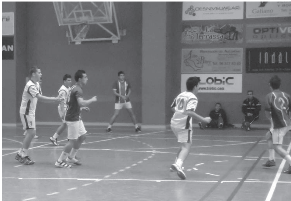
Bm. Petrer cadete

El Sporting Salesianos es el rival del Bm. Petrer este sábado a las 18:30 horas, en el pabellón municipal