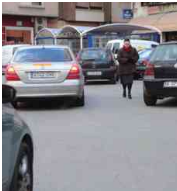
La zona azul afectaría a cuatro calles

acuden gran cantidad de vecinos de la población. En este perímetro urbano donde se demanda la zona azul gratuita se encuentra el Ayuntamiento, el Mercado Central, la Agencia de Desarrollo Económico, Servicios Sociales, la oficina de Urbanismo, las dependencias de SUMA, Gestión Tributaria, el SERVEF (oficina de empleo), el Centro Cultural y la biblioteca, la Oficina de Cultura y el Museo Dámaso Navarro. Asimismo, existen seis entidades bancarias, la oficina de Aguas de Alicante y alrededor de treinta y cinco comercios con muchos años de funcionamiento, aparte de los puestos de venta del maltrecho Mercado Central.