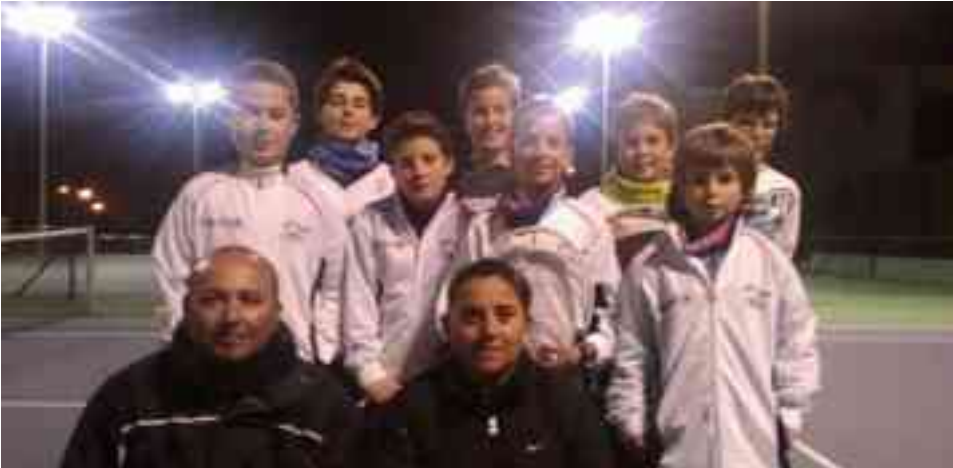
Equipo alevín masculino

El club petrerense toma parte en el Deportes Amorós "Junior Tour" con un total de 78 jugadores en las diferentes categorías