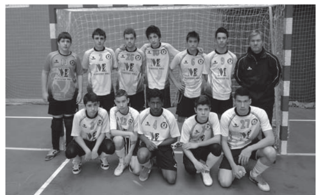
FS Petrer cadete

El juvenil sí ganó su partido al San Fulgencio por un rotundo 7-1. Este sábado, a las 16:30h, visitan la cancha de la Sagrada Familia de Elda ●