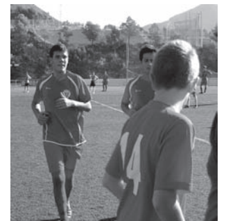
U.D. Petrelense cadete A

Los de Vicente Soler han mejorado su juego y se acercan a la salvación