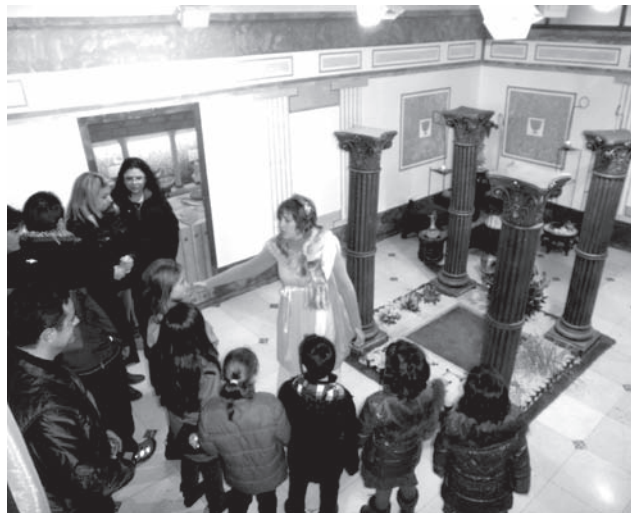
Agripina dando la bienvenida a la exposición

Está previsto que se realicen actividades, dirigidas a niños y niñas, en el que no faltarán personajes romanos que se