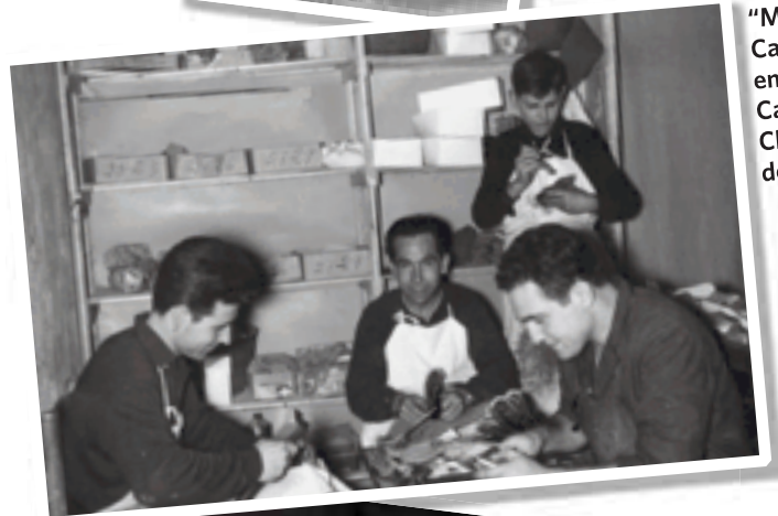
"Mosqui", Cayo y Vicent en la fábrica Calzados Cheris. Marzo de 1964