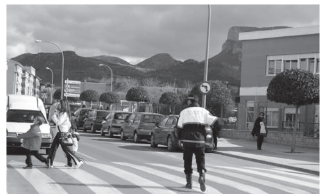
Agente de la Policía Local de nuestra localidad

san 6. También, ha apuntado que de lunes a viernes el turno de noche está compuesto por un total de 5 agentes que se refuerza el fin de semana con al menos dos más. Además, ha comentado que con este cambio lo que se consigue es que la calidad del trabajo que realizan los agentes sea mayor ya que conocen los "entresijos" de las noches