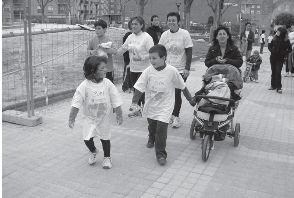
Imagen de archivo. Carrera Solidaria "Por la Esperanza"

Por otra parte, ha apuntado que "Sense Barreres" ha puesto en marcha una