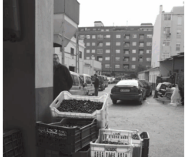
Almazara de la Cooperativa Agrícola de Petrer

La vecería del olivo y algunas circunstancias meteorológicas adversas parecen ser la causa