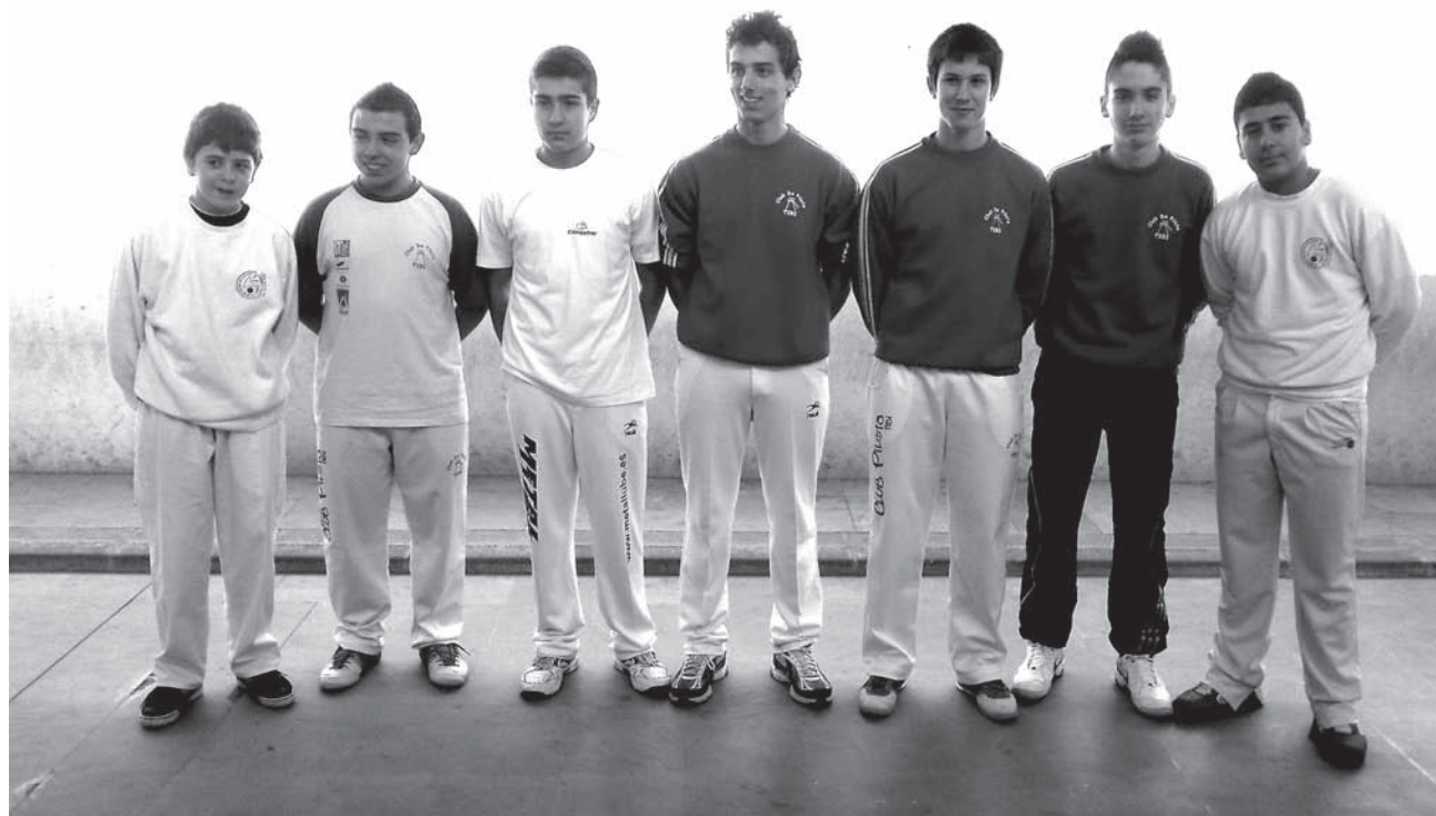
Finalistas de galotxa

El infantil cayó en la pista del Denia 98 por 75-9. Este sábado, a las 10:30 horas, reciben al Teixereta de Ibi A. El alevín se impuso 24-23 al Crevibasket y este sábado, a las 12 horas, visitan al Montemar B. ●