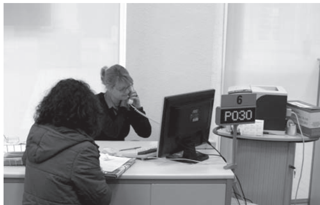
Oficina del SERVEF, en la Plaza Pablo Iglesias

Por sectores, el desempleo ha subido en Agricultura con 435 parados más, en Construcción con 110 y en Servicios con 422 más mientras que ha bajado en Industria con 4 menos y en Sin Empleo Anterior con 11 menos. En lo que respecta a