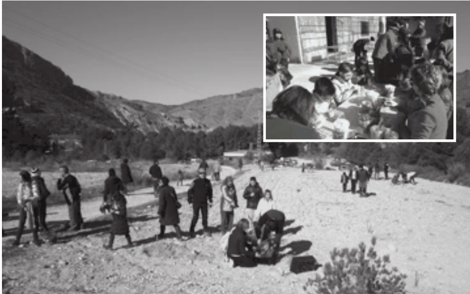
Imagen de la plantación del pasado domingo

Después de varios años sin hacerla, en esta ocasión la plantación sí se ha llevado a cabo