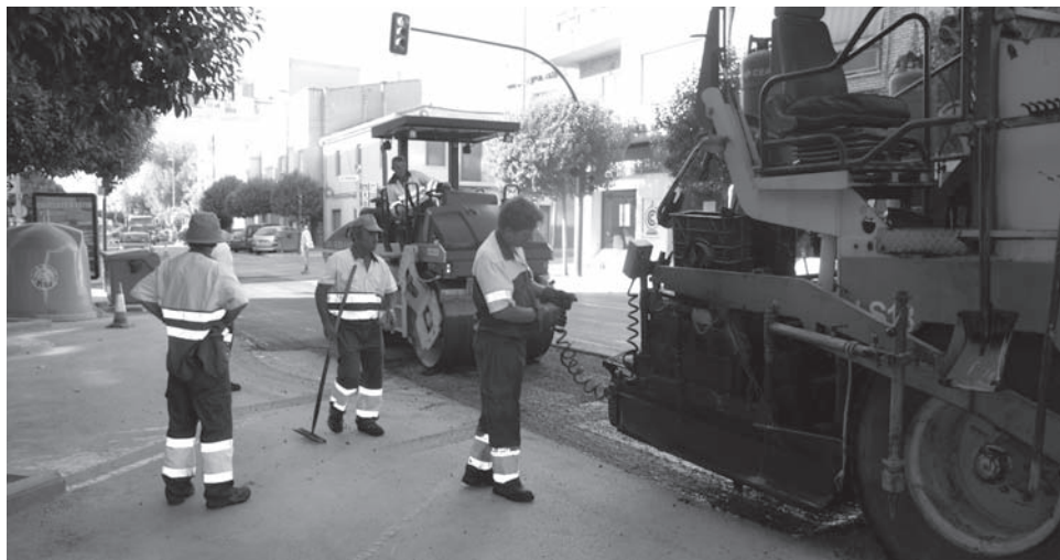
Trabajadores de una empresa en labores de asfaltado

Es la primera iniciativa parlamentaria que ha elevado Izquierda Unida al Congreso de los Diputados