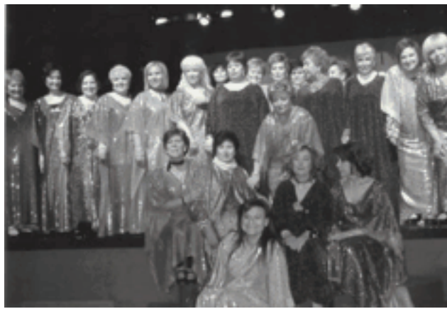
Imagen de las protagonistas del espectáculo "Viaje a la felicidad"

dad" en el que los personajes de diferentes "sketch" contando sus problemas del día a día y explicando a la vez posibles alivios y soluciones siempre relacionados con el mundo del ocio y entretenimiento, se fueron intercalando con actuaciones musicales en los que no faltaron las sevillanas, el charleston y un repaso por la música que ha marcado las últimas décadas con canciones tan conocidas con las de la banda sonora de la película "Grease". Un espectáculo con el que las "Amas de Casa" quisieron