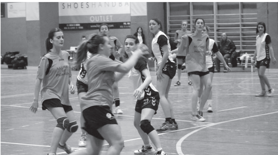
San Boni