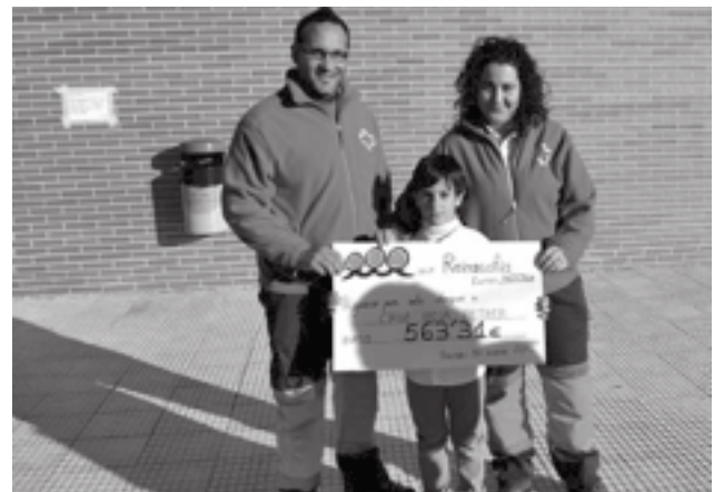
Técnicos de Cruz Roja en el colegio "Reina Sofía"