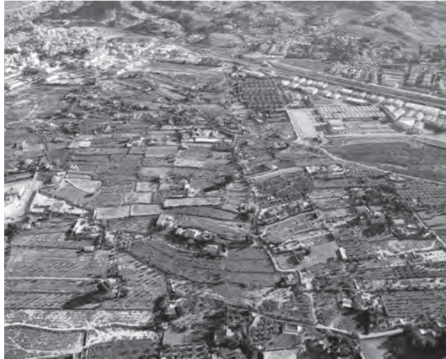
Panorámica aérea de la Almafrá

Ha añadido que afecta a todo el terreno del término municipal de Petrer que está declarado como