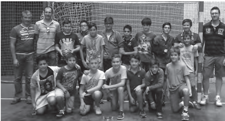
Hispanitas Petrer Infantil B