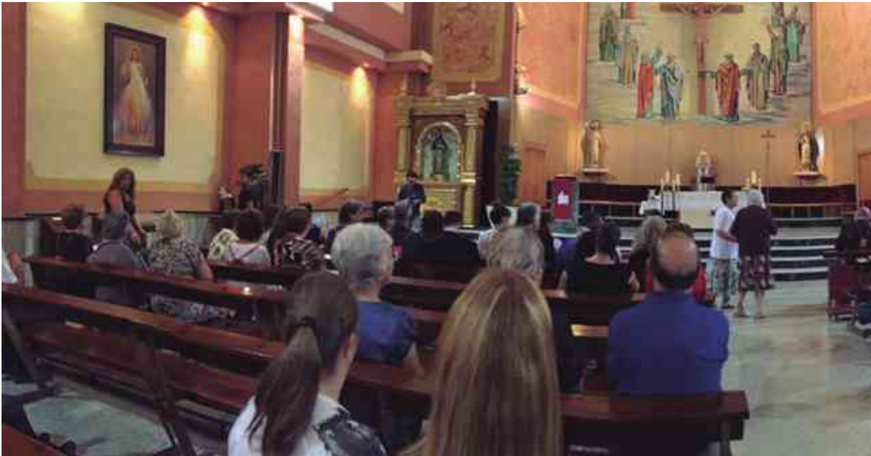
Iglesia de la Santa Cruz donde el pasado 13 de septiembre el Obispo de la Diócesis Orihuela-Alicante abrió el Año Jubilar con la celebración de la Santa Misa y la lectura de la "Bula del Jubileo"