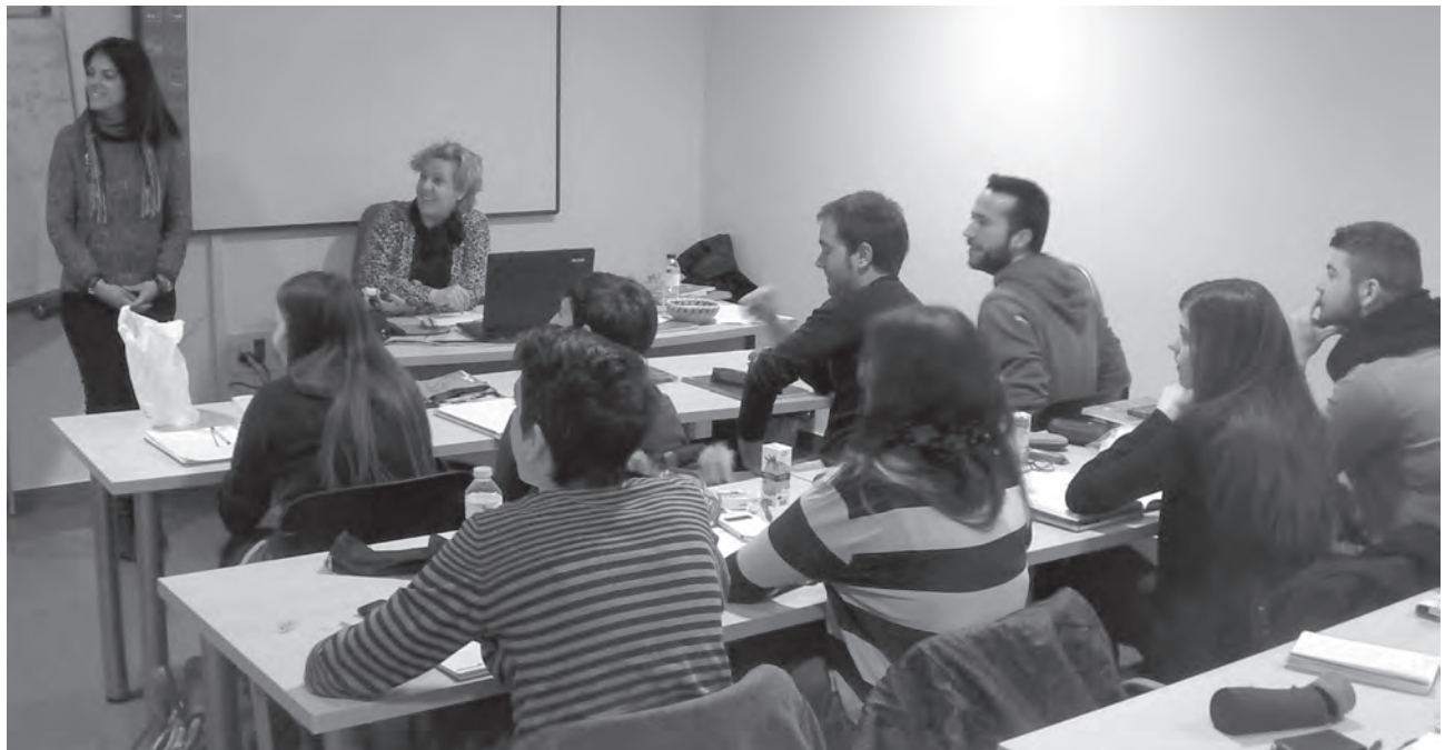
Imagen de archivo de uno de los cursos de formación impartidos por la ADESP