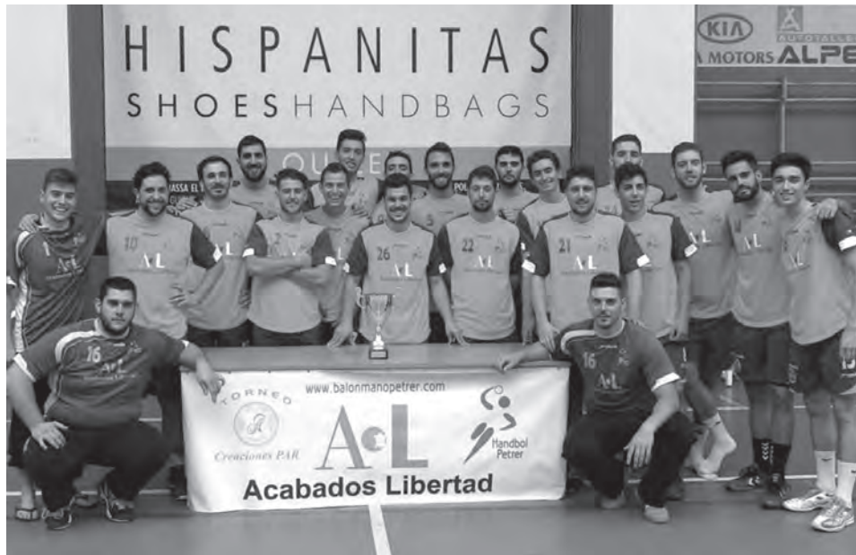
Hispanitas Petrer, subcampeón del Creaciones Par

Esta semana toca seguir con la preparación de pretemporada y para ello el cuadro