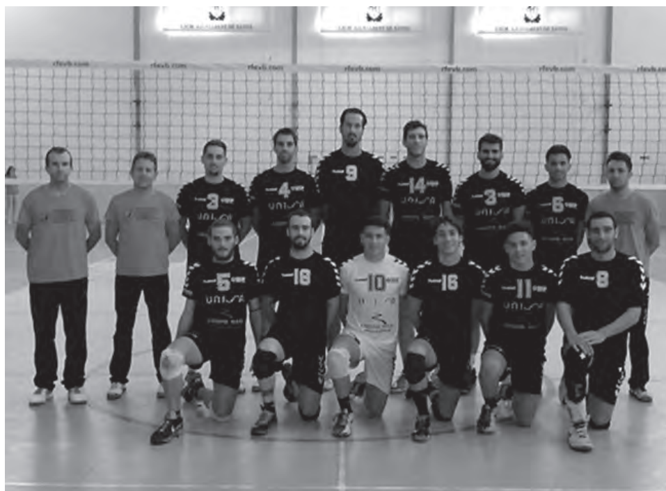
SDVP en Xàtiva