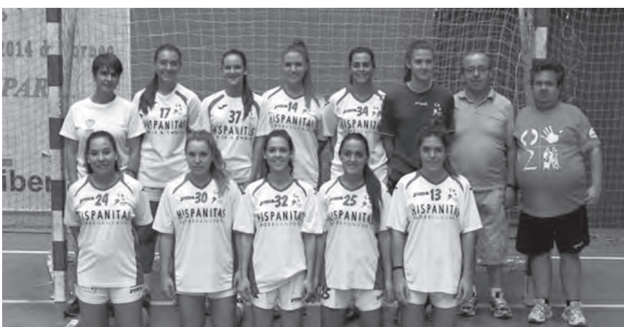
Hispanitas Petrer cadete femenino