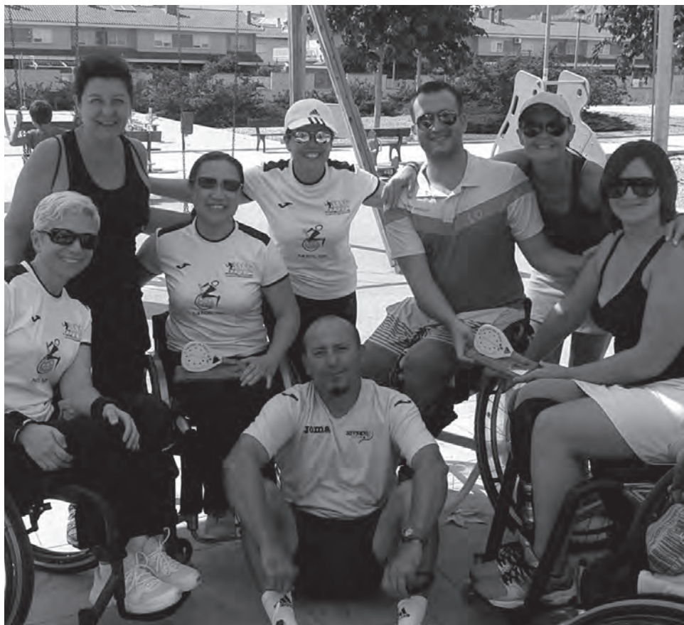
Participantes en el I Torneo de Pádel Asprodis