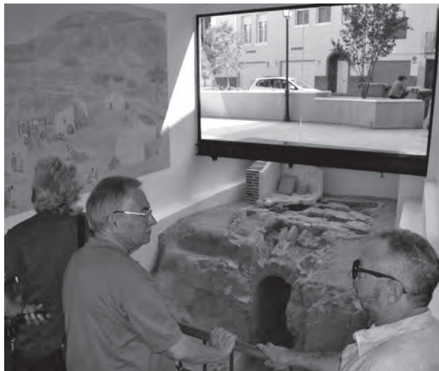
Momento de la visita al Horno Romano de un grupo de personas