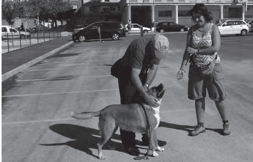
Imagen de unos vecinos junto a su perro

Ramón Poveda ha justificado la eliminación de la tasa a parking comunitarios de más de 10 vehículos señalando que los vecinos ya abonaban los impuestos correspondientes a través de la tasa de vados y del IBI por lo que, gravarlos con esta tasa adicional, no es sino un sinsentido cuando, además, estos aparcamientos facilitan el que se descongestione el espacio disponible en las vías