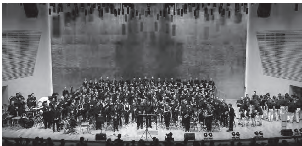
Imagen del concierto celebrado en el Auditorio de la Diputación de Alicante

Algunas de las piezas que interpretaron fueron "Somni Andalús", "Carrer de l'Alegria", "Arrop i tallates" y "La Muixeranga" ●