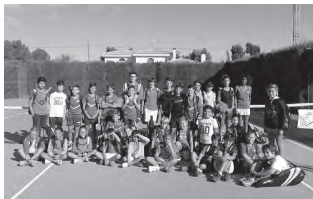
Jugadores del C.T. Petrer en Villena

saltar la fantástica jornada tenística que un buen número de integrantes del Club Tenis Petrer vivieron el pasado fin de semana en las instalaciones del Circulo Agrícola Villenense donde 31 raquetas, de entre 8 y 16 años, disfrutaron de una convivencia a modo de confrontación amistosa contra los jugadores locales. Los de Petrer lo dieron todo y algo más en cada partido que disputaron. ●