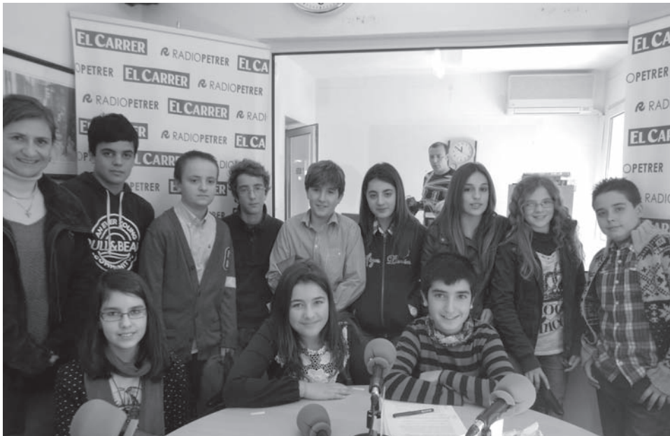
Imagen de los once alumnos y alumnas durante su visita a Radio Petrer

Los estudiantes recibieron un reconocimiento municipal en el salón de plenos