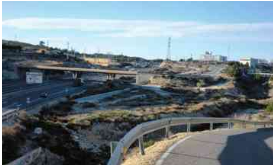
En la entrada norte a Petrer no aparece señalizado el Polígono Les Pedreres