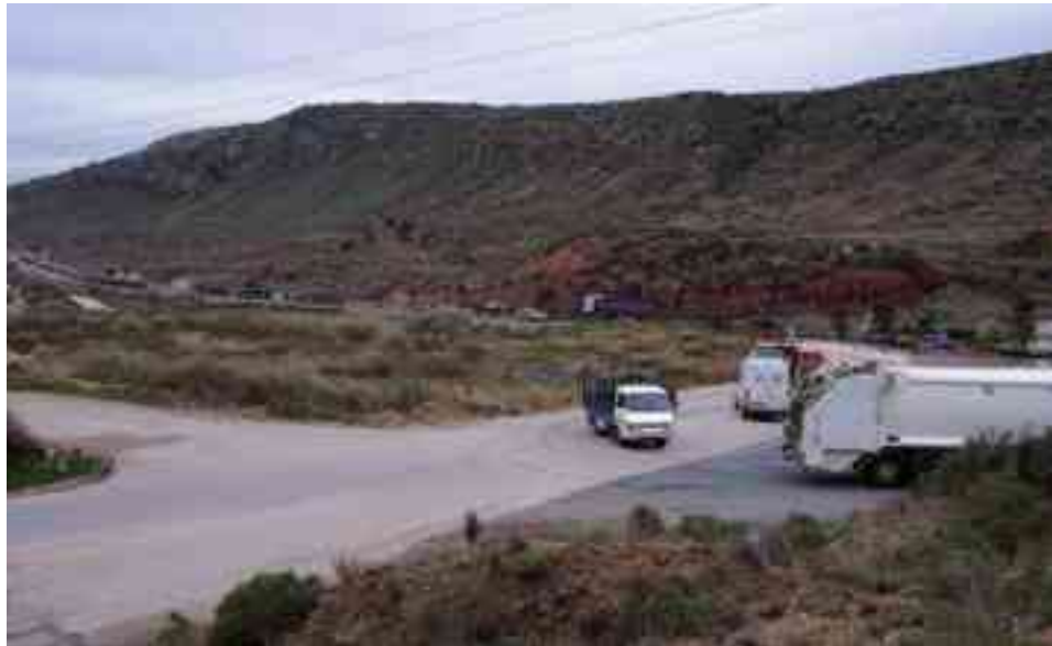
Terrenos donde está previsto que se construya la ITV