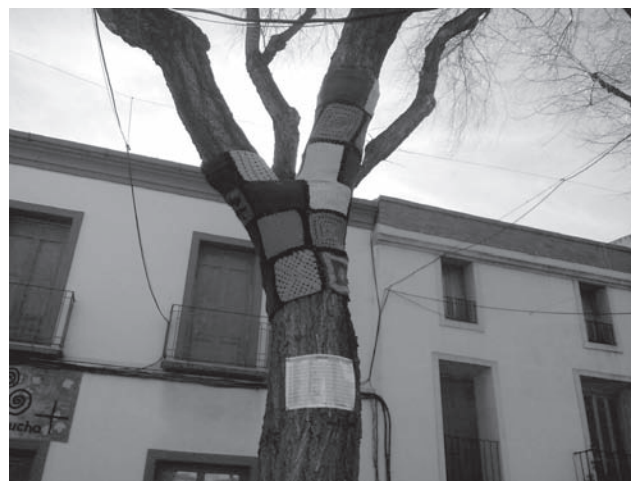
Primer árbol de la Plaça de Baix vestido

rios, uno para 6 niños, otro para 6 niñas y un tercero para dos hermanas que ejercerán de madres/tías y dormirán con los recién nacidos y con aquellos niños que necesiten una atención continuada. Además, según ha añadido Vicenta Jover, la casa contará con un "Referitorio", cocina y sala de estar. Un hogar, en definitiva, en el que las hermanas cuidarán a los huérfanos en un entorno familiar, se preocuparán de su alimentación, salud y educación, matriculándolos en la escuela y proporcionándoles una vivienda donde crecer hasta ser adultos y ser capaces de valerse por sí mismos. ●