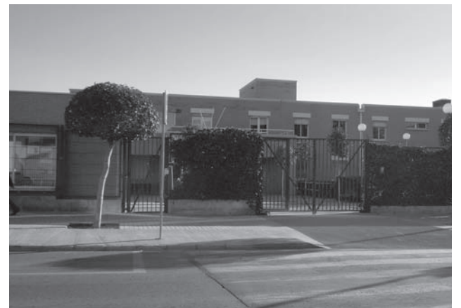
Imagen del IES "Paco Mollá"

El pasado martes los estudiantes de secundaria de toda España iniciaron una huelga de tres días contra la Ley Orgánica para la Mejora de la Calidad Educativa, LOMCE, y los recortes en materia de educación y, además, exigiendo la dimisión del Ministro de Educación, José Ignacio Wert. Una huelga que concluyó este jueves con una manifestación, convocada por el "Front Estudiantil de les Comarques del Sud", que partió desde la rotonda de la Estación de Autobuses de Petrer para concluir en la Plaza del Ayuntamiento de la vecina población de Elda.