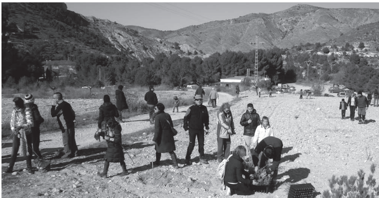
Imagen de archivo de la plantación del año pasado