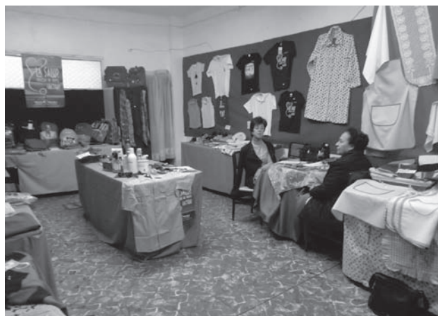
Imagen de archivo. "Rastrillo" de Manos Unidas, en la calle Gabriel Payá