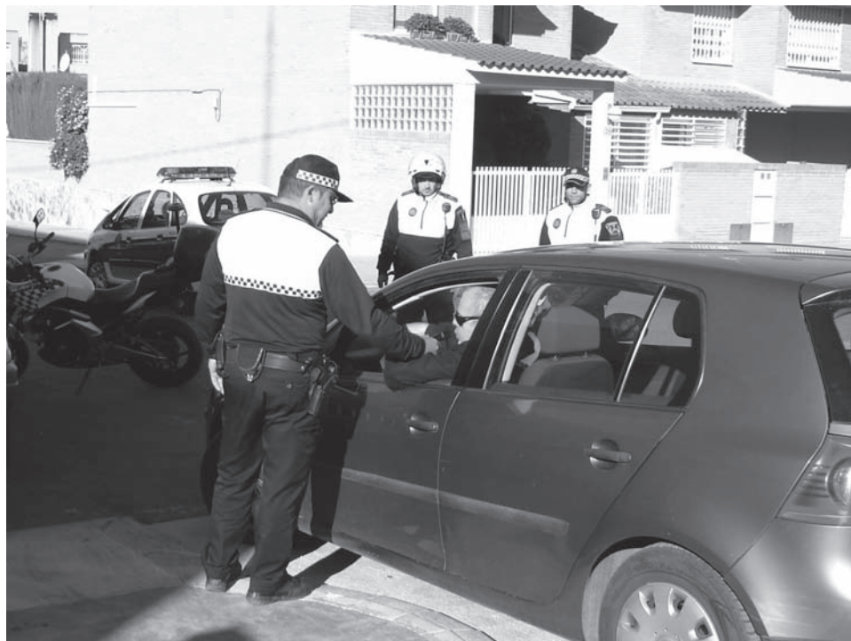
Imagen de archivo. Control de la Policía Local de Petrer

de la vía pública, de los que se tramitó su baja tal y como marca la normativa vigente en esta materia y, además, se atendieron 9.796 servicios demandados por los vecinos, una media de 26 al día, lo que supone un incremento del 3% respecto al año 2011. Servicios, ha puntualizado el delegado de Tráfico y Gobernación,