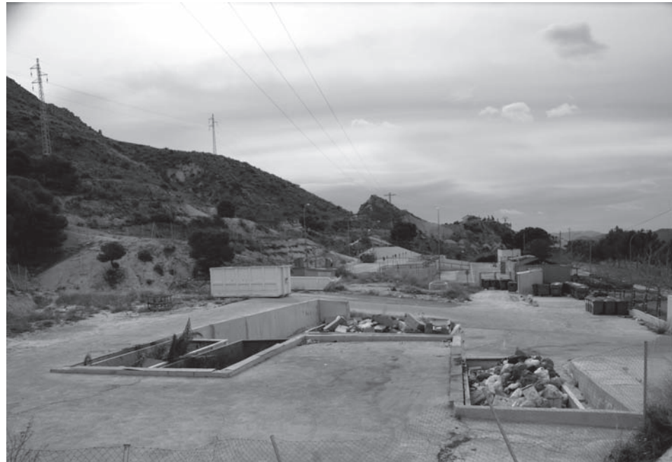
A partir de este mes, los vertidos de inertes se deben depositar en el Ecoparque de Cuatrovientos