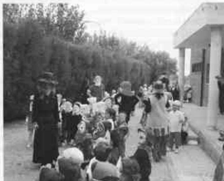
Celebració de carasses