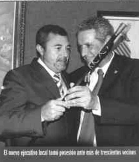
El nuevo ejecutivo local toma posesión ante más de trescientos vecinos.