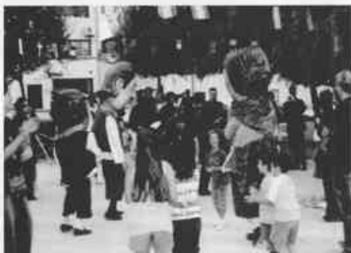
Ninos en las danzas tradicionales con los nanos y la celta.