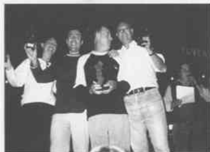
Ganadores de los últimos juegos de mesa organizados en el barrio

Dentro de las actividades que ha puesto en marcha la asociación para la nueva temporada de otoño-invierno son el taller de bailes de salón en el que hay diez parejas pero todavía queda abierta la inscripción para aquellos que deseen participar, así como los navegues que están completamente subvencionados por Consellería y que se pondrán en marcha durante las vacaciones navideñas de los niños. Ambas actividades se desarrollan en la sede social que este año estrenó aire acondiona-