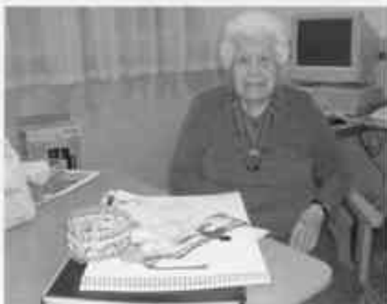
Sentada junto a una muestra de su pintura y de las manualidades que realiza.