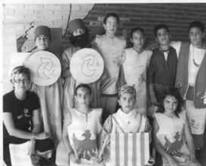
Representació teatral al voltant del 9 d'octubre i ball de bastonets

Les festes constitueixen una oportunitat útil a l'hora de treballar la interdisciplinarietat, la socialització i la diversió de tots i totes. Ací teniu una mostra: