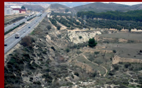
PETRER PROYECTA UN POLÍGONO PARA GRANDES EMPRESAS