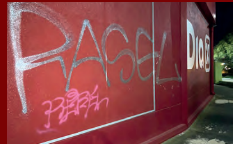
LOS GRAFITEROS VUELVEN A LAS ANDADAS