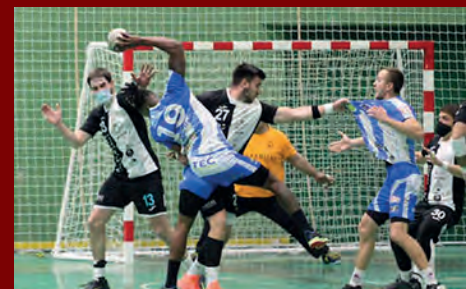
ELDA-PETRER, EL DERBY SE JUEGA EL SÁBADO EN EL CEE