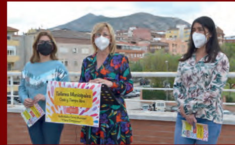
ABIERTA LA INSCRIPCIÓN DE LOS TALLERES MUNICIPALES