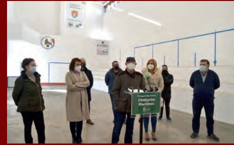
SOM DE PETRER: UN TRINQUET MUNICIPAL PER A PETRER