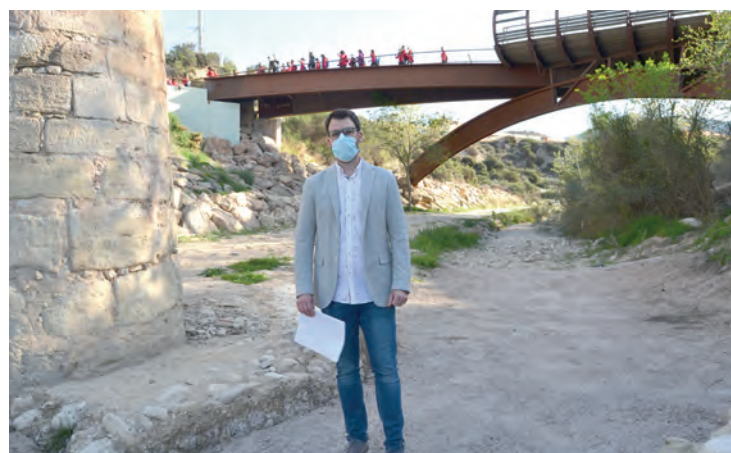
El concejal de Patrimonio junto a una de las bases del acueducto

La concejalía de Patrimonio Histórico ha concluido las obras de consolidación del Acueducto de San Rafael en las que ha invertido 43.200 euros, aunque el 65% de esa cuantía ha sido aportada por la Consellería al estar catalogado como Bien de Interés Cultural (BIC). Las riadas y escorrentías de lluvias de la última década