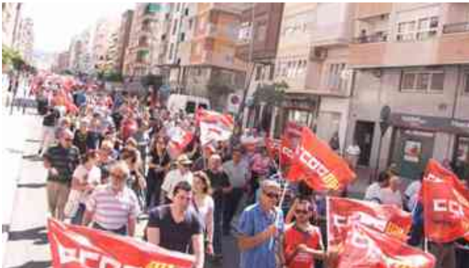
Manifestación de Día del Trabajador, convocada por los sindicatos UGT y CCOO

La manifestación la encabezaba una gran pancarta reivindicando un empleo de calidad y una cohesión social. Pero no fue la úni-