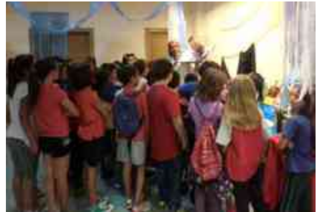
Taller de Lectura, "Seres del mar", en el Centre Cultural

Asimismo, ha apuntado que esta actividad supone para los alumnos un viaje al fondo del mar donde se les incita a vivir la aventura de leer pero también a respetar y conservar el medio ambiente.