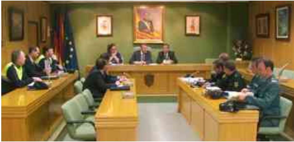
Reunión de la Junta Local de Seguridad Ciudadana, en el Salón de Plenos del Ayuntamiento de Petrer

En este sentido, el concejal de Gobernación ha apuntado que la Policía Local va a