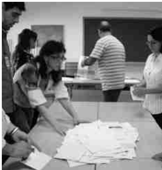
Imagen de archivo del recuento de votos en una mesa electoral en 2009