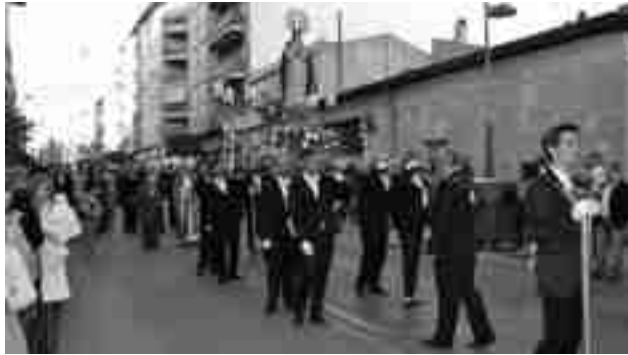
Solemne Processó de la Santa Creu

president de la Comissió de Festes, va fer un balanç molt positiu de les festes, sobretot de l'Esmorzar Popular, sempre molt participatiu. Respecte als actes previstos per al cap de setmana passat, cal recordar que la programació es va desenvolupar dissabte, Dia de la Santa Creu, amb la tradicional Cavalcada que va partir de l'avinguda de Madrid, a l'altura del col·legi Rambla dels Molins; i posteriorment, la Santa Missa en honor de la Santa Creu que donà pas al Concurs de Creus Florides. Les Festes de la Santa Creu