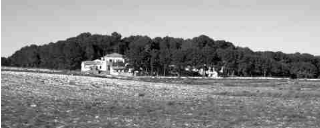
Finca de El Poblet