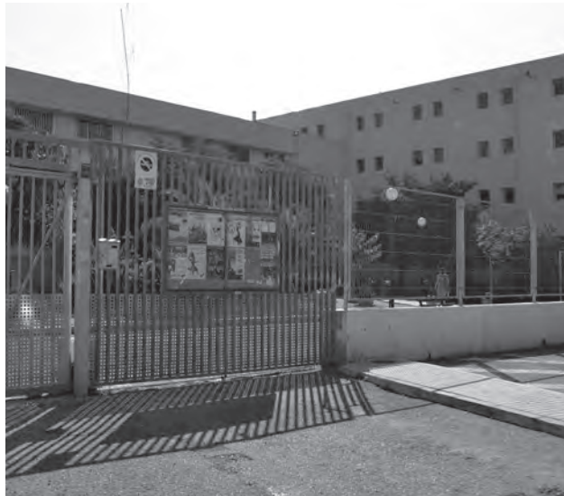
Imagen del exterior del instituto Azorín