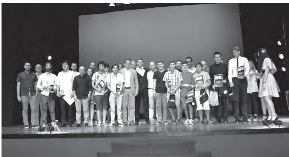
Fotografía de familia de todos los galardonados junto con algunos miembros del jurado, patrocinadores y autoridades municipales