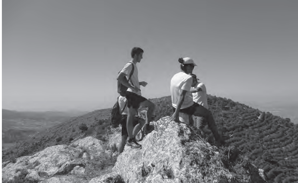
Imagen de archivo. Voluntarios medioambientales vigilando los montes de nuestra localidad