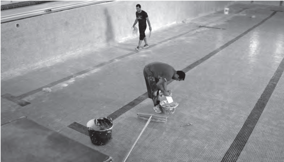
Varios conserjes municipales dentro del vaso grande de las piscinas de San Fernando realizando tareas de reparación

Los trabajadores del recinto y miembros de la Brigada de Servicios del Ayuntamiento están llevando a cabo las actuaciones