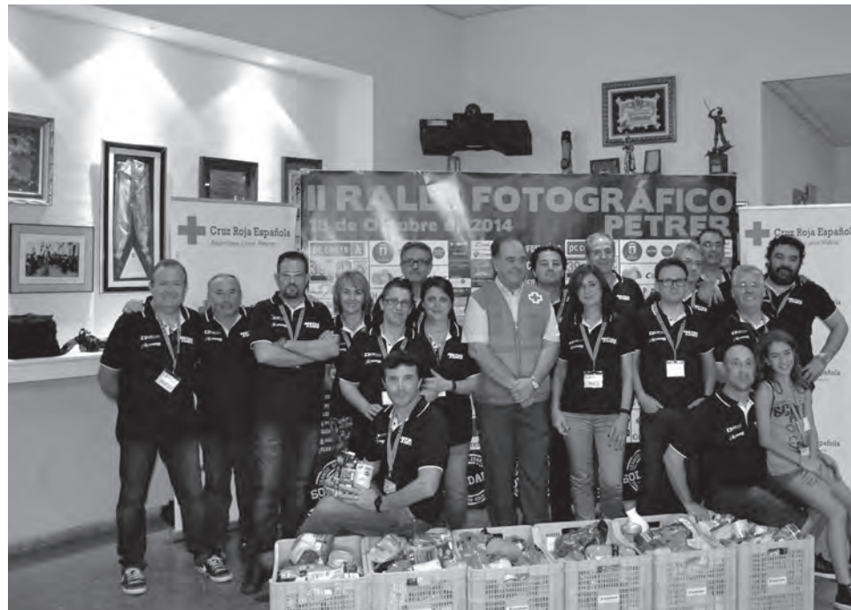
Foto de familia de algunos componentes del Grupo Fotográfico Petrer con el presidente de Cruz Roja el día del "Rally" de 2014