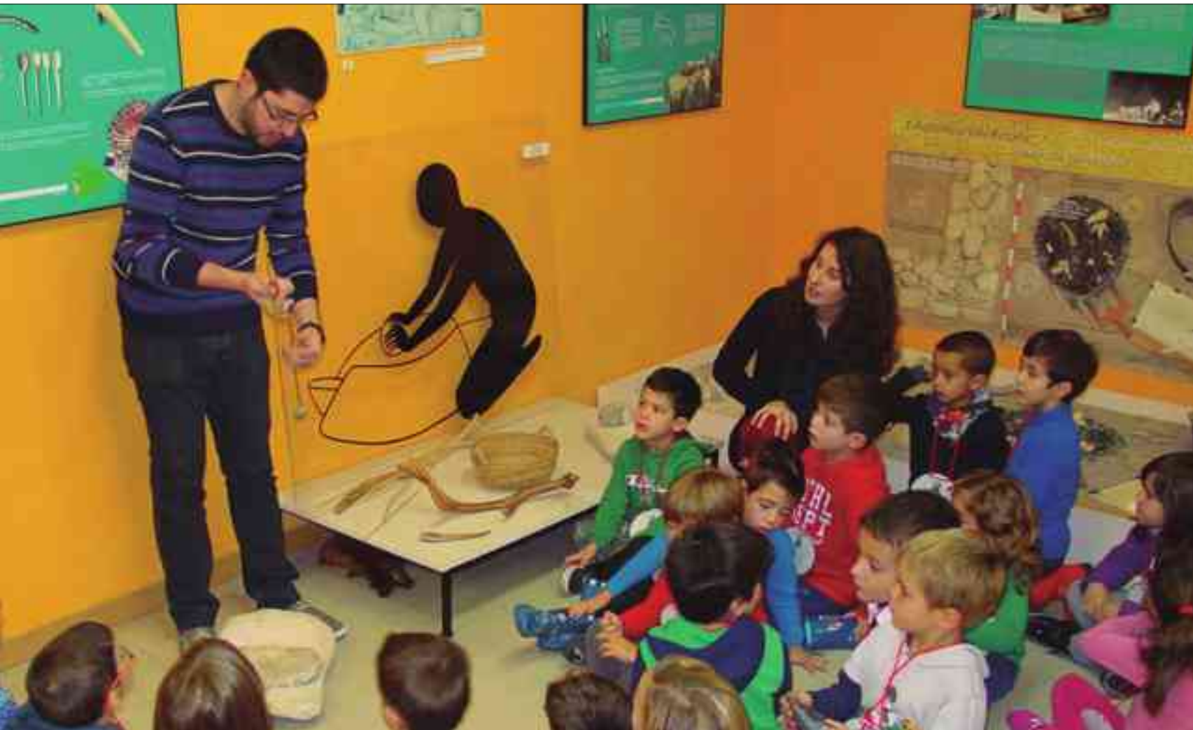
Grupo de escolares en una de las visitas al museo Dámaso Navarro