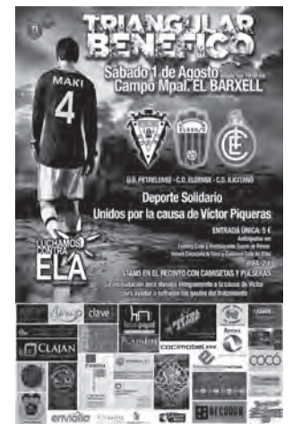
Cartel del triangular