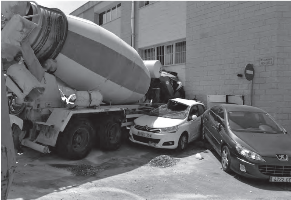
Estado en el que quedó la fachada y los vehículos empotrados contra ella

Ocurrió en la Avda. Hispanoamérica y afortunadamente no hubo que lamentar daños personales