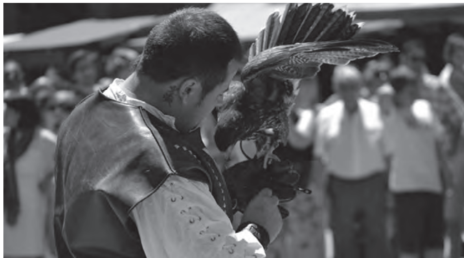
Imagen de archivo. Espectáculo de cetrería en el Mercado Medieval