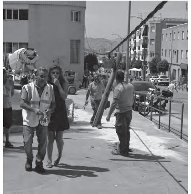
Imagen del recorrido aproximado que hizo la hormigonera

Todo ocurrió en la mañana del pasado viernes en la Avda. de Hispanoamérica, a la altura del colegio "La Foia". Allí, la empresa Aguas Municipalizadas de Alicante está acometiendo obras de mejora en la red, excavando y tapando zanjas, cuando de repente, uno de los camiones hormigonera que en ese momento estaba parado y sin conductor, comenzó a desplazarse hacia abajo siguiendo la inercia de la pendiente. En su recorrido