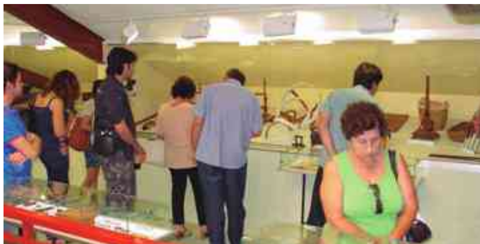
Visitantes en unade las jornadas de puertas abiertas

mentar en ellos el placer de saber y conocer aspectos de su pasado y de las antiguas civilizaciones que habitaron en estas tierras. En muchas ocasiones utilizando juegos y utensilios manejables y adaptados a los pequeños para despertarles la curiosidad. Precisamente a ellos van dirigidos una serie de talleres educativos que se desarrollan a lo largo de todo el curso y en los que participa el alumnado de Infantil, Primaria y Secundaria. Para los más pequeños están las "maletas didácticas" en las que se guardan utensilios y objetos que tienen que ver con la prehistoria, época romana, etc ..., y para los más mayores, cuadernillos para poder hacer sus propios apuntes de lo que encuentran en el Museo y basándose en las explicaciones que les da el arqueólogo. Estas visitas escolares han contribuido notablemente a incrementar la estadística