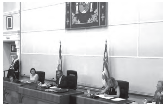
Pascual Díaz presidiendo la sesión constitutiva de la Diputación Provincial

agradecer públicamente al presidente de esta administración la confianza que ha depositado en él. También, ha puntualizado que "lo esencial no es dónde estás sino que lo importante es el gran equipo que seguimos con la misma ilusión de trabajar desde la Diputación por todos los municipios de la provincia de Alicante".