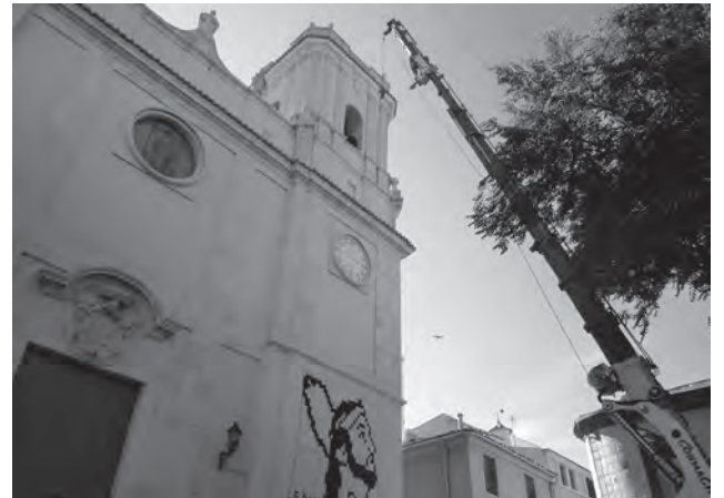
Imagen de los instantes previos a la bajada de las campanas averiadas

En la primera colecta extraordinaria llevada al efecto se recogieron 1.500 euros