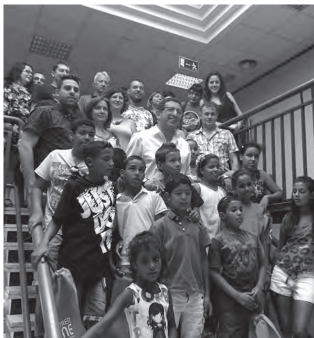
Foto de los niños saharauis junto a miembros del consistorio y familias de acogida

Cabe recordar que la presencia de los jóvenes saharauis este verano en nuestra comarca ha sido posible gracias a las gestiones de la O.N.G. "Amigos del pueblo Saharaui de Elda-Petrer". ● S.A.R.