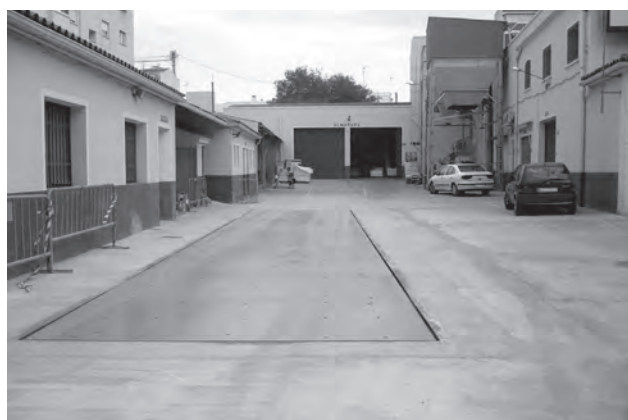
Imagen de la nueva báscula