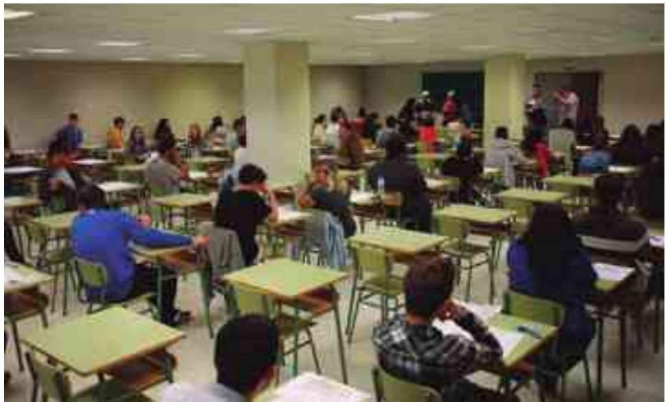
Imagen de estudiantes tomando parte en una de las jornadas de las pruebas de acceso a la Universidad (P.A.U.)