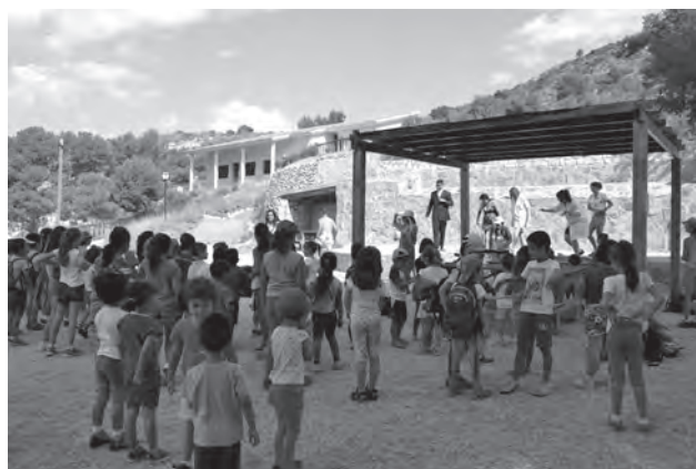
Distintos niños participando en una de las actividades de la Escuela de Verano

No obstante, ha puntualizado que como suele suceder cada año a partir de esta misma semana la asistencia de niños a la "Escuela de Verano" se reduce, principalmente en la "Finca Ferrussa", puesto que algunos padres ya están de vacaciones. Para el mes de agosto la participación en esta actividad, que se va a desarrollar en el colegio "9 d'Octubre" hasta el viernes 14, va a ser de unos 50-60 niños. ● A.B.G.