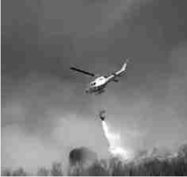
Imagen izquierda tomada mientras el helicóptero tiraba agua en la zona