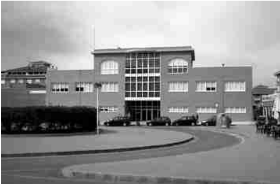
Imagen del Centro Municipal "Las Cerámicas"