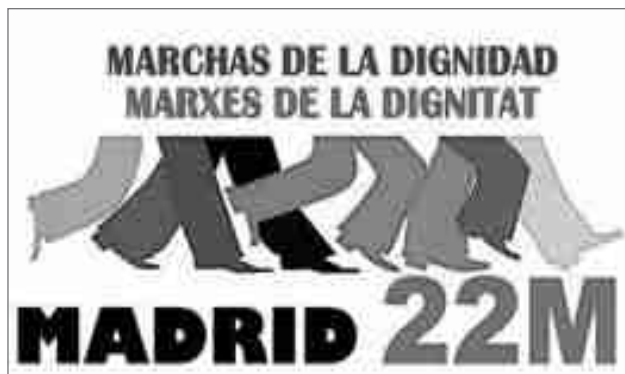
Logotipo "Marcha por la Dignidad"

De momento están previstos tres autobuses, uno para Sax y Villena y dos para Elda y Petrer, contando también con las personas de Monóvar y otros puntos limítrofes que tengan pensado viajar con este sistema. Estos tres autobuses ya están prácticamente completos y se ha pensado en poner uno más. La colaboración para el viaje es de 20 euros, pensado para cubrir