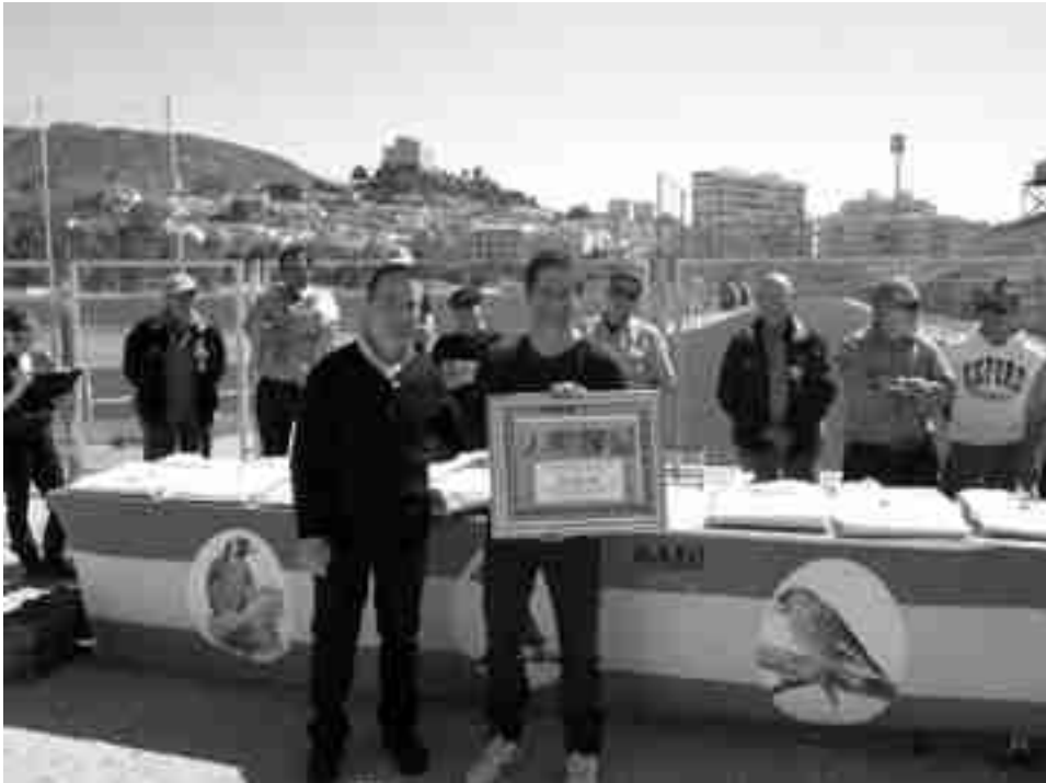
Momento de la entrega de trofeos

El concurso de pájaros cantores contó con la participación de 371 ejemplares distribuidos en las modalidades de pardillos, jilgueros, verderones, gafarrones y mixtos, reuniendo silvestristas de toda la provincia de Alicante y provincias cercanas. El nivel fue extraordinario y el jurado tuvo