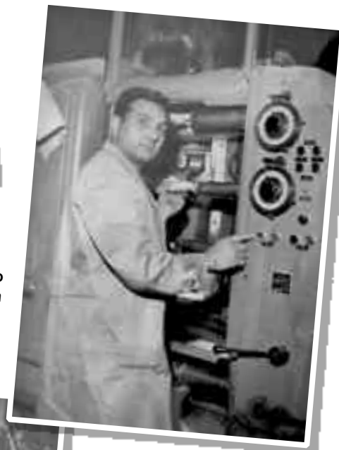
"Popeye" cuando estuvo en Milán (Italia) en el año 1968