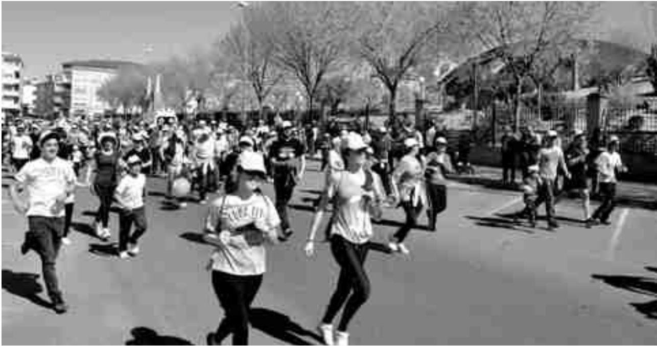
La Carrera Solidaria transcurrió por las inmediaciones del Parque Municipal "El Campet".