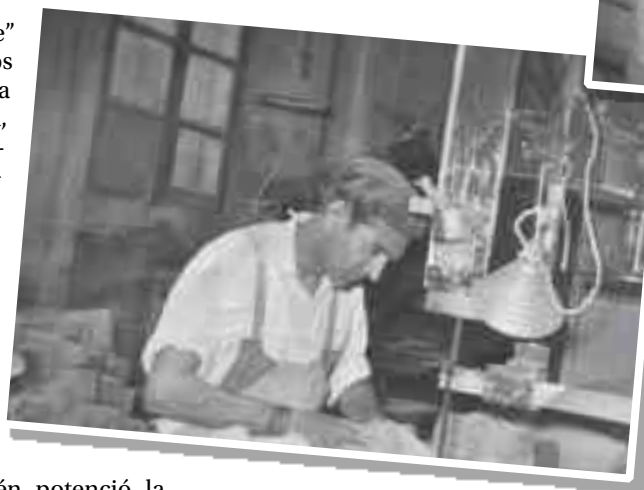
"Popeye" recortando madera para las hormas en la fábrica de Obrador. Año 1955