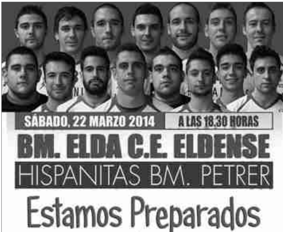
Hispanitas Petrer necesitan los puntos

E ste sábado se juega el esperado derbi entre Hispanitas Petrer y Elda CEE. Un derbi que llega en buen momento para los petrerenses que están exhibiendo su mejor nivel de juego de la temporada en las últimas jornadas, por el contrario, para los eldenses el encuentro les llega tras perder el liderato de