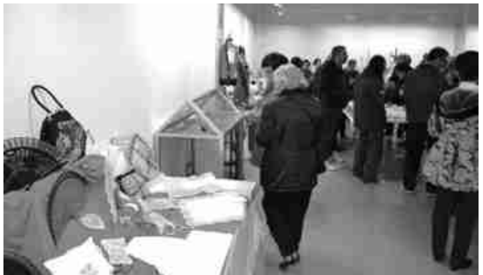
Exposición de los talleres de las "Amas de Casa" que se puede visitar en el Centre Cultural