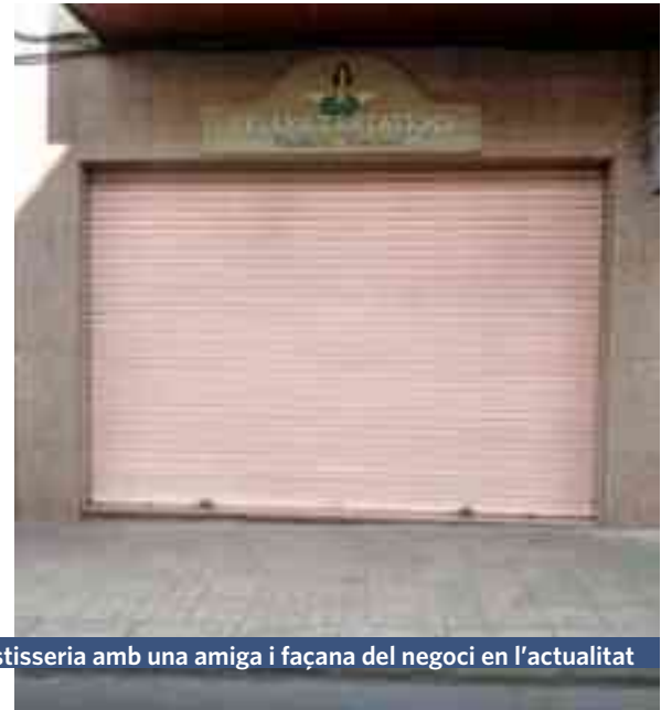
A la porta de la pastisseria amb una amiga i façana del negoci en l'actualitat