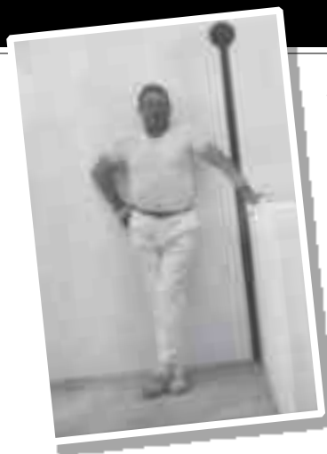
"Popeye" vestido de pelotari en el trinquete de Petrer. Año 1987

"Popeye" siempre ha tenido una especial afición por jugar a la pelota valenciana