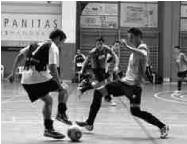
FS Petrer juvenil

El equipo infantil cayó en Alicante frente al Akrasala