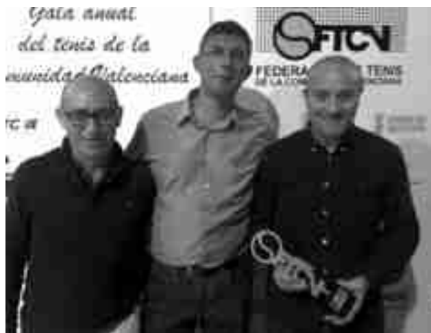
C.T. Petrer veteranos

Tres de los integrantes del equipo de veteranos del Club Tenis Petrer que esta temporada se proclamaron campeones de segunda división autonómica, estuvieron presentes en la Gala del Tenis