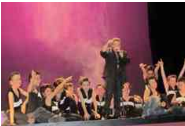
Una de las actuaciones

Desde su primera edición, esta actividad pretende acercar diferentes culturas musicales a los alumnos del centro y, también, al mismo tiempo, que disfruten de estar con sus compañeros en un entorno distinto al aula. Este año, el festival fue titulado "Demasié pal cuerpo" y, el contenido, un homenaje a la música y cultura de los años 80 que dejó encantados al numeroso público que asistió al espectáculo. Dos exalumnas dieron vida a sendos discjockeys que llevaron el hilo conductor con referencias a la época, hablando desde los chistes de Jaimito hasta La Bola de Cristal, y Kit, El coche fantástico, pasando por las