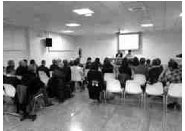
Imagen tomada durante la celebración del acto

Por último, ha adelantado que en breve se va a presentar el "Portal del Consumidor". ●