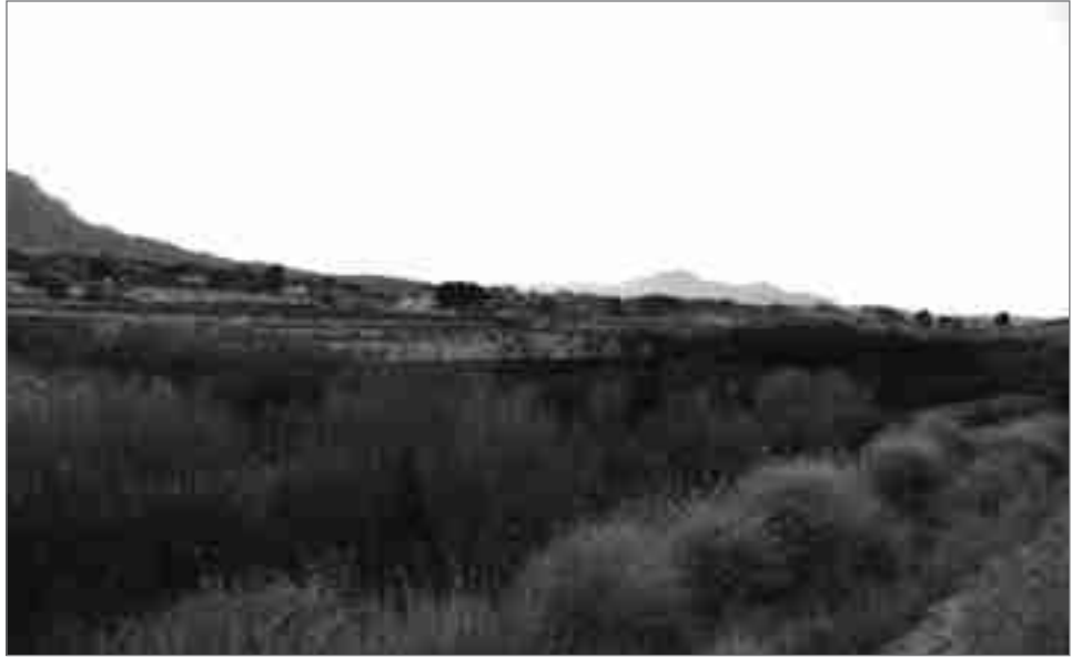
Fotografía realizada a las seis y media de la tarde, una vez controlado