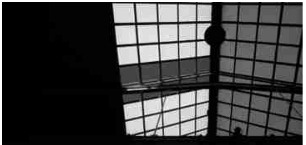
Durante unos días el Pabellón estuvo acordonado debido a que una placa del techo se desprendió

les, se cerraron estas instalaciones deportivas ya que parte del techo del pabellón quedó al descubierto. Fue 24 horas después cuando una vez amainó el temporal de viento se volvió a colocar la placa del lucernario reforzando la sujeción y una unidad del Parque Comarcal de Bomberos comprobó que la techumbre estaba en buen estado y no peligraba su estabilidad. Pero ante este incidente, desde la concejalía de Deportes se ha decidido contactar con algunas empresas para firmar un convenio de mantenimiento tanto del techo del Pabellón Cubierto como de la