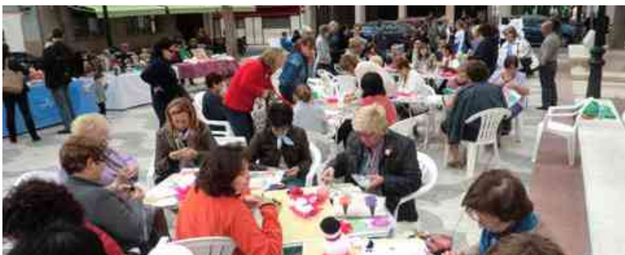
La Asociación "Més que art" participando en un encuentro de artesanía celebrado el pasado mes de noviembre

Agrupación de Agencias de Desarrollo Local de la Provincia de Alicante como una actividad conmemorativa más del Día Internacional de la Mujer. Concretamente, esta actividad se llevará a cabo el próximo miércoles 26 de marzo entre las 9.00 h y las 13.00 horas en el Fom Cultural y reunirá a mujeres en una exposición de sus trabajos y una mesa