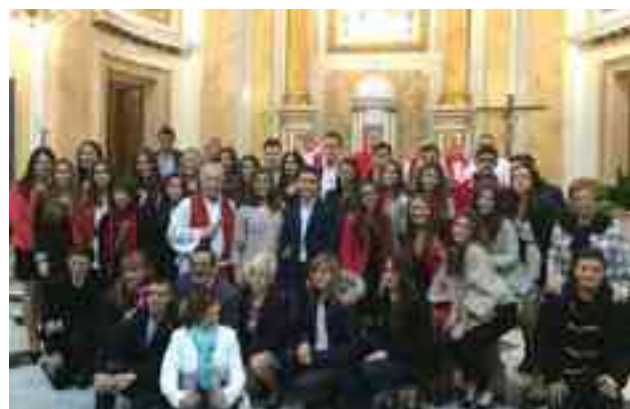
Foto de familia de todos los confirmantes

Además, comentó que "el Sacramento de la Confirmación no es un acto religioso únicamente para los confirmantes y sus familias sino para toda la comunidad parroquial de San Bartolomé y que la Confirmación es renovar un compromiso personal con Jesucristo". ●