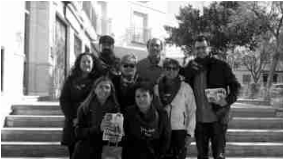
Concejales y militantes del PSOE recogiendo firmas contra la subida de las tasas deportivas

Aunque ya están recogiendo firmas desde hace unas semanas, fue el pasado sábado cuando salieron a recorrer distintas calles de nuestra población para informar a los vecinos sobre