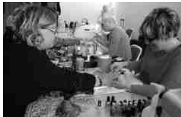
Imagen de archivo. Talleres "Cocinando la vida" en el Forn Cultural, 2012

En cada uno de los 36 países que van a participar en este Concurso Internacional de Maquillaje se ele-