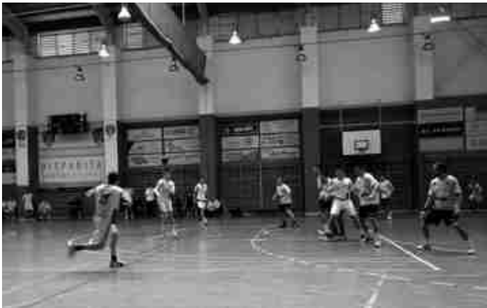
Hispanitas Petrer juvenil - M. Algemesí

En la segunda parte el juego del equipo mejoró muchísimo. La portería