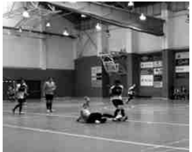
FS Petrer juvenil