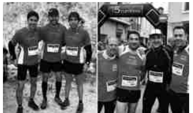
A la izquierda C.A. Petrer, a la derecha C.A. Petrer-Capet