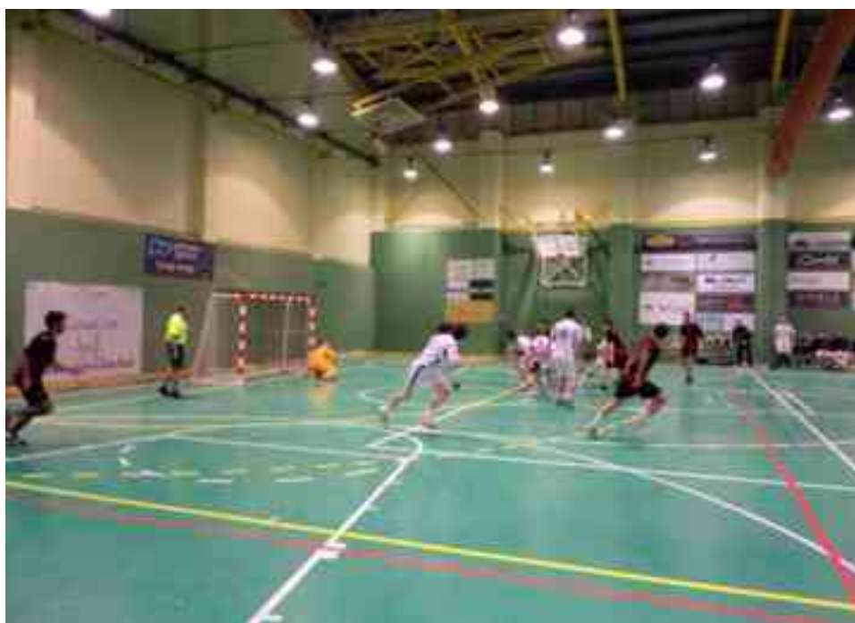
Hispanitas Bm. Petrer

Si consigue ganar a Quart del Poblet igualaría a los valencianos en la tabla con 17 puntos