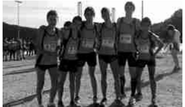
Equipo cadete de cross

El equipo del C.A. Petrer quedó en la 54ª posición en el nacional cadete de campo a través