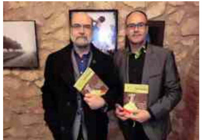
Instante de la presentación, en el Forn Cultural