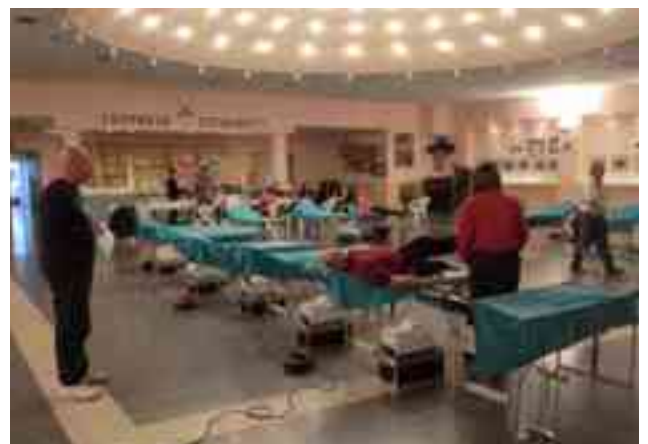
Momento de la donación de sangre en el "Campus"

También, comentó que se habían desestimado a cuatro donantes por distintos motivos y, además, explicó que en esta ocasión no se había hecho una llamada especial a personas de un determinado grupo