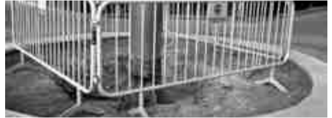
Uno de los pilares de la pérgola

El camino que da acceso a la "chabola del forestal" o a la silla de El Cid ya está reparado. Las obras comenzaron el pasado mes de enero y han concluido hace apenas unos días. No han consistido en un simple parcheado sino que ha sido un arreglo a conciencia para que dure el máximo tiempo posible en óptimas condiciones. Hay que recordar que este camino se deterioró mucho a finales de 2012 debido, sobre