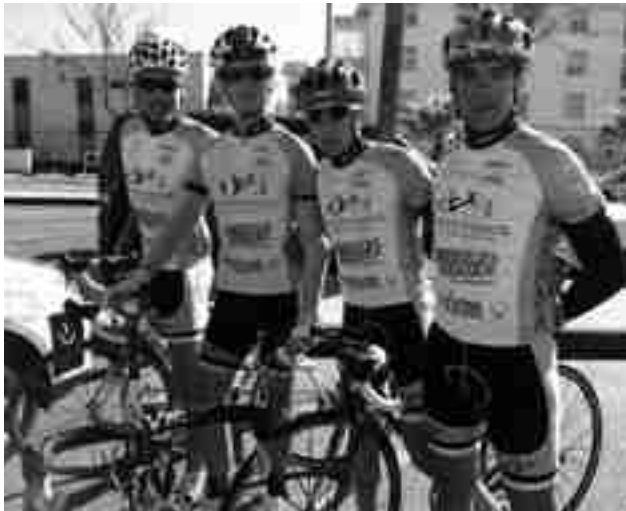
Los cuatro ciclistas en Don Benito