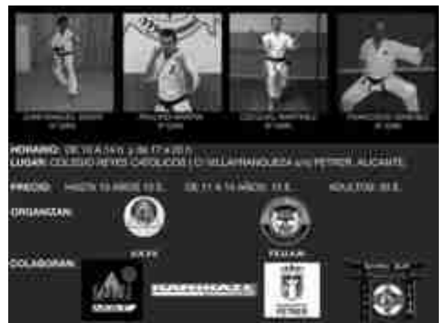
Cartel del curso

Se impartirán clases de Goju Ryu, Kyokushinkai, Shito Ryu y Shotokan