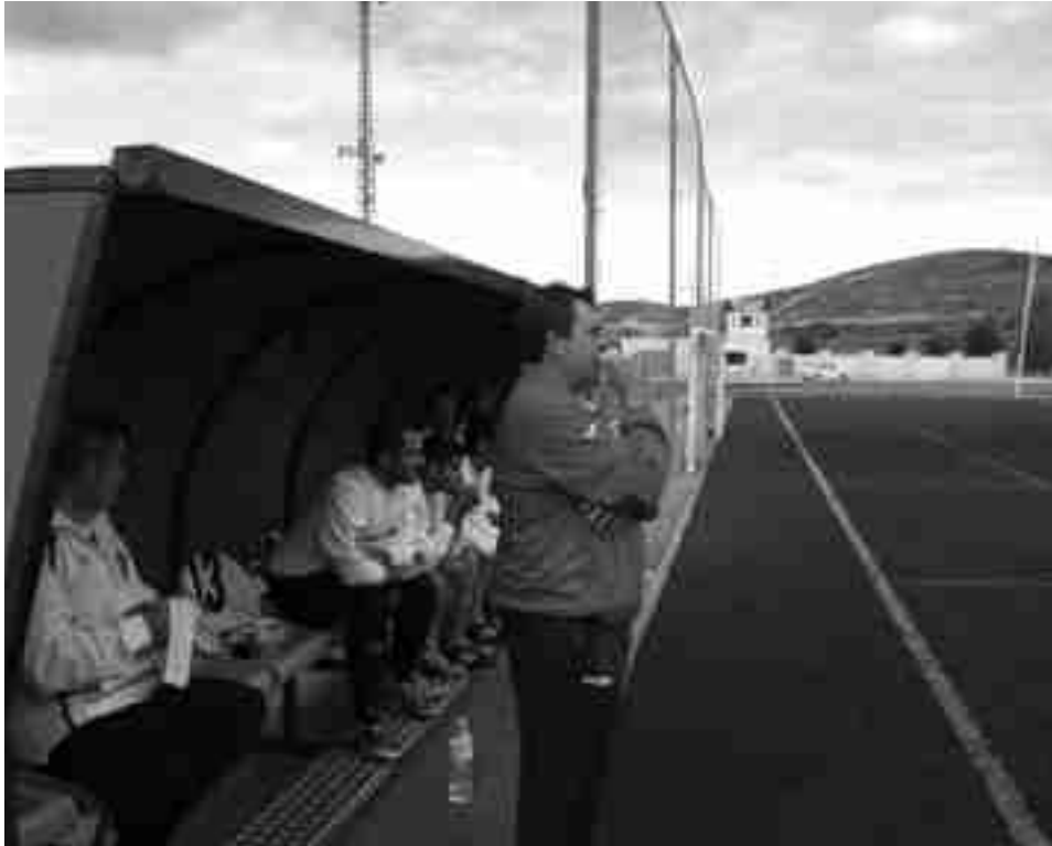
Banquillo de la U.D. Petrelense

El objetivo era ganar como fuera y el Petrelense cumplió con creces en un campo muy complicado como el de L'Ollería. A estas alturas de la temporada, con ocho jornadas por delante, cualquier tropiezo se paga caro, así que el conjunto rojiblanco no se dejó sorprender. Ya en la primera parte fue claro dominador, disponiendo de un par de ocasiones que no entraron y que dejaron el marcador en empate a cero