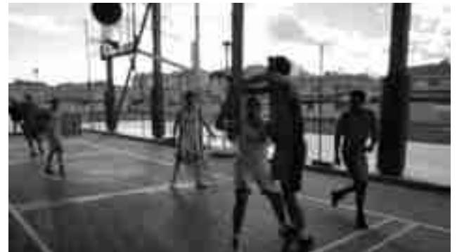
C.B. Petrer cadete

Tercera derrota del C.B. Petrer cadete ante el Elda Negro (54-48) que aleja todavía más el liderato