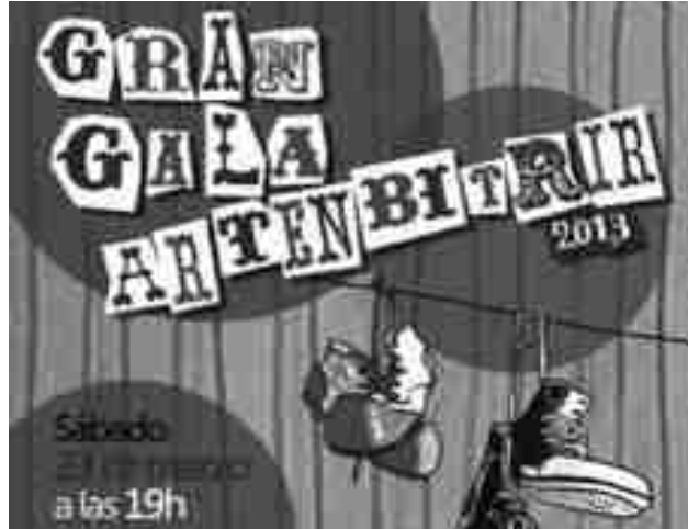
Cartel promocional de la "Gran Gala de Artenbitrir"