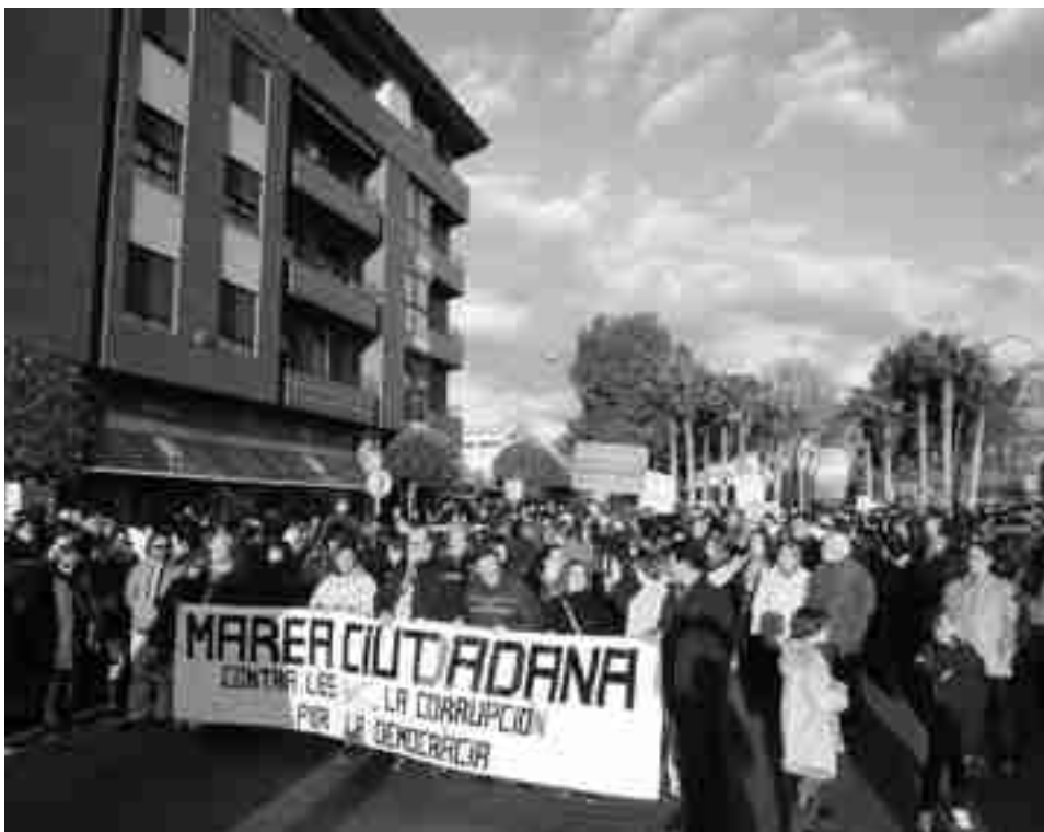
Manifestación de "Marea Ciudadana" por la avenida Reina Sofía de nuestra localidad

Según la organización, a la "Marea Ciudadana" de Petrer-Elda se sumaron más de 5.000 vecinos de estas poblaciones y de otras de la comarca