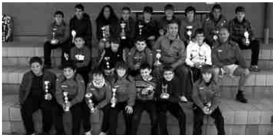
Finalistas Deportes Amorós

Los equipos alevín masculino y cadete femenino lograron permanencia en 2ª