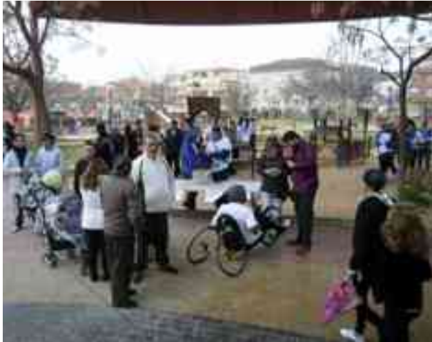
Imagen de archivo. Carrera Solidaria de "Sense Barreres", 2012

Pero, además, se han programado otras actividades para los más pequeños en el propio parque como hinchables, juegos y animación infantil que estarán amenizadas por la "Colla Moros Nous". Mientras que a las once y media se dará lectura al manifiesto del Día Internacional de las Enfermedades Raras y suelta de globos por la esperanza. Asimismo, ha recordado que el precio de la inscripción de la carrera es de 2