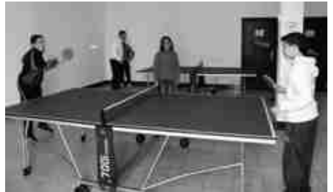
Adolescentes jugando al ping-pong

También ha destacado el carácter abierto de la coalición así como la figura del "adherido", un modo en el que la ciudadanía tiene la posibilidad de sumarse directamente Compromís, sin militar por los partidos que componen la coalición. Asimismo, Compromís queda abierto a posibles formaciones locales de carácter independiente que quieran sumarse al proyecto. ●