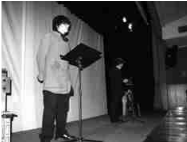
Imagen de archivo. "VII Quincena Literaria Paco Mollá", 2012

Mientras que el sábado 9 de marzo, a las siete y media de la tarde, en el Centre Cultural, tendrá lugar la entrega