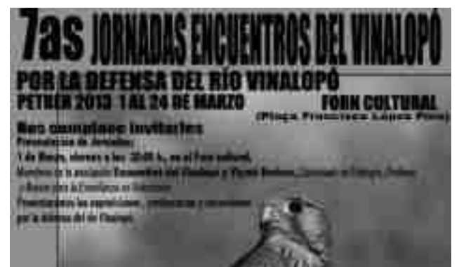
Folleto promocional de las jornadas

Por otra parte, el 10 de marzo a las 8.30 de la mañana