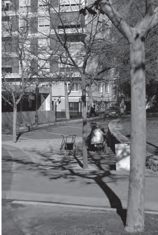
Grupo de mayores en el parque 9 d'Octubre