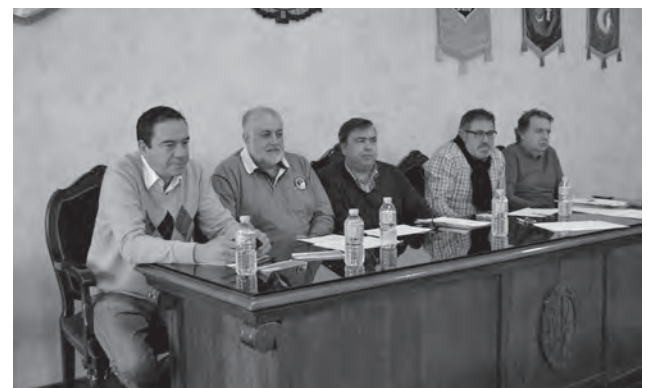
Momento de la reunión de comparsas y filas Astures, en la "Casa del Fester"

Sobre la jornada del sábado, cabe indicar que comenzó con un café para posteriormente en la re-