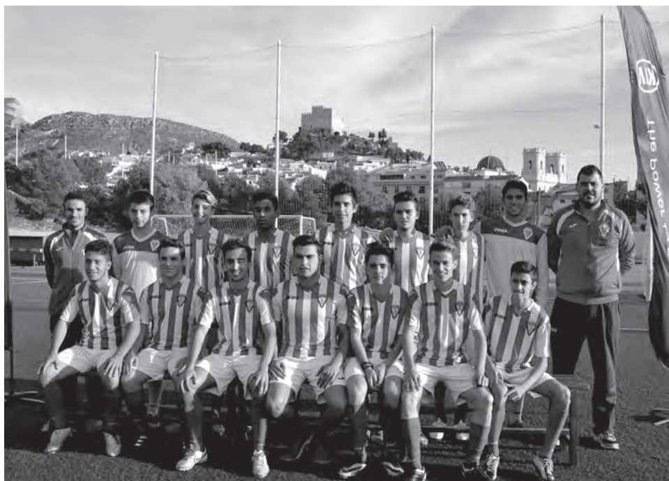
U.D. Petrelense juvenil A

El infantil A pinchó en casa contra el Biarense, uno de los últimos clasificados. El