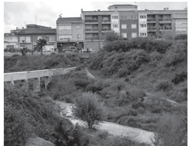
Rambla de Puça durante la mañana del 2 de noviembre

Para la técnico de Medio Ambiente, el 2015 ha sido un buen año, meteorológicamente hablando, puesto