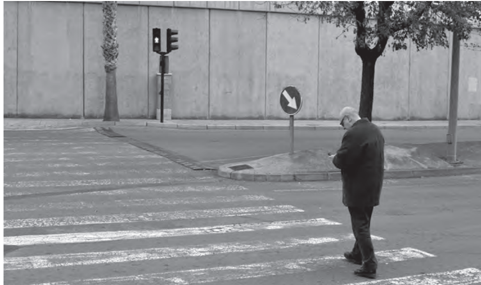
Peatón cruzando en rojo un paso de cebra de uno de los semáforos de la Avenida de El Guirney

Se ha incrementado el número de atropellos de peatones por estar pendientes del móvil