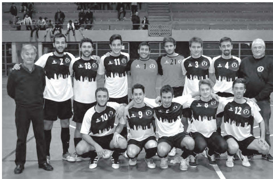
FS Petrer 2015/2016

Guardamar-FS Petrer Sábado, 23 de enero, 18h Pabellón (Sant Jaume)