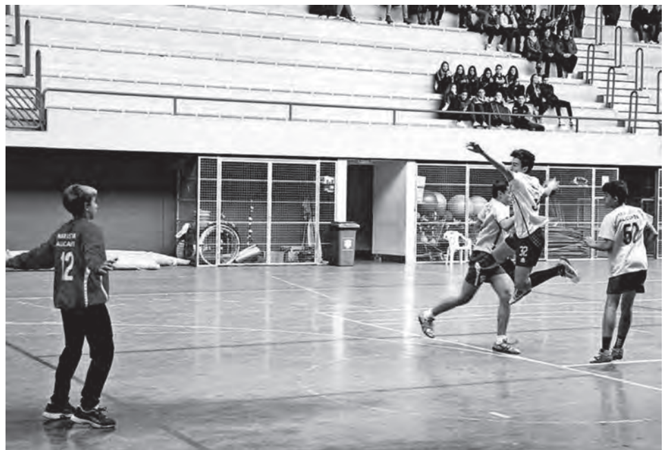
Hispanitas Petrer cadete A.

El cadete B ganó 38-23 al Benidorm B en un choque muy cómodo. Este sábado, a las 11:30h, visitan a Sant Joan, líder del grupo que todavía no sabe lo que es