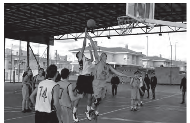
C.B. Petrer cadete A

Por último, el equipo junior que tuvo jornada de descanso, rinde visita al Iris Contestano el próximo domingo, a las 12:30h. El conjunto de Cocentaina es penúltimo en la tabla. ●