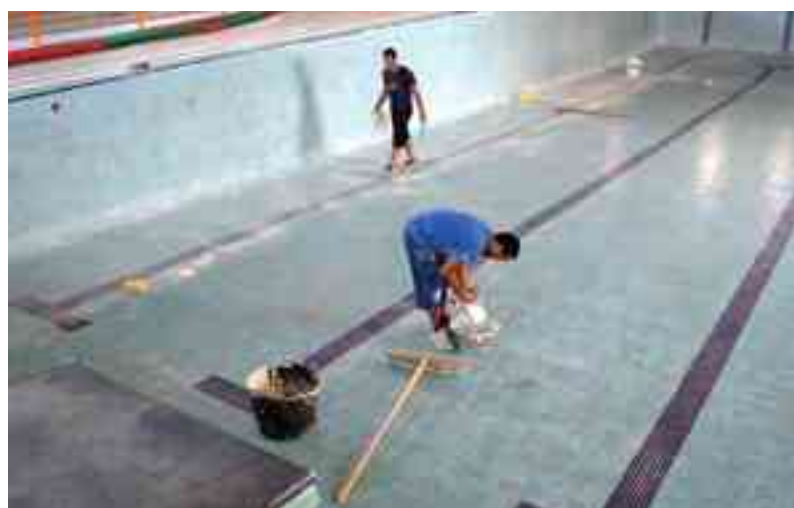
Trabajos de limpieza llevados a cabo en la piscina de San Fernando el pasado agosto