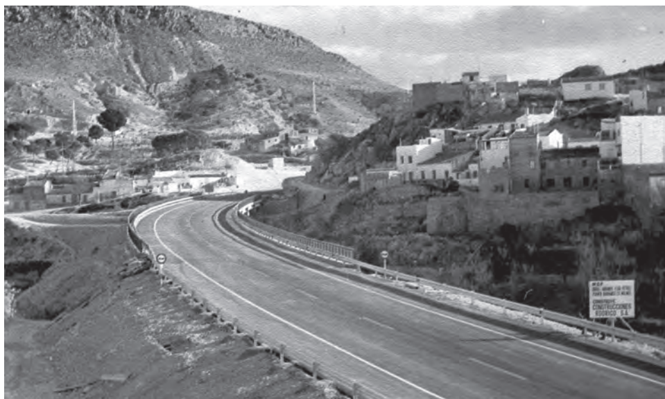
Tramo previo al viaducto en la zona Norte del casco urbano