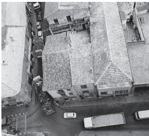
Vista aérea del trazado que seguía la antigua nacional en el casco urbano de Elda