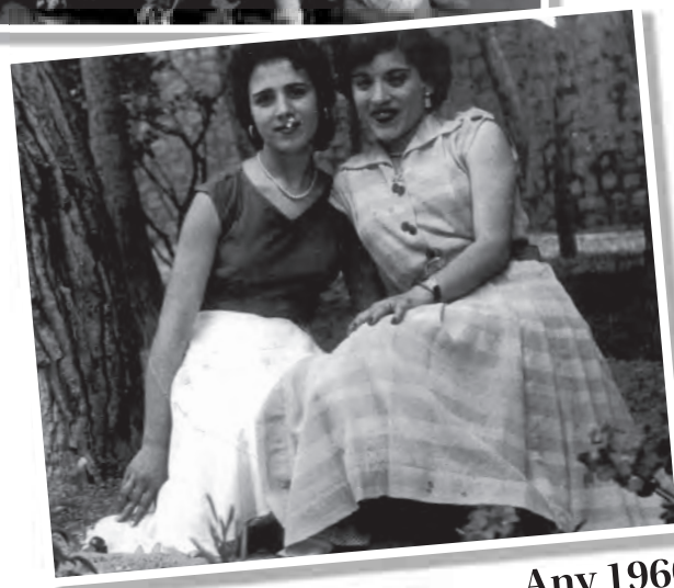
Any 1960 Gardemia i una amiga en els jardins de les escoles.