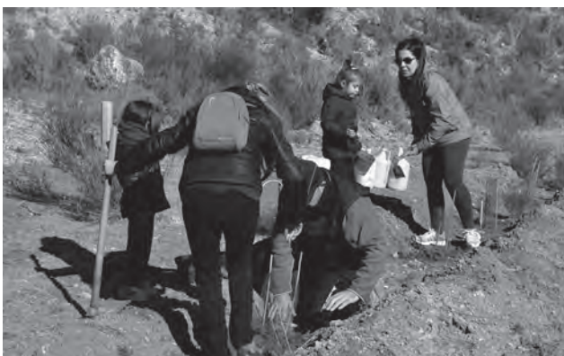
Imagen de archivo de la edición del año 2015

El paraje de la Casa del Dolç, será la zona donde se llevará a cabo la plantación