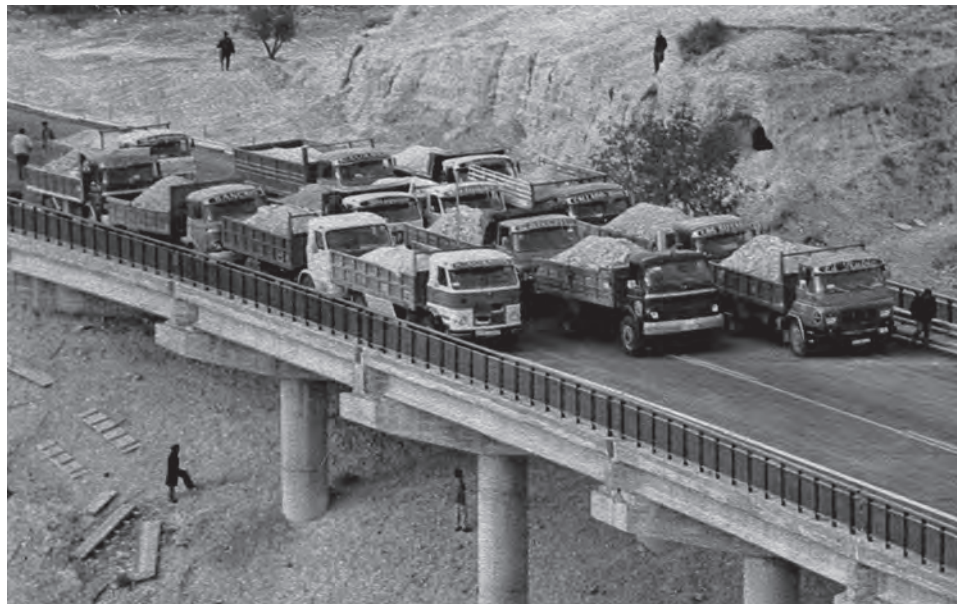
Prueba de carga en el viaducto de la nueva carretera

mejor trazado que se barajó fue establecer la ruta bordeando el casco urbano de Petrer, concretamente, por la ladera Este del Castillo que es la que permanece hoy en día y la que tiene actualmente la autovía A-31 Alicante-