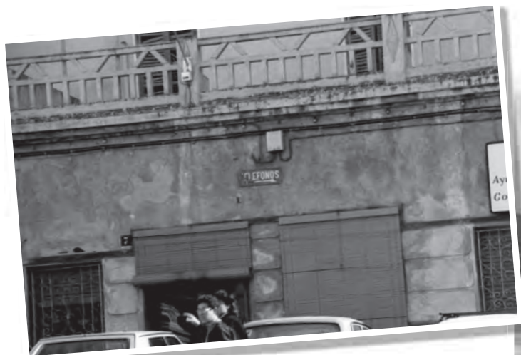
Any 1983 Fatxada de la carnisseria Laliga en el carrer José Perseguer, dalt el balcó de l'actual "Caché"