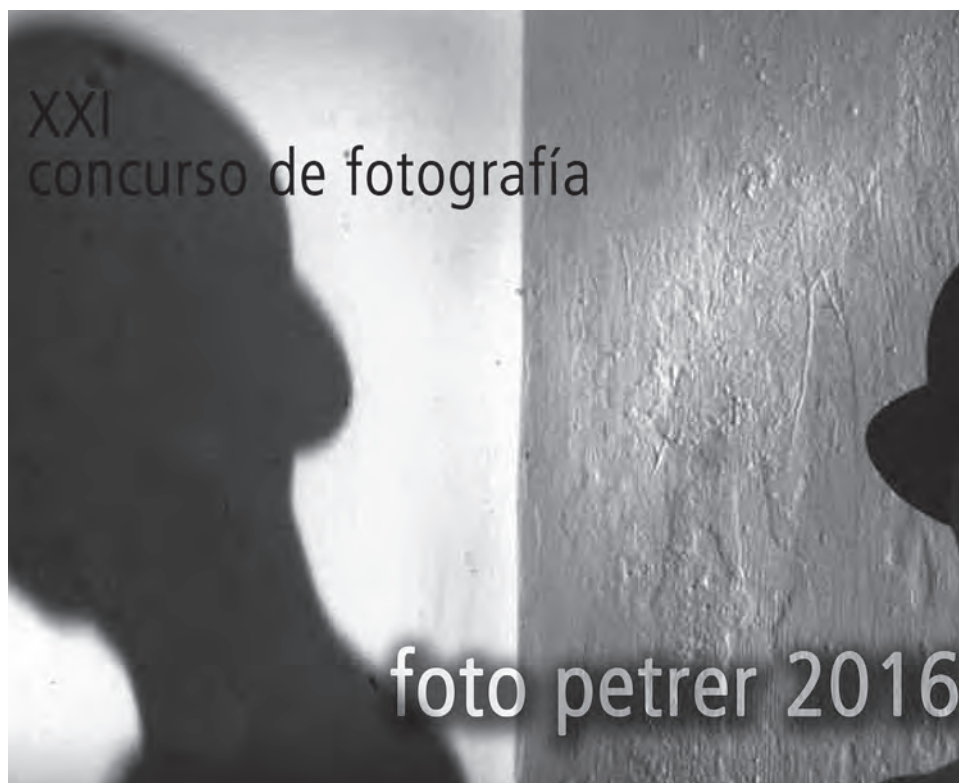
Folleto promocional del XXI Concurso Internacional de Fotografía "Foto Petrer 2016", que incluye las bases

Ya han salido a la luz las bases de la vigésimo primera edición del Concurso Nacional de Fotografía "Foto Petrer 2016", que organiza desde el año 1996 la concejalía de Cultura con la colaboración del "Grup Fotogràfic Petrer". Las bases recogen que en este certamen pueden participar fotógrafos residentes en España, tanto en el apartado de tema libre como en el de local. Cada participante podrá presentar bien colecciones fotográficas de tres imágenes con unidad temática o un mínimo de tres instantáneas sueltas. También, las bases indican que las obras se pueden presentar en blanco y negro o en color sin límite de técnicas, siendo el tamaño de la imagen libre aunque las fotografías deben de ir montadas sobre una cartulina rígida de 40 por 50 centímetros. Todo el que decida participar en este concurso de carácter nacional deberá de presentar o enviar su obra antes de las dos de la tarde del 20 de