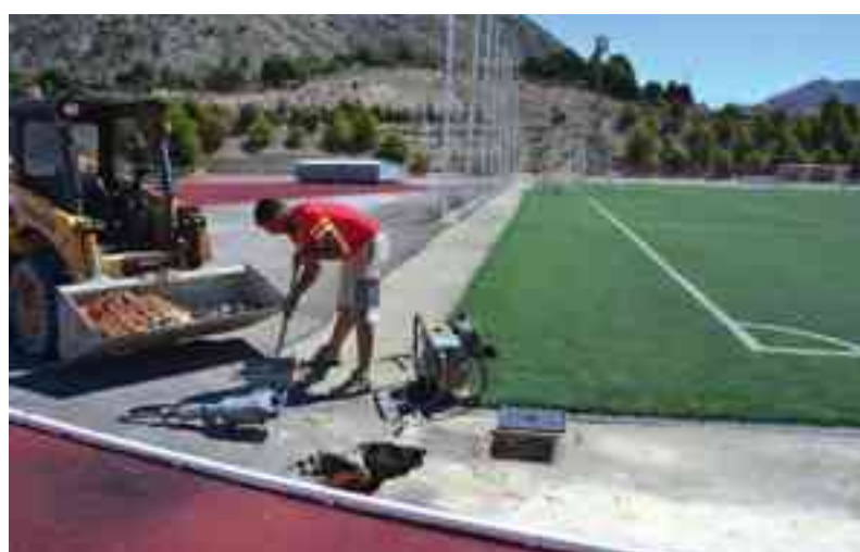
Imagen de arreglos llevados a cabo en El Barxell en julio de 2014

En concreto, se va a proceder a la colocación de 35 metros de bordillo y a quitar los pilares que hay en la caseta volviéndolos a levantar con bloques de hormigón y varillas de hierro. También se va a erradicar la valla metálica existente,