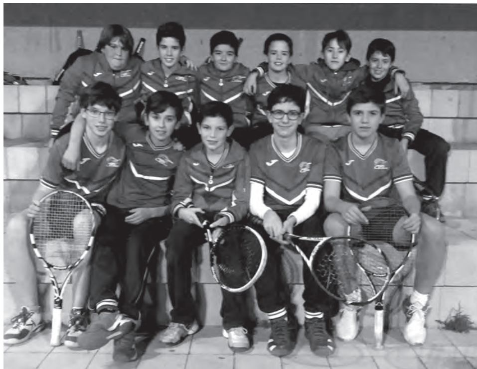
Club Tenis Petrer infantil

Abierto el plazo de inscripción para tomar parte en el campeonato Deportes Amorós Júnior Tour en el que habrá dos fases previas y un máster, además de varios premios