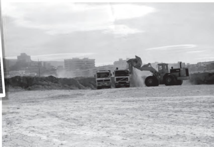
Any 1990 Treballs d'explanació, previs a la construcció del Centre Comercial Carrefour, (Continente).