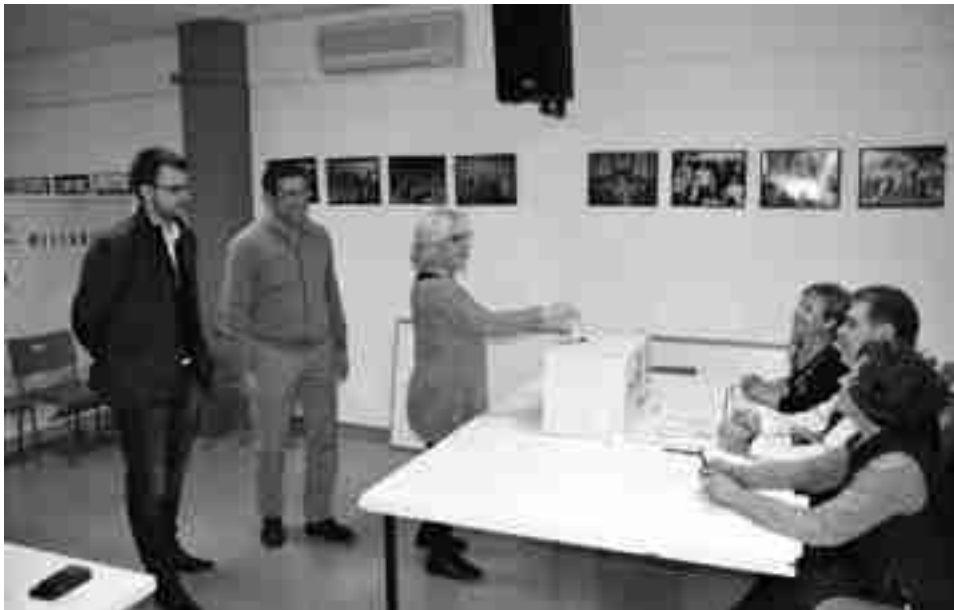
Durante la votación

PERSONAS. Acudieron a votar de las 372 que estaban inscritas en el censo.