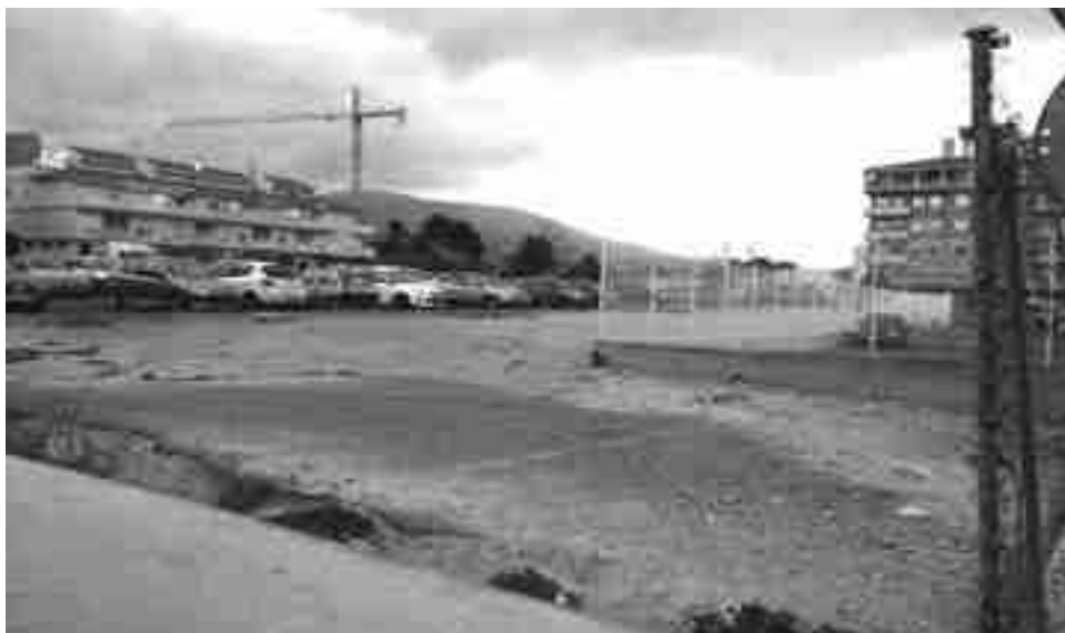
Zona en la que se habilitará el nuevo pipican

También se colocarán 27 nuevos dispensadores de bolsas en distintos puntos de la población que hasta ahora no disponían de ellos