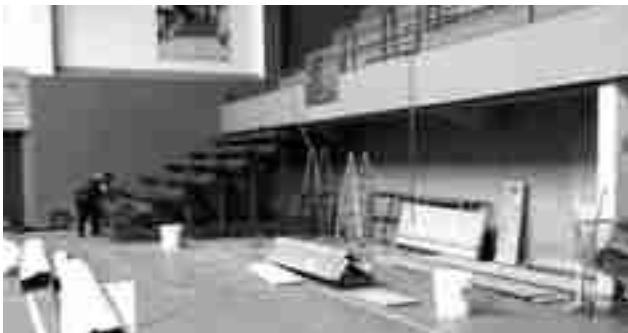
Trabajos de desmantelamiento de las gradas

En el espacio de esas gradas se van a crear varios almacenes para los clubs