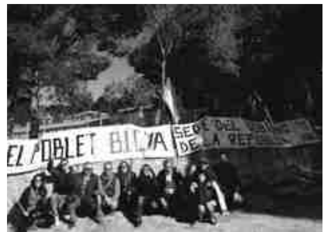
Militantes de EU de Petrer y Elda, en la finca “El Poblet”

histórico que, aunque está reconocido por la legislación en la Comunidad Valenciana, no se aprobado ninguno. No obstante, ha matizado que en estos momentos está en trámite el BIC por espa-