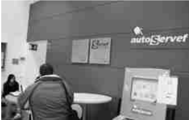
Oficina del SERVEF de Petrer, en la Plaza Pablo Iglesias