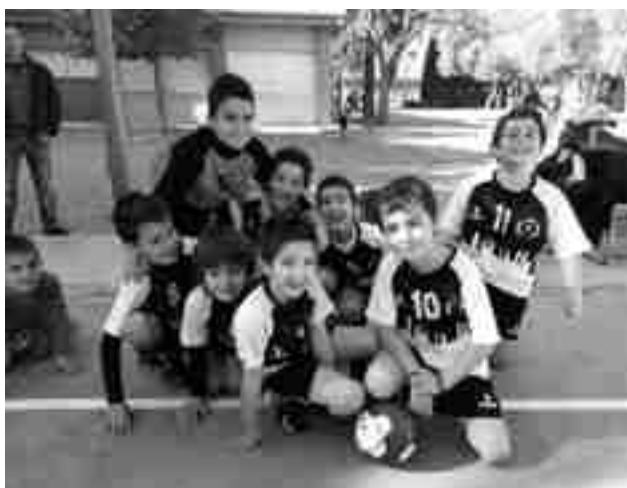
FS Petrer prebenjamín

El infantil perdió en casa por un ajustado 4-5 ante Santa María Magdalena de Novelda. Este sábado, a las 16h, juegan en la pista del Akrasa-la Alicante.