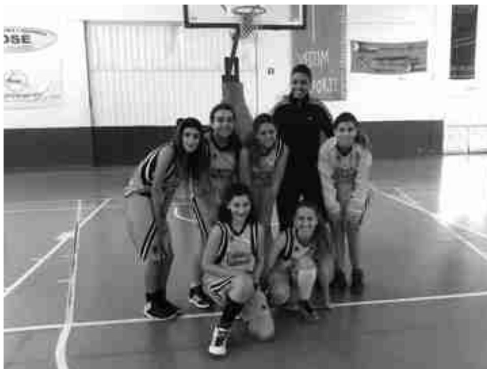
Club Baloncesto Petrer infantil femenino