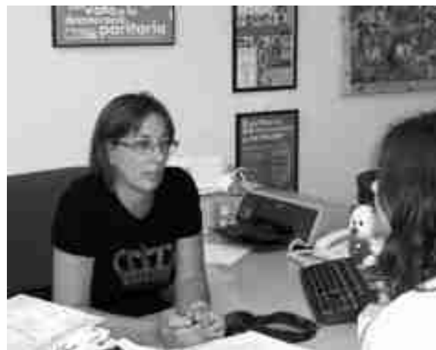
Abogada del servicio jurídico de Igualdad

ner limpia la vía pública de las defecaciones animales bajo multa de 50 euros si no se cumple. ●