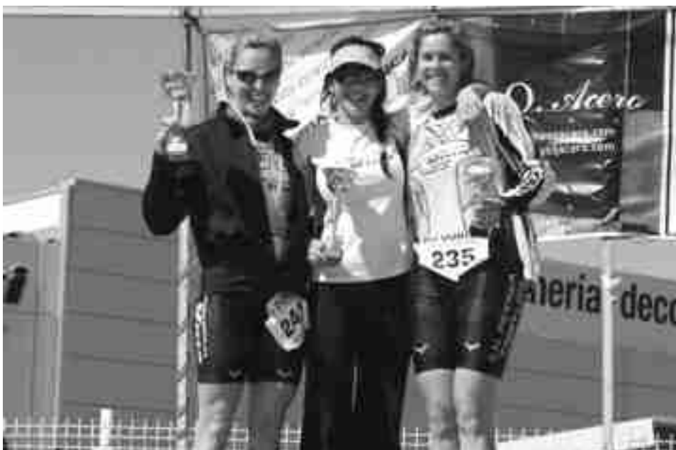
CN Petrer - La Villa femenino

El podio de la clasificación general masculina se