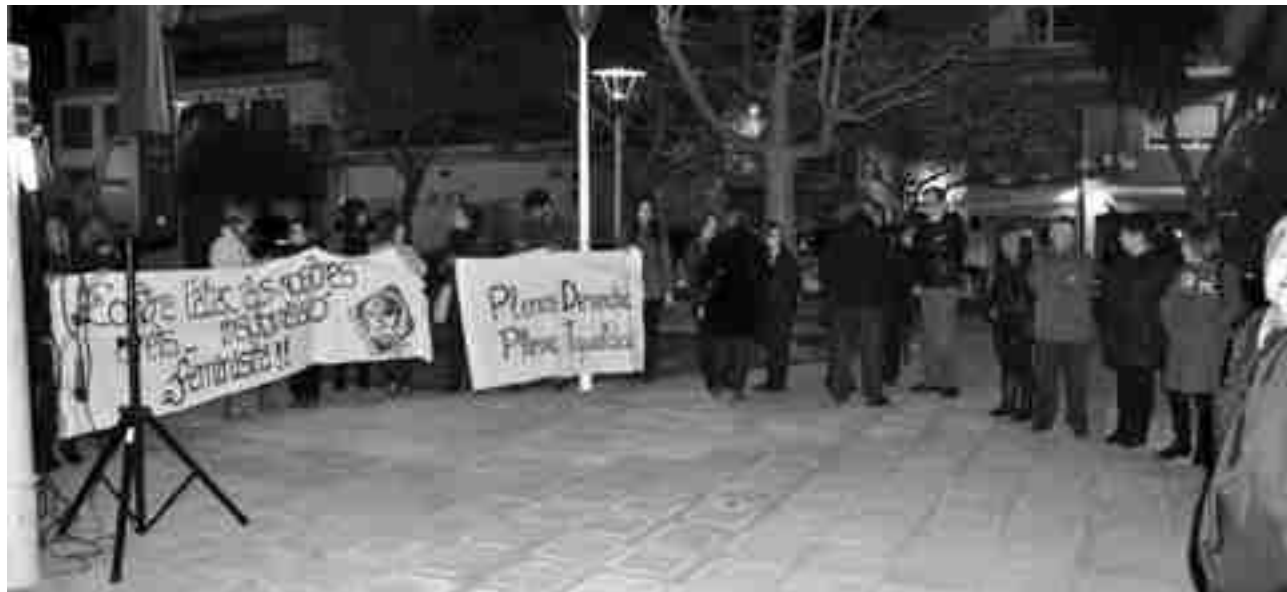
Concentración reivindicativa por la igualdad, en la Plaza de España, organizada por el Área de Feminismo de EU