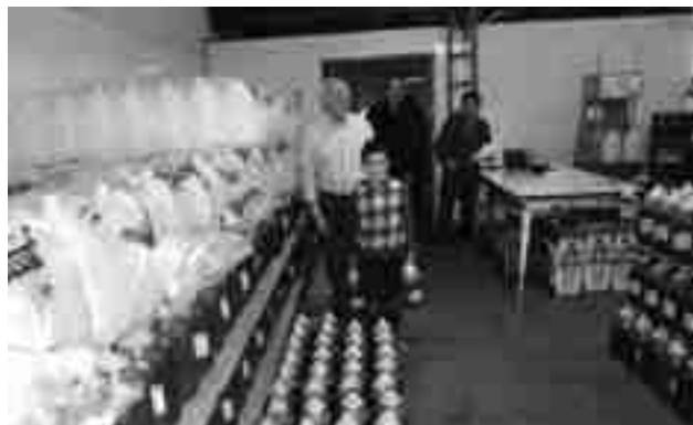
Trabajadores de la Cooperativa liquidando el aceite de esta campaña

nar el material de entrenamiento y una zona central con jaulas y taquillas para conseguir que los aseos y vestuarios puedan ser utilizados por los usuarios de estas instalaciones deportivas aunque se esté jugando un partido federado. Por su parte, el concejal de Urbanismo, Fermín García, ha explicado que se ha decidido retirar esas gradas telescópicas porque estaban en desuso, se habían deteriorado con el paso del tiempo y era necesaria una inversión mayor para que cumpliera la actual normativa en materia de seguridad. Además, ha comentado que con esta actuación, que cuenta con un presupuesto de 6.000 euros, también, se da respuesta a una demanda de diferentes clubs deportivos de nuestra localidad. ●