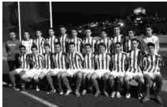
U.D. Petrelense juvenil