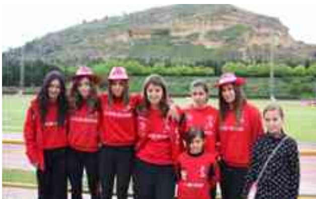
Atletas de Petrer en la Liga Nacional

El Club Atletismo Petrer tomó parte en el campeo-