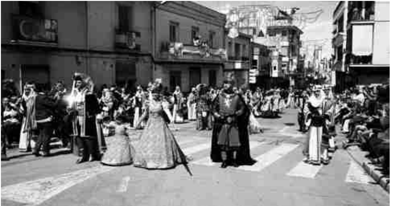
Desfile de Honor, la mañana del pasado domingo