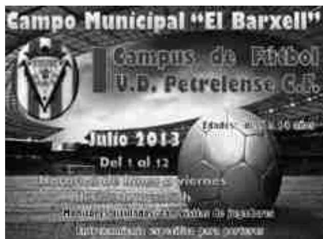
Cartel del Campus

Cuando concluyan los entrenamientos se procederá a realizar una fiesta de fin de curso y se entregará un CD con fotografías de la participación de cada niño. ●