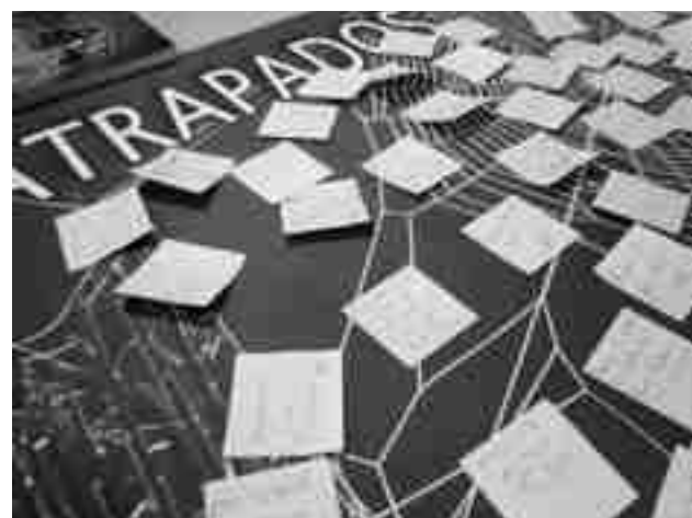
Unos 78 visitantes dejaron su deseo plasmado en tela de araña "Atrápame"