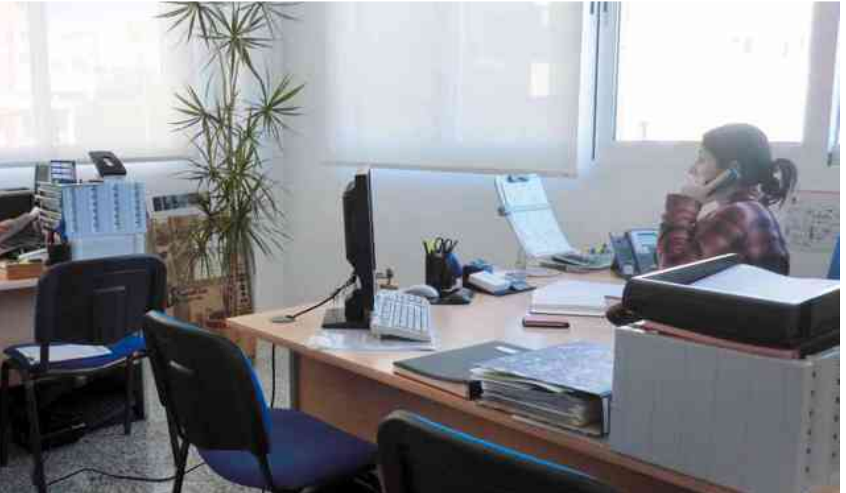
Dependencias municipales de la Concejalía de Igualdad

la denuncia penal, romper con la convivencia matrimonial o de hecho, acabando con el ciclo de violencia que ellas y/o sus hijos han sufrido, en muchas ocasiones desde hace años.