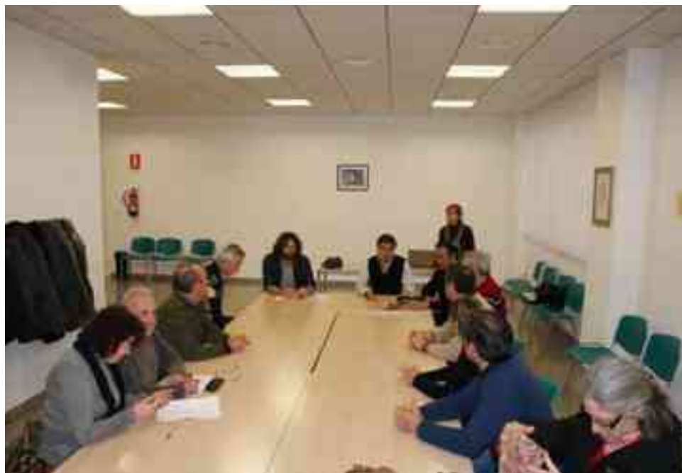
La Asociación de Hombres por la Igualdad también organiza talleres