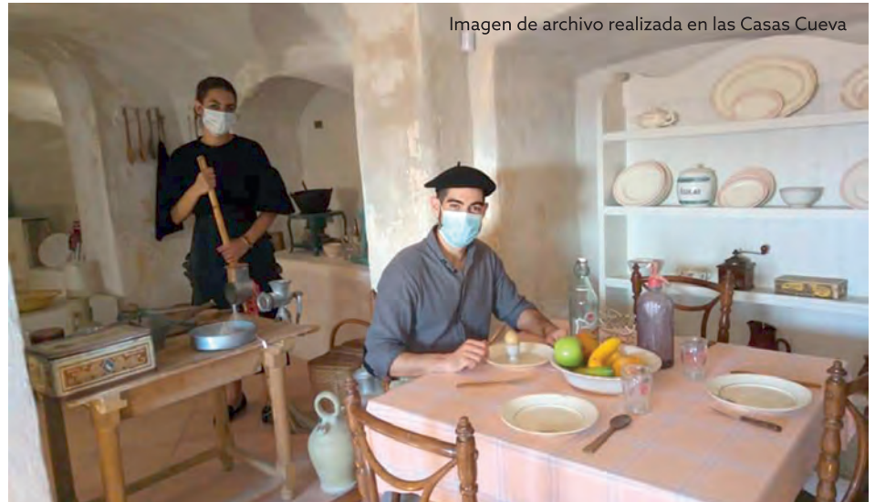
Imagen de archivo realizada en las Casas Cueva

La Tourist Info hace memoria de 2020 y registra un total de 9.012 visitas, una cifra que se aleja de las 21.000 de 2019 y en cuyos resultados ha tenido mucho que ver la pandemia de la Covid 19 y el hecho de que la actividad turística en Petrer se anulara por completo o se redujera considerablemente durante varios meses. A pesar de ello, teniendo en cuenta los efectos de la pandemia y los días que ha estado con actividad, proporcionalmente esos datos son bastante positivos. Incluso los meses en los que estuvo abierta, a partir del mes de junio, las cifras fueron mejores de lo esperado registrando un mes de agosto histórico con los datos más altos de los últimos diez años para esa época. Según David Ivorra, técnico de la Oficina de Turismo de Petrer, la actividad más numerosa fue la visita al Castillo con 3.560 personas, seguida de la ruta "Petrer se viste de luna" de la que tan solo se pudieron hacer seis contabi-