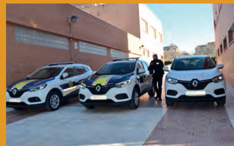
LA POLICÍA LOCAL TENDRÁ TRES NUEVOS VEHÍCULOS