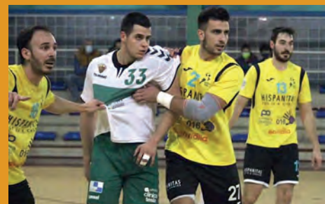
APLAZADO EL H.PETRER-MARRATXÍ POR CUATRO POSITIVOS