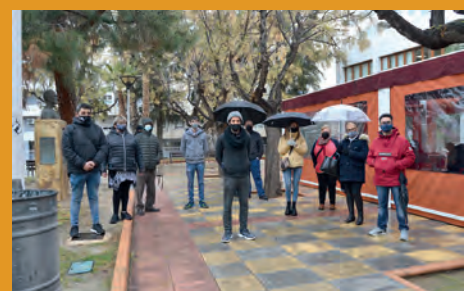
LOS HOSTELEROS SE MOVILIZAN POR LAS NUEVAS RESTRICCIONES