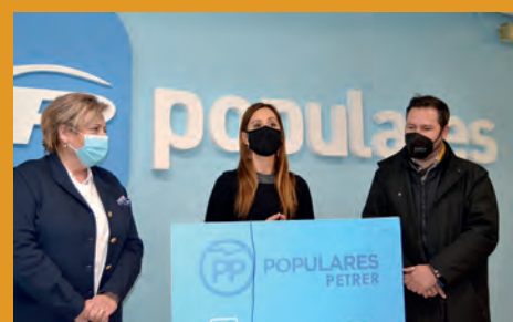
EL PP DENUNCIA EL NUEVO IMPUESTO PARA VERTIDOS