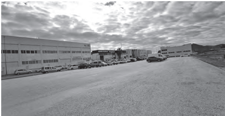
Imagen del nuevo parking

La concejalía de Desarrollo Económico ha habilitado un nuevo parking en el Polígono Salinetes de Petrer con capacidad para un centenar de vehículos. Este nuevo equipamiento ayudará a solucionar los problemas de aparcamiento y saturación de la calle Arenal. Los empresarios reclamaban un aparcamiento en dicha calle porque se producían numerosos atascos, aparcamientos en doble fila e incluso, en