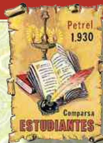
Guerrilla y Embajada Cristiana 2013

Corría el año 1929 cuando un grupo de amigos decidió fundar la Comparsa de Estudiantes . Por la viveza que le aporta a la fiesta, la nuevas ideas y la alegría que todos desprenden, actualmente se trata de una de las comparsas que más comparsistas tiene. Aunque su color identificativo sea el negro, las volteretas y el jolgorio que dejan a su paso arrancan los aplausos de la gente y la mejor de sus sonrisas.