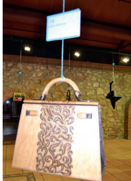
Finalista al mejor diseño: Modelo "Kellywood"