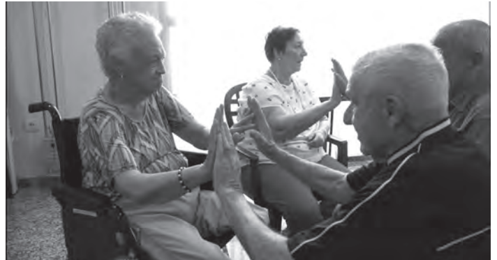
Las personas mayores se ejercitan mediante el movimiento y la música