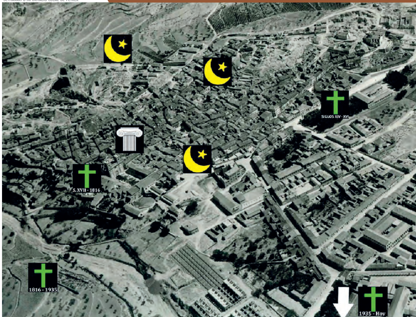
Distribución de los cementerios en el centro histórico de Petrer.