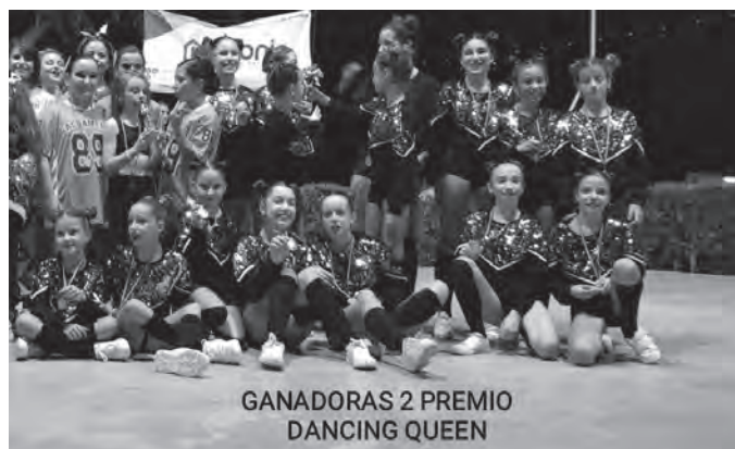
GANADORAS 2 PREMIO DANCING QUEEN