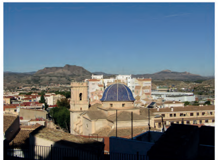
Irina Navarro, 13 años. Primer premio juvenil