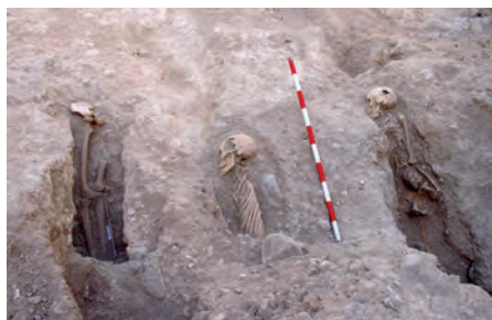
Necrópolis musulmana de la Explanada.