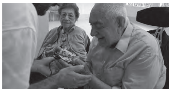
Los usuarios acariciando un cernícalo

La Residencia de la Molineta está llevando a cabo terapias alternativas e innovadoras que cuentan con el apoyo económico, una vez más, de la Obra Social de Caixapetrer para su puesta en marcha. Junto a los cuidados tradicionales, el centro se mantiene a la vanguardia incorporando métodos terapéuticos muy novedosos dirigidos a sus residentes y usuarios. A la terapia