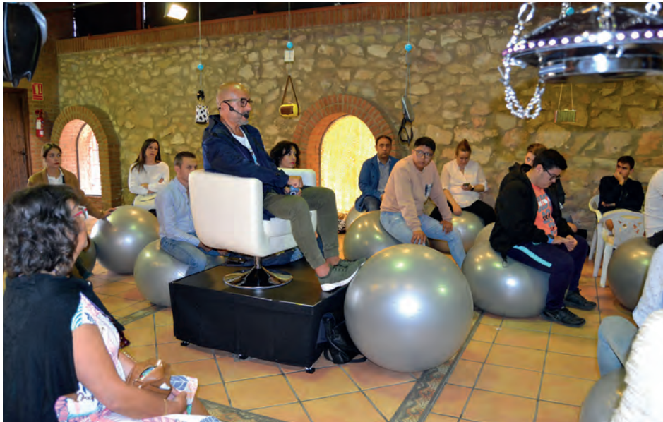
Imagen del Forum Model Experience llevado a cabo antes de la entrega de premios