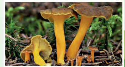
Angula del Monte

El otoño es la época de máximo esplendor micológico. Rebozuelos, níscalos, boletus, trompetillas y amanitas comienzan a brotar en esta época del año, con la llegada de las lluvias y las temperaturas suaves propias de la estación