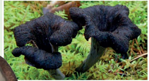
Trompetillas de la Muerte