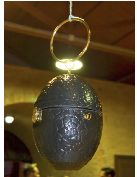
Finalista al mejor diseño innovador: Modelo "Snake egg"

dado que su autor es aficionado a los drones de competición y a los helicópteros acrobáticos, un hobby o pasión que ha trasladado al diseño de una mochila hecha en piel y armazón de goma que ha tardado dos semanas en elaborar. Este diseñador también dijo estar muy contento con el premio y destacó que realmente había disfrutado mucho haciéndolo.