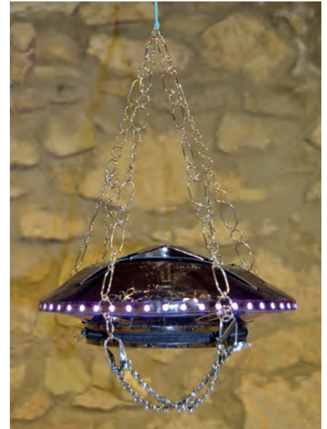
Premio al mejor diseño innovador: Modelo "Mochiovni"