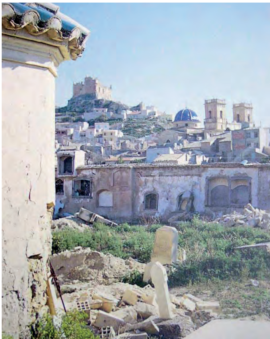
Fotografía del Cementeri vell ya en desuso.

Desde la expulsión de los moriscos en 1609, y ya con población plenamente cristiana que repobló nuestra villa a partir de 1611, y hasta la construcción