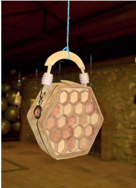
Premio al mejor diseño: Modelo "HoneyComb"