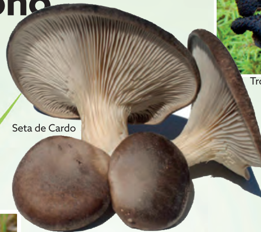
Seta de Cardo