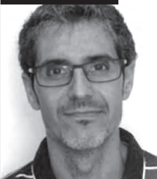
JOSÉ IGNACIO PRADES PONS Seleccionador nacional femenino de balonmano

"Me acuerdo siempre de mi familia porque son los que siempre están conmigo, a las buenas y a las malas y también de los inicios en la pista de San Fernando de Petrer. Lo que me está sucediendo ahora es una parada más y te acuerdas de todos los que te han formado y han hecho posible estar aquí"