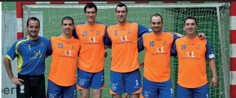
Los hermanos Guardiola en sus inicios en el balonmano como canteranos del BM. Petrer

Ambos hermanos, han aprendido a vivir lejos de su pueblo natal, pero sin dejar de echar de menos a su apreciado Petrer. Su pueblo ha sabido corresponderles, con un merecido reconocimiento local y autonómico a su extraordinaria trayectoria nacional como europea: la corporación municipal después de treinta años de la