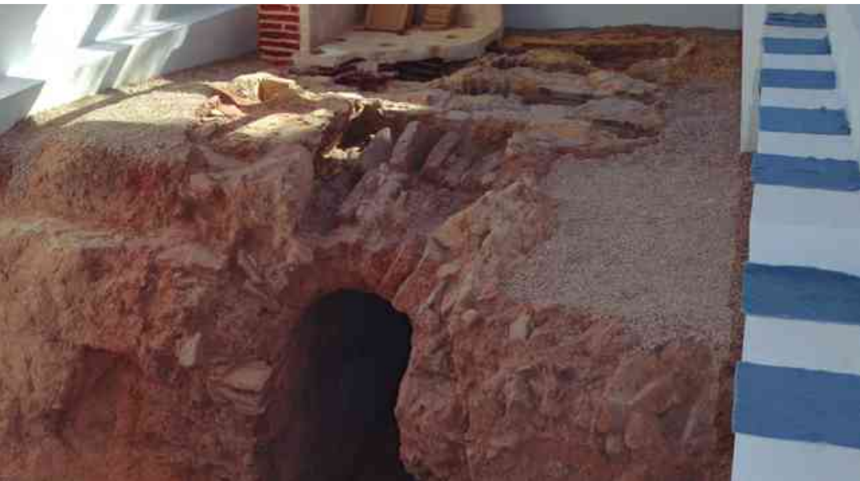
Primer plano de la entrada a la cámara del horno donde se depositaba la leña

una ruta con cinco puntos de visita fundamentales. El Castillo, en el que se podrá acceder a todas las dependencias incluido el calabozo; las Casas - Cueva; el puesto antiaéreo del Altico; el Museo Arqueológico y Etnológico "Dámaso Navarro" y, finalmente, y como novedad, el horno romano de la calle La Fuente. Tendero ha señalado que este fin de semana, tanto sábado como domingo, todas estas dependencias estarán abiertas por las mañanas de 11 a 14 horas y por las tardes de 17 a 20 horas. Además, en el Castillo habrá teatralizaciones cada hora, por la mañana y por la tarde, ambos días, y recreación en las Casas-Cueva con