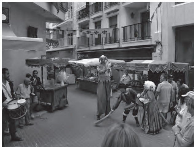
Imagen de archivo. Mercado Medieval de Petrer, septiembre 2014

También ha apuntado algunas de las novedades que va a ofrecer el Mercado Medieval este año como son los talleres de pompas de jabón gigantes, aéreos y taller de música tribal. Además, como cada año no faltarán los talleres de ma-labares, pasacalles de mú-