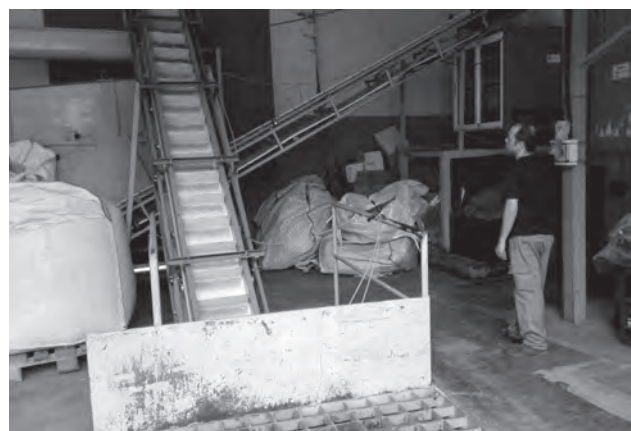
Zona de recepción de la almendra en la Cooperativa Agrícola de Petrer

En cuanto al precio, ha comentado que se ha incrementado respecto a 2015, siguiendo el sistema de "Tablilla", a finales de la semana pasada, el kilo de la variedad "comuna" era de 8.40 euros frente a los 6.30 euros de 2014. ● A.B.G.