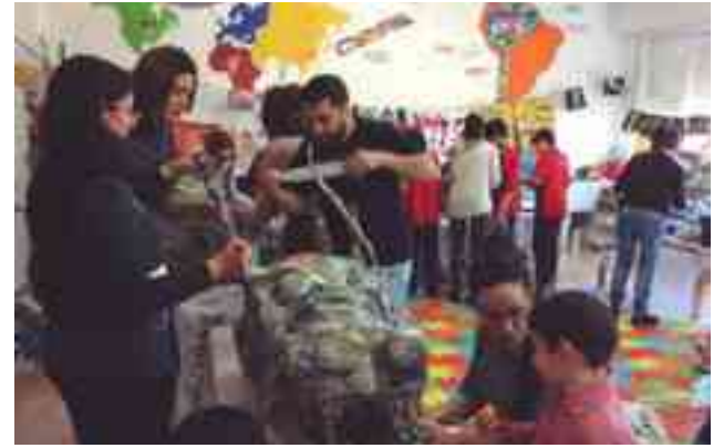
Imagen de uno de los talleres del programa con escolares y padres

Por lo que respecta al alumnado petrerí de Secundaria, Bachillerato y Ciclos Formativos cabe decir que el pasado viernes se incorporaron a las aulas de los tres institutos existentes en nuestra población cerca de 2.650 jóvenes petrerins para iniciar un curso en el que aparte del tratamiento preferencial que se ofrece a los alumnos procedentes de Primaria en estos primeros días como forma de adaptación, la aplicación de la LOMCE en 1º y 3º de ESO y 1º de Bachillerato, el inicio de las obras de remodelación del Instituto Azorín, previsto para los próximos meses, las inquietudes generadas en la comunidad educativa tras el cambio de gestores habido en la Consellería de Educación o la continuación de la celebración del décimo aniversario, en el caso del Instituto La Canal, serán algunas de las incidencias que tendrán presencia constante a lo largo del curso. ● S.A.R.