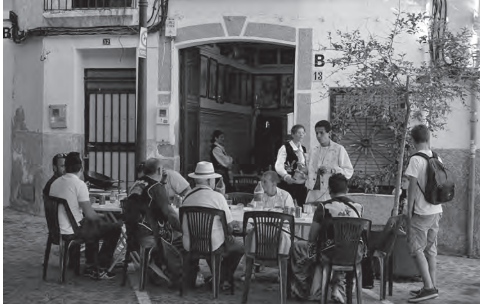
Ambiente festero en un cuartelillo de la plaza de Dalt