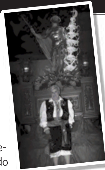
"Turu" en una foto reciente junto a San Bonifacio

Las fiestas de Moros y Cristianos siempre han tenido mucho protagonismo en la vida de "Turu". Fue rodela de los Labradores los años 1968 y 1969, después abanderada de la misma comparsa en 1986 y en la actualidad es la presidenta. Con anterioridad, también fue dos años presidenta de los Moros Nuevos. ●