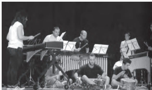
Educandos de la Asociación Musical Virgen del Remedio