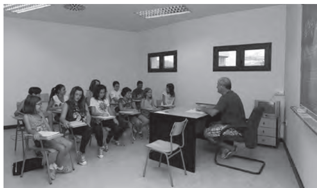
Educandos de la Escuela de Música Tradicional y Danza