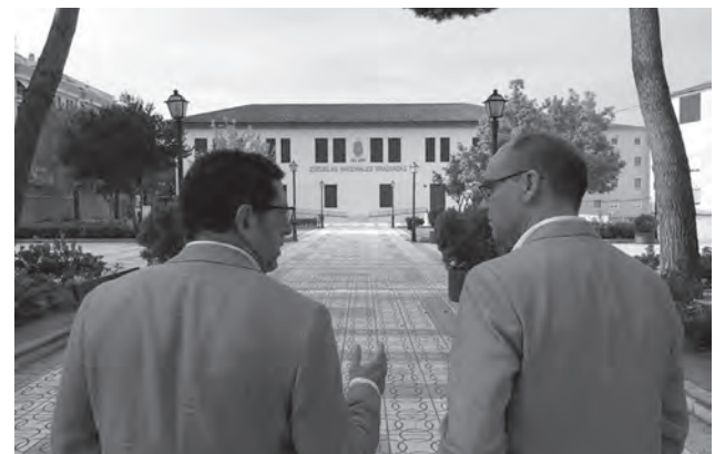
El alcalde de Petrer y el Rector de la UA dirigiéndose hacia "Las Escuelas"