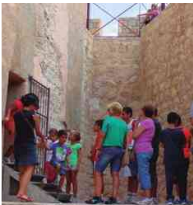
Visitantes durante las Jornadas realizadas el año pasado

la aparición de personajes vestidos de época. Para ello se contará con la colaboración de todo el personal de la concejalía de Cultura y también de la Tourist Info. El técnico municipal ha recordado que tras unas excavaciones arqueológicas llevadas a cabo entre los años 2007 y 2008, apareció la parte artesana de Villa Petraría, hornos que según los estudios reali-