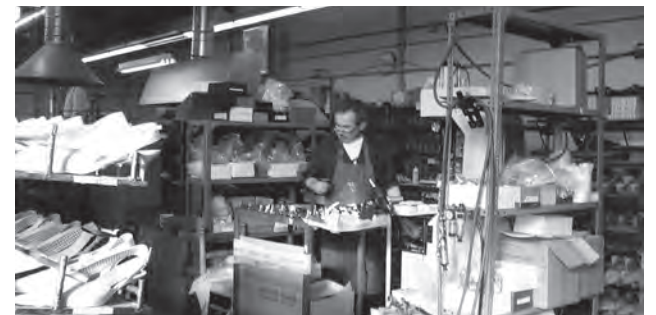
Imagen de archivo de una empresa local de calzado

Respecto a los sectores cabe mencionar que, a diferencia del mes de julio en que la tasa de paro más alta se dio en nuestra población en el sector servicios, con 2.160, seguido muy de cerca por el sector industrial con cerca de 2.000 parados, en los datos existentes del mes de agosto se invierten los términos y pasa a ser el sector Industria el que copa el mayor número de desempleados con un total de 2.236 correspondiendo