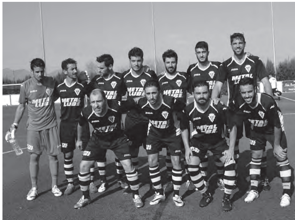
Formación titular del Petrelense en Benferrí

U.D. Petrelense-Thader Domingo, 20 septiembre, 12h Campo (El Barxell)