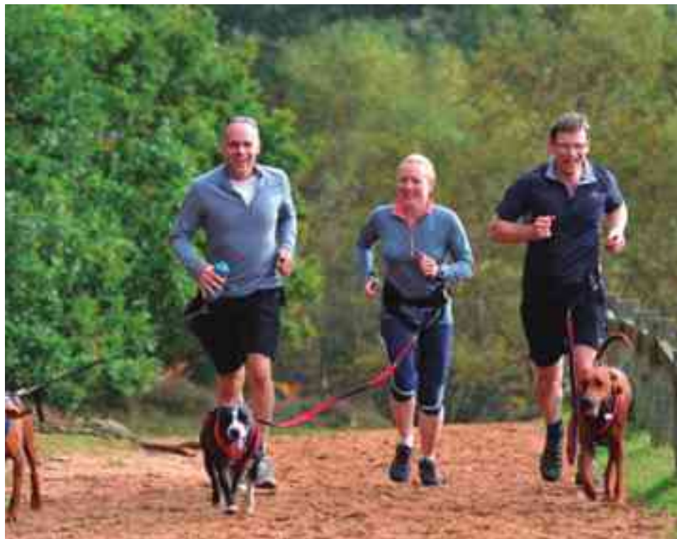
Imagen de un canicross

El canicross consiste en correr con un perro atado a la cintura con un cinturón y una línea de tiro que va hasta el arnés del perro