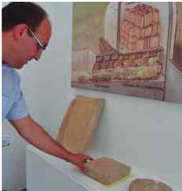
Ladrillos y teja originales de la época