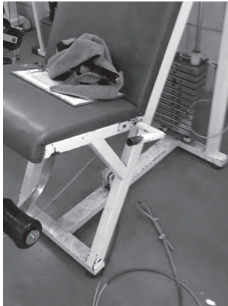
Imágenes del estado deteriorado de algunos aparatos del gimnasio

Se quieren maximizar los recursos de los centros escolares en materia deportiva