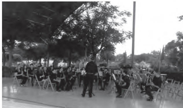
Educandos de la Sociedad Unión Musical

Respecto a la Escuela de Educandos de la Asociación