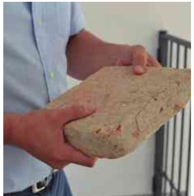
Ladrillo de la época romana