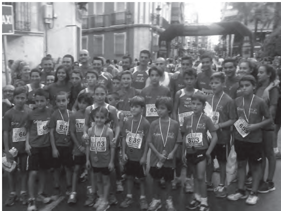
Atletas del Capet en Sax