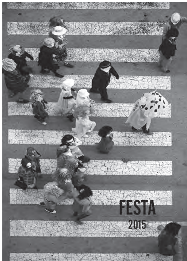
Portada de la revista "Festa 2015"