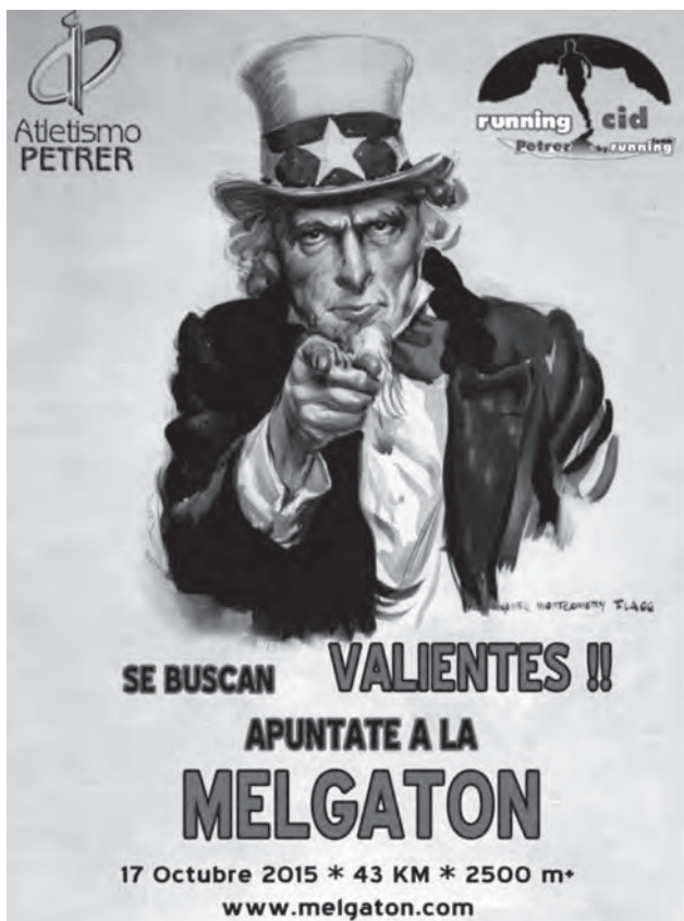
Cartel de la prueba

cadete y máster, tanto masculino como femenino. En la disciplina de caminantes habrá una categoría única. El recorrido será el mismo que en años precedentes: Explanada, Cuesta del Río, Tiberio, campamento de Caprala, Collado Gordo, L'Avaiol, Collado