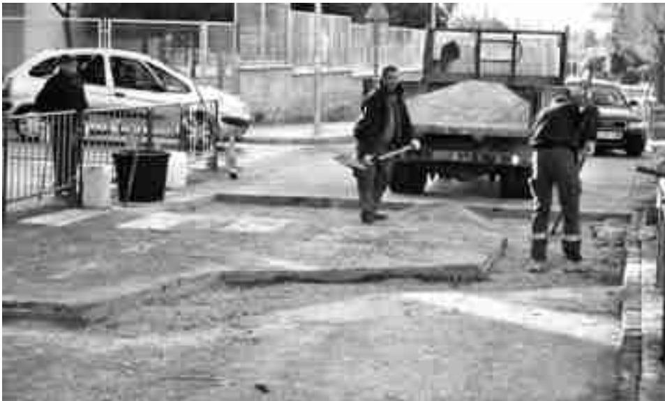
Tramo de la avenida Felipe V cotada al tráfico rodado, por obras, durante esta semana