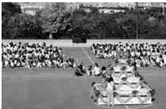
Imagen de archivo de otra actividad

apellidos, fecha de nacimiento y colegio o club al correo: millaceipreinasofia@gmail.com o personalmente en "La Casa del Corredor Running Cid" de la calle Leopoldo Pardines. La cuota de inscripción es de 1 euro al recoger el dorsal en el colegio los días 28,29 y 30 de enero de 17.00 a 18.00 horas en el Rincón del Ampa. Al finalizar la prueba se entregará un obsequio. La carrera dará