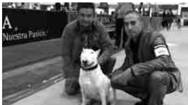
Aquí vemos a Nala con su propietario