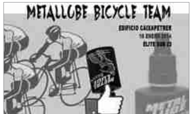
Cartel de la presentación del equipo