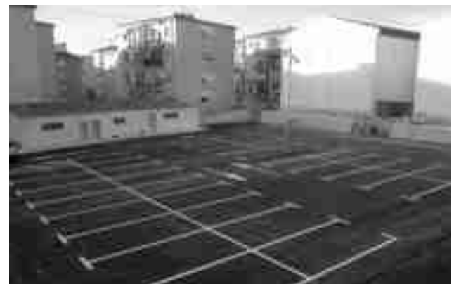
Nueva zona de estacionamiento del edificio "Las Escuelas"

una subvención de la Generalitat Valenciana. A esta ayuda de la administración autonómica ha habido que añadir una aportación por parte del Ayuntamiento de alrededor de 30.000 euros, invertidos en la comunicación del parking con el edificio "Las Escuelas". Tal y como ha declarado el delegado de Urbanismo, con la ejecución de este proyecto se cumplen dos objetivos, por un lado, finalizar la rehabilitación y adecuación exterior del antiguo colegio "Primo de Rivera" y por otro, ofertar