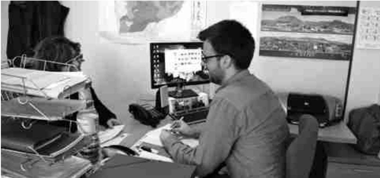
Despacho del grupo municipal socialista en el Ayuntamiento de Petrer donde se puede coger cita