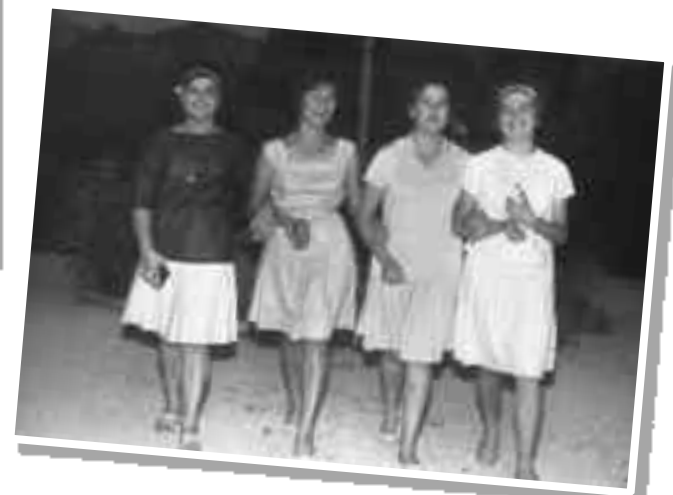
Any 1962 Grup d'amigues que tenien els Nòvios en el Servei Militar.