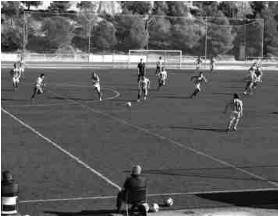
Momento del partido contra el Crevillente

U.D. Petrelense-N. Benidorm Sábado, 18 enero, 16:30h Campo (El Barxell)