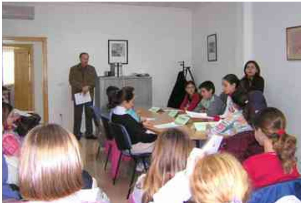
Grupo de escolares durante un taller en las dependencias de la OMIC