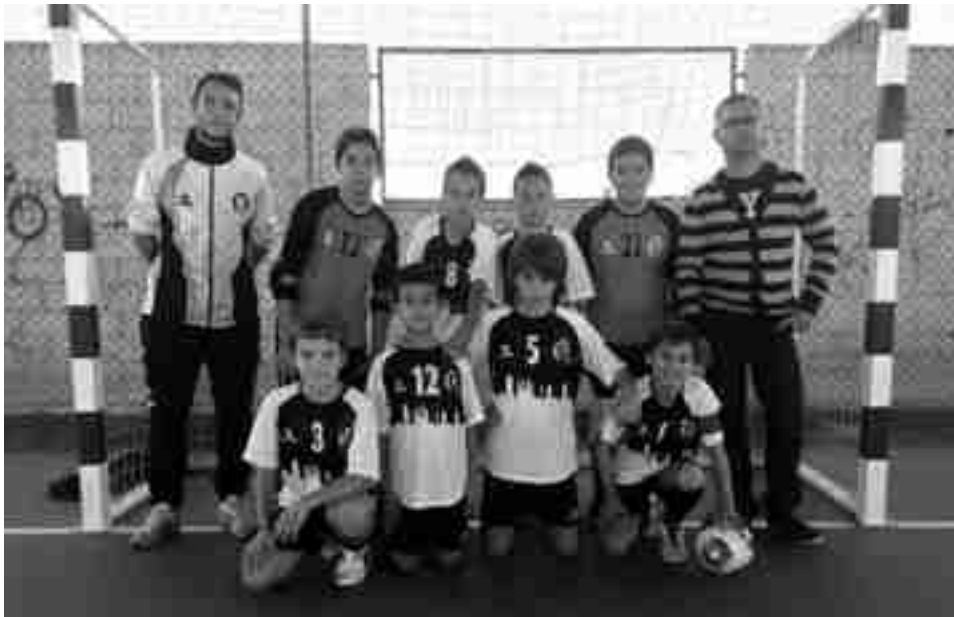
FS Petrer alevín

El FS Petrer de 1ª Regional volvió a perder por la mínima en la pista del Sanz Joyeros El Campello. El equipo petrerense no acaba de tener la suerte necesaria para ganar su primer partido de la temporada pero está claro que compiten por ello todas las jornadas con buen juego y goles. Ante los costeros tenían una buena oportunidad para abandonar la última posición de la tabla que ocupan con dos puntos, no obstante, habrá que esperar a este sábado, a las 16h, al partido que les medirá al Lifusa El Campello