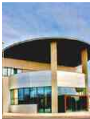
Centro de Cocemfe en Petrer

ocupando plazas públicas en Centros de Día o Residencias de Discapacitados. La moción va encaminada, por un lado, a evitar los recortes en las subvenciones a los centros dedicados a la discapacidad porque podría ocasionar la reducción de personal o incluso el cierre, y por otro lado, que la subida de las tarifas del copago a los discapacitados en muchos casos serán insostenibles y provocarán el regreso de