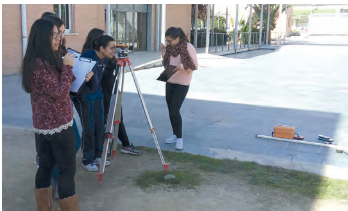
Alumnos y alumnas realizando labores topográficas.

Tras realizar las actividades propias del trabajo de campo (excavación, toma de datos, fotografías, etc.), se pasa al dibujo arqueológico de diversas piezas (bifaz de piedra, idolillo, cuenco metálico, arpón de hueso) empleando las herramientas técnicas adecuadas. Por último, se realizan labores de topografía tomando cotas con el nivel y la mira para poder situar los hallazgos en su posición correcta. Con esta actividad se consiguió acercar nuestra profesión a los estudiantes y, quizás, algunos de ellos opten por estudiar historia y arqueología en su inminente paso a la universidad.