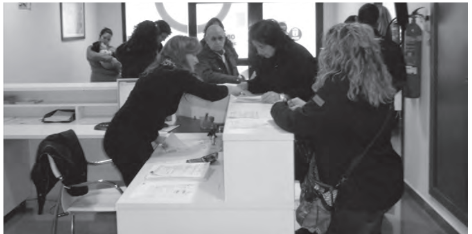
Proceso de inscripción del programa XarxaLlibres

Por otra parte, la edil ha puntualizado que las familias que han adherido a este programa no están obligadas a