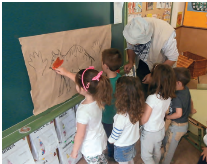
Realización de la pintura rupestre en el colegio Reina Sofía (2015)