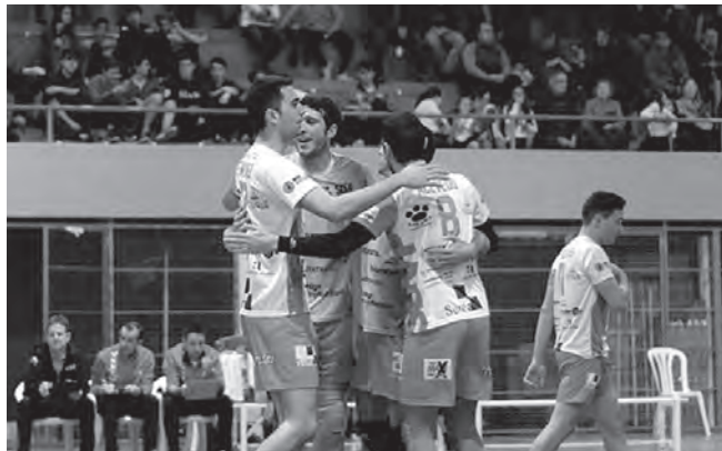
SDVP celebrando un punto

Sant Pere i Sant Pau demostró en Petrer por qué comanda la clasificación del grupo al vencer por 0-3 en unos parciales apretadísimos. El choque comenzó muy bien para el equipo local que logró colocarse con 15-7 a favor. Pero Sant Pere fue recortando diferencias poco a poco hasta igualar el set en los momentos finales donde su mejor gestión del ataque otorgó el 27-29. Lejos de venir-