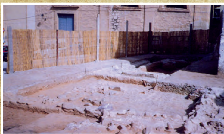
Any 1989. Excavacions arqueològiques enfront de la porta lateral de l'Església de Sant Bartomeu.