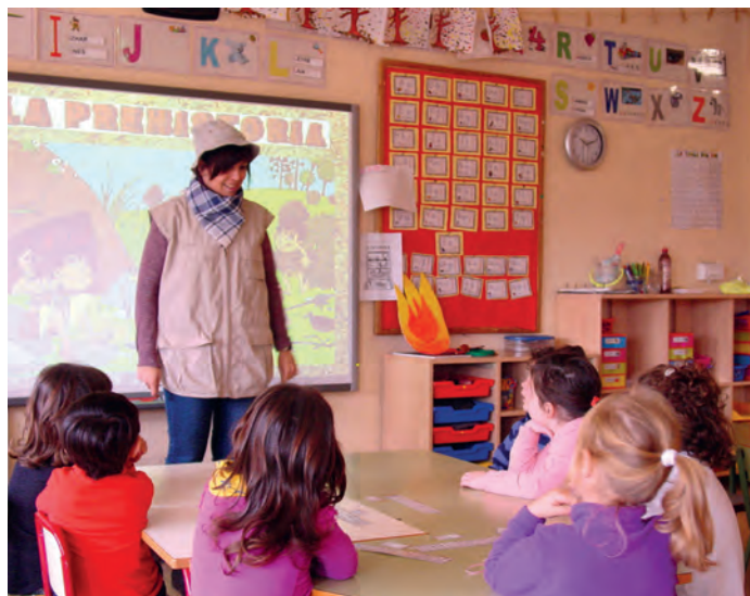
Explicación del powerpoint de la prehistoria en el colegio La Foia (2016)

E l Museo Dámaso Navarro nos informa, en esta ocasión, de la difusión museística que se lleva a cabo entre los escolares.