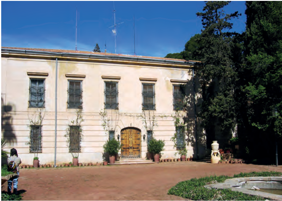
Fachada principal de la finca de El Poblet.

La Consellería de Cultura modifica la Ley de Patrimonio y la de Justicia trabaja en un anteproyecto de la Ley de Memoria Democrática que abren otras vías de actuación para conseguir la conservación del Poblet