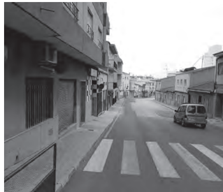
calle San Francisco de Asís

Un decreto de alcaldía en 1964, paralizó la obra y hubo que derribar lo que se llevaba construido. El comportamiento del Ayuntamiento fue excelente, indemnizando a la com-