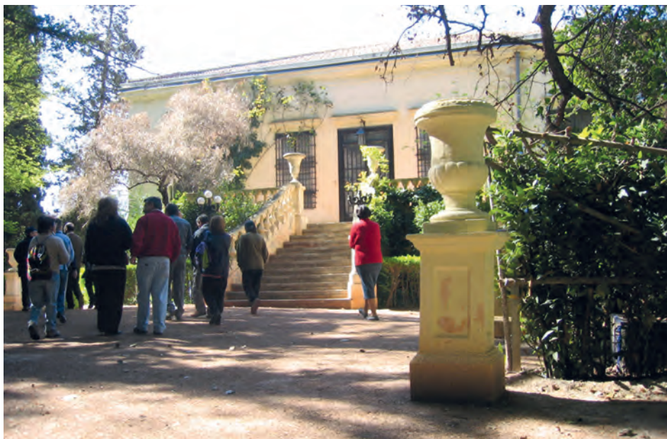
Grupo de personas en los jardines de El Poblet.

al interior del inmueble por la constante negativa del dueño de la finca. La poca predisposición del propietario, de 93 años de edad, ha sido una constante desde que comenzara la reivindicación para obtener una figura de protección y conservación con recursos públicos.