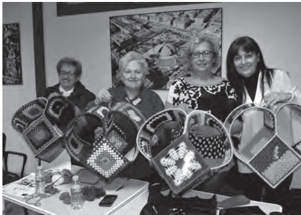
Integrantes del taller presentando los corazones de ganchillo