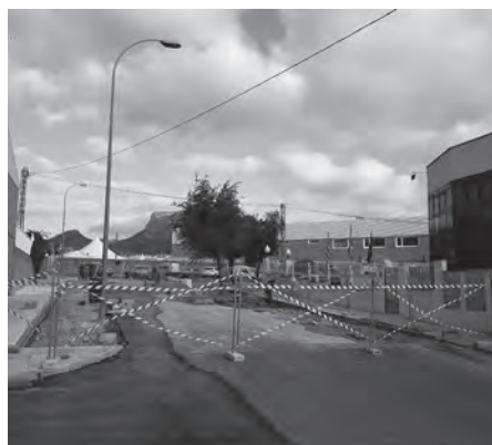
Imagen reciente de las obras