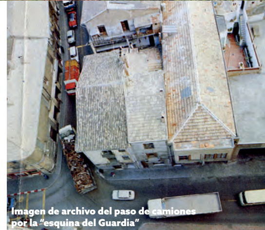
Imagen de archivo del paso de camiones por la "esquina del Guardia"