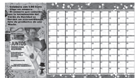
Cartel de la campaña

E l denominado "Equipo Infinito Elda-Petrer y Comarca" pone en marcha una campaña solidaria para ayudar a un niño con esclerosis tuberosa