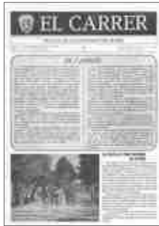
Número 0 • febrero 1980