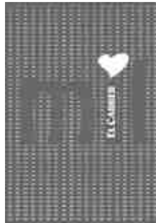
Número 1000 • 26 de diciembre 2013