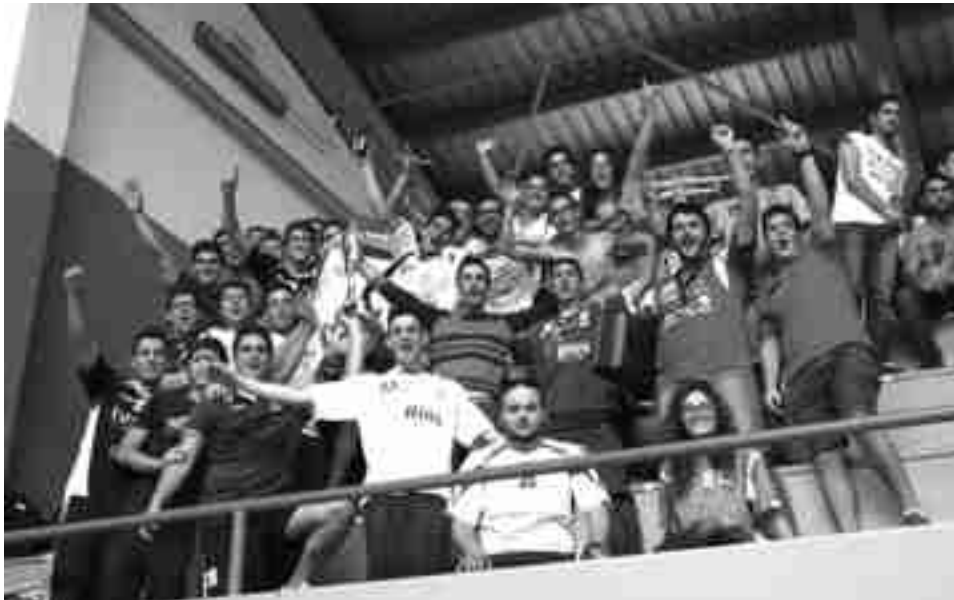
Incondicionales del Hispanitas Petrer

Hispanitas Petrer no pudo sacar provecho de su visita a Torre vieja. La salinera es una cancha difícil y aun-