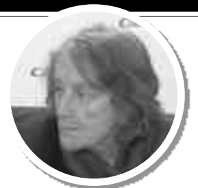
ROSA REGÁS Escritora

“ Hay un fenómeno machista entre las adolescentes que achaco a una falta de lucidez y para evitarlo, lo que hace falta son muchas mujeres que sigan luchando por meter en el ánimo y el corazón la suficiente lucidez para no caer en el machismo ”