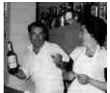
Eva con su hija en la cocina y la pareja en sus inicios