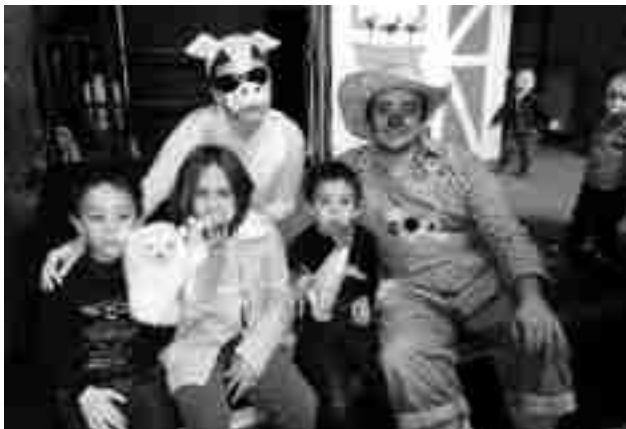
Imagen de archivo. "Marionetari 2012"

"Marinetari 2013" se clausurará con "La Finestreta" y