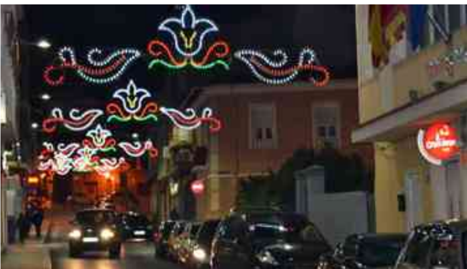
Desde el pasado viernes está encendido el Alumbrado Extraordinario de Navidad

Y será el sábado 28 de diciembre cuando de nuevo el Paje Real visite Petrer para recoger en nombre de Melchor, Gaspar y Baltasar las cartas que no sólo los más pequeños sino también los mayores hayan es-