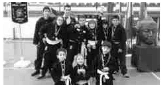
Equipo alevín que quedó subcampeón

La formación alevín consiguió el segundo puesto en el VI Trofeo de Navidad