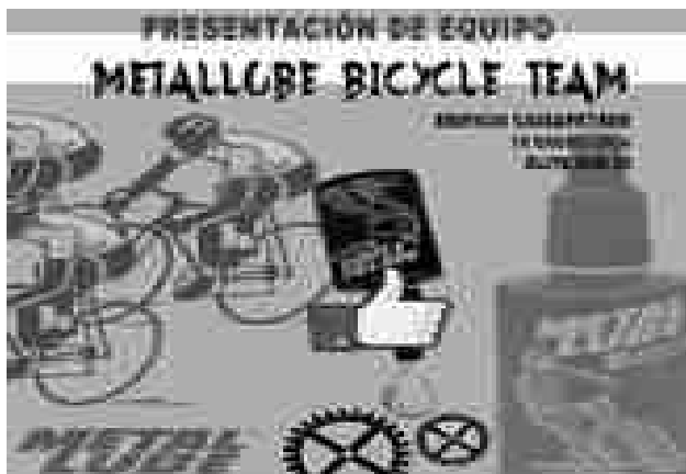
Cartel de la presentación