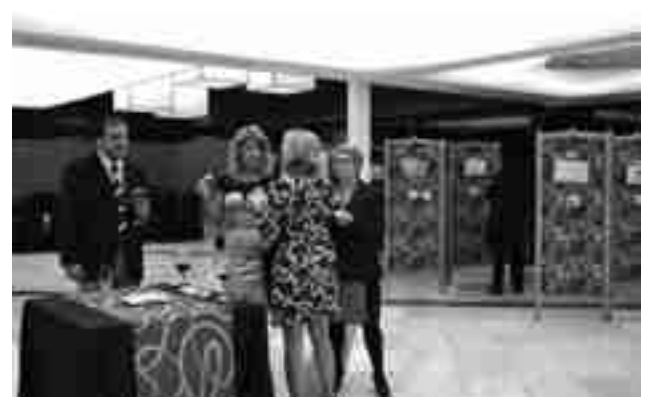
Gala de los "I Model Solidarios", durante el cóctel