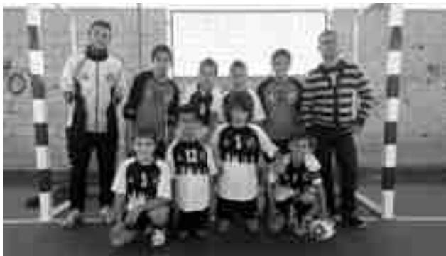
FS Petrer alevín

El FS Petrer cadete logró una cómoda victoria por 6-0 frente al Sporting Desamparados. El equipo estuvo muy bien en defensa dejando la portería a cero. Este domingo, a las 12:30h,