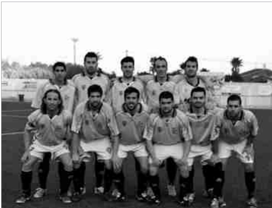
Formación de la U.D. Petrelense en Cox

Rayo Ibense-U.D. Petrelense Jueves, 19 diciembre, 21h Campo (Francisco Vilaplana)