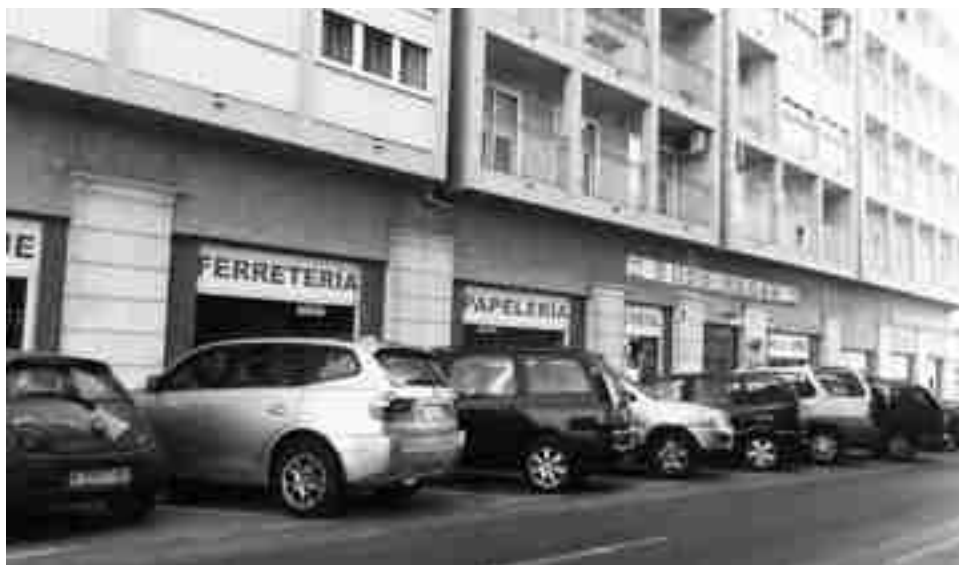
El segundo establecimiento atracado fue el estanco de la calle Joaquín Poveda

El presunto autor de los hechos consiguió sustraer dinero en metálico atracando dos comercios y una cafetería