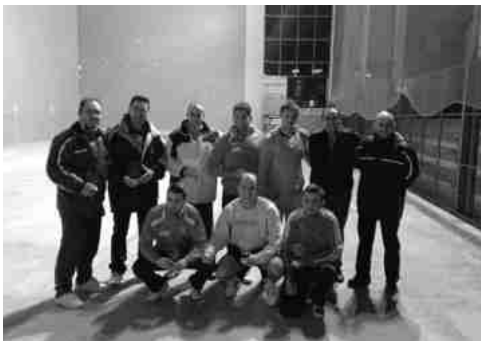
Finalistas del Campeonato de Otoño