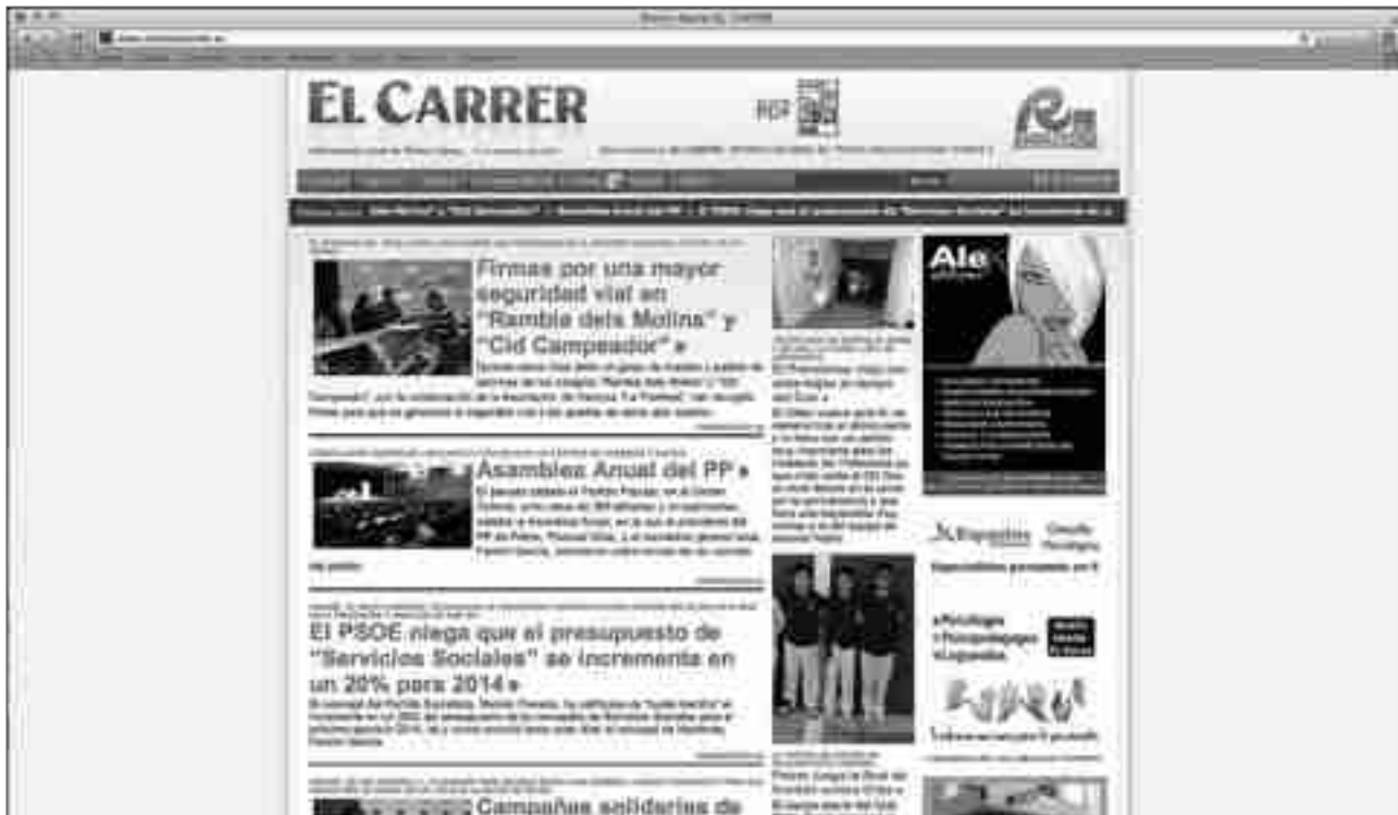
Portal de diarioelcarrer.es

El número total de visitas realizadas durante este año ha alcanzado las 138.000 a falta de cerrar el año