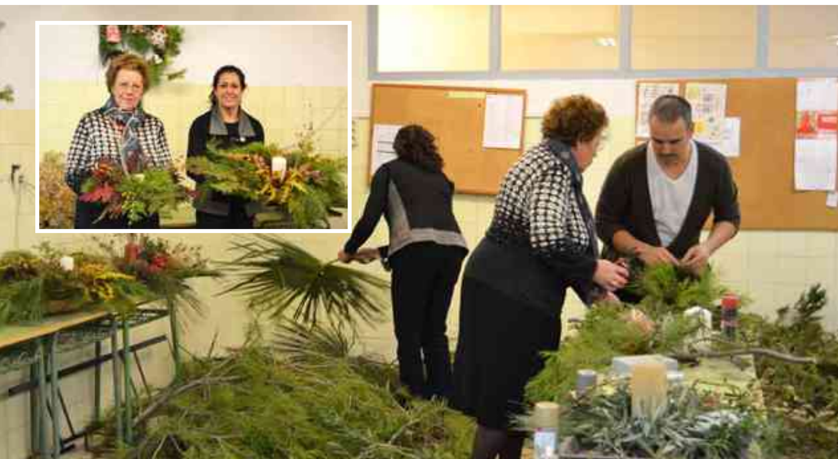
Durante tres días se ha llevado a cabo un Taller de Adornos Navideños, en las dependencias de la antigua EPA. Han sido muchos los petrerins y petrerinas que han participado creando su propio centro navideño