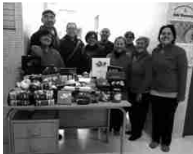
Participantes en el acto

Todos los alimentos que se recogieron fueron entregados a Cáritas