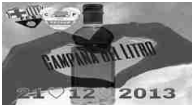
Logotipo promocional de la campaña

Estarán el sábado en la Plaza Pablo Iglesias recogiendo litros de aceite que donarán a Cáritas