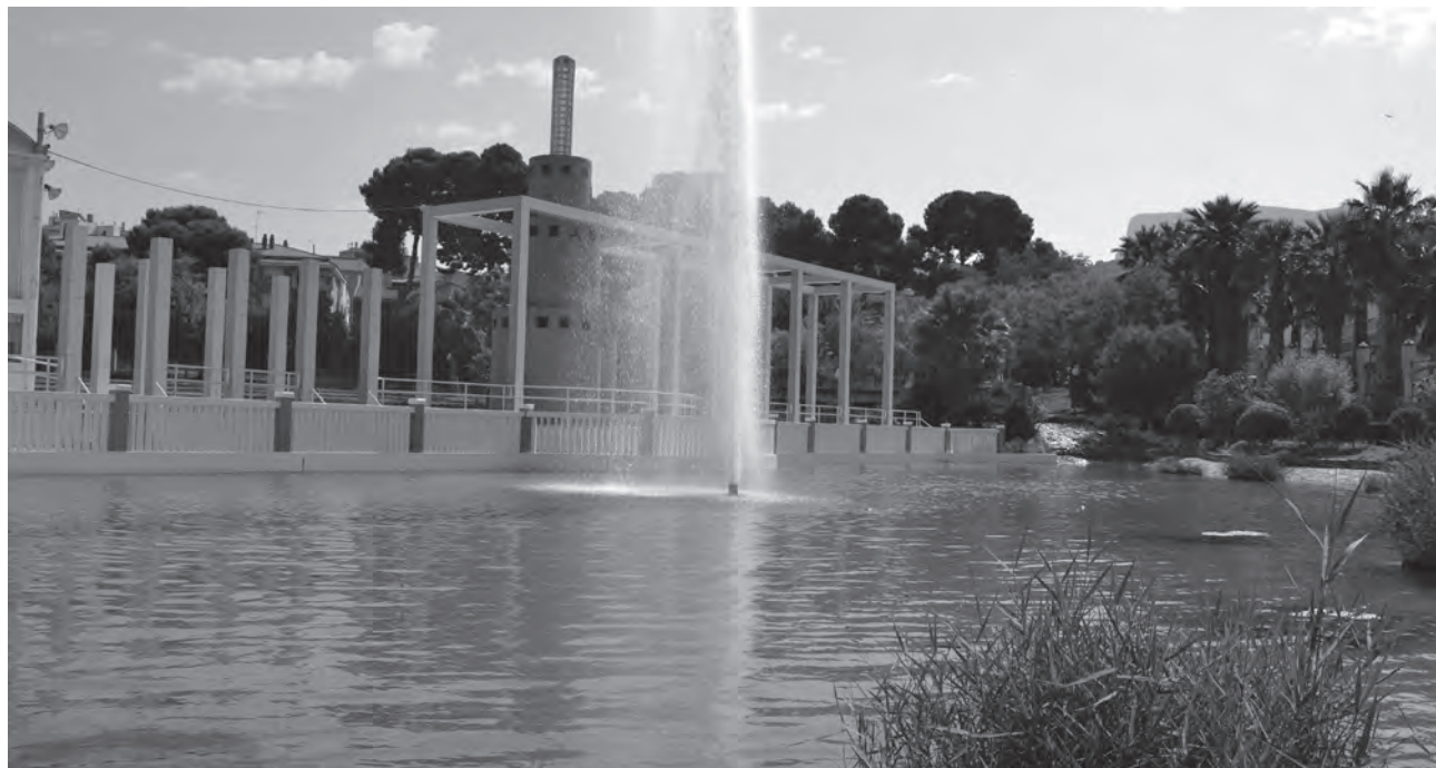
Estado actual del lago