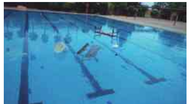
Instantánea de varios objetos arrojados a las piscinas

Fruto de un operativo policial preparado al efecto y tras numerosas denuncias recibidas por parte del vecindario sobre casos de jóvenes que aprovechando la nocturnidad saltan la valla del polideportivo municipal para bañarse en las piscinas municipales de verano así como para realizar diversos actos vandálicos, a principios de esta semana una unidad policial pillaba in fraganti a dos jóvenes de 18 y 16 años introduciéndose en el recinto con el fin de bañarse en las referidas piscinas.