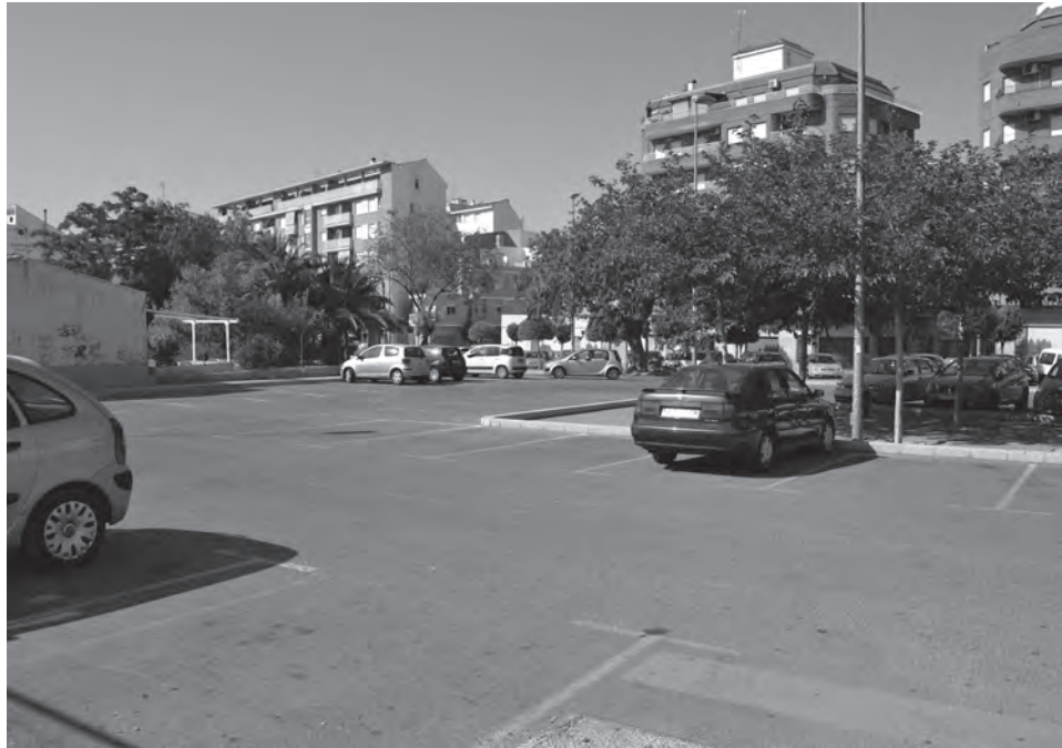
Actual zona de estacionamiento donde se van a instalar las aulas prefabricadas

En estos momentos, la adjudicación de esta actuación está en fase de alegaciones