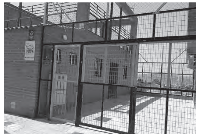
Puerta de entrada al Centro de Día