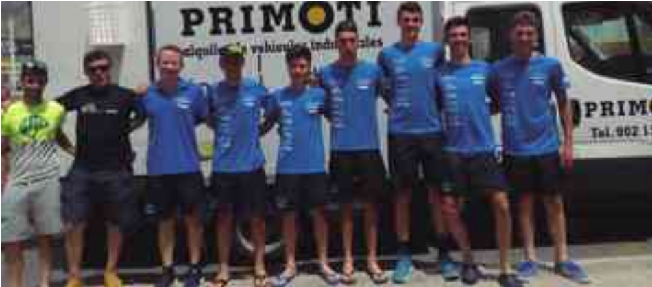
Wolfbike Metal Lube Petrer

El equipo petrerense estuvo metido en carrera hasta la etapa reina donde los líderes no pudieron aguantar el ritmo de los favoritos