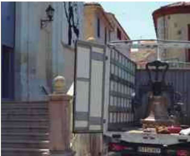
Imagen de la nueva campana momentos antes de ser izada al campanario. A la derecha, primer plano de la campana

El coste total de la intervención se acerca a los 5.800 euros