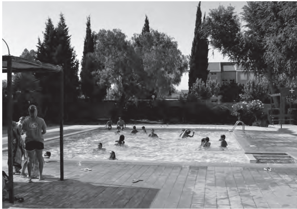
Imagen de usuarios de la piscina

rada, es decir del 19 de julio al 19 de julio, se ha incrementado en cerca de 10.000 euros respecto a ese mismo periodo del pasado año. En concreto, en el primer mes de funcionamiento de estas instalaciones deportivas en 2014 se ingresó 8.239 euros que se traducen en 7.340 ba-