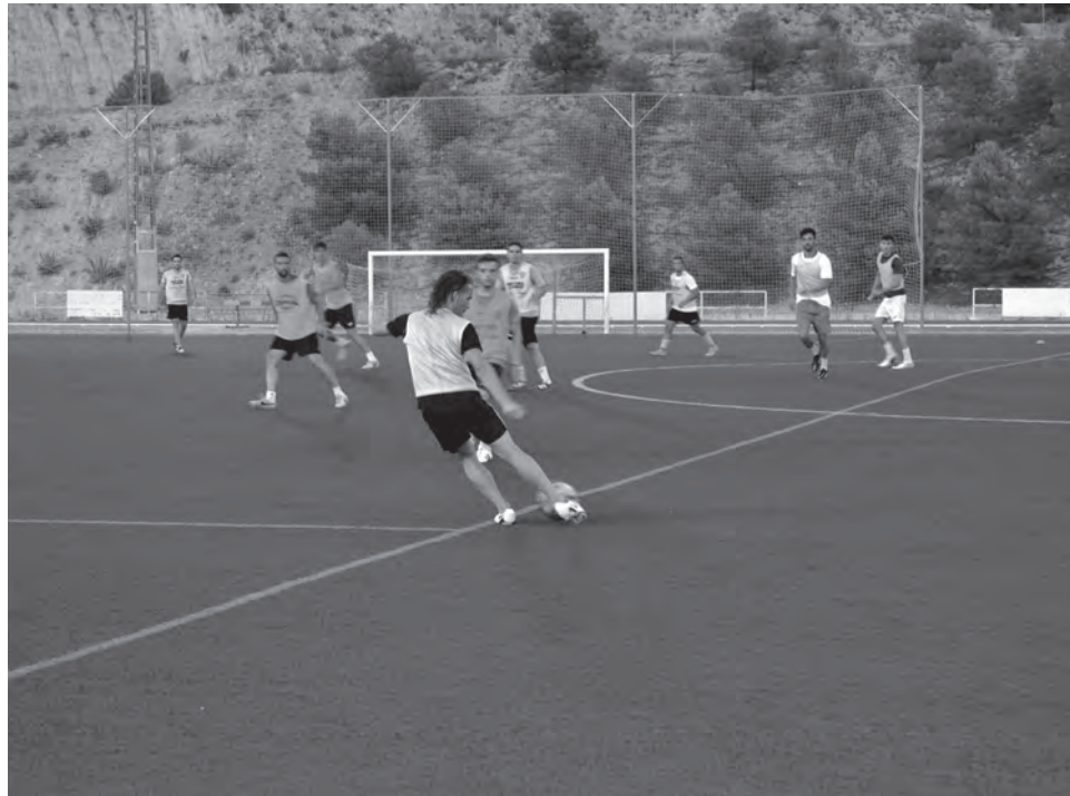
Primer entrenamiento de la pretemporada de la UD Petrelense

En el capítulo de amistosos, al margen de los dos partidos ya conocidos y confirmados a disputar en El Barxell contra el Novelda el 5 de agosto, a las 20:30h, y frente