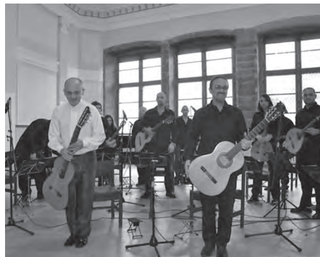
Este fin de semana actúa "Iberian Folk Ensemble". Imagen de archivo