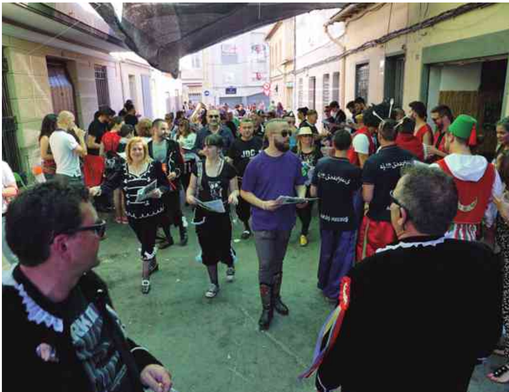
Ambiente a las puertas de uno de los muchos cuartelillos que se abren en nuestra localidad

podrán disponer de música también hasta las tres y media de la noche. Mientras que el resto del año, los cuartelillos podrán poner música hasta las doce de la noche los fines de semana. También el concejal de Urbanismo ha apuntado que otras alegaciones hacen referencia a la interpretación del redactado y otras sobre cuestiones meramente técnicas. No obstante, ha puntualizado que “eso no significa que tengan o no razón ya que cualquier