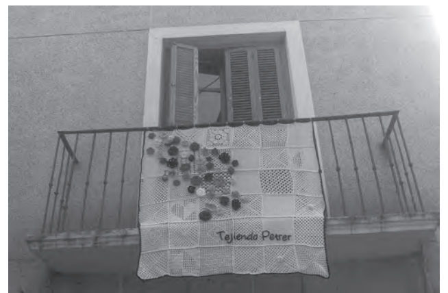
Tapiz alusivo a "Tejiendo Petrer" en un balcón de la calle Cura Bartolomé Muñoz

silueta del castillo y las ermitas con la luna de fondo. Mientras que el segundo tapiz con flores, también de ganchillo, es un homenaje a "Tejiendo Petrer". Además, ha adelantado que este sábado, 1 de agosto, coincidiendo con la luna llena, se van a colgar dos nuevos tapices, en este caso en la calle Mayor, relacionados con la Ruta del Vino de Alicante, a la que pertenece Petrer, y el Horno Romano. También, ha comentado que esta iniciativa está teniendo muy buena aceptación entre los vecinos del casco antiguo que no sólo disfrutan de un