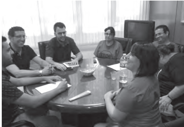
Imagen de la reunión

tell, manifiesta que los bancos han cambiado su voluntad de negociación en este apartado haciendo más difícil la búsqueda de soluciones a los problemas de las personas para hacer frente a sus hipotecas. Tras dar a conocer algunas de las prácticas que vienen sufriendo los afectados en sus relaciones con las entidades bancarias tales como la dificultad de acceso a la información, el acoso telefónico por parte de las entidades de gestión de cobro o la negativa a acceder a las demandas planteadas por las personas afectadas por las hipotecas, Pilar Deltell ha querido ver en ello un cambio de criterio de los bancos basado en el ampa-