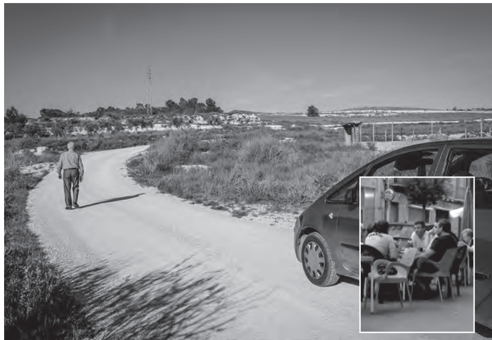
Camino de La Zapatera que quedó inacabado. En detalle: imagen de whatsapp de dos de los detenidos en una terraza de Sax supuestamente tomada el pasado viernes por la tarde

En lo que respecta a la detención del responsable de una mercantil de Petrer, cabe señalar que, según ha trascendido en varios medios de comunicación, recibió el encargo del, por entonces concejal de Obras, Pedro Nieto, para que se encargara de la realización de diferentes obras de arreglo de los viales rurales de Peña Rubia y La Zapatera siendo denunciado por dueños de varias casas de campo de la zona en marzo del 2015 ante la Unidad de Delincuencia Económica por diferentes irregularidades en el acondicionamiento de estos caminos rurales.