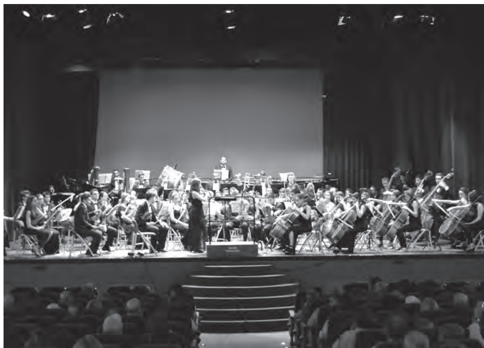
Momento de la actuación de la "Jove Orquestra de la Generalitat Valenciana" durante el concierto de clausura