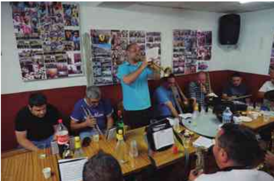
Ambiente en un cuartelillo durante la visita de una banda

DURANTE EL PERIODO DE EXPOSICIÓN PÚBLICA DE ESTA ORDENANZA MUNICIPAL, TRAS SER APROBADA EN SESIÓN PLENARIA, SE PRESENTARON 130 ALEGACIONES